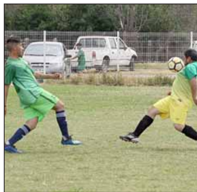
El domingo se dará el vamos a las revanchas en los torneos de verano en el valle de Aconcagua.

Grupo H: Enrique Meigs – Torino; Arturo Prat – Colunquén