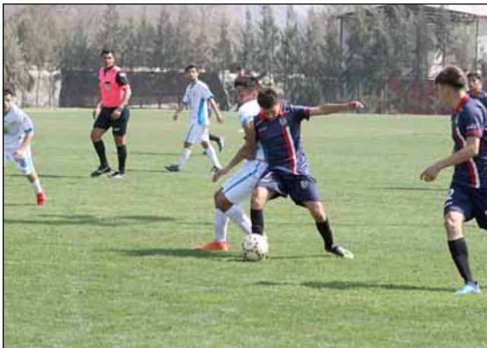
En marzo harán su estreno las cuatro series cadetes del Uní Uní en el torneo de Fútbol Joven 2019.

nes, se definirán de la siguiente manera: subirá a la Primera A del Fútbol Joven los que sumen la mayor cantidad de puntos en la Tabla Acumulada (cuatro series) de cada zona (Norte, Centro y Sur); mientras que los monarcas de cada categoría serán los equipos que terminen en el primer lugar en sus respectivas competencias.