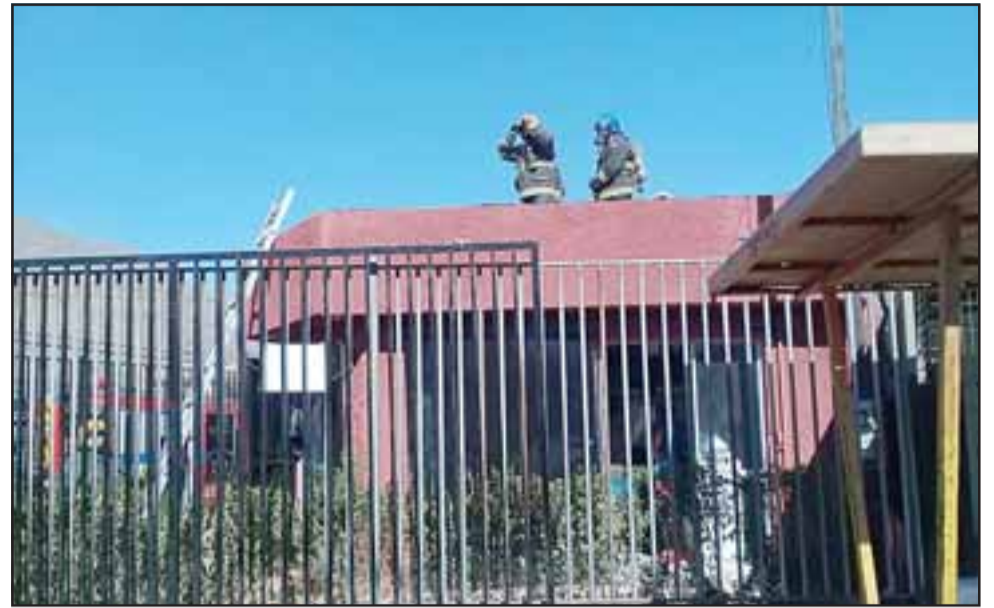
El fuego afectó a un local recién inaugurado en la esquina de calles Benigno Caldera con Diego de Almagro en la población San Felipe. (Fotos: @Preludioradio).

Sin embargo una presunta mala instalación del conducto de ventilación con brasas calientes habría generado el fuego en el entretecho, causando finalmente un incendio estructural, dejando pérdidas de consideración para el locatario.