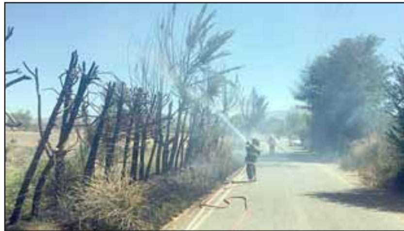
Bomberos de Santa María combatiendo las llamas a un costado de la ruta en el sector de la medialuna de esa localidad.

Arancibia destacó el oportuno llamado de automovilistas que circulaban por el lugar, quienes dieron cuenta de la emergencia a Bomberos, lo que evitó que el fuego siguiera avanzado. Pablo Salinas Saldías