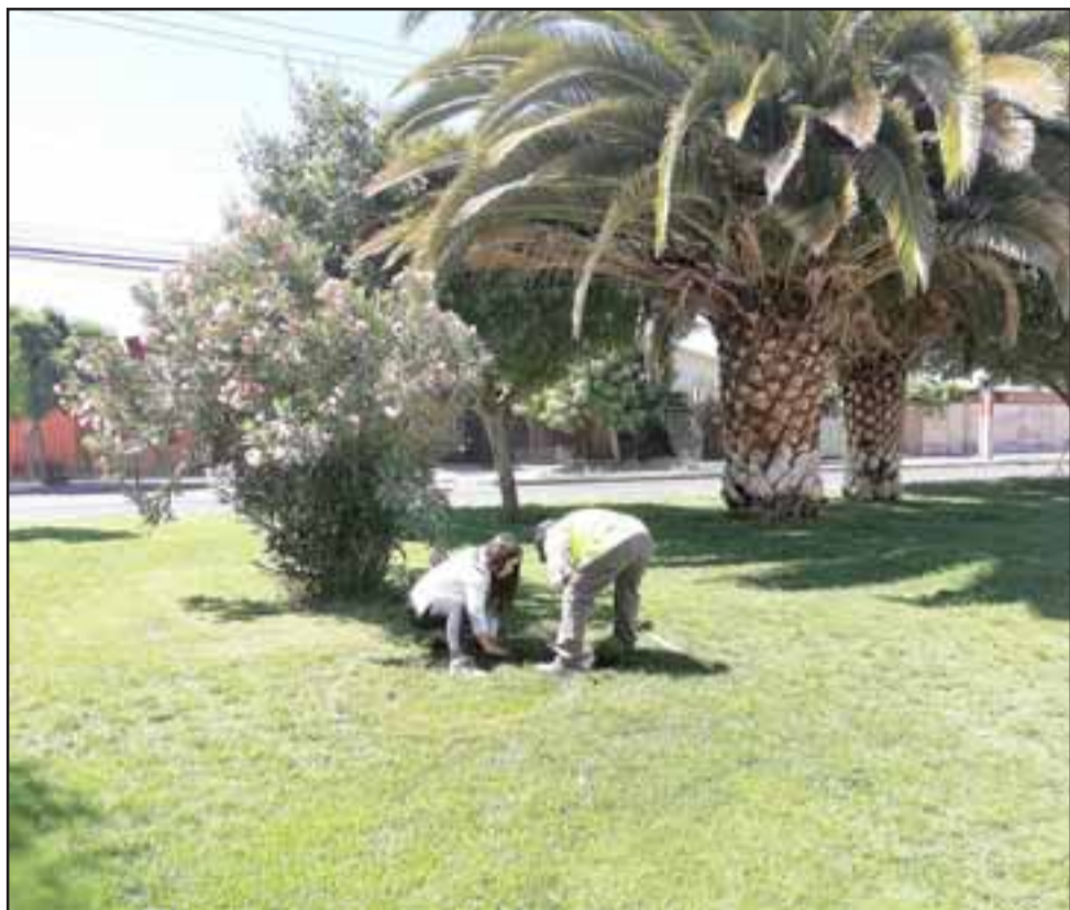
Pese a los problemas suscitados a inicio de año, las plazas y plazoletas comienzan a lucir totalmente recuperadas.

«Las plazas son un punto de encuentro de la comunidad, lo bueno que tenemos contacto con la empresa y vamos informando sobre lo que falta o se requiere mejorar», comentó.