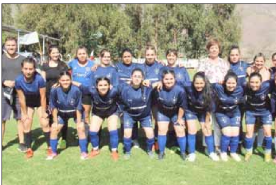
Equipo femenino del club Deportivo y Social Putaendo.