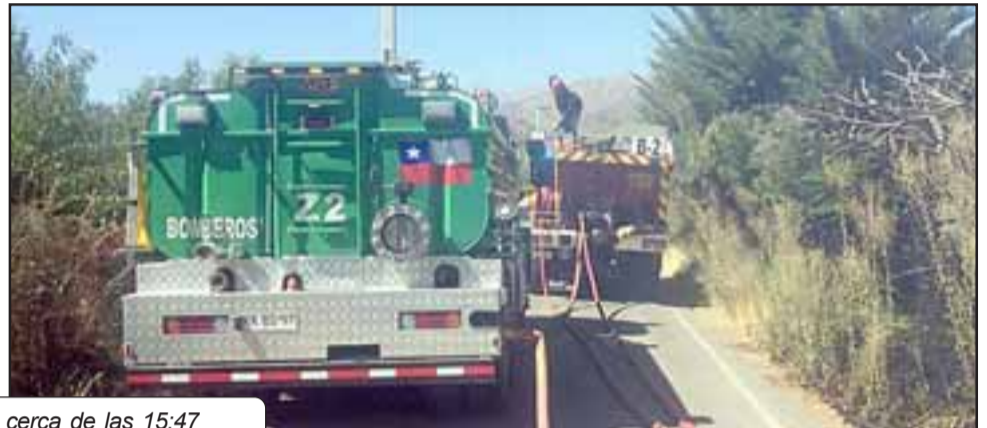
La emergencia ocurrió cerca de las 15:47 horas de ayer jueves.