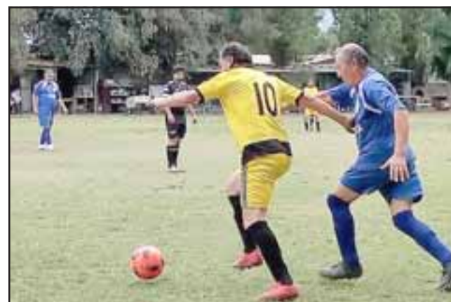
Después de un tiempo muy prolongado regresa la acción dominical en la cancha Parrasía.