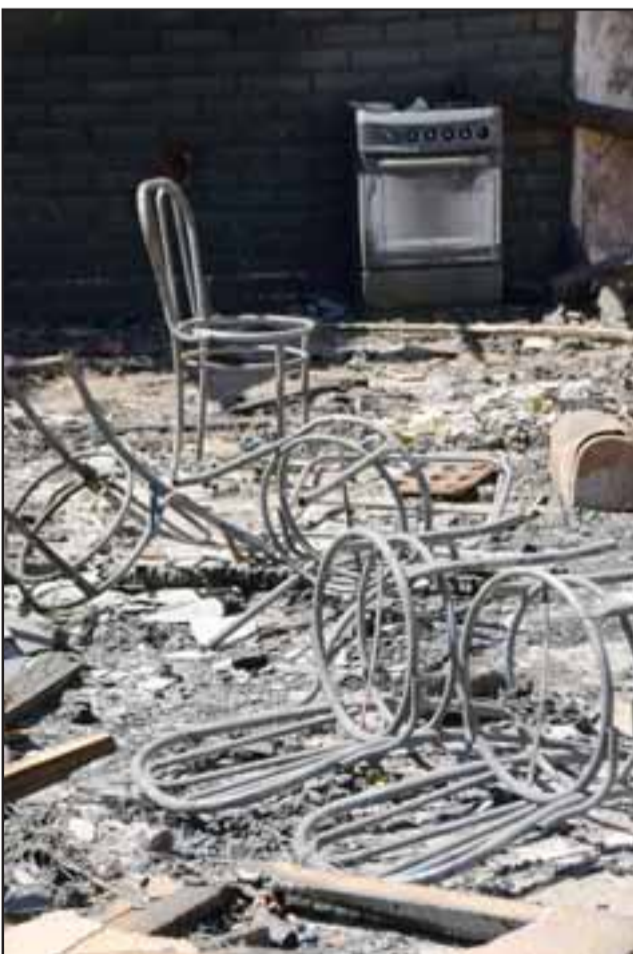
PÉRDIDAS TOTALES.- Así quedaron las sillas de comedor en estas casas destruidas por el fuego.