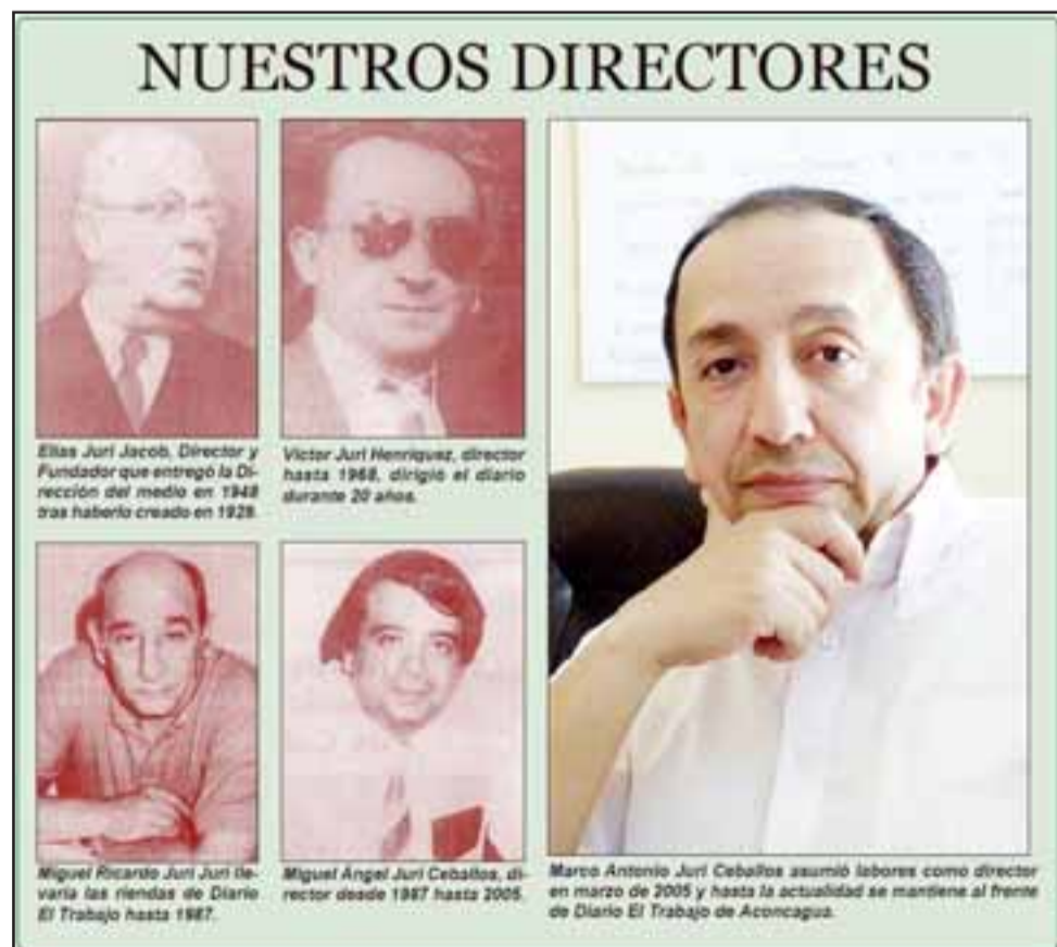
A TODOS GRACIAS. - En este recuerdo vemos a nuestros directores, algunos de ellos ya no nos acompañan.