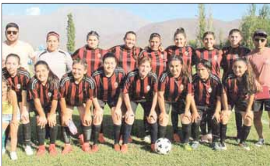
Conjunto de mujeres del club El Asiento.