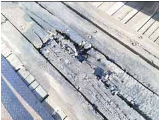
Así quedaron los durmientes del puente, reducidos a cenizas por la acción del fuego.