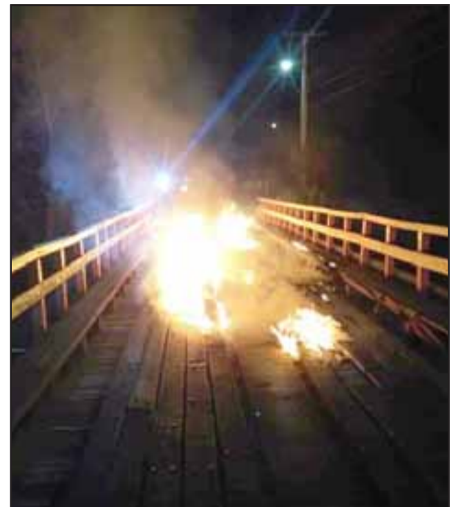
Momento exacto cuando el fuego consumía gran parte del «puente de los clavos de oro».