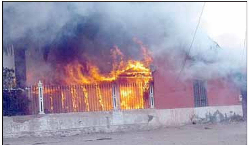
AL ROJO VIVO.- Así de impactante fueron las escenas que debieron controlar los bomberos durante muchas horas de trabajo.