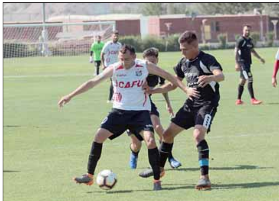
Esta tarde ante Barnechea el Uní Uní jugará su primer partido oficial de este año.

En esta oportunidad las elegidas fueron los elencos femeninos de los clubes El Asiento y el Deportivo Social de Putaendo.