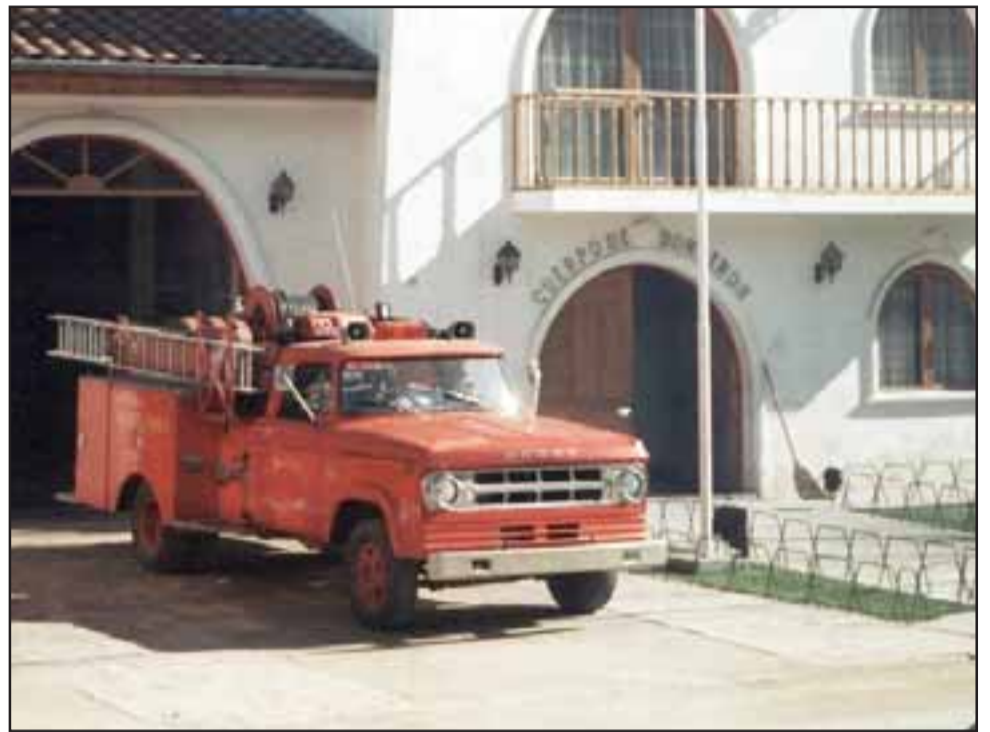
Esta vieja bomba nos recuerda los años de servicio de esta ejemplar familia bomberil de San Esteban.

Durante febrero se han estado efectuando otras ac-