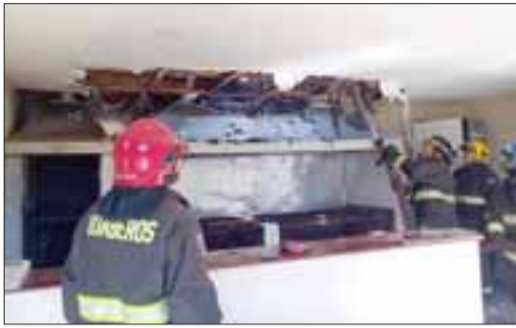
Las pérdidas al local fueron millonarias

En plena marcha blanca se desató la tragedia