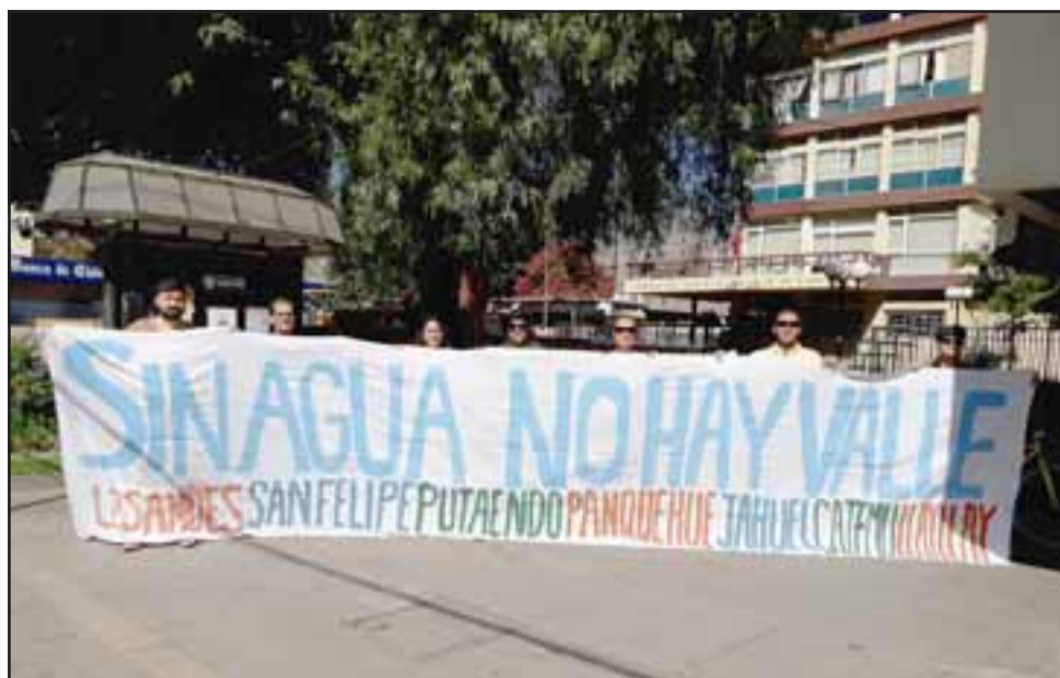
Representantes de los agrupaciones ambientalistas de Aconcagua en convocatoria a marchar por la defensa del agua este día sábado.

nocidos como el derrame de relave minero al cauce del río Blanco o la instalación de empresas mineras en la cordillera de Putaendo, es que « estamos muy descontentos e intranquilos con las autoridades, con las amenazas tan violentas de parte de las empresas, de cómo nos coartan el libre acceso