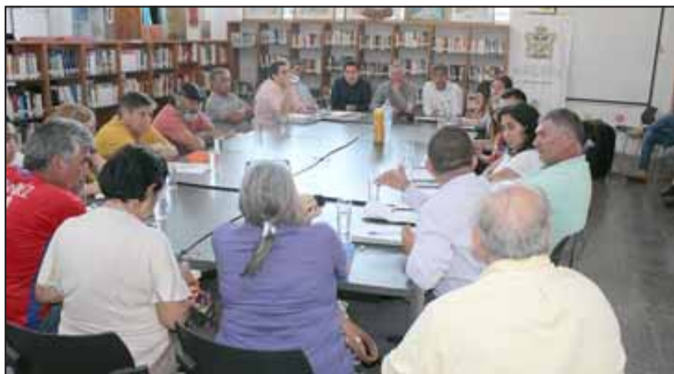
Participaron de esta reunión las directivas de las cooperativas y comités de agua potable de Escorial, Panquehue Centro, San Roque, Palomar Interior, Héroes de la Concepción, Arturo Prat, Bulnes, Los Libertadores, el Progreso de La Pirca y Llaiquen.

«Lo que las comunidades deben tener en claro, que hay mucha disposición de la DOH por solucionar cada uno de los problemas, pero para ello se requiere de plazos».