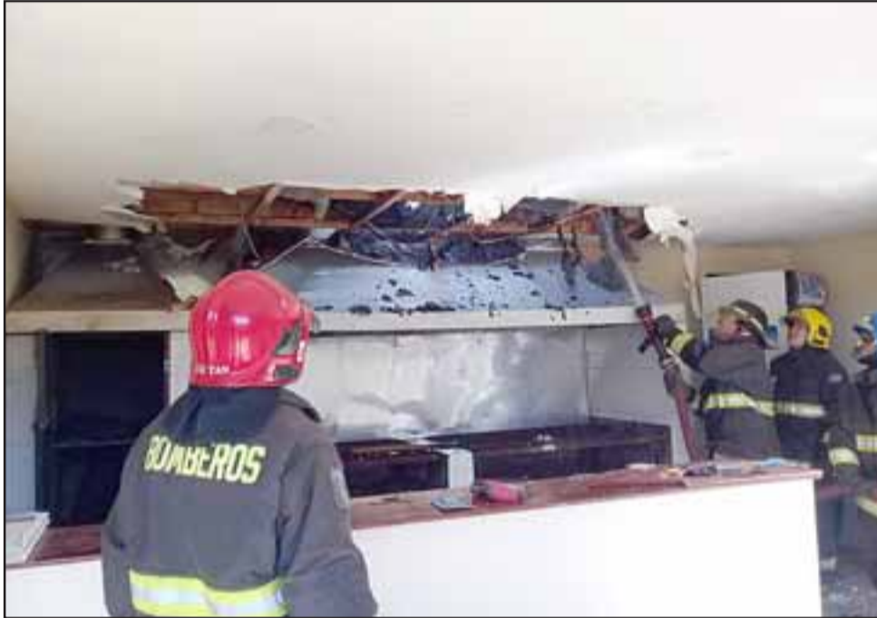
Personal de Bomberos logró reducir las llamas durante la mañana de ayer jueves.

ceso de marcha blanca con su negocio, poniendo a prueba las instalaciones de hornillas para la preparación de alimentos que serían comercializados para los clientes.