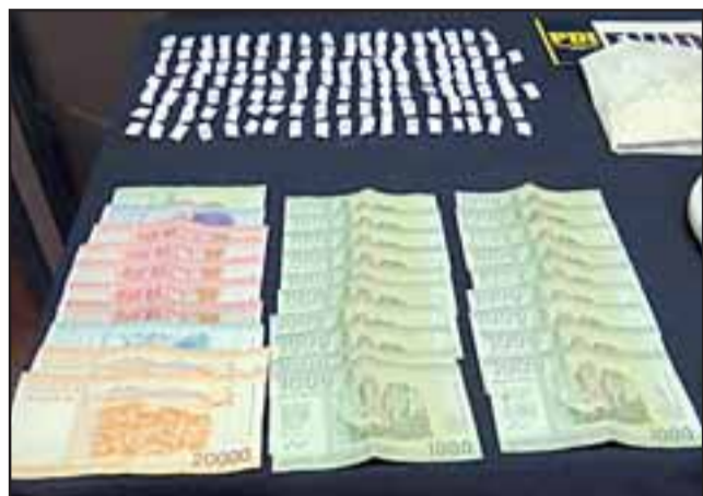
Dinero sucio que sólo a prisión les llevó, es el que las autoridades decomisó a esta pareja.

Como ambos mantienen antecedentes por el mismo delito, las diligencias se centraron en reunir los medios de prueba que permitieran su detención. De esta forma la tarde del jueves se logró interceptar el radiotaxi en que se desplazaban, para luego concretar la orden de entrada y registro de la propiedad que habitan en Villa Lomas de Santa Rosa, siendo incautado 158 gramos de pasta base dosificada y a