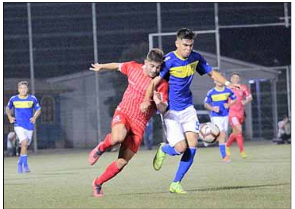
En el partido debut por el torneo de la B, Unión San Felipe cayó claramente ante Barnechea.