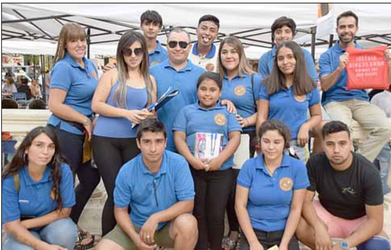
PROFESIONALES VOLUNTARIOS.- Aquí tenemos también a parte del grupo organizador de este gran operativo social.