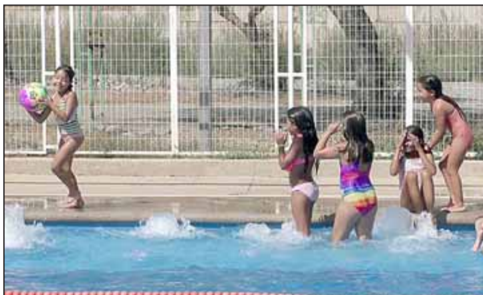
Las niñas también aprovecharon del refrescante verano y ya se preparan para su regreso a clases.