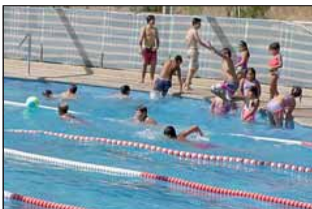
TODO GRATIS.- Importante señalar que estas actividades se desarrollaron de forma totalmente gratuita para quienes participaron.