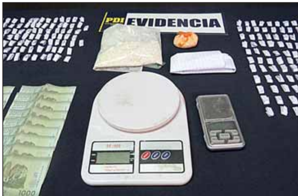
Esta droga incautó la Policía en Villa Lomas de Santa Rosa, 158 gramos de pasta base dosificada y a granel, una pesa digital y 98.000 pesos producto de la venta de droga.

granel, una pesa digital y 98.000 pesos producto de la venta de droga.