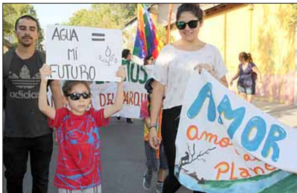
ES SU FUTURO.- Este pequeñito también expresó su preocupación frente a un futuro incierto, si no hay justicia social a la hora de repartir el preciado líquido.