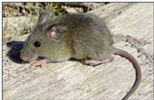
Este es el conocido y temido ratón de cola larga que porta el virus Hanta.

pero fue importado desde el sur, por eso el llamado a extermar las medidas de seguridad para prevención del virus Hanta. Acá específicamente en la zona no hemos detectado casos de contagio de virus Hanta, por eso reiteramos el llamado al cuidado porque además estamos en una zona que es el hábitat natural de este ratón.