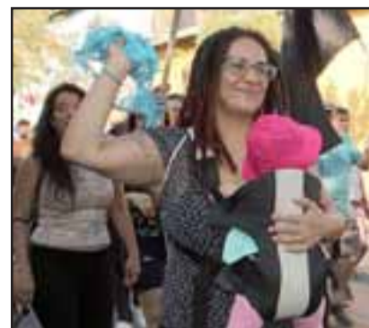
MALESTAR GENERAL.- Madres con sus guaguas y niños de distintas edades salieron de sus casas para reclamar el agua de los aconcagüinos.

Roberto González Short