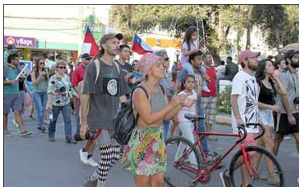
MARCHA EN SAN FELIPE.- Cerca de 600 personas del Valle de Aconcagua marcharon desde Avenida Chacabuco hasta la Plaza de Armas de San Felipe, en total la jornada casi fue de cuatro horas.