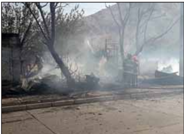
Según testigos el fuego habría sido intencional afectando parte de las dependencias del Estadio Fiscal de San Felipe.