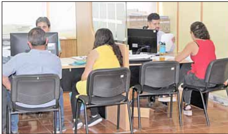
El municipio espera renovar más de 14.000 permisos durante este período, el que se extiende hasta el 31 de marzo.