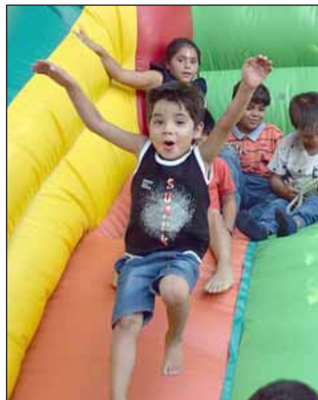
IMPARABLE CHIQUITÍN.- Los más pequeñitos no perdieron el tiempo en cosas de adultos, ellos sólo llegaron a jugar.