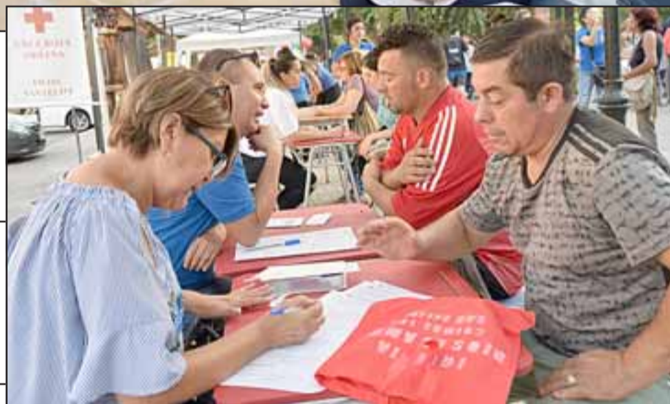
CONSEJERÍA.- Cientos de personas llegaron a los stands instalados en la Plaza de Armas para recibir consejería personal y también financiera.