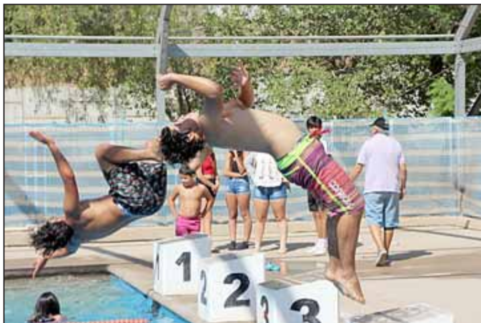
Estos chicos volaron por los aires para ser recibidos por estas refrescantes aguas de las piscinas en el Estadio Fiscal.