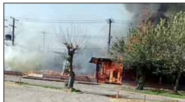
El fuego se desató la tarde de este viernes en el Estadio Fiscal de San Felipe.

vo que Carabineros procedió a acoger la denuncia resaltando que tras esta emergencia no se registraron personas ni voluntarios de bomberos lesionados, enfatizando que es materia de investigación en lo refiere al origen del fuego.