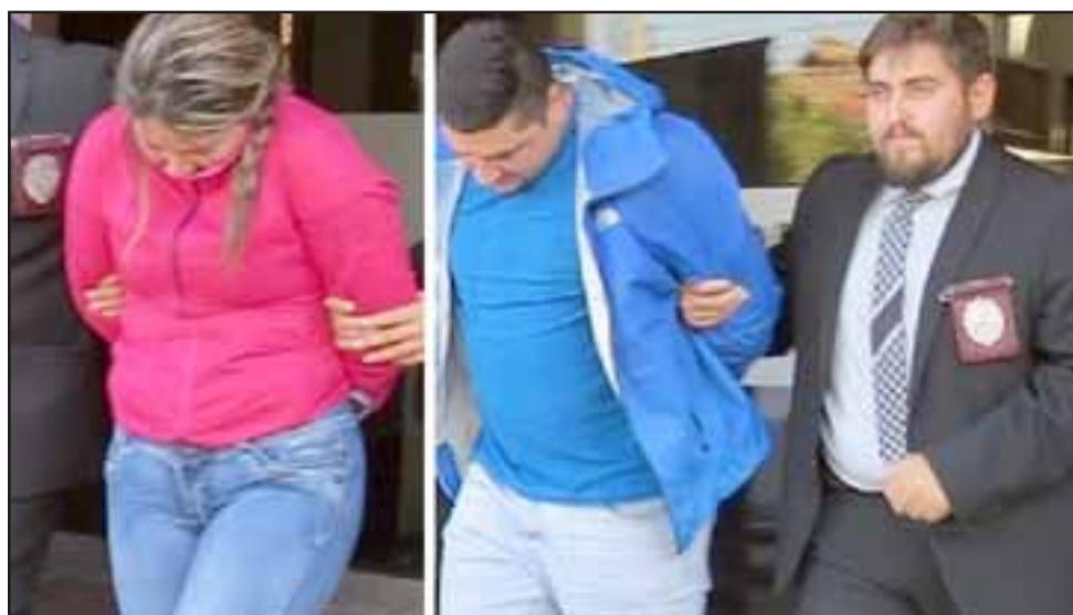
Ambos mantienen condenas por delitos similares y en el allanamiento de la casa donde residen en Villa Lomas de Santa Rosa se incautó droga dosificada y a granel.