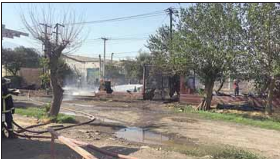
Cuatro compañías de Bomberos trabajaron arduamente para apagar las intensas llamas.