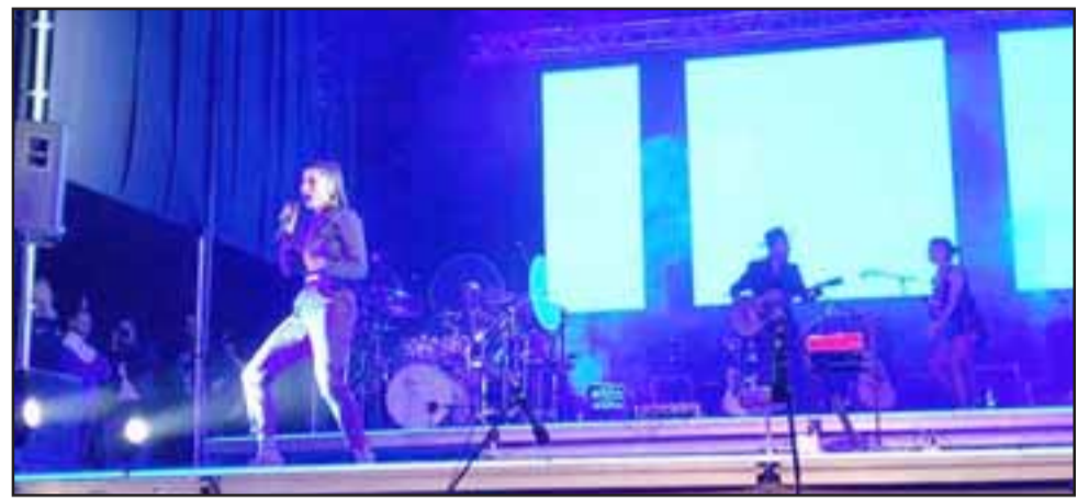
Miles de personas disfrutaron el show en el Estadio Municipal de Llay Llay.