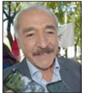
Patricio Freire, alcalde de San Felipe.

con la Seremi de Medioambiente, con la Dirección General de Aguas, con la Dirección Obras Hidráulicas (...) Nos preocupa mucho más sobretodo cuando estamos con el tema del agua, no podemos seguir sólo como municipalidad, tenemos que pedir a las instituciones que se fiscalice de mejor manera, que venga como se vino hace algún tiempo”, finalizó Boffa.