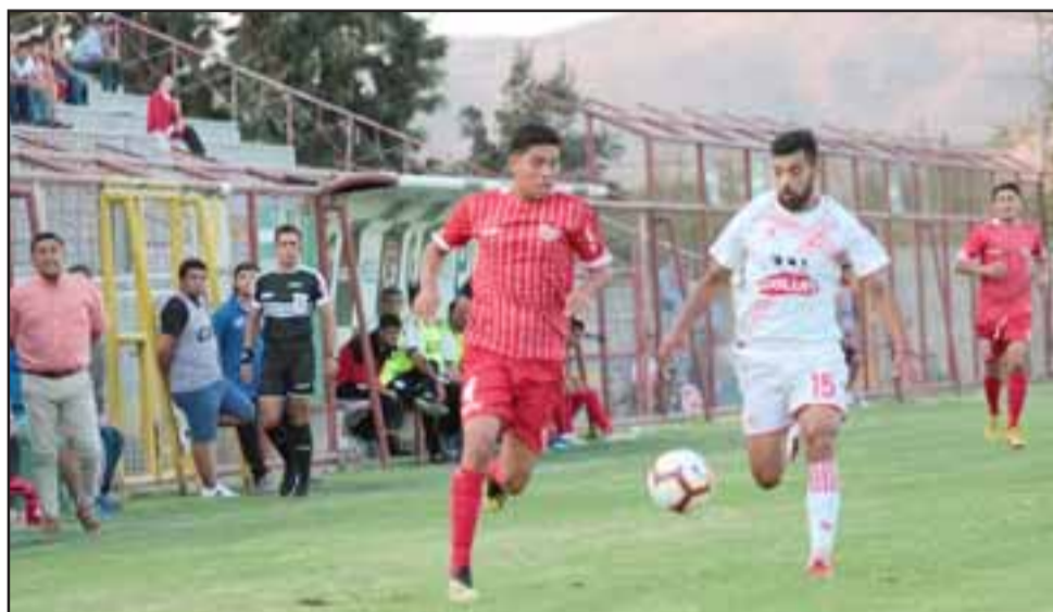
En su estreno en casa Unión San Felipe cayó por la mínima ante Deportes Valdivia.

Con Pio el equipo retomó el control del mediocampo, aunque el ritmo y la precisión ya no eran las mismas porque el trajín pasaba la cuenta a 'La Nona' Muñoz. Promediando el segundo lapso la ilusión de la hinchada se encendió cuando Ángel Vildoza ingresó a la