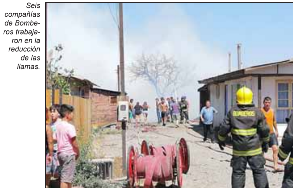
Seis compañías de Bomberos trabajaron en la reducción de las llamas.