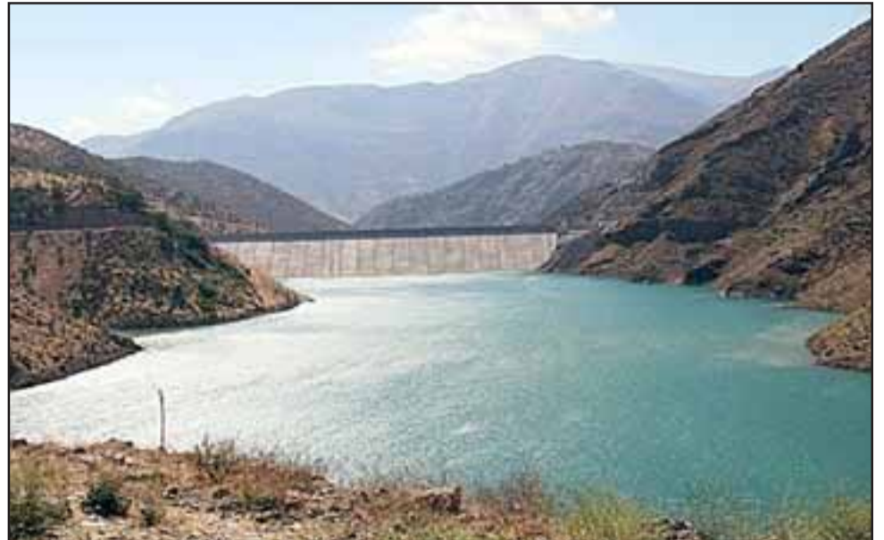
Proyecto busca la construcción de un embalse de cabecera en el sector de Juncal. Foto referencial. (Referencial)

En este sentido Carrasco detalló que « la idea es que exista un embalse de cabecera un par de embalses más en la parte media y baja de la cuenca, el plan