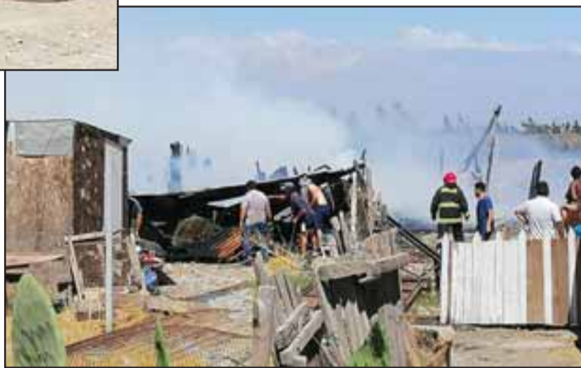
Dos casas, un galpón y un vehículo fueron calcinados por el fuego.