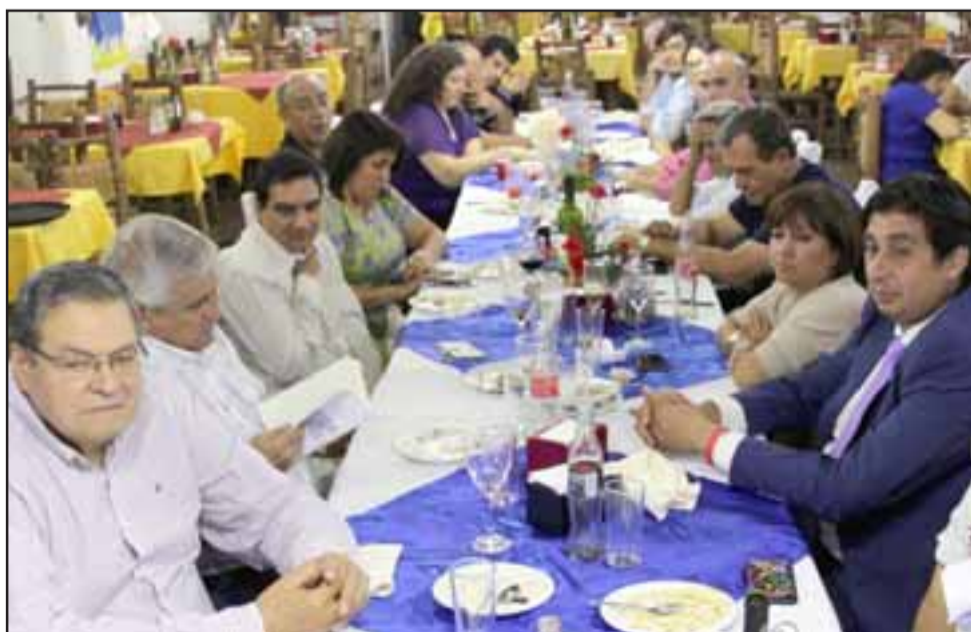
CENA ESPECIAL.- Después del Cambio de Folio llegó la cena, el vino y los manjares tan únicos de Restaurante La Ruca, autoridad y equipo de Diario El Trabajo disfrutaron como amigos del agasajo.