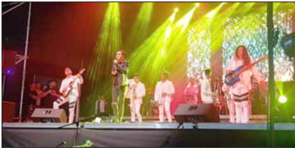
El baile estuvo a cargo de los grupos 'Megapuesta' y 'La Sonora Barón', quienes se encargaron de cerrar las noches del viernes y sábado, respectivamente.

Y es que sin lugar a dudas la intérprete de temas como 'Dulce' o 'Muérdete la lengua' fue una de las más aplaudidas y esperadas por los miles de espectadores. La artista nacional estuvo por más de una hora sobre el escenario y realizó un show 'completo y lleno de éxitos', como comentaron sus seguidores.