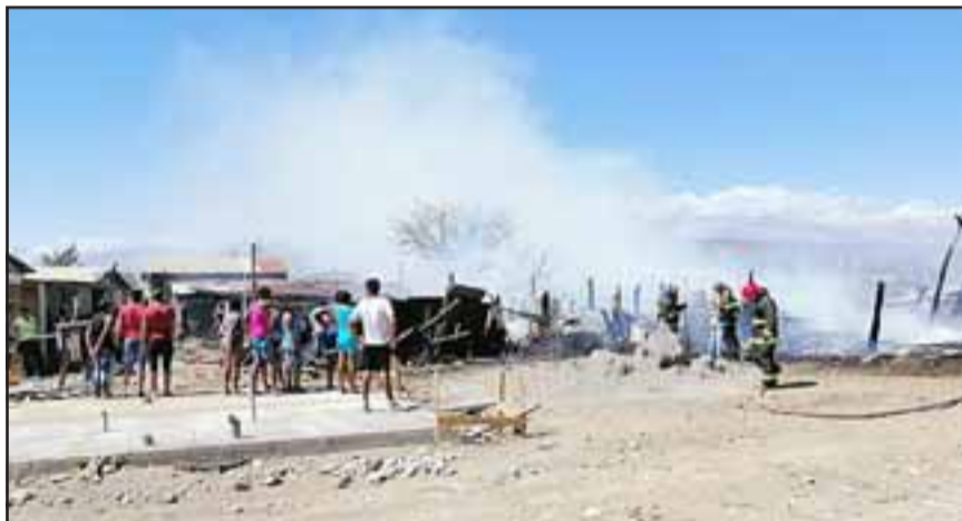
El origen del fuego está siendo investigado por Bomberos.