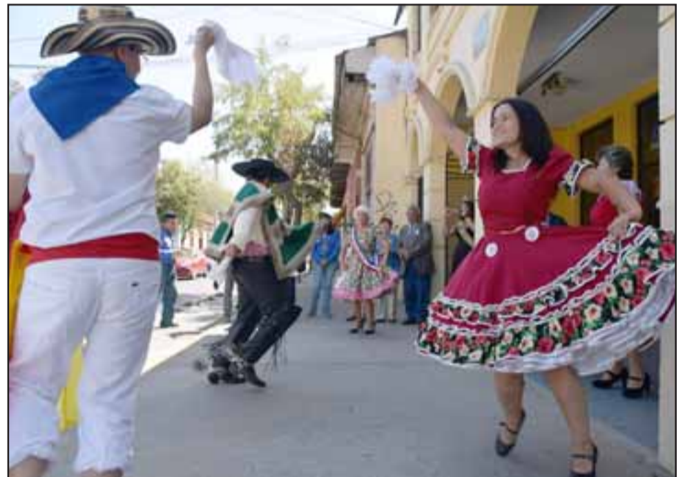
BAILANDO CUECA. - Bellas damitas de nuestra comuna nos honraron este viernes con tan inesperado Esquinazo frente a Diario El Trabajo.