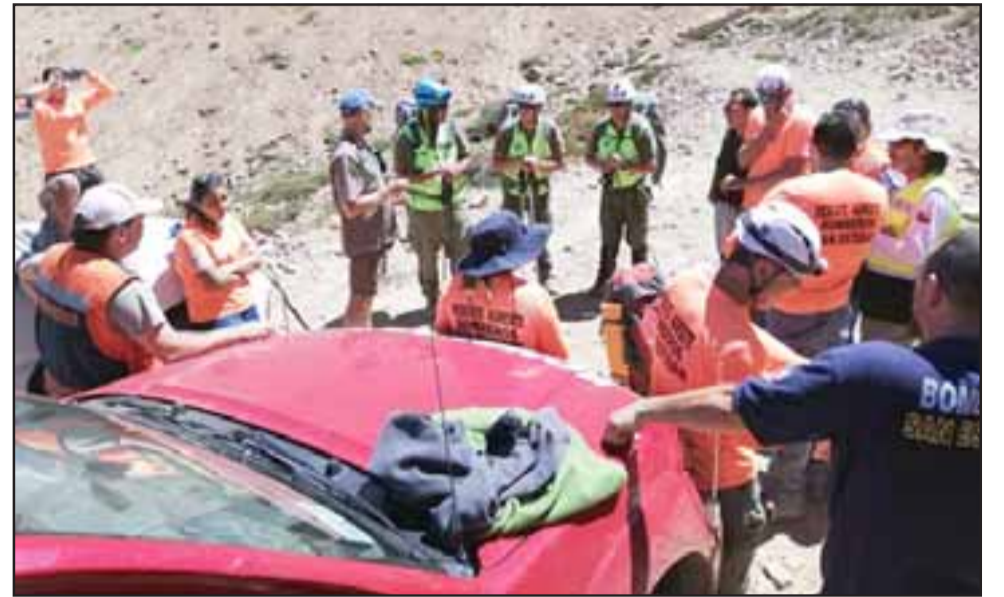
Tras una extensa búsqueda, las autoridades recataron con éxito a un turista francés de 54 años de edad.

AVISO: Por extravío quedan nulos cheques serie SQ N° 5623, 5625, Cuenta Corriente N° 22309046858 del Banco Estado, Sucursal San Felipe. 21/3