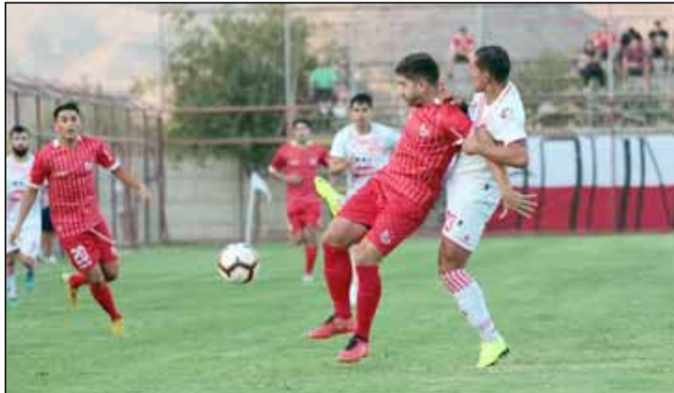
La escuadra sanfelipeña tuvo un primer tiempo bastante aceptable, pero decayó en el segundo.