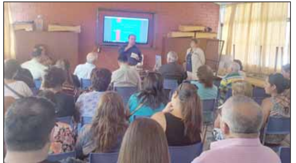
Primera autoridad provincial dialogó con los dirigentes vecinales y las personas que viven en el lugar, con el fin de facilitar el traslado diario a los distintos lugares a los cuales viajan tras el incendio que afectó al puente.