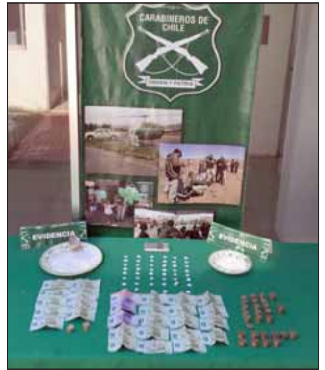
Procedimiento fue efectuado por personal de OS7 de Carabineros Aconcagua, incautando diversas cantidades de pasta base de cocaína desde dos domicilios de Villa Departamental de San Felipe.