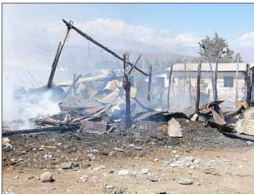
El incendio ocurrió cerca de las 15:30 horas de ayer domingo.