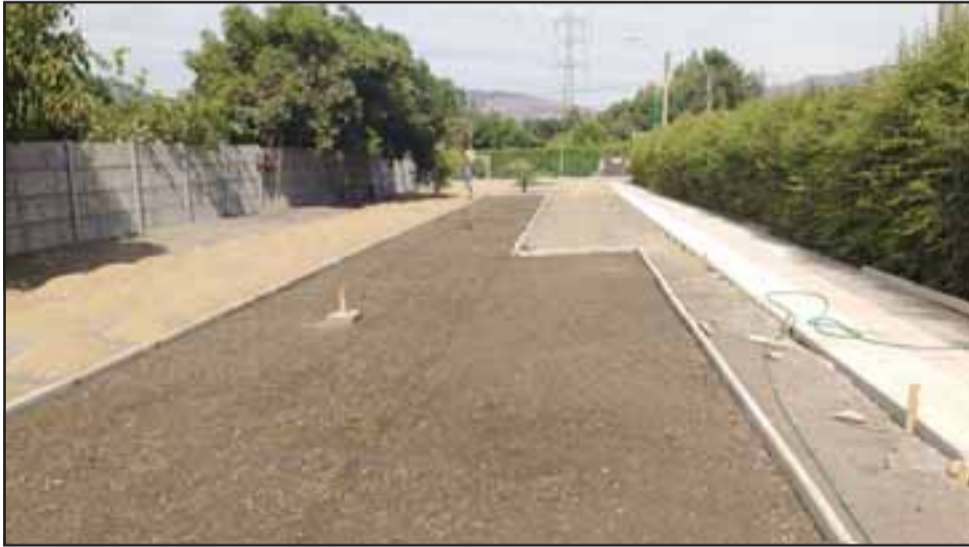
Un 60% de avance registran las obras de construcción de un paseo peatonal en Villa Lo Campo de la comuna de Panquehue.