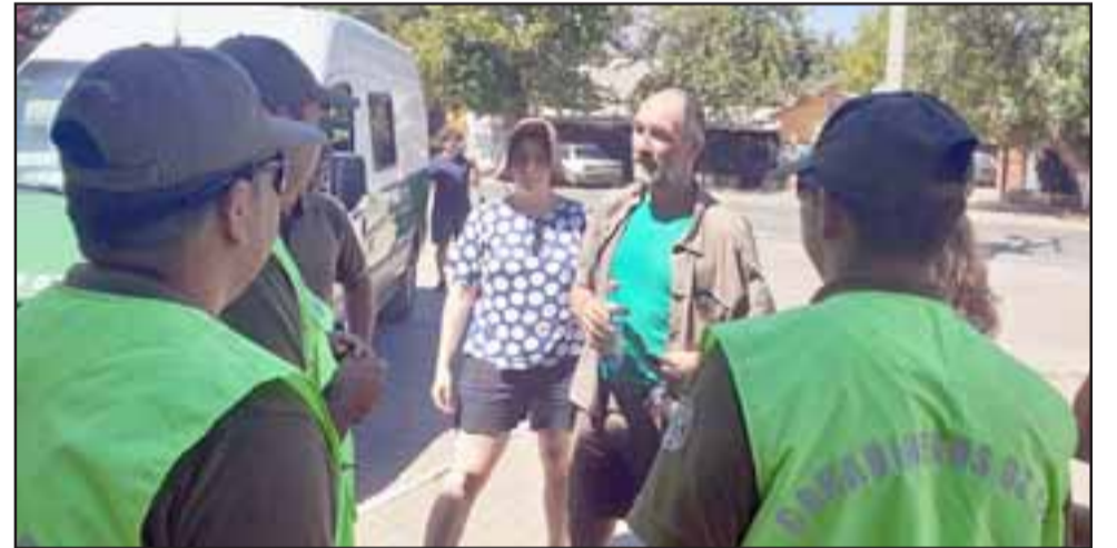
Los rescatistas lograron dar con el paradero de este turista, quien se encontraba realizando trekking en el sector cordillerano y se verificó su estado de salud, presentaba cierto grado de deshidratación razón.