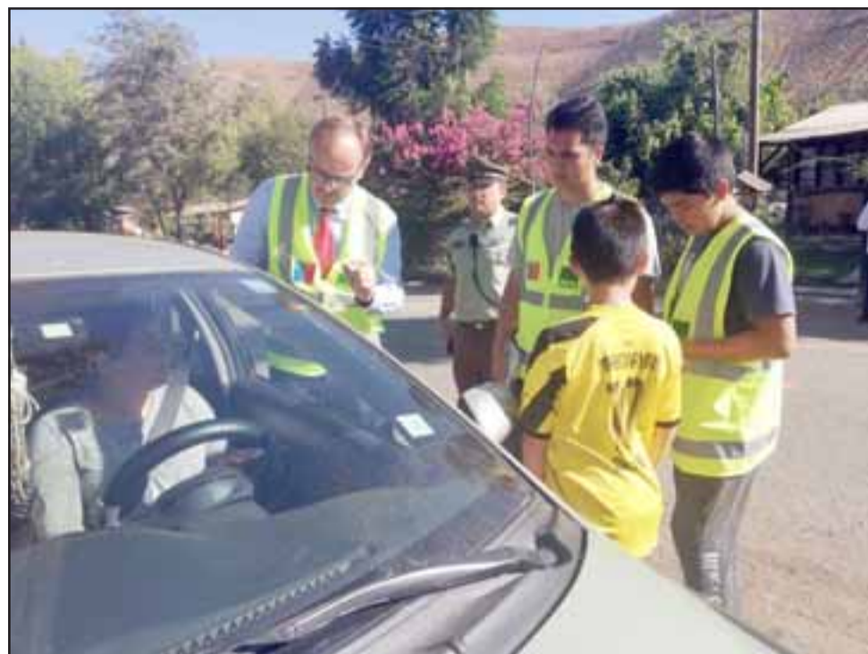
Jóvenes de la Agrupación El Porvenir junto al Seremi de Transportes Gerard Oligier y carabineros, entregando información a los automovilistas en la Ruta E-422.

Junto a la compañía del Seremi de Transportes y Telecomunicaciones de la