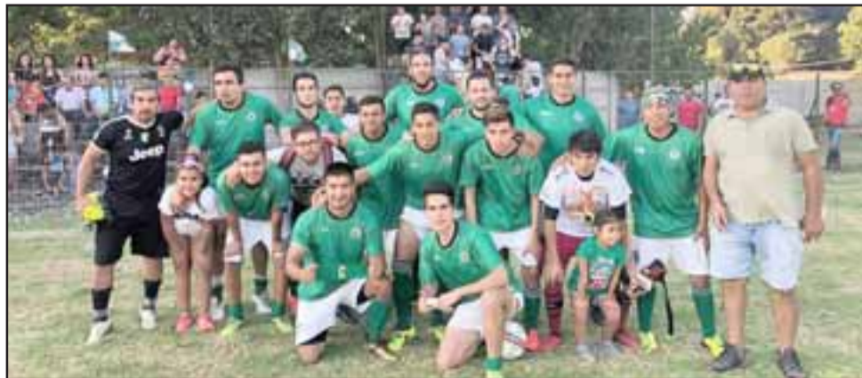
Viña Errázuriz tuvo una campaña perfecta en la primera etapa de la Copa de Campeones.

El micro ciclo de entrenamientos se prolongará hasta el próximo sábado 2 de marzo, en lo que serán días intensos y sin pausas debido a que este grupo que por ahora integran 19 jugadores, será el encargado de defender el título sudamericano obtenido el 2017 en Perú.