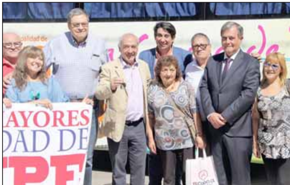
El nuevo bus representó una inversión que bordea los 136 millones de pesos y cuenta con capacidad para 44 personas.