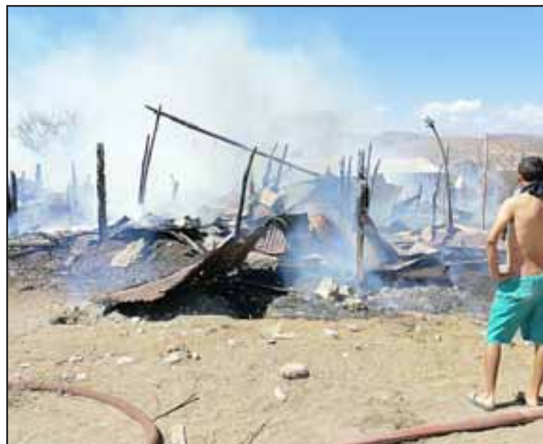
Tal como lo muestra la imagen, el incendio destruyó por completo las viviendas de material ligero.

nadie y obviamente uno tiene que empezar para salir adelante a luchar por uno mismo», señaló la abuela.