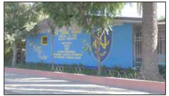
Con un nuevo pabellón y el mejoramiento de internet espera el Liceo Corina Urbina a las cientos de alumnas que comienzan su año escolar 2019.

«Durante enero y febrero se han estado realizando arreglos, por ello estamos listas para recibir a las alumnas del Liceo Corina Urbina 2019. Las novedades, y que se hicieron en la época estival, es un pabellón multicultural, donde se ubicarán las banderas de cada una de las nacionalidades a que corresponden las alumnas, acá no solamente hay niñas de Chile, hay siete países más, de Perú, Bolivia, de Sudamérica, niñas palestinas, haitianas, entonces se ha hecho un trabajo de poder elaborar un pabellón, que ellas se sientan identificadas y colocar un pedacito de lo que