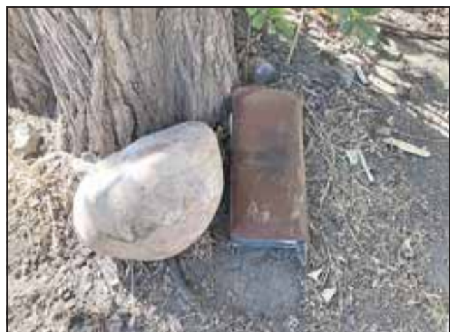
La billetera fue abandonada en las cercanías, pero sin el dinero en su interior.

La suma robada es cercana a unos 50 mil pesos.