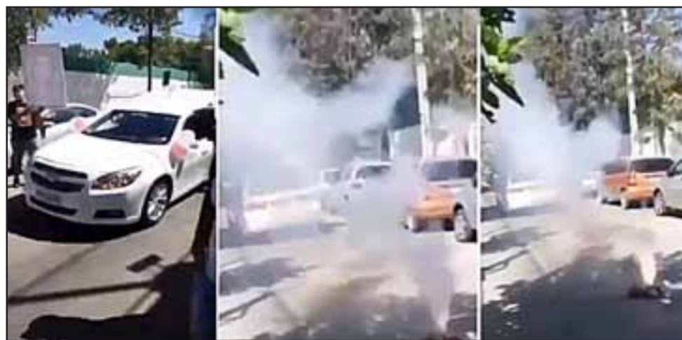
Durante una transmisión en vivo vía internet de uno de los asistentes al cortejo fúnebre, entre bocinazos y lanzamiento de fuegos de artificiales frente a la cárcel de San Felipe, fue despedida la joven fallecida este fin de semana.

Sin embargo sobre este último punto, Carabineros descartaría el uso de armas de fuego durante el reco-