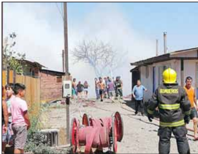
Seis compañías de bomberos debieron concurrir para enfrentar el incendio que se registró este domingo a eso de las 15:30 horas en 21 de Mayo.

Actualmente los damnificados se encuentran de allegados en casas de personas cercanas; «porque estaban limpiando en el terreno, porque no sé si habrá asistido el alcalde o habrá ido alguien para ayudar, usted sabe que todos prometen y en el momento no llega