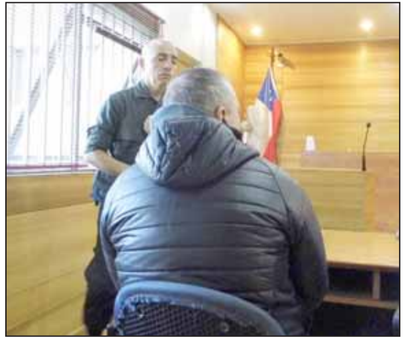
De apellido Peruzzi es el argentino a quien se le decomisó la maleta con fármacos. Quedó en libertad.

puesto a disposición del Tribunal de Garantía de Los Andes, siendo formalizado por el delito de Contrabando. Por no tener antecedentes penales en nuestro país, accedió a una Suspensión Condicional