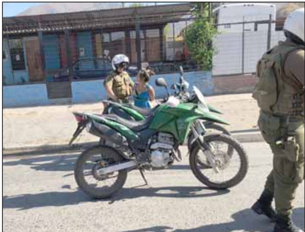
Acá vemos a Carabineros deteniendo a la mujer por su presunta participación en el robo del dinero al voluntario.

El otro hecho delictual fue el que afectó a un voluntario de la Unidad de la Compañía de Panquehue en los momentos que pasaron al Puente El Rey a cargar agua: «El conductor y el ayudante bajaron a hacer las conexiones para poder cargar el camión con agua; una pareja conformada por un hombre y una mujer ingresaron a la parte de la cabina, robándole los documentos. Bueno, los documentos los botaron, pero sí le robaron la plata que te-