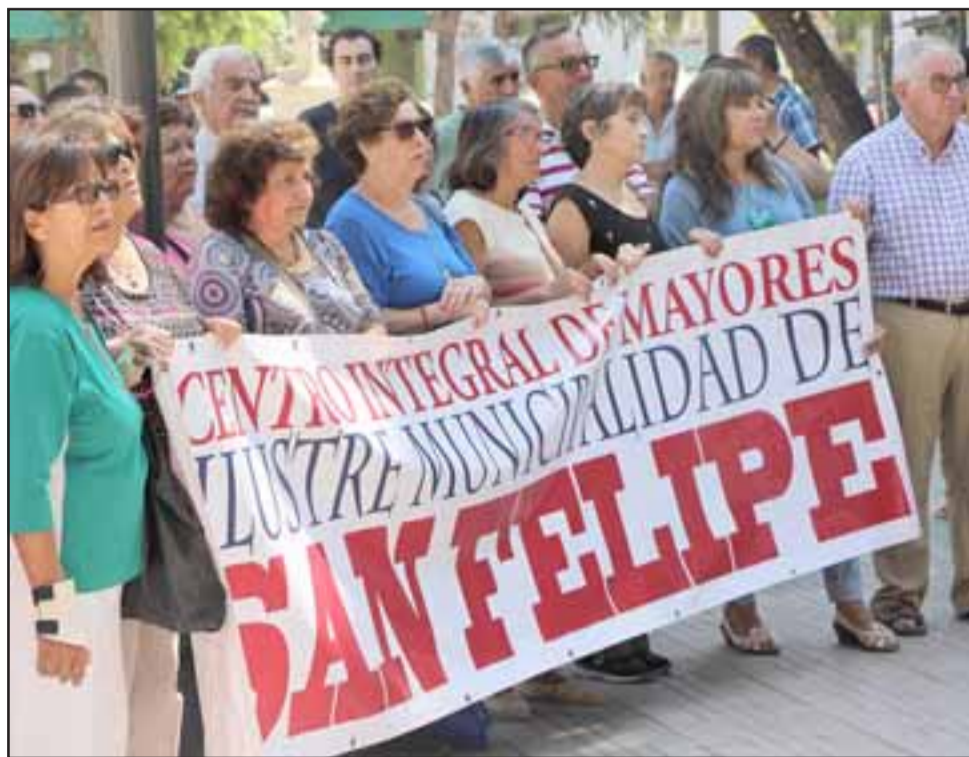
Diversas organizaciones sociales estuvieron presentes en la oportunidad, quienes serán los directos beneficiados.