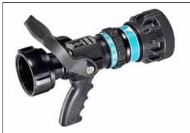
Este es un pitón de bomberos como el que se robaron (Referencial).