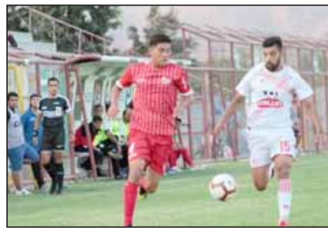
Por la tercera fecha del torneo el Uní Uní enfrentará a Santiago Morning.

*Jugaban al cierre de la presente edición de Diario El Trabajo