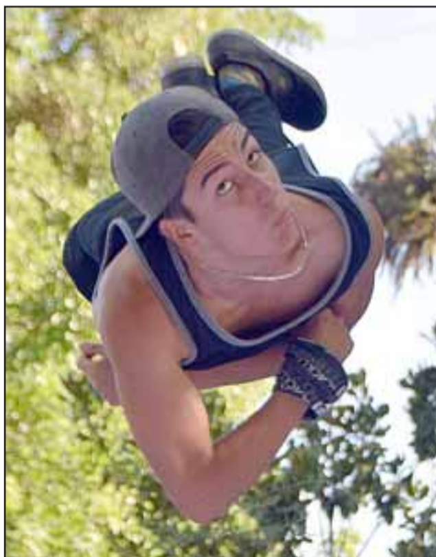
TRUCO LOCO. - Nuestras cámaras tuvieron que ser bien enfocadas para poder captar el mejor ángulo que nos dieron estos chicos.