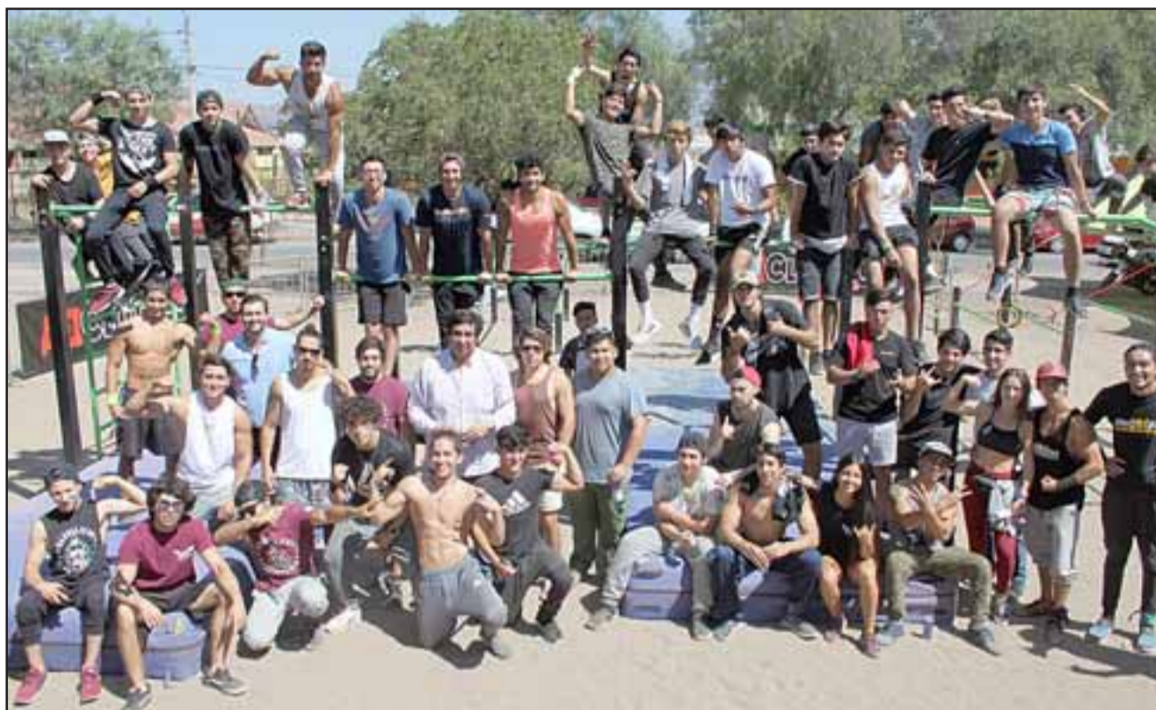
DE TODAS LAS EDADES.- Ellos son gran parte de los competidores que este sábado dieron vida al 2º Torneo Intercomunal de Calistenia San Felipe 2019.