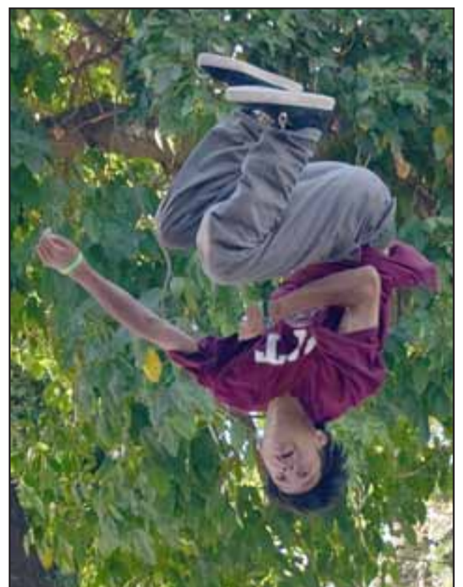
IMPRESIONANTE. - Los nacionales también se lucieron como profesionales en este extremo deporte.