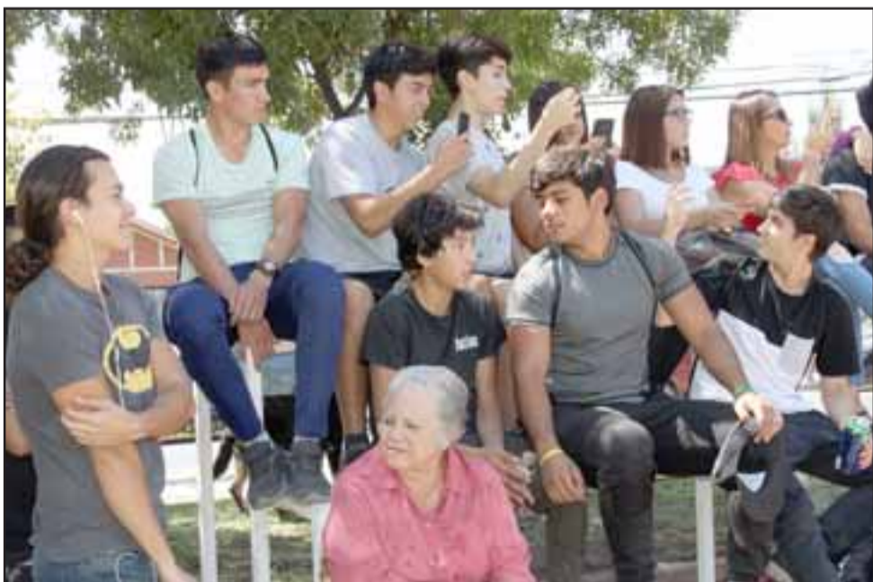
JORNADA FAMILIAR.- El público fue variado, llegaron niños, adultos mayores y familias enteras para apoyar a sus competidores.