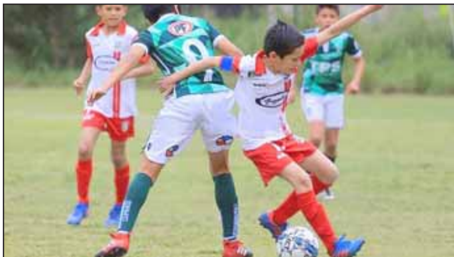
Para el 9 de marzo está contemplado el estreno de los equipos más pequeños del Uní.

Zona Centro: Audax Italiano, Barnechea, Cobreloa, Cobresal, Colo Colo, Everton, Melipilla, Magallanes, O'Higgins, Palestino, San Luis, Santiago Wanderers, Santiago Morning, Unión Española, Unión La Calera, Universidad de Chile, Universidad Católica, Unión San Felipe.