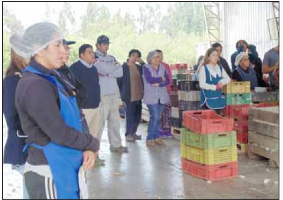
Los trabajadores escuchan con atención a los misioneros con quienes compartieron un momento de oración.

los trabajadores, momento que se vive con gran alegría.