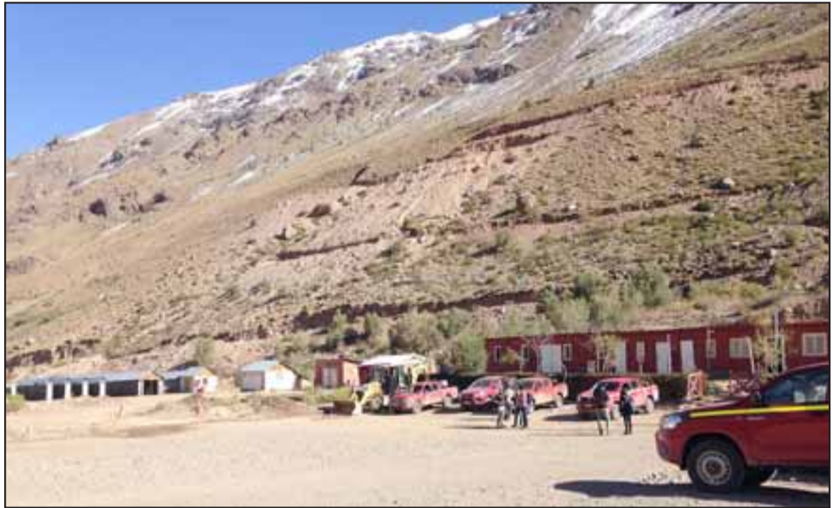
El campamento minero en Las Tejas, construido en forma totalmente irregular e ilegal, deberá ser demolido según lo dispuesto por la Corte de Apelaciones.

En primera instancia, el Juzgado de Policía Local de Putaendo sentenció a la Compañía Minera Vizcachitas Holding al pago de una multa ascendente a treinta unidades tributarias mensuales y a la demolición de todas las obras realizadas en el sector de Las Tejas. La Corte de Apelaciones de Valparaíso confirmó dicha