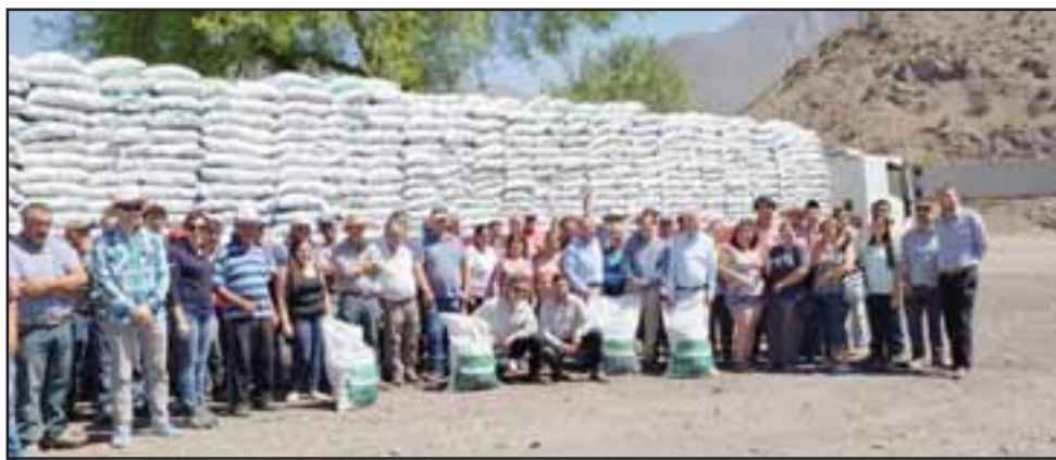
En total fueron 54 pequeños ganaderos de la comuna de San Felipe los que recibieron casi 30 toneladas de forraje para alimentar a sus animales.

En tanto, el Seremi de Agricultura enfatizó que son $450 millones los que se dispusieron para la compra de estos alimentos en toda la región. «Con esto podremos ayudarles a que lleguen al otoño de la mejor forma. Así, podemos facilit-