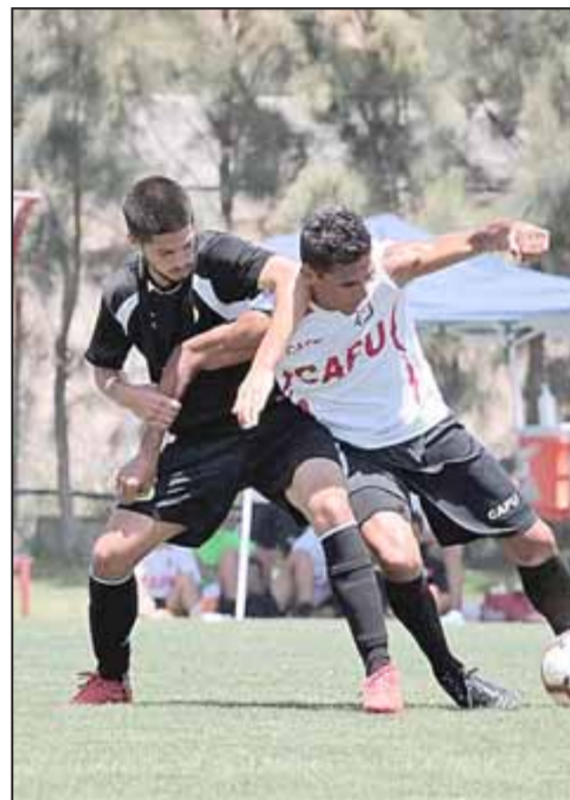
El equipo albirrojo está obligado a sumar ante Santiago Morning para detener su mal inicio de torneo.

Lugar Ptos. Valdivia 6 Santiago Morning 6