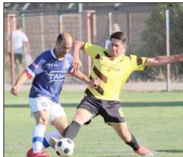
Este fin de semana culminará la fase de grupos de los torneos Amor a la Camiseta y Afava.

Grupo H: Pachacama – Unión Escorial; Estrella – Vichiculen.