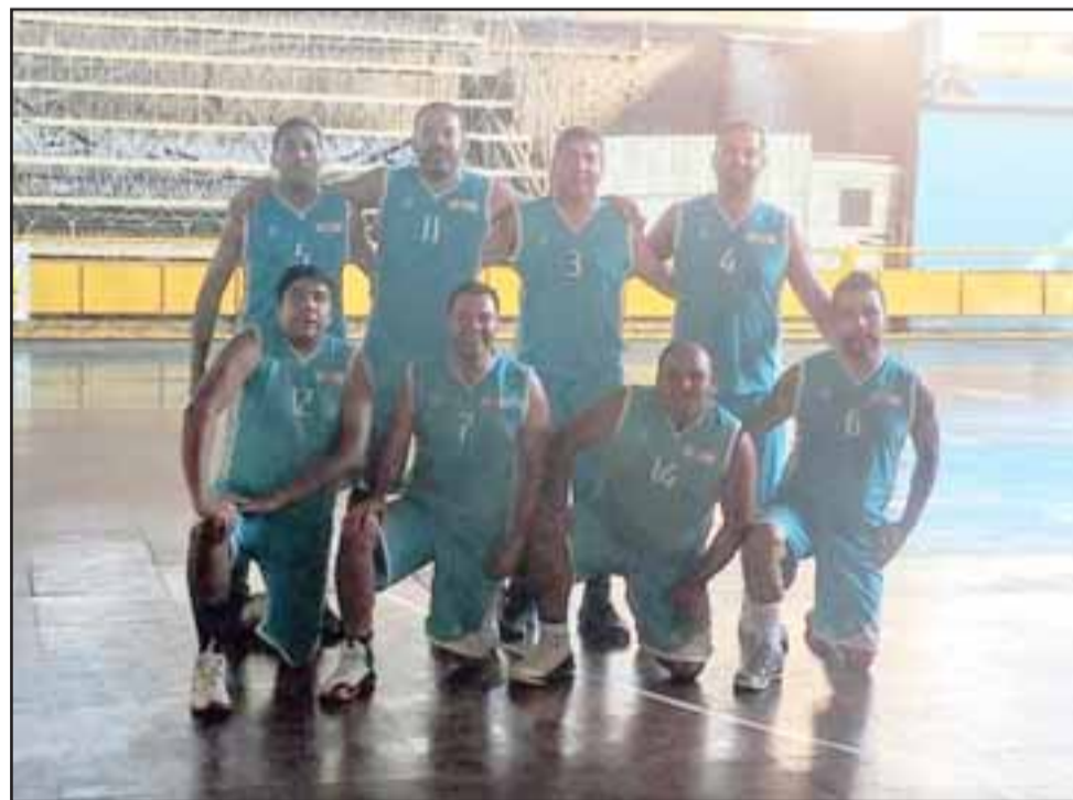
El quinteto del IAC cerrará la jornada dominical en el torneo Sénior en el Fortín Prat.