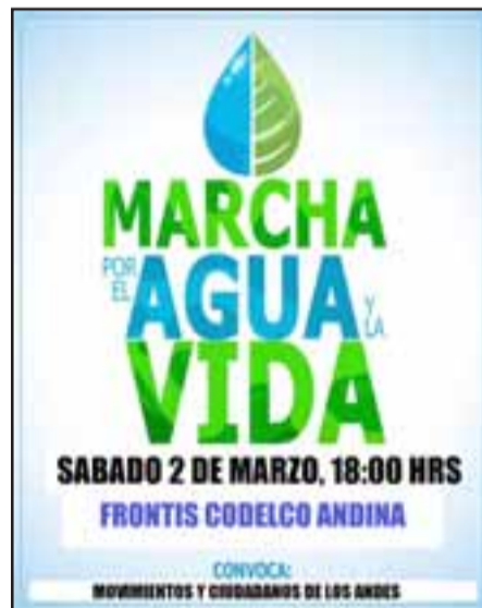
Este es el afiche con el cual están convocando a esta primera marcha por el agua.

«Finalmente, queremos manifestar que nos sumaremos a todas las convocatorias a marchas que existen en el Valle en pro de defender este recurso vital, solo la unidad y convergencia de todos podrá salvar el agua, para entregarla a nuestras familias y devolverla a Chile para que sea un derecho de todos los chilenos y chilenas».