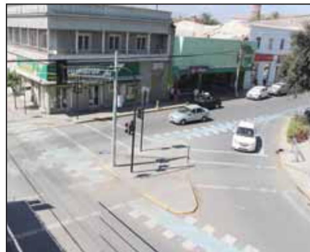
El cambio de sentido de tránsito se implementará solo una vez que se haya recepcionado las obras que se efectúan en el centro.