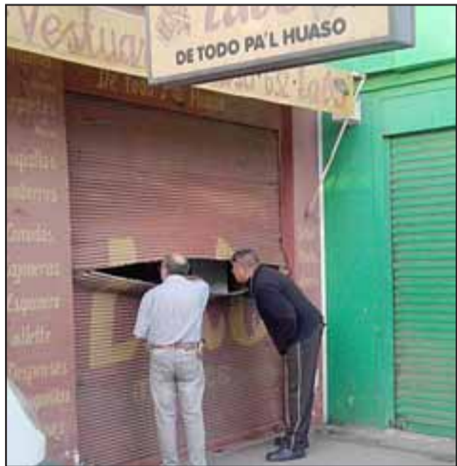
En la imagen el afectado observando hacia el interior de su local aún sin abrir, en espera de la policía que nunca llegó.