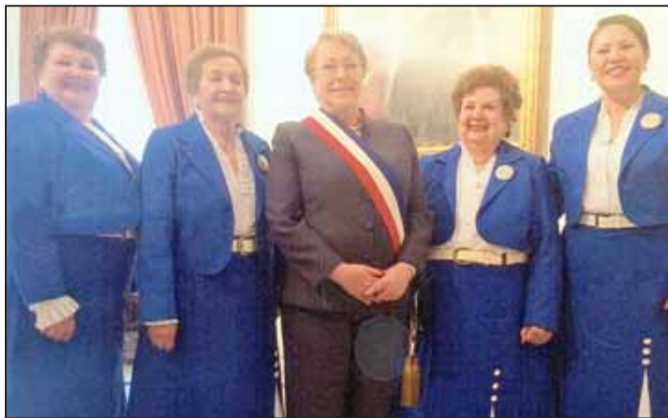
LAS MEJORES DEL PAÍS.- Hasta doña Michelle Bachelet cuando ha sido presidenta ha disfrutado del trabajo artístico de Las Morenitas.