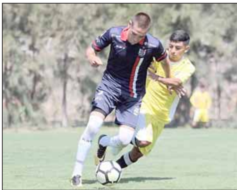
Irregular fue el inicio del torneo de Fútbol Joven para las canteras del Uní Uní.