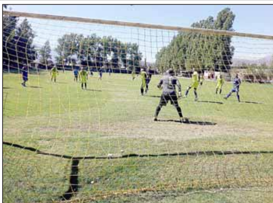
Los jugadores mayores de 57 años de la Liga Vecinal seguirán compitiendo durante el otoño.