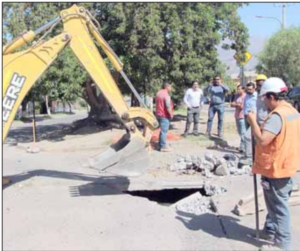
En la imagen el inicio de las obras de reparación que demandaron una inversión de diez millones de pesos.