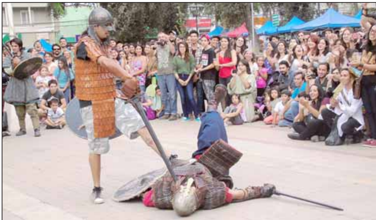
REGRESAN LOS VIKINGOS.- La Cuarta Feria Medieval se realizará en nuestra comuna a partir de las 11:00 horas y hasta las 21:00 horas del sábado. En la gráfica vemos a Varnesjord Recreación Vikinga.

Mambo Celta será otra de las agrupaciones que harán de las suyas en este Fe-