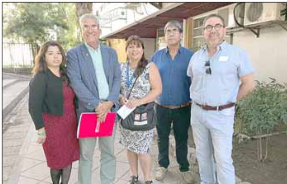
Dirigentes de la Fenats Aconcagua hicieron extensiva la invitación a todas las mujeres en general.

de género y el fin a la violencia contra la mujer, a realizarse este jueves 7 de marzo a las 10:30 horas en el Teatro Municipal de San Felipe.