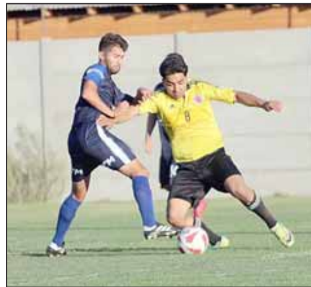
Ya están definidos los grupos del torneo de fútbol amateur Amor a la Camiseta.