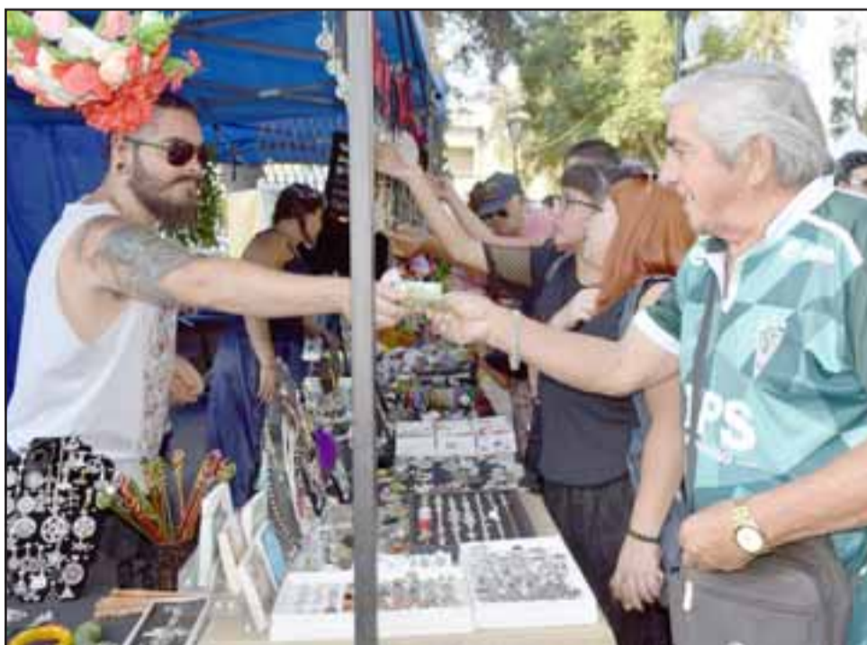
RICA HIDROMIEL.- Aquí tenemos a los productores de hidromiel Melikraton, con sus mejores productos medievales.