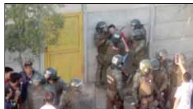
Numeroso personal policial durante la detención del joven acusado de golpear a una mujer carabinero.