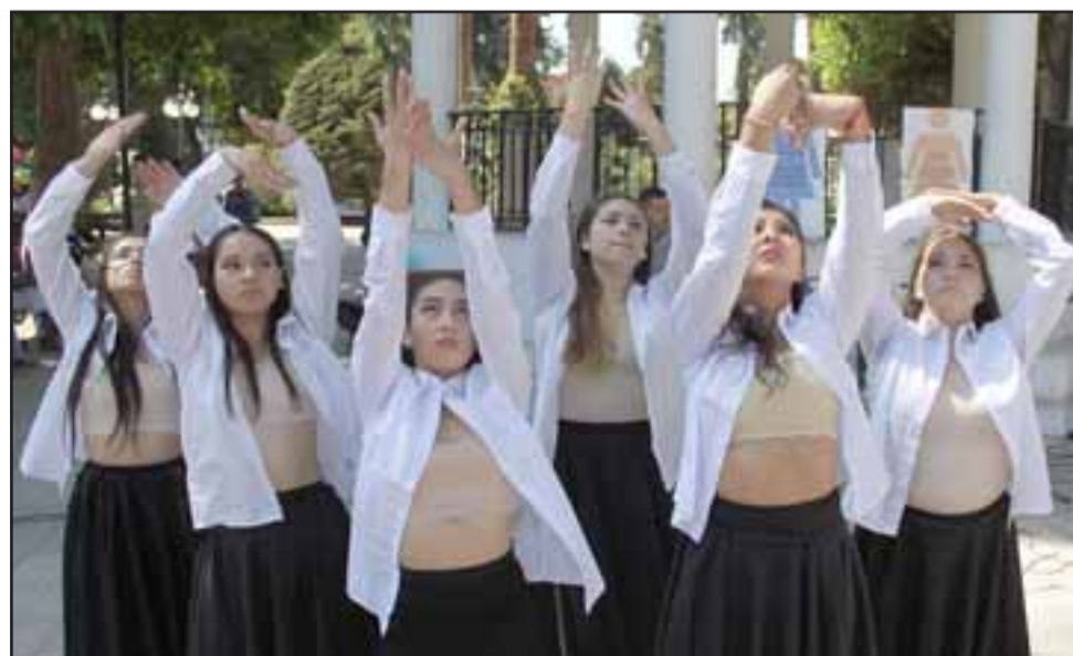
BALLET SERGIO LENIN.- Ellos son los chicos del Ballet Sergio Lenin, quienes hicieron de las suyas durante la presentación de la actividad.