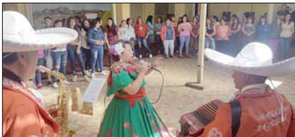
SERENATA EN PRISIÓN.- Así lucieron estos artistas sanfelipeños en el CCP Los Andes, durante la serenata especial a las damas ahí reclusas.