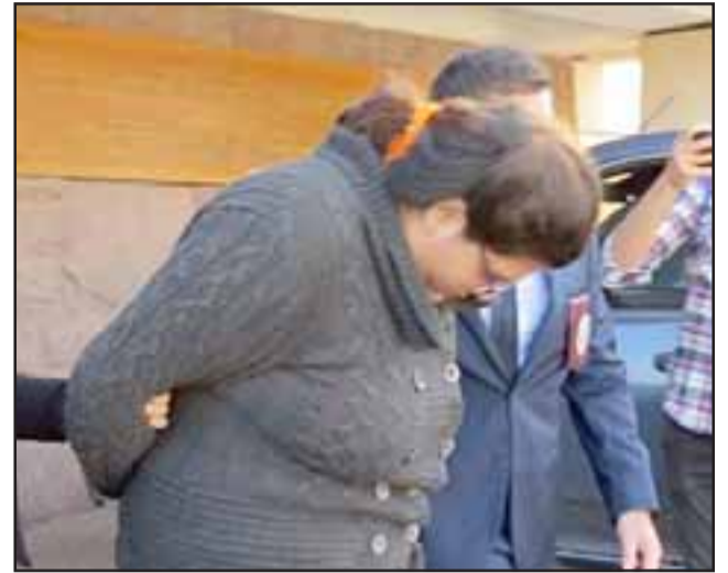
FUE CAPTURADA.- Así se le dio captura a esta mujer sanfelipeña tras el allanamiento ejecutado por la Biro Los Andes en Calle Chorrillos de San Felipe.

AVISO: Por extravío queda nulo cheque N°1020480, Cuenta Corriente N° 22109000152, Banco Estado, Sucursal Putaendo.