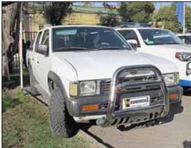
CAMIONETA DEL ROBO.- Esta es la camioneta usada para perpetrar el millonario robo en la empresa de detergentes, adentro estaban las armas.

Detectives de la Brigada de Robos de la PDI de Los Andes (Biro) arrestaron en Calle Chorrillos de San Felipe, a una mujer que mantenía en su domicilio gran cantidad de especies que fueron robadas desde una distribuidora de detergentes ubicada en el sector industrial de la comuna de San Felipe.