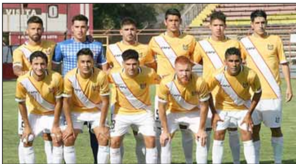
Unión San Felipe cayó ajustada pero merecidamente frente a Santiago Wanderers.

Independiente de la calidad de sus jugadores y riqueza de plantel, Santiago Wanderers no era un gran equipo, muestra de aquello fue que pese a todo lo mal que jugó, el Uní Uní igual tuvo chances claras para empatar el duelo, pero Ji-