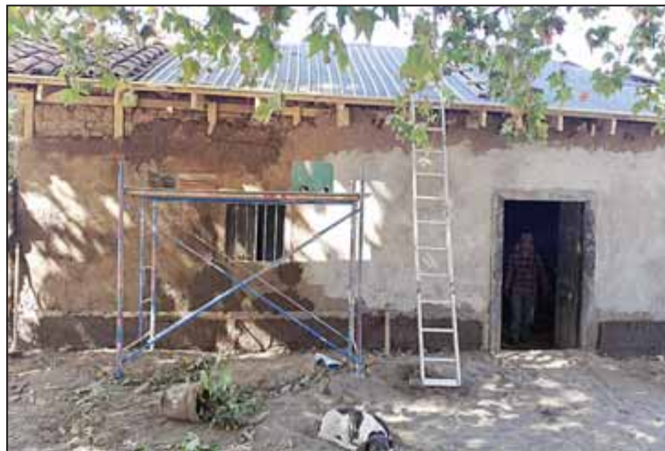
A través del Programa de Protección al Patrimonio Familiar, el proyecto piloto está recuperando 40 casas patrimoniales en la comuna de Putaendo, recuperando su estructura y conservando su valor histórico, pero además optimizando las condiciones de habitabilidad para las personas que viven en ella.

En línea con lo anterior, Tomás Ochoa destacó que lo que se está haciendo en estos proyectos