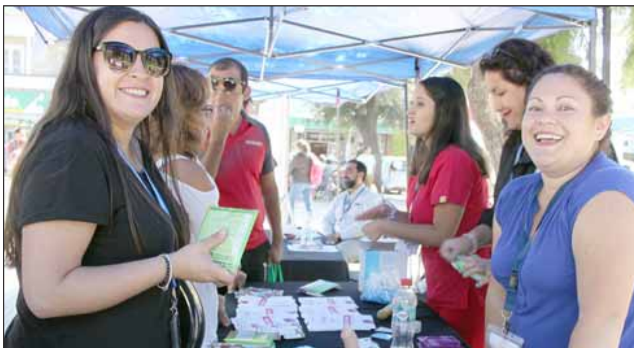
MUCHO INTERÉS.- Decenas de sanfelipeñas se acercaron a los distintos stands instalados ayer en la Plaza de Armas para recibir asesoramiento en las distintas referencias ofrecidas en ‘Tu Plaza Mujer’.