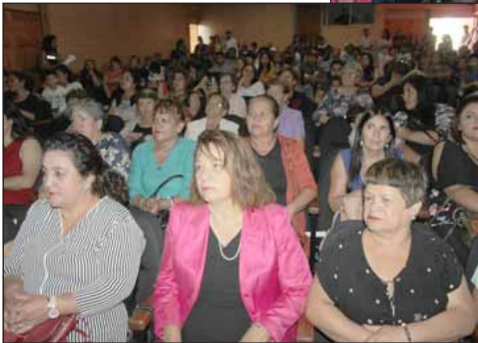
¡SANTA MARÍA VIVE! - El Teatro Municipal de Santa María fue insuficiente para albergar sentadas a todas las personas que asistieron a la especial actividad.

tros los hombres no, y partiendo de este maravilloso hecho puedo asegurar que si bien no es posible establecer que debamos ser iguales, lo que sí debemos buscar en esta lucha milenaria entre ambas figuras es la equidad, equidad en las oportunidades laborales, sociales y de derechos individuales entre ellas y nosotros, y eso es lo que buscamos a nivel comunal también, que las vecinas se empoderen de su comuna, de sus juntas vecinales y de sus