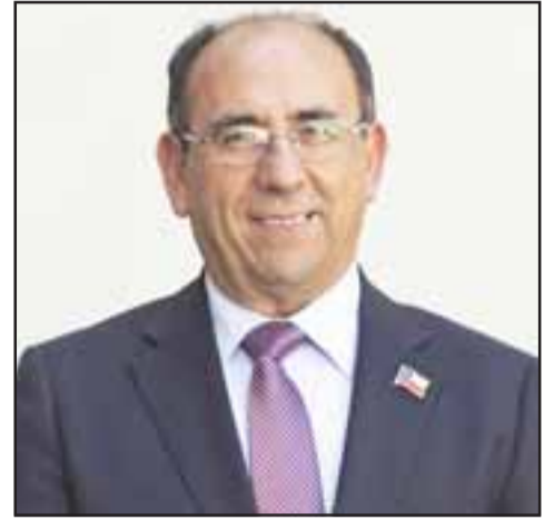
El gobernador Claudio Rodríguez Cataldo destacó los avances logrados en el primer año de gobierno.

Para la primera autoridad provincial, importantes serán los desafíos para este año, que se enmarcarán en