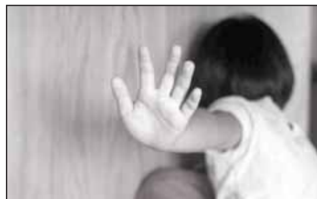
La menor habría sido abusada sexualmente en agosto del año 2017 en la localidad de Reinoso en Catemu. (Foto referencial).

pornográfico infantil, independiente que son dos delitos diferentes que son sancionables, por lo tanto cada uno por separado y estamos a la espera de que se fije la audiencia de juicio oral».