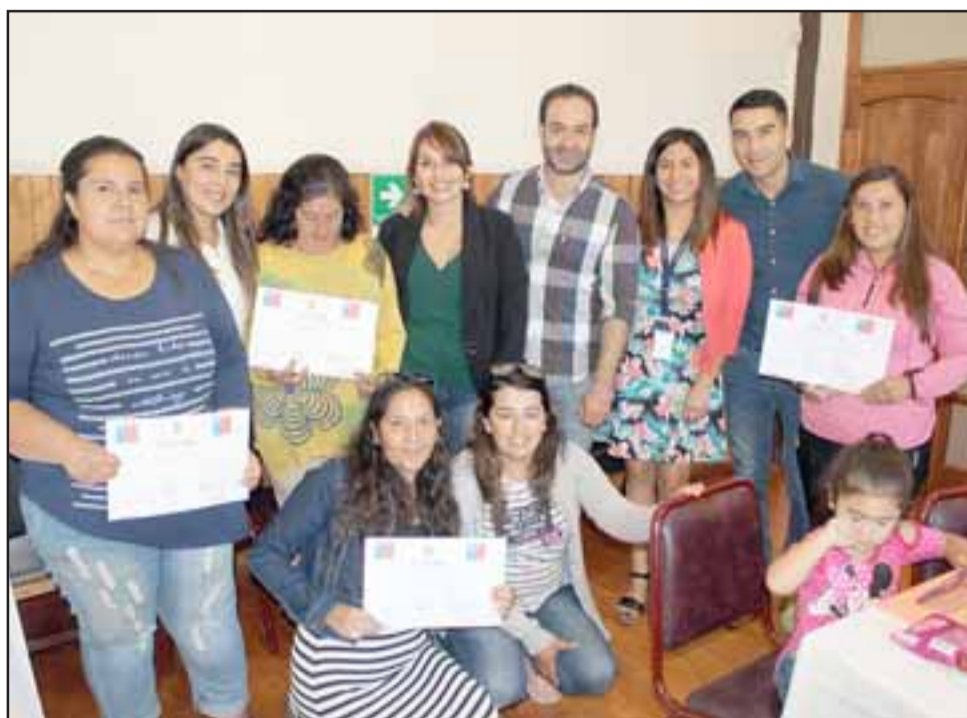
Al término de la reunión cada una de las familias intervenidas recibió un certificado que acredita su intervención social.

«Nuestra idea es seguir trabajando con las familias que debiesen ingresar este año, puedo comentar que al escuchar el discurso de las familias, ellas estaban emocionadas, ellas hablan de un cambio de vida, hablan de un antes y un después de la intervención que se realizó,