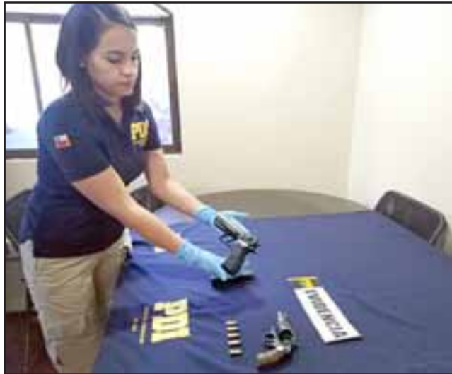
BIEN ARMADA.- Los detectives de la PDI hallaron en la camioneta un revólver marca Rossi calibre 38 y una pistola a balines que la banda usaría como defensa.