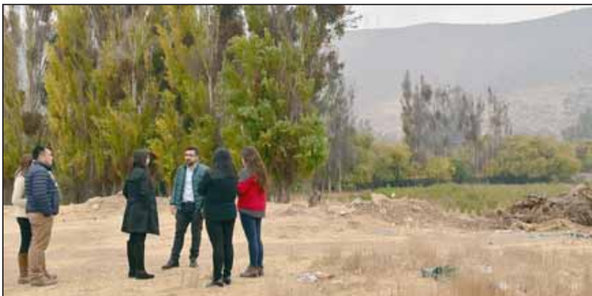
Un negro lunar constituye el terreno de la cancha Inducorn, convertido en un importante foco de insalubridad y delincuencia.

El propietario del terreno era el sindicato de trabajadores y ex trabajadores de la empresa Industria de maíz y Alimentos SA de Llay Llay, con quien se comenzó a conversar sobre esta interesante iniciativa. Después de meses de acercamientos, finalmente se llegó a un