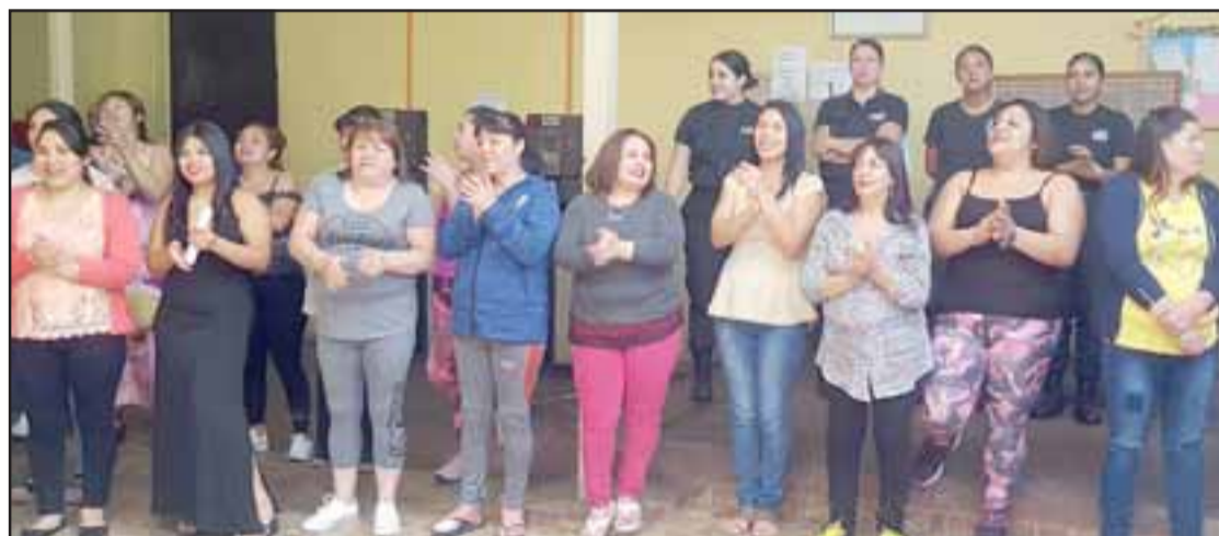
DAMAS HOMENAJEADAS.- Ellas son algunas de las damas que disfrutaron gratuitamente de esta iniciativa desarrollada por Mariachi La Reina.