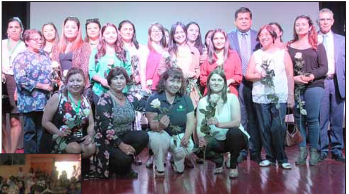
ELLAS LA LLEVAN.- Casi medio centenar de mujeres santamarianas recibieron en vida el justo reconocimiento por sus logros y aportes a la comuna.

«Creo que es muy importante destacar que, en honor a la verdad el Hombre y la Mujer somos distintos, jamás podremos ser iguales, la mujer puede traer hijos al mundo, noso-