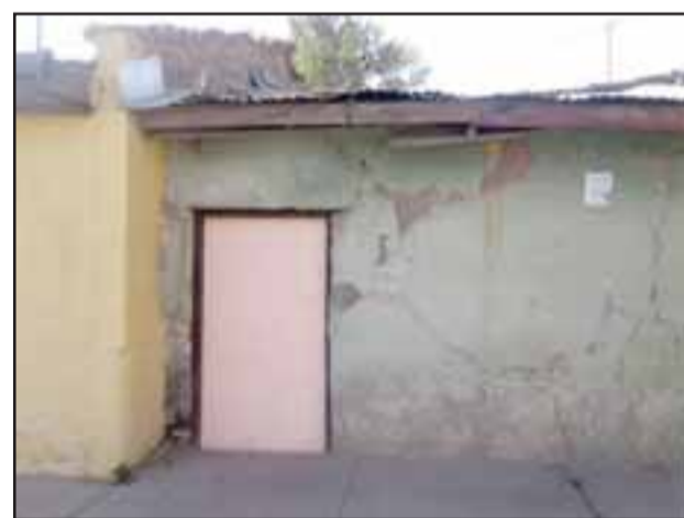
Esta es la puerta que forzaron los sujetos para apoderarse de los 450 bidones plásticos.

Dice que habló con Carabineros, quienes les indicaron que estarían realizando rondas periódicas.