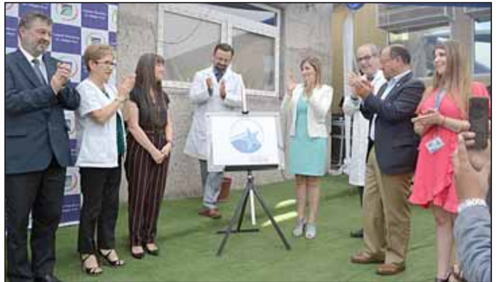
Momentos emotivos y de gran satisfacción en cada funcionario por el logro alcanzado, fueron los que experimentaron estos funcionarios.

En la oportunidad el director del Hospital Dr. Jaime Retamal Garrido, precisó que esta ceremonia se estaba esperando desde el año recién pasado, toda vez que la acreditación propiamente tal se logró en el mes de julio de 2018, y que luego según calendario se debe esperar a lo menos unos tres meses para que se produzca dicha ceremonia, pero debido a diferentes coyunturas que se produjeron a lo largo de este tiempo, se tuvo que reprogramar en un par de oportunidades. No obstante lo anterior, nada pudo restarle la fuerza y la emoción vivida. A este respecto el director destacó el compromiso funcionario, el trabajo en equipo, el liderazgo del equipo de calidad, del equipo directivo de los jefes de servicios y unidades y especialmente que estar acreditados va en directo beneficio de los usuarios del hospital.