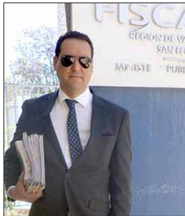
Eduardo Fajardo de la Cuba, fiscal a cargo del caso.

El crimen de Susana quedó al descubierto el día 7 de marzo de 2017, cuando un funcionario del Juzgado de Policía Local de San Felipe concurrió hasta el Archivero Municipal ubicado en Calle Prat N°242 y descubrió la mano del cuerpo de una persona que estaba envuelta en una bolsa plás-