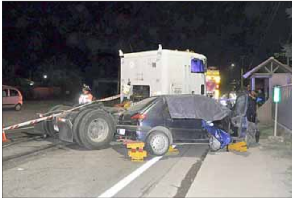
La Siat de Carabineros Aconcagua quedó a cargo de los peritajes a fin de establecer las causas de este nuevo accidente ocurrido en la ruta que une Los Andes con la frontera.