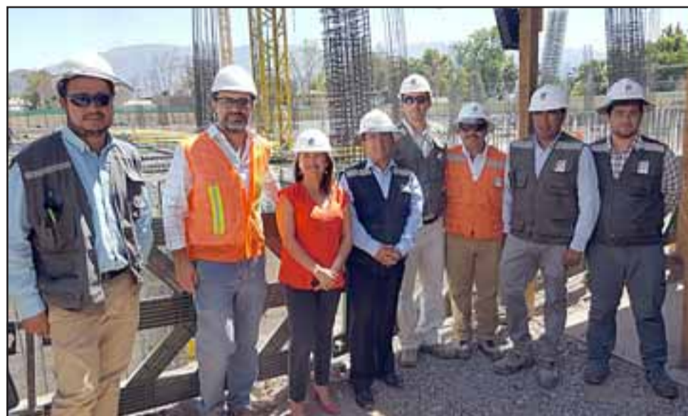
Autoridades gubernamentales participaron de la cita con los ejecutivos de la empresa que desarrolla la construcción del futuro hipermercado en un sector estratégico e histórico en la comuna de San Felipe.