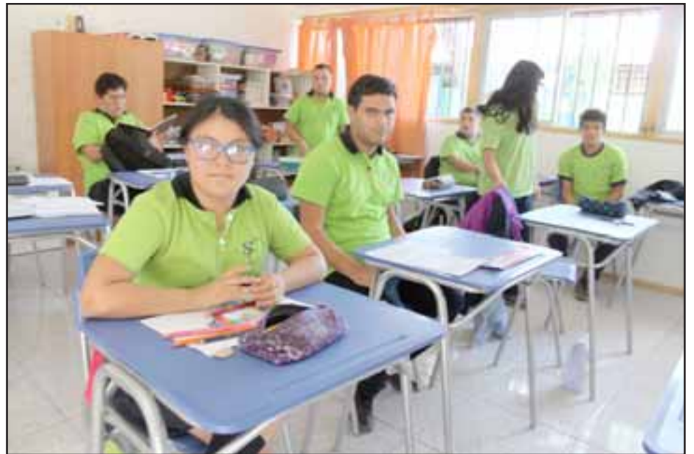
TODO NUEVO. - Ellos son estudiantes que ya están usando el nuevo inmobiliario, sillas, estantería, mesas y pizarras totalmente nuevos.