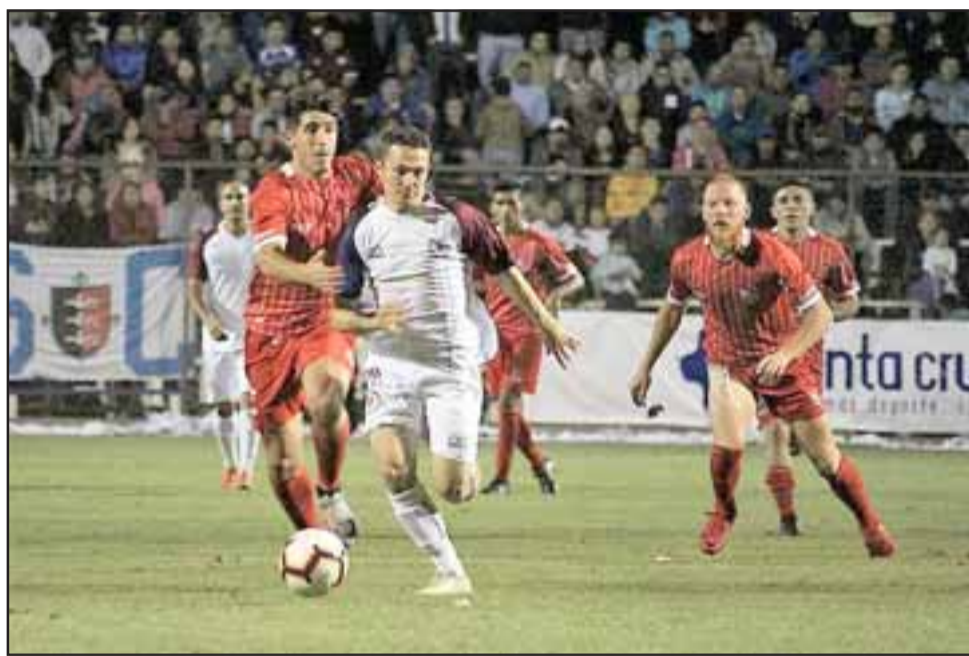
Ante Santa Cruz el Uní Uní mostró escaso fútbol y solo se dedicó a defenderse, pero igual terminó con las manos vacías.

Santa Cruz aceptó la invitación y se fue con todo sobre el arco de Andrés Fer-