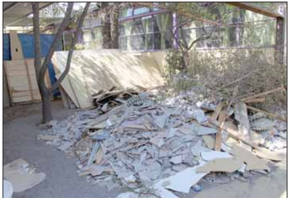
VIENEN TIEMPOS MEJORES. - Estas son las montañas de escombros generadas de la demolición de viejas aulas.