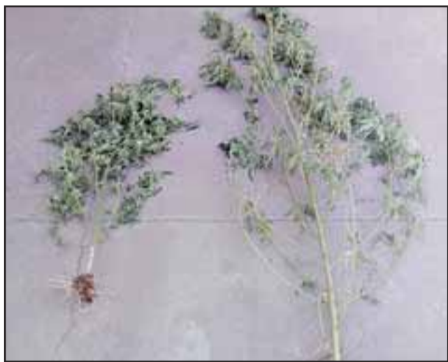
Personal de la PDI incautó las plantas de cannabis sativa desde el inmueble de la imputada en Población Pablo Neruda de Llay Llay.

Desmienten femicidio en población Santa Brígida: