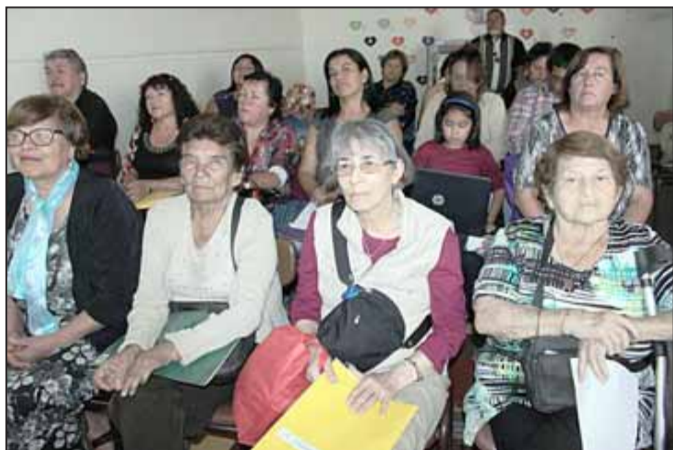
EMPIEZAN LAS CLASES. - Decenas de dirigentes sanfelipeños participan todos los sábados en la Escuela del Dirigente.