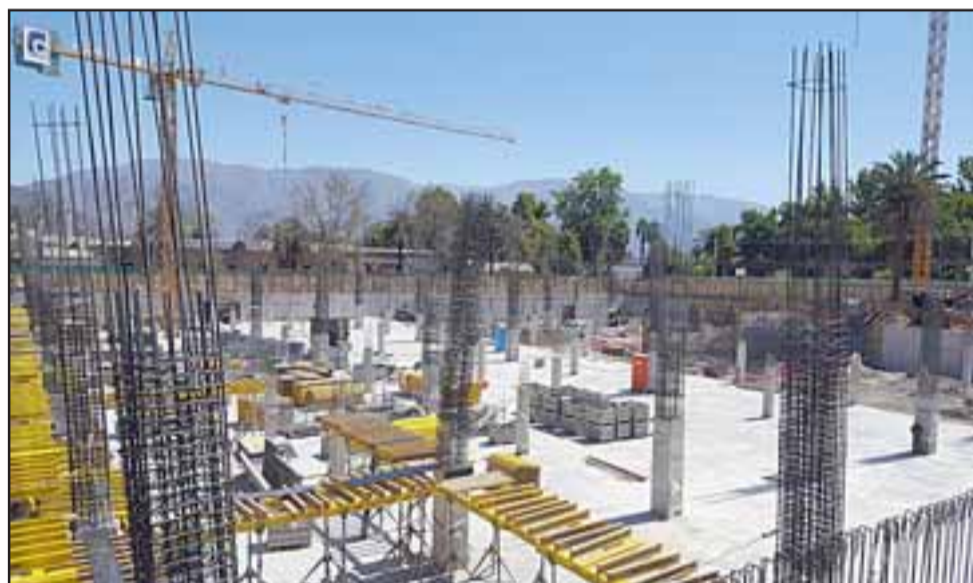
Así lucen las obras de este gigantesco supermercado en nuestra comuna, lo que significará más plazas de trabajo para muchos sanfelipeños.

nos adjudicamos comenzó el pasado 14 de enero de este año y finaliza en septiembre próximo».