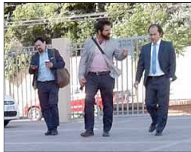
A la izquierda los dueños de Pixel junto a su abogado entrando al patio del tribunal luego de un receso.

- ¿En el caso que los dueños de Pixel sean encontrados culpables, después se pueden seguir acciones legales como quizás para recuperar parte del dinero de esta estafa?