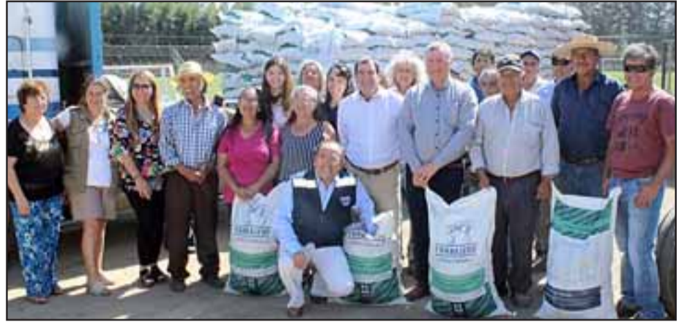
Aquí el gobierno está asumiendo su rol de apoyar a los pequeños agricultores, cuando la situación climatología lo requiere.

Los pequeños agricultores, usuarios del programa Prodesal, se manifestaron muy agradecidos con esta ayuda, que les permitirá paliar en cierta medida la falta de forraje para la alimentación de sus animales. Explicaron que de no haber lluvia durante este invierno, la situa-