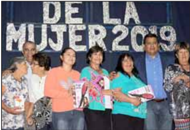
MUCHOS PREMIOS.- El Concejo en pleno entregó muchos regalos a las ganadoras de sorteos, cada una de ellas eligió su propio regalo.

Como parte de la actividad las autoridades entregaron 80 premios en sorteos, además de algunos sobres con premio sorpresa. Hubo artistas invitados que también alegraron el corazón de todos, pues la picar-