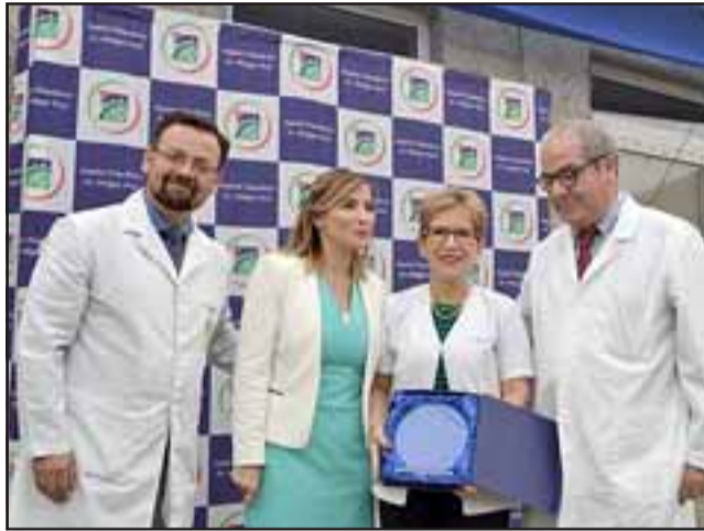
Personal médico del hospital psiquiátrico de Putaendo felices tras recibir la Acreditación en Calidad y Seguridad del paciente.