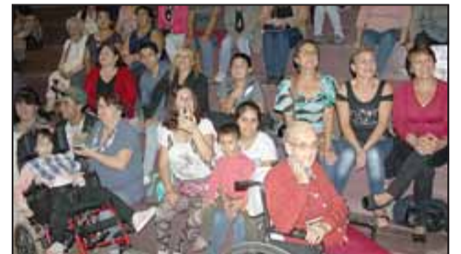
SIEMPRE MUJER.- No hubo limitaciones en edad ni salud, las mujeres de la comuna salieron de sus casas para recibir dignamente la ofrenda para ellas servida.