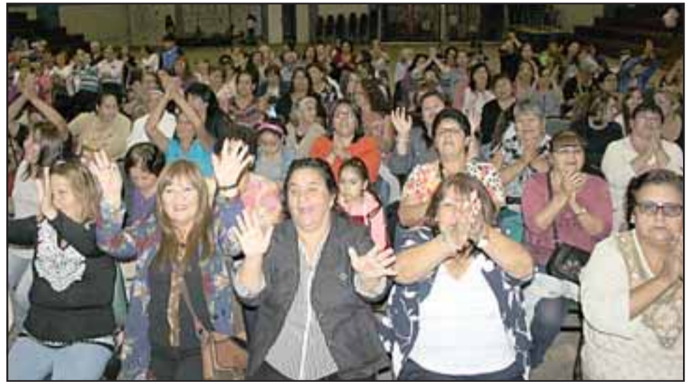
ESTA FUE SU FIESTA.- Como nunca antes las vecinas de Santa María se sintieron verdaderamente regaladas por las autoridades comunales.