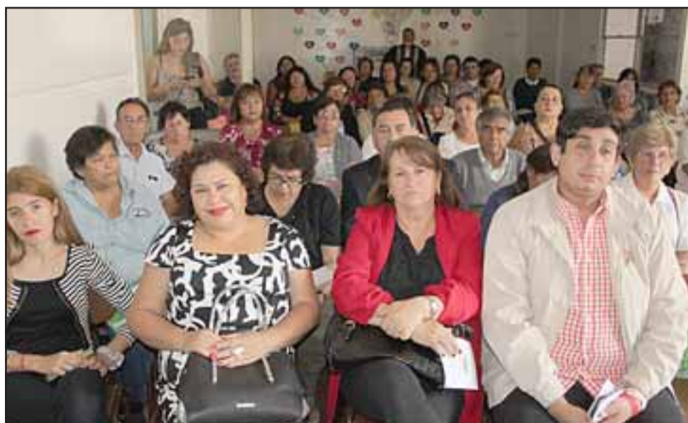
AUTORIDADES CERCANAS. - Las reglas de la Escuela fueron explicadas, este año se contará también con el apoyo de exalumnos de esta escuela.