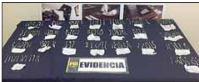
La Brianco sacó de circulación tanto al traficante como su inusual mercancía.

El próximo 28 de marzo vence el plazo de inscripción, por lo que las interesadas pueden asistir a la Oficina Municipal de la Mujer, ubicada en Calle María Eufrosia 1350, ex San Martín, al frente de la Fiscalía, de lunes a jueves de 08:00 a 13:00 y en la tarde de 15:00 a 17:00 horas, mientras que el viernes 08:00 a 13:00 horas.