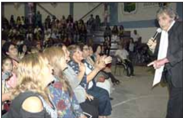
GRANDE SANDRO.- El Doble Oficial de Sandro arrolló con los suspiros de cada mujer en ese lugar, un homenaje al gran Sandro de América.