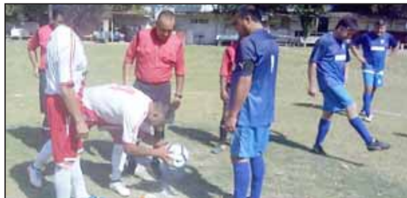
Jugadores y árbitros antes de iniciar un duelo en la cancha Parrasía.

Carlos Barrera 1 – Aconcagua 1; Barcelona 1 – Hernán Pérez Quijanes 0; Unión Esfuerzo 2 – Villa Argelia 0; Tsunami 2 – Santos 0; Villa Los Álamos 3 – Unión Esperanza 0; Los Amigos 4 – Pedro Aguirre Cerda 2; Andacollo 5 – Resto del Mundo 0.