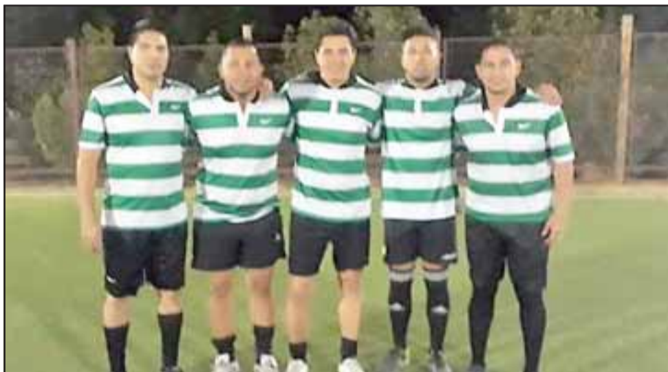
Los equipos de Ecuador (rayados) y Banco Estado jugaron la final del torneo de Fútbol 5 en el Club de Tenis de San Felipe.