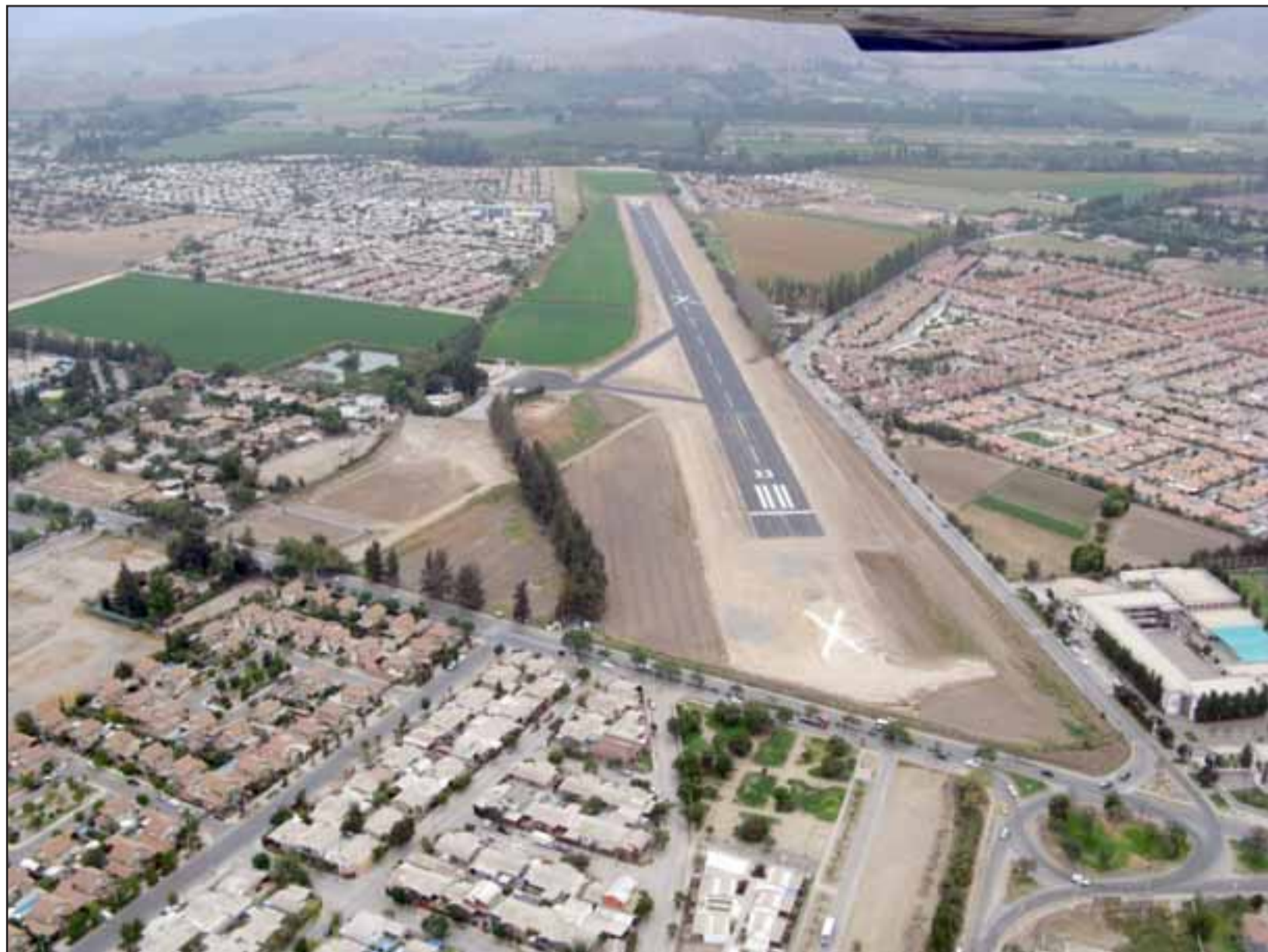
NADA MAL.- Así luce este aeródromo desde las alturas, bien demarcada la pista y menos polvo impidiendo la visibilidad.