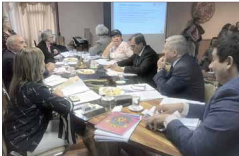
La presentación fue realizada por el equipo directivo de la Dirección de Educación municipal.

«Algunos tienen sello en áreas como inglés, artes, en la música o en la robótica y eso hoy día se ve en los distintos establecimientos municipales, donde los alumnos eligen qué quieren estudiar. Hoy conocimos lo que se ha mejorado y las evaluaciones que tienen los establecimientos, lo que esperamos seguir mejorando, por ello estamos trabajando, porque hasta el último día en que tengamos la educación