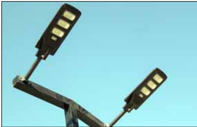
Son cuatro paneles como éstos los que fueron instalados y ya funcionan para beneficio de quienes usen este enlace vial.

- ¿Cómo pudieron los rotarios gestionar esta obra?