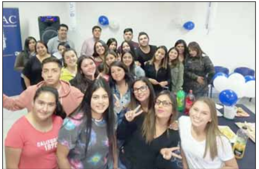
Con alegría los alumnos retomaron sus clases, en tanto los nuevos, con cierto nerviosismo, se incorporaron a esta casa de estudios superiores.