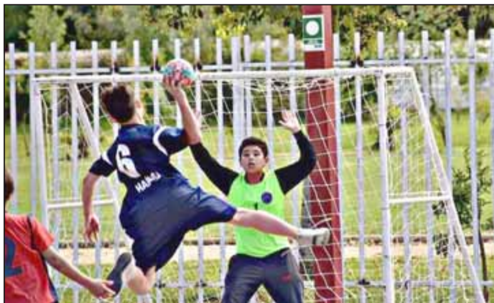
Este año 2019 la Escuela 21 de Mayo ya comienza a ejecutar los talleres deportivos para sus alumnos.

«Hoy en día requerimos que nuestros estudiantes y todas las personas que trabajamos en la comunidad educativa de la Escuela 21 de Mayo, tengan la posibilidad de ampliar la mirada