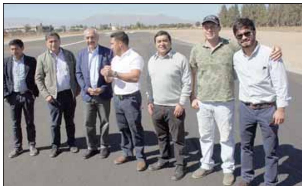
REVISIÓN FINAL.- Una comitiva de trabajo en terreno recorrió la pista de aterrizaje del Aeródromo Víctor Lafón de San Felipe, la que será reinaugurada el próximo 12 de abril.

Esta pista se hizo en conjunto con la Dirección de Aeropuertos del MOP, la cual consistió netamente en hacer una conservación de la pista de aterrizaje, lo que implica hacer un doble tratamiento en la pista completa más las calles de correaje, sumando además las zonas de plataformas. El material usado en esta millonaria obra fue comprado en una planta de áridos de