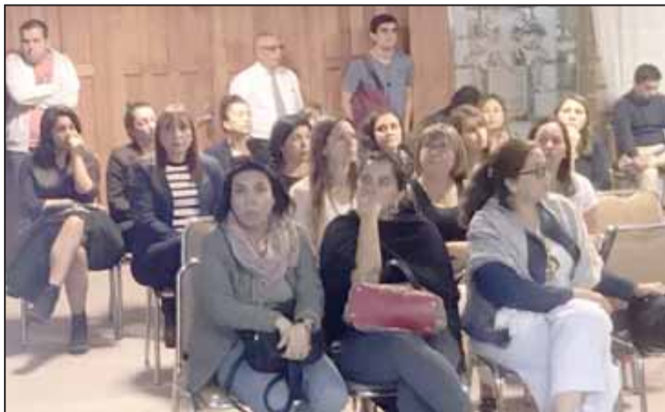
Los directores y profesionales de la Daem estuvieron presentes para aclarar dudas durante la presentación.

pública municipal, vamos a estar dispuestos a aportar, porque la educación es el pilar fundamental en el desarrollo de los pueblos», dijo el jefe comunal.