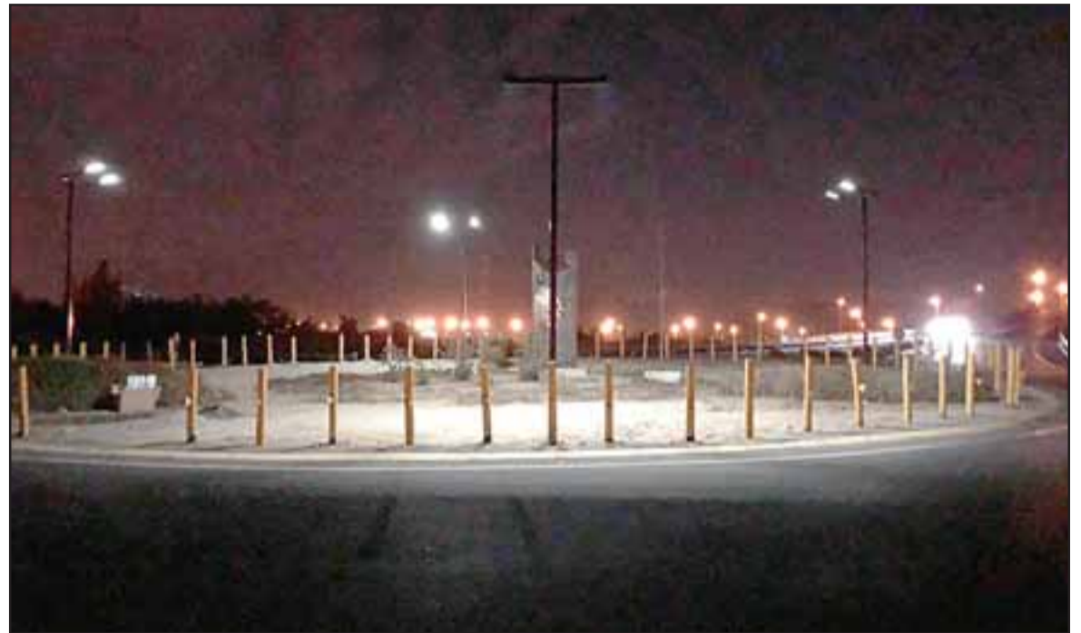
ROTONDA ILUMINADA.- Así luce la Rotonda Monasterio a partir de este lunes, no representa un gasto en electricidad, porque son a energía solar.

cientes a una señora de la zona. Luego de que entregaron esa obra han pasado seis años, ese sector ha estado muy oscuro, pues no se pudo concretar la iluminación porque no había quién energizar ese sector, la concesionaria le tiraba la pelota al MOP y viceversa, la Municipalidad tampoco podía llegar e instalar luminarias en ese sector pues no estaba autorizado», explicó Monasterio a nuestro medio.