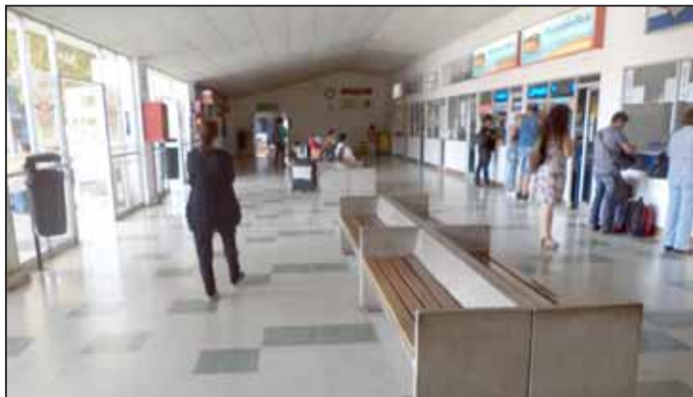
La problemática delincriminal que existe en el sector mantiene asustada a la gente aseguró el administrador del terminal rodoviario.

- Ingresó a un local que estaba cerrado, la conservadora de alimentos estaba afuera, él cortó el cordón eléctrico donde estaba enchufada y salió por la parte trasera de la feria, pasando por la parte baño de acá, y parece donde tenía mucho peso se devolvió y siguió para la parte de pasajes, en donde dos damas de la feria lo increparon y le quitaron la máquina, ante la cual el sujeto salió arrancando y según testigos salió hacia la