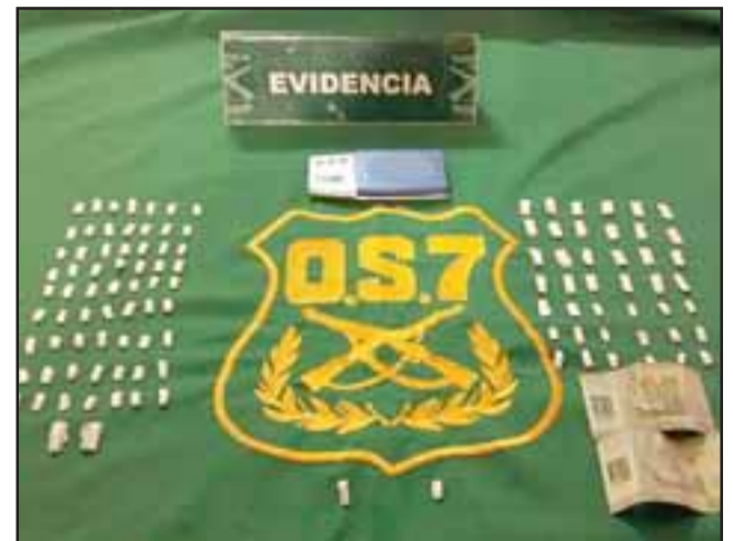
Personal del OS7 de Carabineros incautó papelillos y pasta base de cocaína a granel desde el domicilio del imputado en la población El Algarrobal de San Felipe. (Foto Archivo).