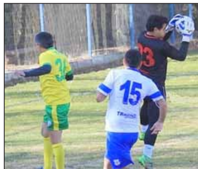
Solo 16 clubes sobreviven en el torneo estival Selim Amar Pozo.