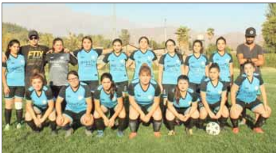
Equipo femenino del club Juventud El Tártaro de Putaendo.