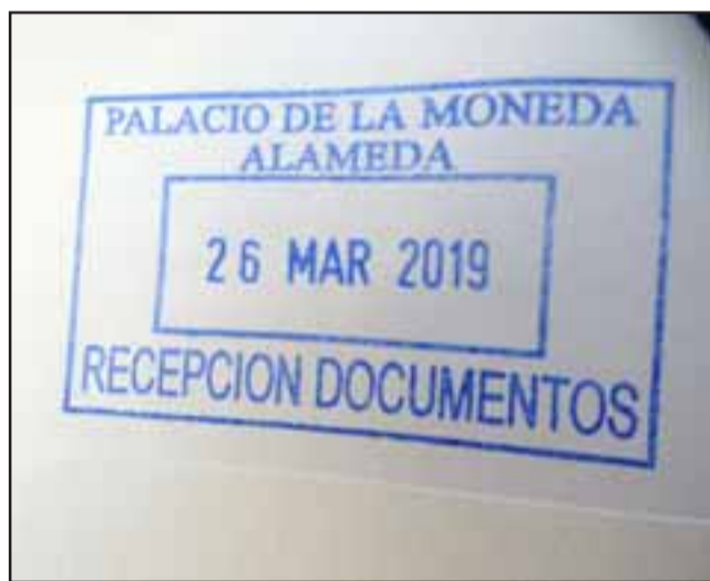
La carta con el timbre de la moneda como señal de haber sido recepcionada.