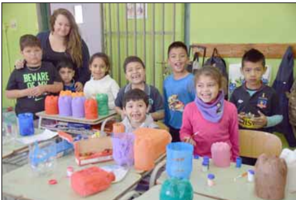
TALENTO ARTÍSTICO. - La confección de los maceteros y floreros se desarrolló en las salas de clases, estos pequeñitos pintaron cada uno de los recipientes.