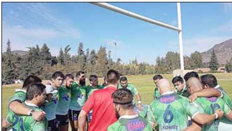
Los Halcones han mostrado por ahora un pobre rendimiento en el Apertura de Arusa.

ir a su oponente de mañana si quiere mantener en algo encendidas sus ya escasas opciones de avanzar a la postemporada, un objetivo que por ahora se ve muy lejano debido a que este torneo es de una sola rueda, por lo que el margen de error es igual a cero, y por lo visto por el momento Los Halcones ya han fallado mucho, tal como en la fecha pasada donde cayeron 31 a 42 frente a Maccabi.