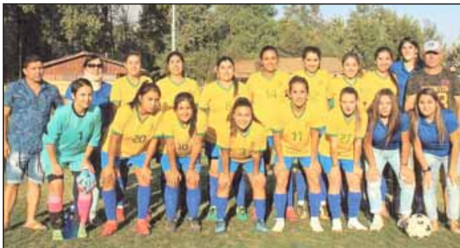
Conjunto de mujeres del Deportivo Brasil de Putaendo.