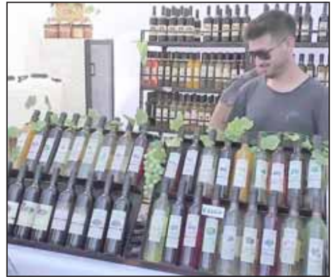
Como ya es tradición, el evento reunirá a numerosos viñateros que expondrán sus productos, a lo que se suman comidas típicas, artesanía y diversos números folclóricos.