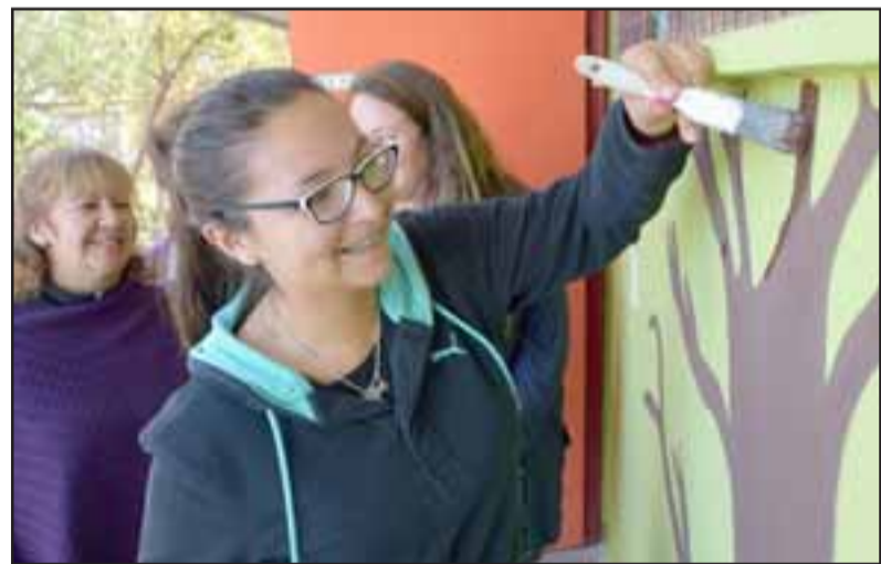
PROFE PINTORA. - Esta profesora también aportó con su creatividad pintando murales en las paredes de la Escuela San Rafael, sus colegas le animaron.