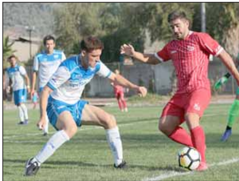
En la interna sanfelipeña esperan que el paso a segunda fase de la Copa Chile les sirva para mejorar en el torneo oficial.