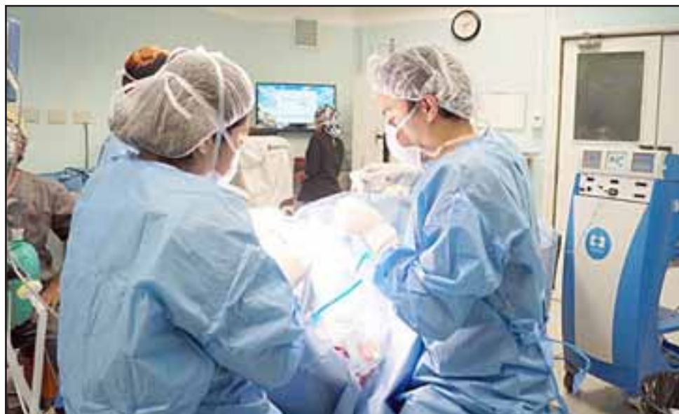
Un total de 31 médicos llegan al Valle de Aconcagua, parte de ellos son especialistas que ya han realizado su beca y que permanecerán seis años en el sistema.

La autoridad agregó que a lo largo de la próxima semana se realizará un completo programa de induc-