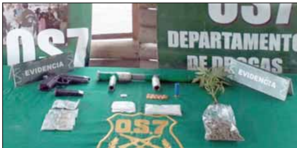
Personal del OS7 de Carabineros incautó las drogas y el armamento hechizo desde un domicilio de la Villa Puertas del Sol en la comuna de Llay Llay.

Asimismo, Fuentes Guerra fue condenado a la