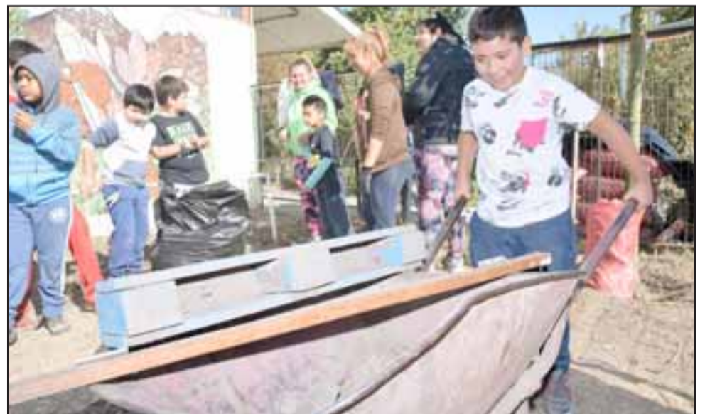
EL FORTACHÓN DE LA ESCUELA. - Este Pequeñín tomó la iniciativa y echó mano a la carretilla para ayudar durante la jornada.