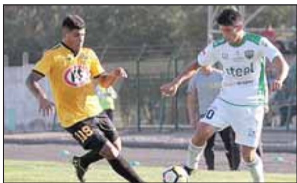
Los andinos partirán como visitantes en el torneo de Tercera A.