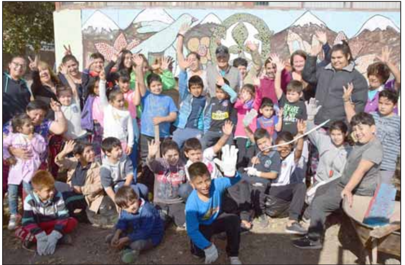
AMAN SU ESCUELA. - Aquí tenemos a parte de la gran familia de la Escuela San Rafael, ellos hicieron un gran operativo de limpieza y embellecimiento a su casa estudiantil.