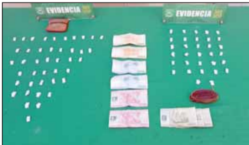
Personal de OS7 de Carabineros Aconcagua incautó desde el interior del domicilio del imputado, 76 papelinhas de pasta base de cocaína en la población René Schneider de Los Andes.