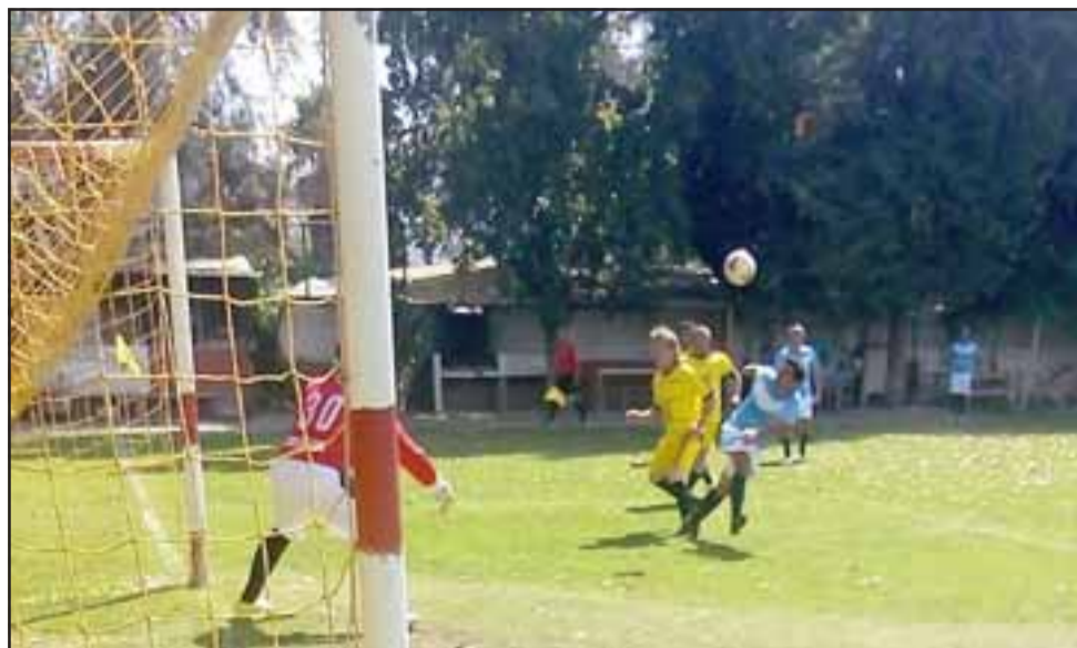
La competencia central en Parrasía ya está en su recta final.