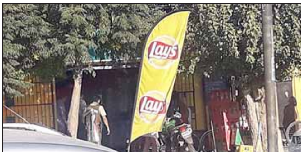
EN INVESTIGACIÓN.- Este menor de edad, asegura su abuela, fue detenido por haber sido señalado como autor de un robo, sólo porque usaba un gorro similar al que tenía el 'verdadero' asaltante.

- Yo quiero dejar en claro que mi nieto no es un delincuente, no es un ladrón, no es un asaltante y menos con cuchillo; es un joven como todo joven, él está estudiando porque quiere ser alguien mejor, además, él pertenece a familia uniformada, por eso me pregunto