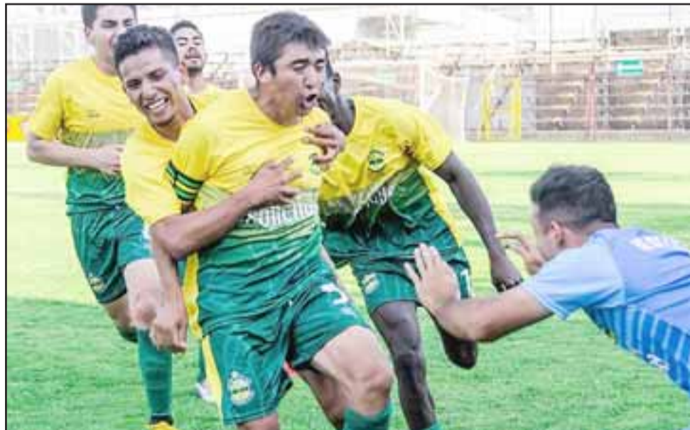
Unión Delicias es uno de los dos equipos que sacará la cara por el balompié aconca-güino en los cuartos de final de la Copa de Campeones. (Foto: Jorge Ampuero).

17:00 horas: Monjas (Valparaíso) – Unión Tocornal (Santa María)