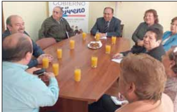
El gobernador Claudio Rodríguez destacó el convenio que realizan las empresas de la provincia para entregar una tarifa rebajada a los adultos mayores.

Consiste en un Pase que le permite viajar en la locomoción colectiva mayor, con una tarifa rebajada, según el destino de viaje y la línea de buses. La rebaja fluctúa entre 15% a 63%. El requisito es tener 60 años de edad, mujeres y varones. Cancelar $6.000 por el costo del pase. El período de inscripción comenzó el 11 de marzo y finalizará este mes. Las inscripciones se pueden realizar en la Gobernación San Felipe de Aconcagua. Hasta la fecha 1.500 adultos mayores han utilizado el pase para sus traslados.