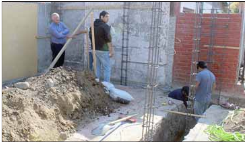
Las obras que son ejecutadas por la empresa JLS, demandan una inversión de 52 millones de pesos y consideran la demolición de la actual sede y la construcción de una nueva estructura.

«Como parte de nuestra política municipal y con el fin de poder satisfacer las necesidades de nuestros vecinos, se ha estado trabajando con la Secretaría Comunal de Planificación, en el mejoramiento y la construcción de nuevas sedes vecinales. A la fecha hemos logrado entregar espacios comunitarios adecuados en casi la totalidad de los sectores de Panquehue, y eso se puede reflejar en sectores como Lo Campo, La Pirca, Panquehue Centro y Palomar. Nos queda mucha tarea por realizar y es así que estamos trabajando en otros sectores de la comu-