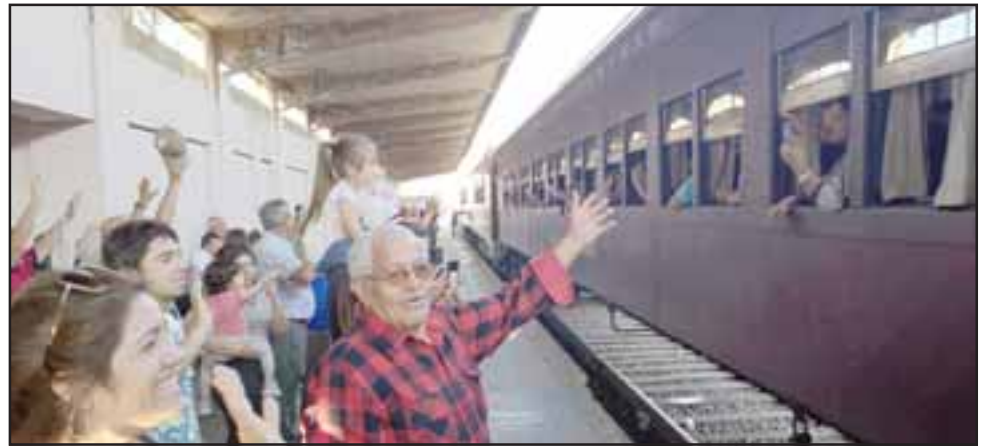
Cientos de llayllaínos dieron una gran bienvenida a cerca de 400 turistas que llegaron en tren al Valle del Aconcagua, tal como lo hacían hace más de 20 años.

«Sin duda un aniversario muy emotivo, celebrando los 144 de la comuna de Llay Llay con la llegada del tren a nuestra comuna. Esto permite que nuestros vecinos, especialmente los adultos mayores poder recordar y poder revivir esos tiempos de gloria y apogeo del movimiento ferroviario en nuestra comuna, que nuestros vecinos recuerdan con mucha