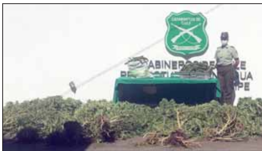
La Policía uniformada decomisó trece plantas de cannabis sativa en proceso de cultivo.

Las diligencias se efectuaron luego de una previa coordinación de la Policía uniformada y la Fiscalía de San Felipe, estableciéndose que en el domicilio se mantendría un cultivo ilegal de marihuana de grandes proporciones. Es por ello que desde el inmueble del imputado se decomisaron trece plantas de cannabis sativa en proceso de cultivo y ocho kilos 830 gramos de marihuana elaborada que sería