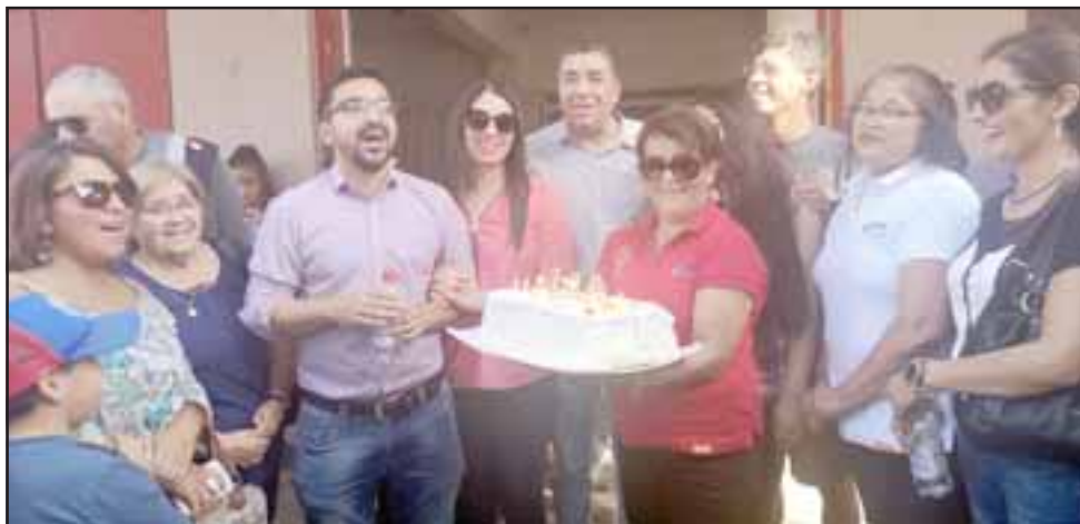
Autoridades y vecinos a la vez celebraron el 144° aniversario de su comuna.

A las 18:20, los pasajeros del tren abordaron la antigua máquina y se despidieron de esta jornada en el Valle del Aconcagua. Al igual que en su llegada, fueron cientos los que acompañaron a los carros hasta que dejaron el andén. Con mucha emoción, muchos pidieron que el tren vuelva a la comuna y así recuperar este medio de transporte.