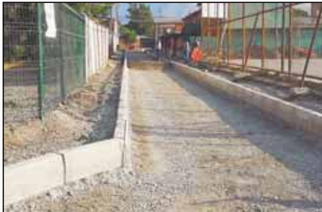
Las mejoras incluyen Calle Independencia I (entre Las Palmas e Independencia) e Independencia II (entre 21 de Mayo y Pasaje Ocoa), con una inversión cercana a los $81 millones.

tación de Población Las Palmas durante el año pasado. Estamos contentos porque hemos cambiando la cara al sector, que en invierno sufría mucho con inundaciones y que con esta inversión esperamos que sea parte del pasado». Las obras actualmente se encuentran en plena ejecución y se esperan que estén terminadas a fines del primer semestre de este año.