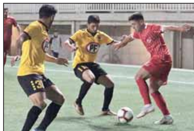
Pese a jugar mejor Unión San Felipe no pudo superar a San Luis en Quillota.