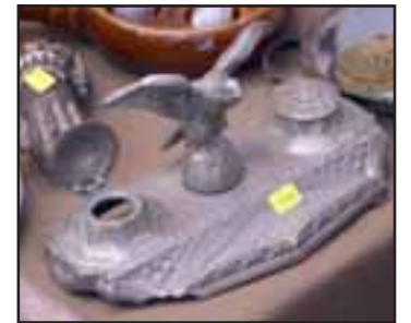
MUCHA TINTA. - Aquí tenemos este antiguo tintero de hierro fundido en perfecto estado, estas antigüedades se venden o permutan.