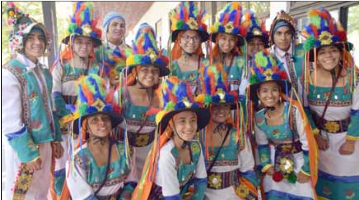
FOLKLORE DUAO. - Ellos son los jóvenes sanfelipeños que esta semana tendrán que ser los mejores del país en cuanto a danza y folklore del país.