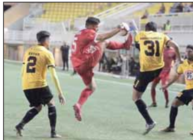
El estadio Lucio Fariña de Quillota fue escenario de un duelo de alta intensidad y fricción.

1-0, 31' Sebastián Parada (USF). 1-1, 86' Christian Muñoz (SL).