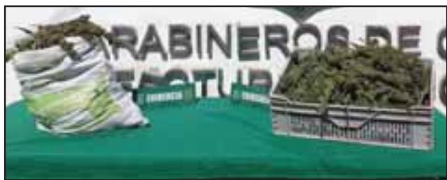
Un total de ocho kilos de marihuana elaborada fueron incautadas por el OS7 de Carabineros, desde un domicilio en el sector Quebrada Herrera de San Felipe.