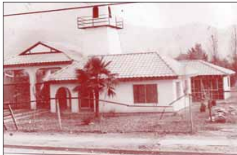
CUARTEL TERMINADO.- Así lucía este cuartel una vez terminado, una muestra fiel de que el trabajo en equipo, si se concentra en una meta definida, siempre será bien aprovechado.