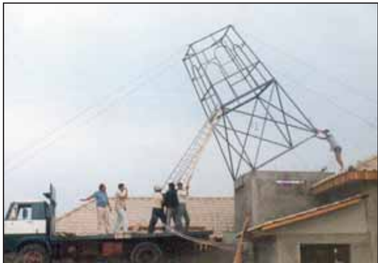
FOTO HISTÓRICA.- El torreón principal del cuartel cuando era instalada su armadura sobre el edificio.