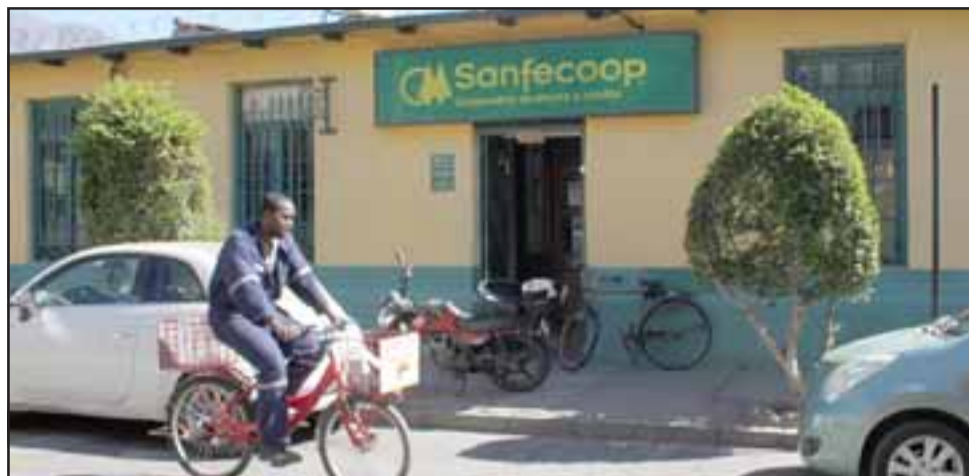
El próximo remate de una vivienda dejada en garantía por un crédito habría sido lo que llevó a un comerciante a presentarse en las oficinas de Sanfecoop, donde se reunió con la gerente y la encargada de cobranzas, momento en el que extrajo un revólver y habría amenazado a los funcionarios para luego retirarse.

¿cuál fue el motivo por el cual se había judicializado su caso, él tenía problemas de atraso con las cuotas o algo así?