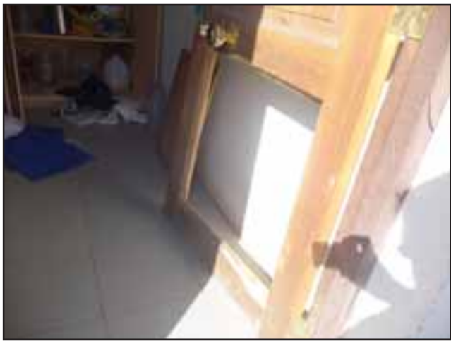
La puerta principal fue destruida por los antisociales, quienes ingresaron por este lugar para robar en la parroquia.