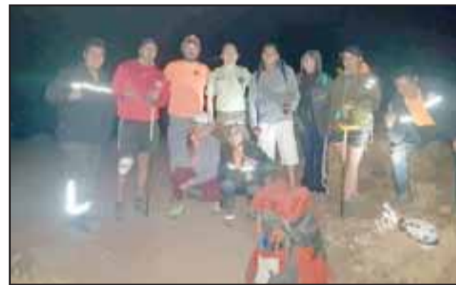
Los excursionistas regresaron a salvo gracias a la coordinación efectuada por Carabineros de San Esteban.