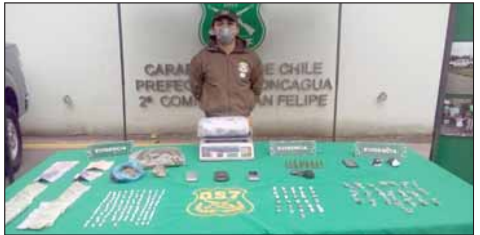
El procedimiento estuvo a cargo de los funcionarios de OS7 de Carabineros Aconcagua, quienes lograron decomisar las drogas y detener a los cuatro integrantes de esta banda delictual.

Asimismo Carabineros efectuó un allanamiento al interior de uno de estos departamentos, encontrando al cuarto imputado identi-