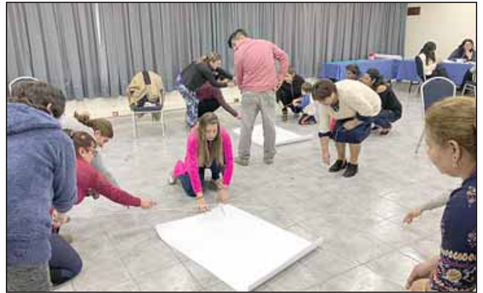
Con el apoyo de un psicólogo laboral se realizan diversas actividades para potenciar habilidades como la comunicación, el liderazgo, el trabajo en equipo, la confianza en sí mismo y la autoestima.

«El programa está enfocado especialmente en apoyar a las familias y en potenciar ciertas habilidades en el ámbito laboral como familiar, y asimismo se les per-