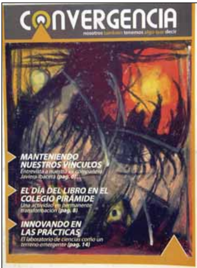
NACE CONVERGENCIA. - Esta es la portada de la Revista Convergencia , que será lanzada oficialmente mañana viernes en el Colegio Pirámide.