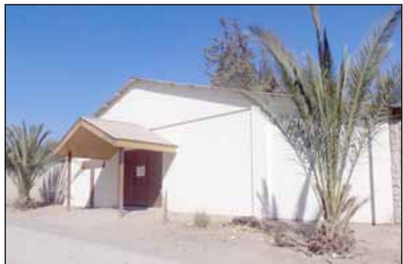
El frontis de la iglesia Cristo Resucitado ubicada en la intersección de las Calles Coronel Santiago Amengual con Justo Estay.

En la parroquia trabajan cinco personas que son muy unidas y preocupadas de su comunidad.