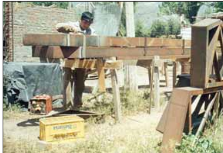
UNA GESTA EJEMPLAR.- Con fierros donados por empresas o instituciones de nuestra comuna se construyó los cimientos de este cuartel.