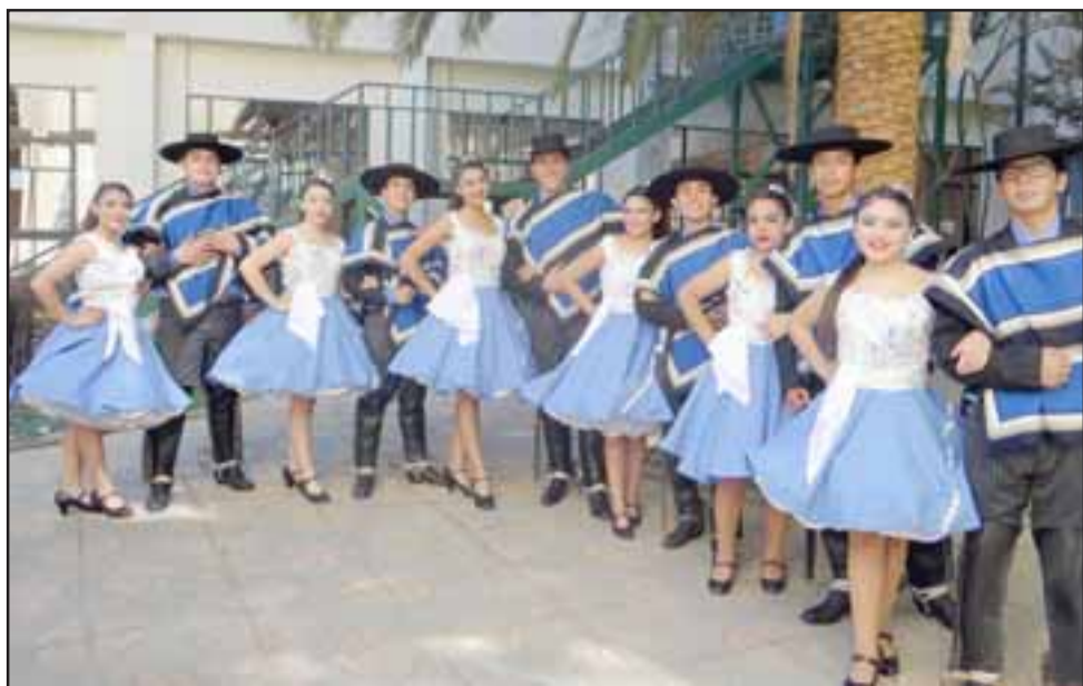
SUERTE CHIQUILLOS.- Aquí vemos la flamante comitiva de Pasión Industrialina, que nos representa en Duao 2010 SNA Educa.