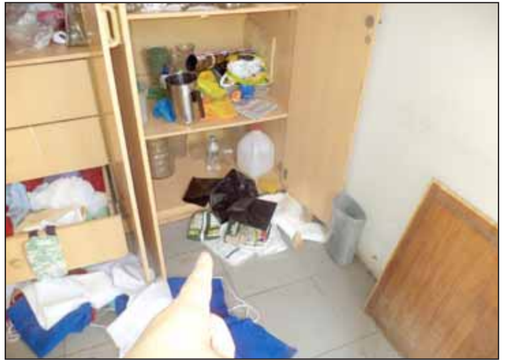
Gran desorden dejaron luego de efectuar el robo, los dos delincuentes que fueron vistos cuando escapaban saltando el cierre perimetral del templo.

Dice que ahora tendrán que ayudarlos desde la parroquia Andacollo para este fin de semana: «El daño no es sólo material, yo creo que es un daño que embarga a las personas, porque son gente de comunidades sencillas que le ha costado mucho tener, además que no es primera vez que les roban,