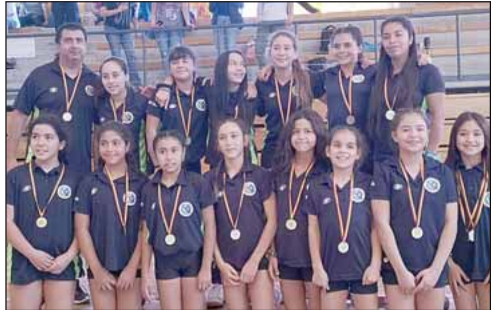
IMPARABLES.- Ellas son las aguerridas voleibolistas del San Felipe Vóley, nuevamente Campeonas del Clasificatorio Liname.