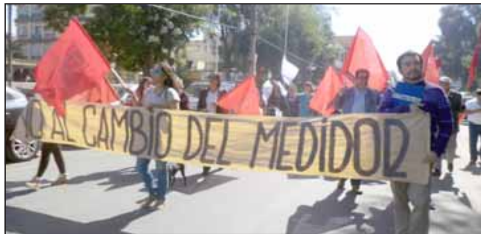
Carteles de No al cambio de medidor también presentes en la marcha.