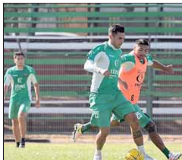
El sábado será el estreno como local de Trasandino en el torneo 2019 de la Tercera A.