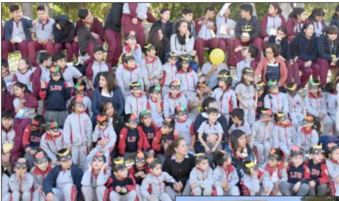
MASIVO CARNAVAL.- Más de 800 pequeñitos de todas las escuelas y jardines municipalizados de Santa María se dieron cita en la Plaza de Armas para disfrutar de la mejor ensalada musical con Los Frutantes.

por el 2% de Cultura del FNDR del Gobierno Regional de Valparaíso y que consta de varias partes o fases, entre estas el tema principal tiene que ver con la vida saludable, todo esto se desarrolla en conjunto con el programa Promoción de Salud, de Santa María, el cual se coordinó en esta oportunidad con el Centro de Padres y Apoderados de esta escuela y las demás casas estudiantiles de nuestra comuna para entregar tips de educación del tema Vida Saludable, por eso durante esta semana tuvimos una masiva presentación de Los Frutantes, en el marco también del Día Nacional de la Educación Rural por el nacimiento de Gabriela Mistral, en este caso el Grupo Frutantes es famoso por hacer adaptaciones musicales de temas conocidos, le cambian la letra y le ponen temas sobre la vida saludable, recordemos que estos artistas la semana anterior estuvieron presentándose