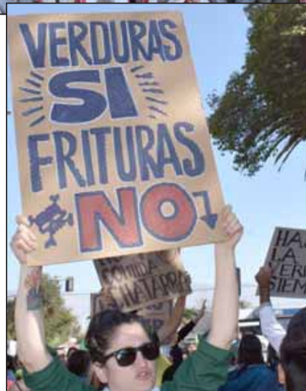
NO MÁS COMIDA CHATARRA.- Artistas, apoderados, estudiantes y profesores presentes participaron todos enfocados en transmitir un claro rechazo a la 'comida chatarra'.