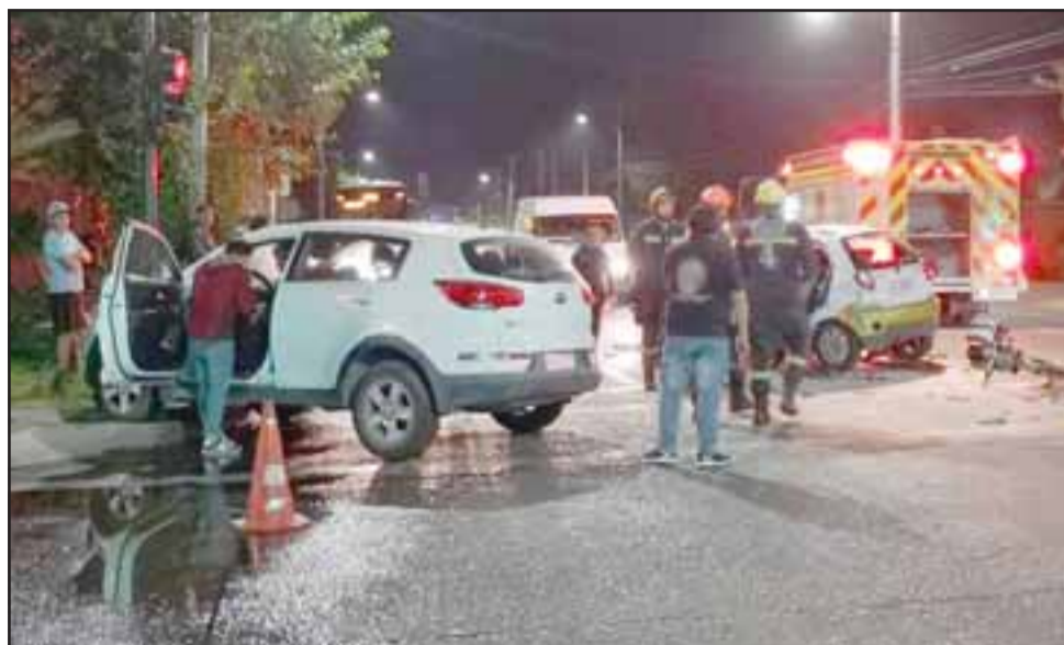
Personal de Carabineros, Bomberos y del SAMU se hicieron presente en el lugar de la emergencia registrada a eso de las 20 horas de este miércoles.

noche de este miércoles, a eso de las 20,15 horas, uno de los automovilistas que