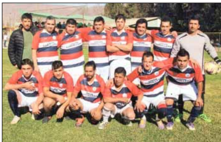
Oncena más experimentada del Unión Cordillera de Putaendo.