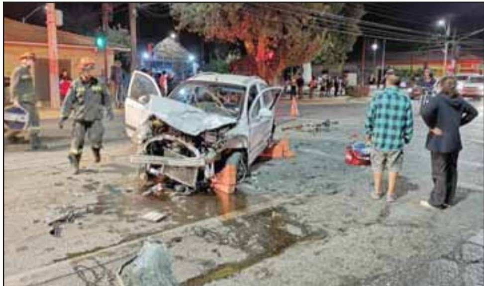
Los daños al vehículo revelan la violencia del impacto que habría tenido lugar aparentemente por una descoordinación de los semáforos, según denunciaron diversas personas a través de RRSS.

circulaba por calle Tacna Norte habría impactado al segundo vehículo que se dirigía por avenida Maipú, produciéndose la violenta colisión.