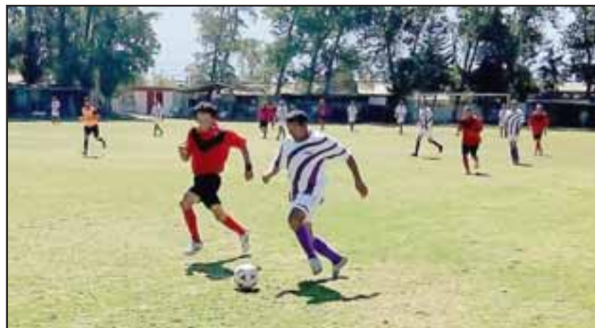
Resto del Mundo fue el equipo que menos sumó en el Clausura de la Liga Vecinal.