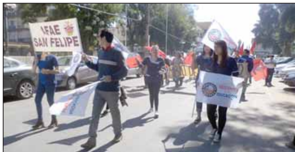
Asistentes de la educación también presentes en la marcha.