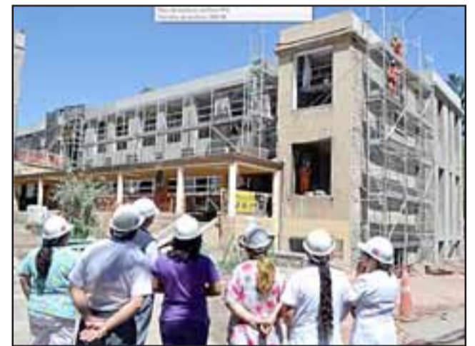
La agresión tuvo lugar al interior de las obras de mejoramiento del Hospital Psiquiátrico de Putaendo, donde un trabajador disconforme con su sueldo agredió con un cincel a un jefe de terreno.