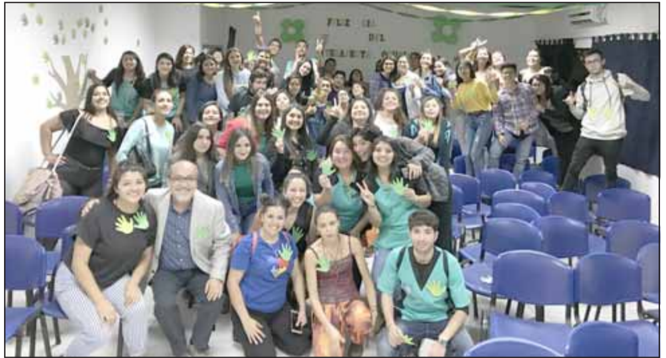
Estudiantes de diferentes generaciones de Terapia Ocupacional junto a sus docentes durante la celebración.

Terapia ocupacional no es una profesión nueva, desde el año 1963 se dicta en nuestro país, por su enfoque y forma de abordar al usuario en su integralidad, la hace una profesión de pro-