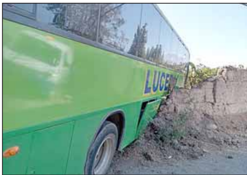
Este autobús habría tratado de esquivar un tractor que realizaba labores de limpieza, quedando incrustado en el muro.

El Comisario Alvear dijo que las causas del accidente, no obstante por los dichos del chofer del bus, el tractor habría estado en la ruta, «pero es algo que aún se debe determinar conforme a peritajes y entrevistas con testigos». Asimismo, ratificó que el bus no llevaba pasajeros, por lo que no hubo más personas lesionadas.