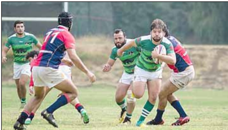
Este fin de semana llegará a su fin la fase regular del Apertura de Arusa.