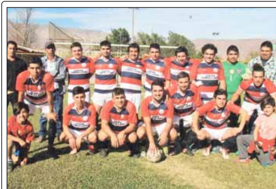
Serie Segunda del club Unión Cordillera.