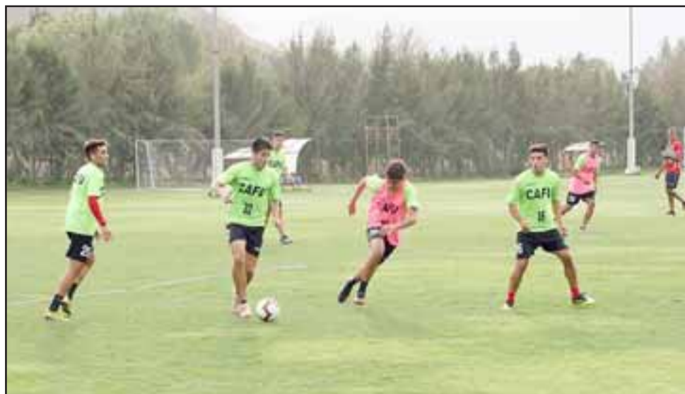
El equipo sanfelipeño está obligado a vencer en el Municipal a Melipilla.

Tabla de Posiciones Lugar Ptos. Santiago Wanderers 15