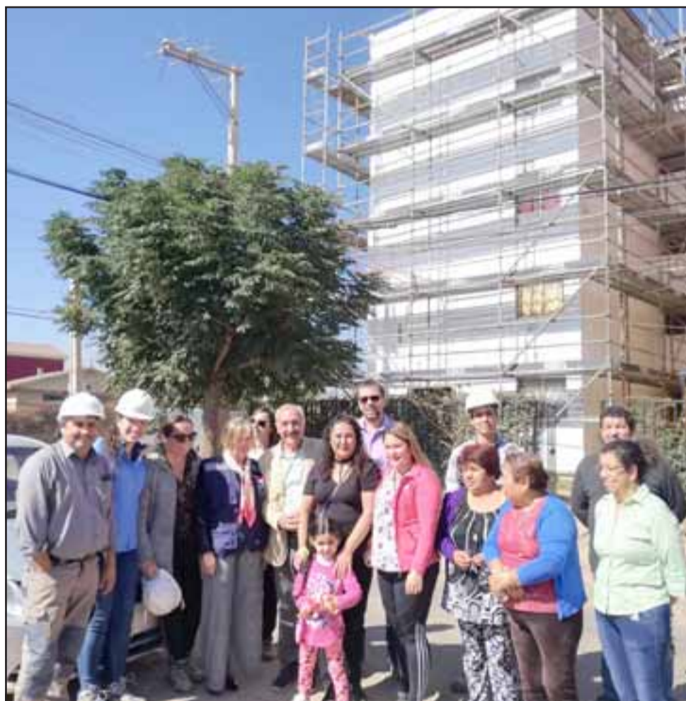
Autoridades municipales y del Serviu visitaron las obras y se reunieron con los vecinos para conocer los detalles de los trabajos efectuados a la fecha.