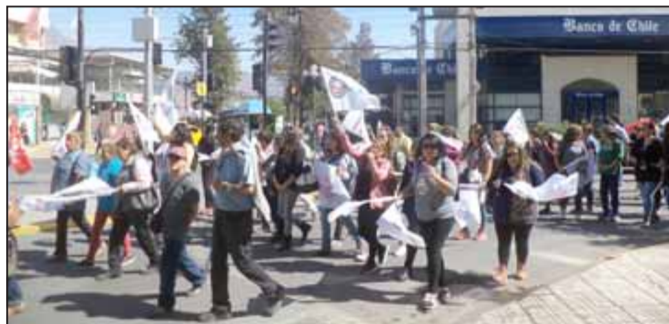
Tras reunirse en el odeón los manifestantes dieron una vuelta alrededor de la plaza de armas para llegar a la plaza cívica donde culminaron con discursos y la participación de un artista local.