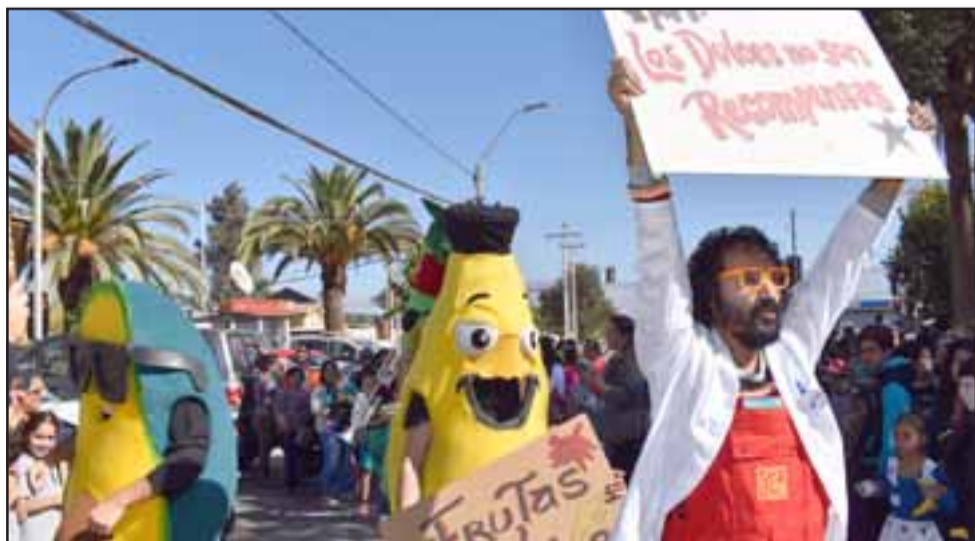
LAS FRUTAS AL PODER.- Los Frutantes se unieron a las marchas en el pleno centro de Santa María, apoderados, estudiantes y profesores también apoyaron la actividad.