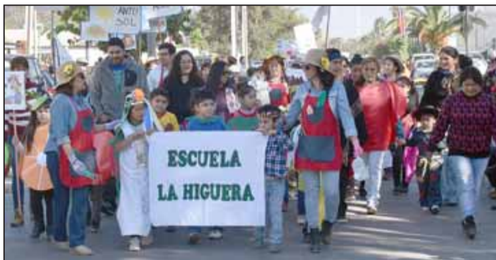
FUERZAS VIVAS.- Comunidades educativas de todos los establecimientos de la comuna marcharon por la ciudad con sus niños también.