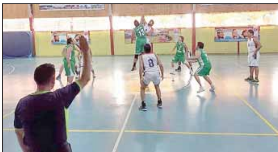
Básquetbol al por mayor habrá esta temporada en los cestos aconcaquiños.