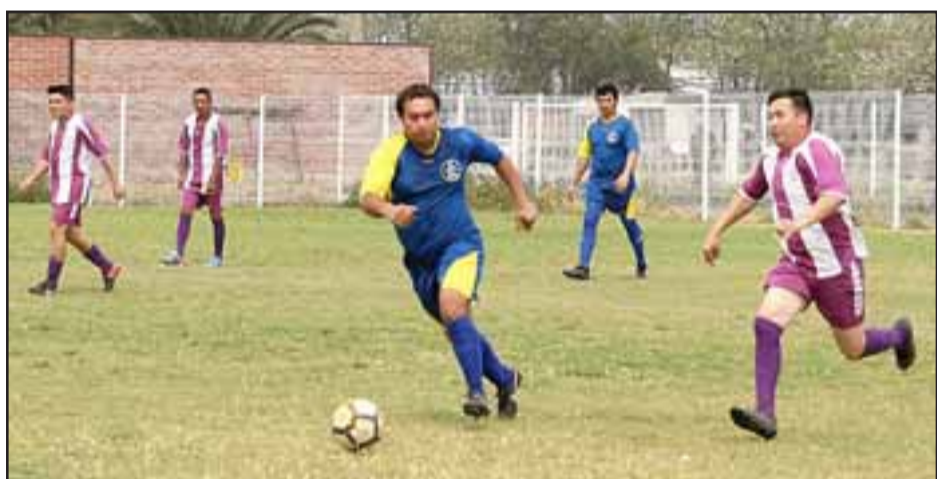
En tres semanas más comenzará el torneo de este año de la Asociación de Fútbol Amateur de San Felipe.

trabajos de resiembra a los que próximamente se someterá la carpeta de pasto natural del coloso de la Avenida Maipú. «Ya está planificado, hace más de dos semanas se hizo ese diseño; venir a resembrar en pleno campeonato no es algo positivo. Manejamos dos opciones para jugar como locales y una de ellas podría ser el estadio de Quillota donde hemos entrenado en algunas ocasiones», finalizó.