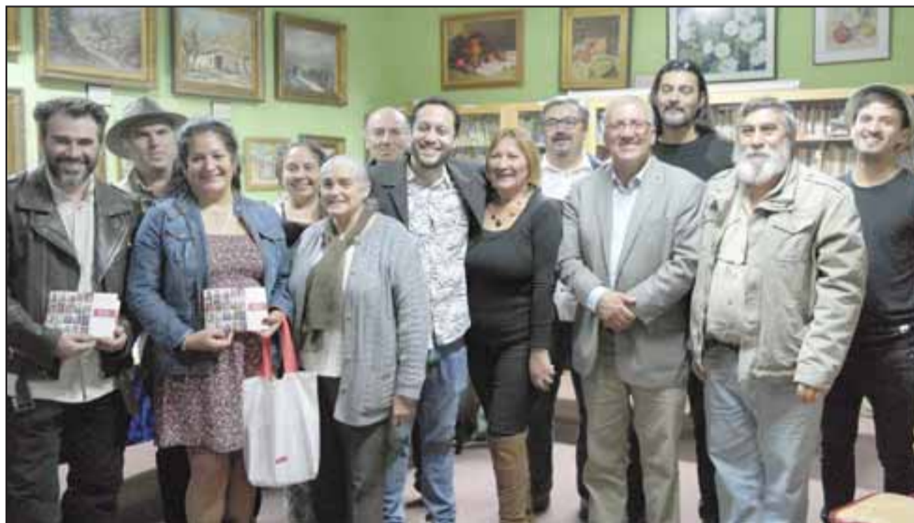
TRABAJO HISTÓRICO.- Todos los presentes muestran orgullosos este trabajo impreso a las cámaras de Diario El Trabajo.