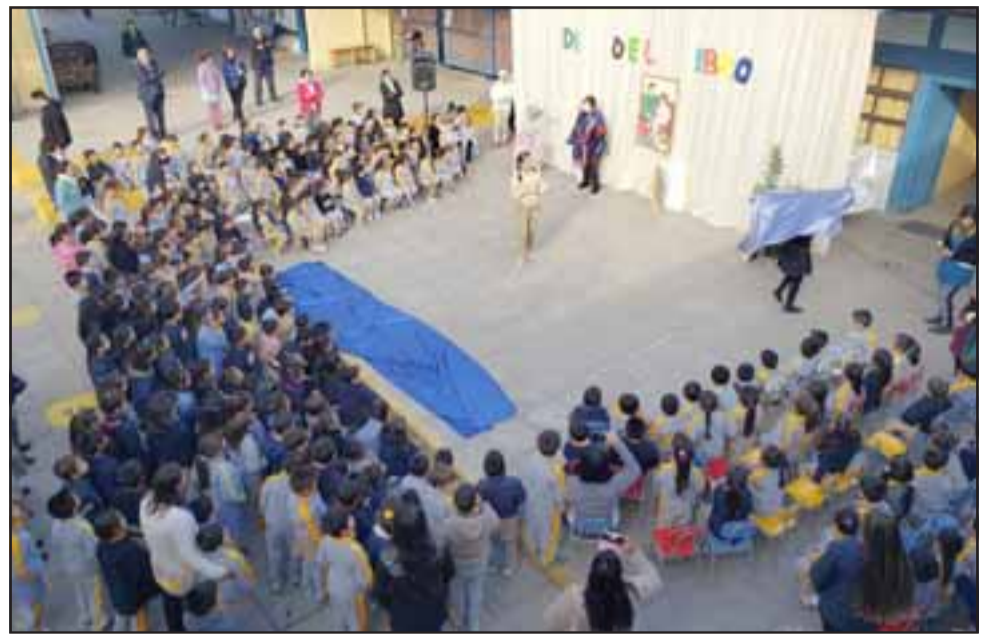
La comunidad educativa del Liceo Cordillera celebró con distintas actividades el Día del Libro.

celebración del Día del Libro, los alumnos disfrutaron con cuenta cuentos, la personificación de personajes de cuentos y obras de teatro y un café literario, donde participó toda la comunidad educativa.