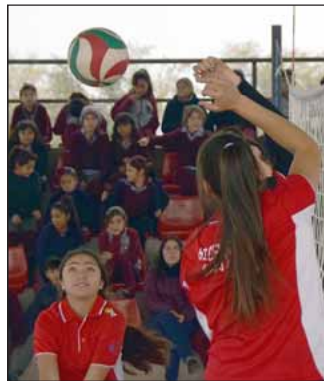
EN PLENA ACCIÓN.- Durante una hora completa las chicas desarrollaron su Clínica deportiva para los estudiantes de la escuela de Las Cadenas.