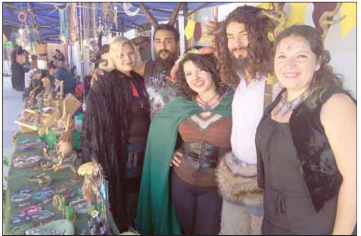
NO PUEDES FALTAR. - Grupos artísticos del Valle de Aconcagua se darán cita este sábado en el Centro Cultural y Museo Presidente Pedro Aguirre Cerda, en Calle Larga.

La actividad es apta para todo público y es completamente gra-