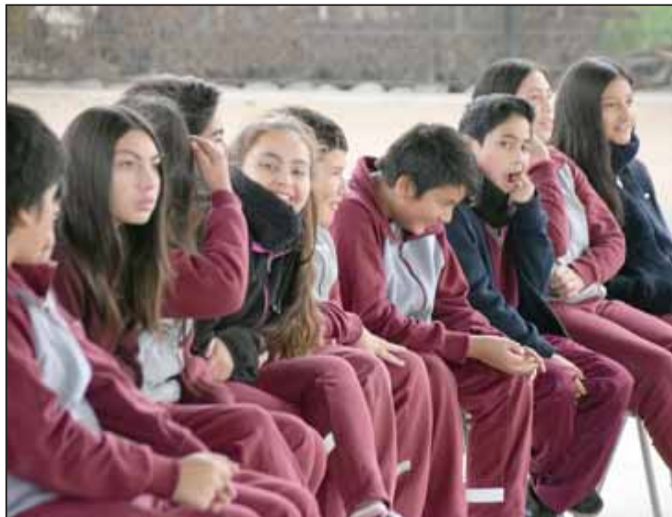
INICIA LA AVENTURA.- Estos niños de la Escuela Guillermo Bañados estaban fascinados viendo a las seleccionadas del Cordillera mostrando su poderío en el Vóley que practican.

ración oficial del campeonato será el sábado a las 11:30 horas en el Gimnasio Samuel Tapia Guerrero, Víctor Lafón esquina Tocornal», dijo Chávez a Diario El Trabajo . Roberto González Short