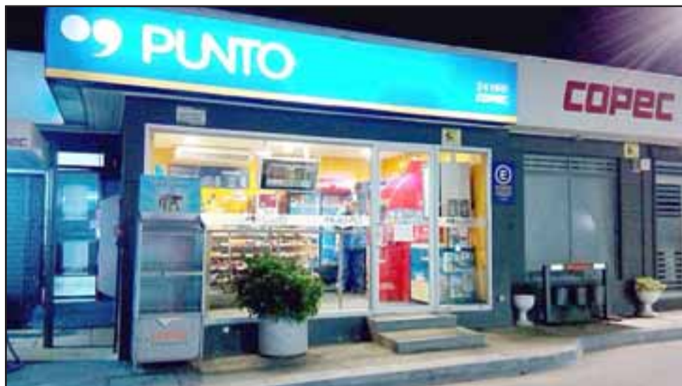
Los delitos ocurrieron en el Punto Copec ubicado en calle Irarrázabal en la comuna de Santa María.

En lo que respecta al segundo caso y por el cual Orellana sí fue declarado culpable, ya que el Tribunal generó convicción de la participación del imputado, se remonta al día 15 de julio de 2017, a eso de las 23:30 horas, cuando Ore-