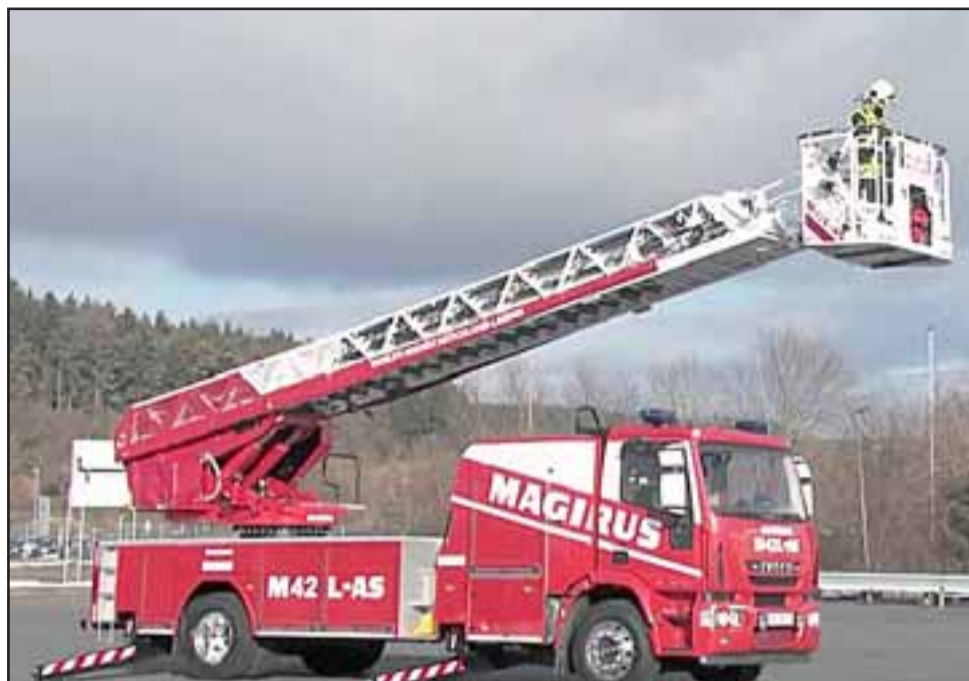
Un carro similar al de la foto necesita con urgencia Bomberos de San Felipe.

Dicho lo anterior, agregó que «nosotros hace ya varios años, en el proceso de renovación de carros regionales, nosotros pusimos este carro dentro de los requerimientos, junto a otras unidades que deben ser renovadas por falta de repuestos, etc., pero este proyecto ha dormido desgraciadamente bajo el gobierno anterior, bajo la administración del Intendente Aldoney, donde la verdad fueron puras promesas y nunca se concretó absolutamente nada, bajo este gobierno, bajo una situación que dice relación que hay una deuda bastante grande de proyectos que fueron aprobados y que no tenían financiamiento en la administración anterior, y eso nos ha tenido rechazado el proceso de compras. Ahora la compra es de 72 carros a nivel de toda la región, no es solamente el Cuerpo de Bomberos de San Felipe, de manera que