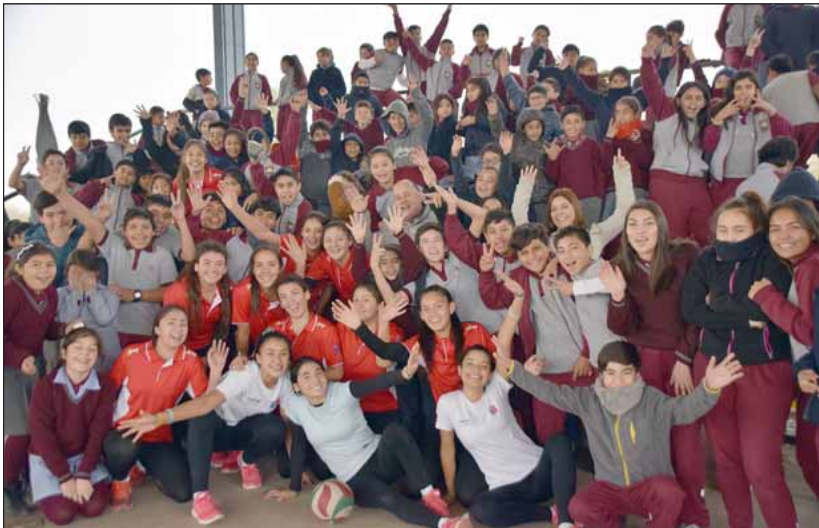
LOCURA POR EL VÓLEY.- Aquí vemos a las chicas voleibolistas del Liceo Cordillera, posando con los niños de la Escuela Guillermo Bañados para las cámaras de Diario El Trabajo .

«Esta es una gran oportunidad para que nuestros estudiantes aquí en Las Ca-