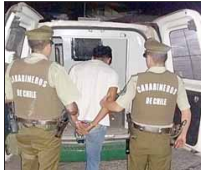
El imputado fue detenido por Carabineros luego de ser retenido por la víctima dentro de su inmueble en avenida Diego de Almagro de San Felipe.

Tribunal Oral en Lo Penal de San Felipe condenó este delito imponiendo una pena privativa de libertad.