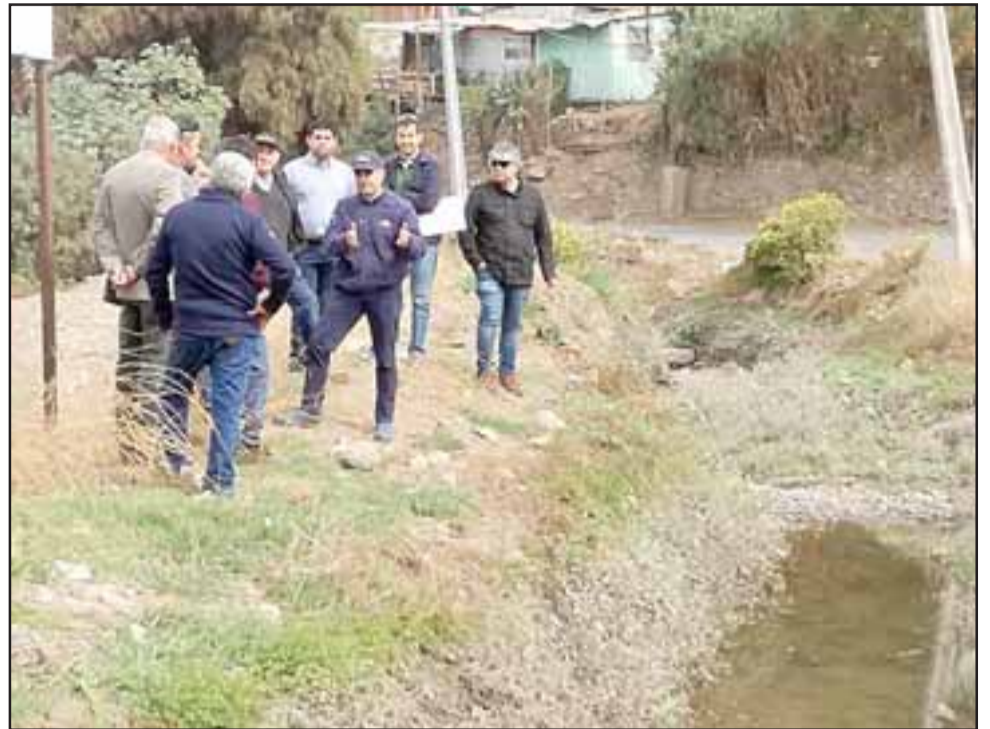
El revestimiento de un kilómetro de canal vendrá a colaborar en evitar la pérdida de agua por infiltración.

Los canales Arriba de Catemu y Debajo de Catemu, captan sus aguas de la segunda sección del Río Aconcagua, regando más de 2.300 hectáreas distribuidas en un total de 436 usuarios. Estas asociaciones fueron beneficiadas a través del concurso 18-2018 Obras Civiles Centro II.