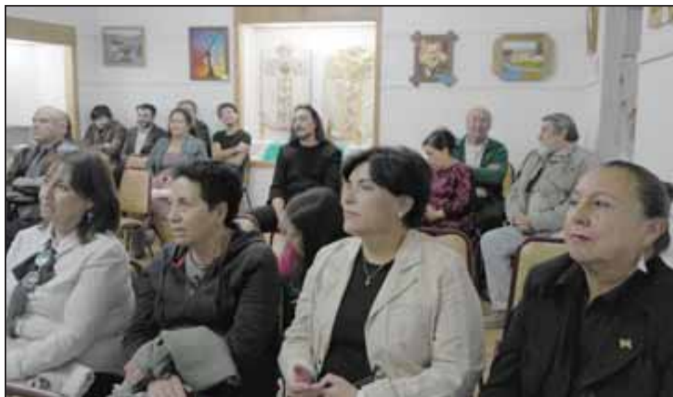
MEMORIA Y RESPETO.- Vecinos, autoridades y cultores putaendinos asistieron a esta cita con la historia de sus más queridos artistas ausentes.

La ejecución se realizó durante el primer semestre del 2019, e incluyó varias fases de desarrollo. «En la primera fase se observó el registro de artistas en las bases de datos de la comuna, para luego seleccionar los artistas invitados a la convocatoria. Se puso el acento en las artes visuales, musicales y literarias, que se desarrollan en Putaendo. La producción del material se realizó posteriormente, en base a entrevistas con los artistas presentes y análisis de registros bibliográficos, en el caso de los fallecidos. Fi-