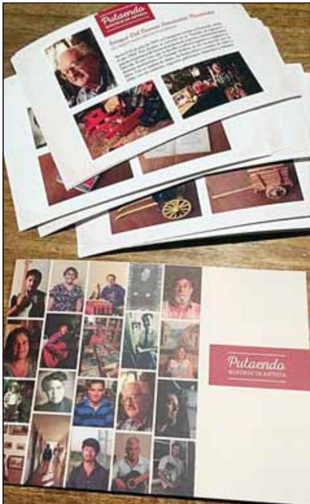
MEMORIA VIVA.- Estas son algunas de las páginas ya en circulación, para mostrar a los primeros 15 artistas putaendinos fallecidos, y cinco que aún viven que se exponen en esta vitrina impresa.