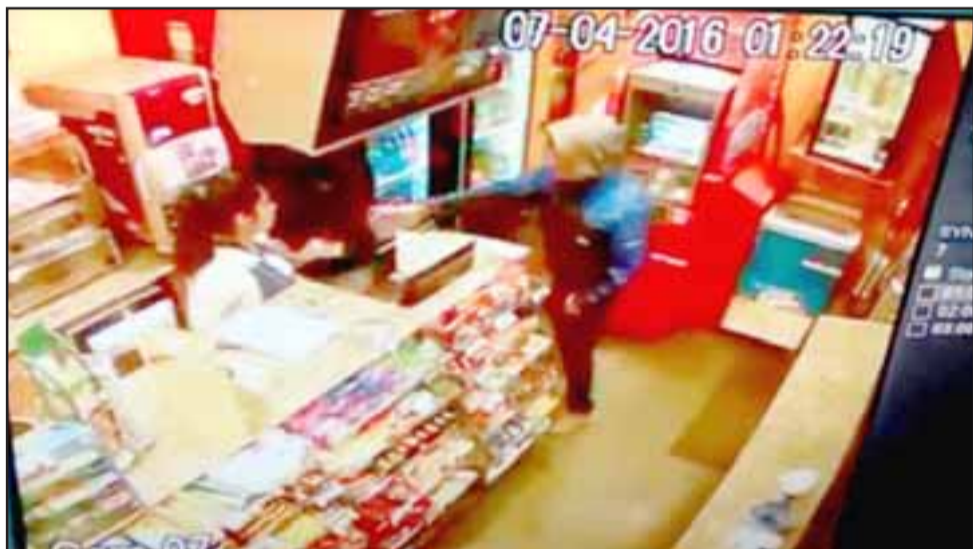
La cámara de vigilancia del recinto registró esta imagen del hecho ocurrido el año 2016, del cual el imputado fue absuelto por el tribunal al no quedar convencido con las pruebas mostradas.