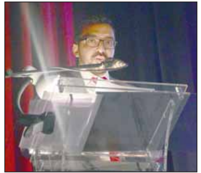
El alcalde Edgardo González dio cuenta de los proyectos y obras que se han realizado el último año en Llay Llay.

«Estamos muy contentos por esta cuenta pública. Siento que estamos transformando a la comuna de Llay Llay con proyectos por 10 mil millones de pesos en