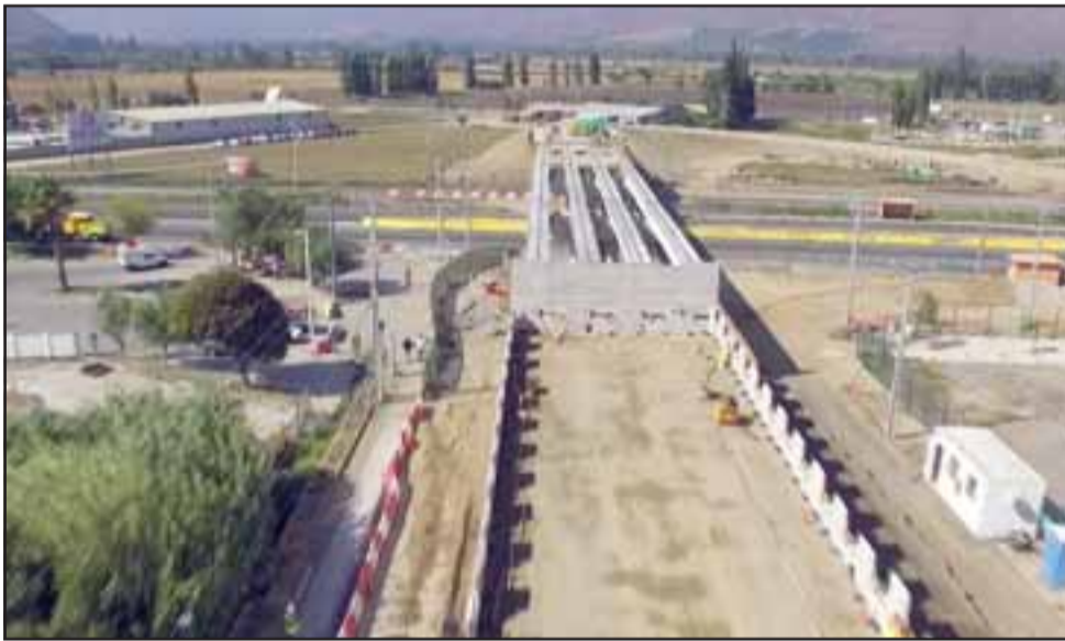
El enlace O'Higgins (en la foto) es uno de los tantos proyectos emblemáticos para la comunidad, junto a la subida al cementerio municipal y los futuros parques urbanos Borde Estero y Escorial Los Loros.

autoridad local, estos logros no se hubiesen conseguido sin el apoyo de varios estamentos: «Quiero agradecer a nuestros equipos municipales, al Consejo Regional, a nuestros concejales, porque sentimos que estamos haciendo una gran tarea y estamos buscando seguir transformando realidades, mejorando así la calidad de vida de los vecinos y vecinas de la comuna», sentenció.