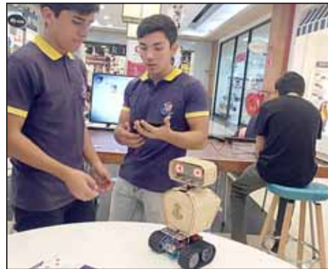
Los talleres se desarrollaron en 6 módulos, desde un nivel básico para los más pequeños, hasta uno más avanzado con programación.

El Liceo América sólo tiene buenas noticias, ya que para el segundo semestre del presente año se espera comience a funcionar