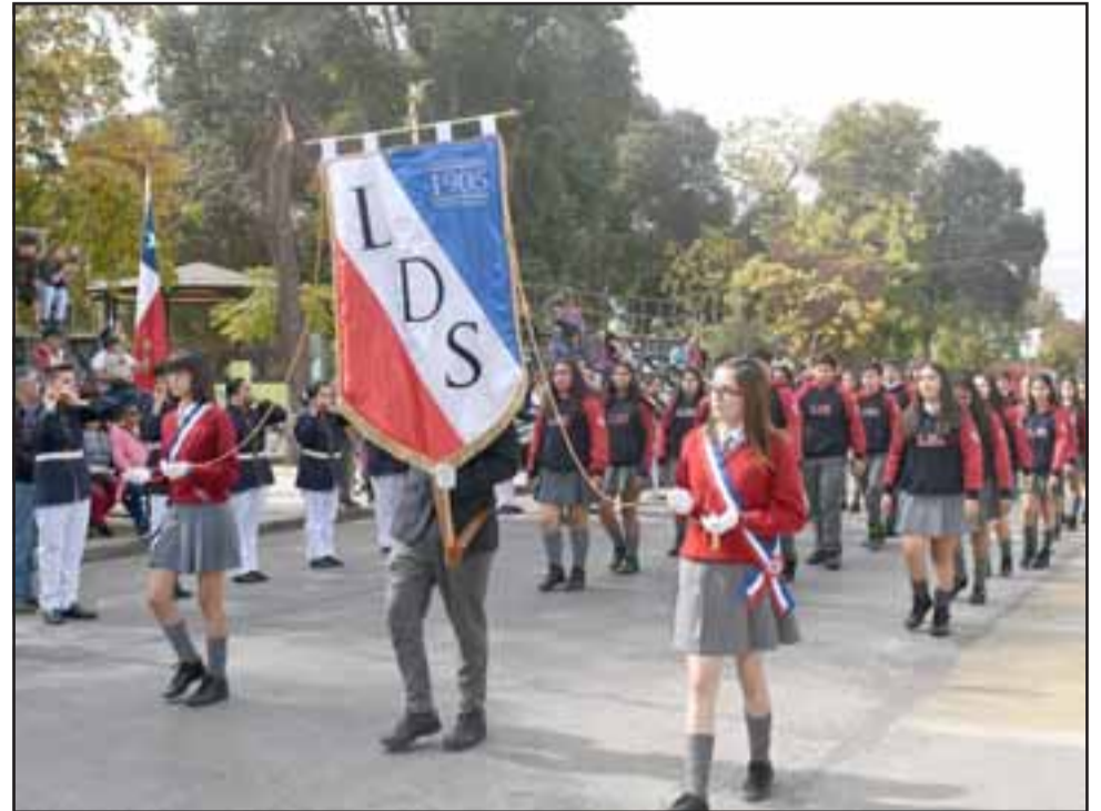
La comunidad educativa rindió Homenaje a Carabineros de Santa María en sus 92 años de vida institucional.

Destacada fue la participación de la banda de guerra de la Escuela Guillermo Bañados Onorato, quienes tuvieron la responsabilidad de encajonar el desfile; asimismo la puesta en escena