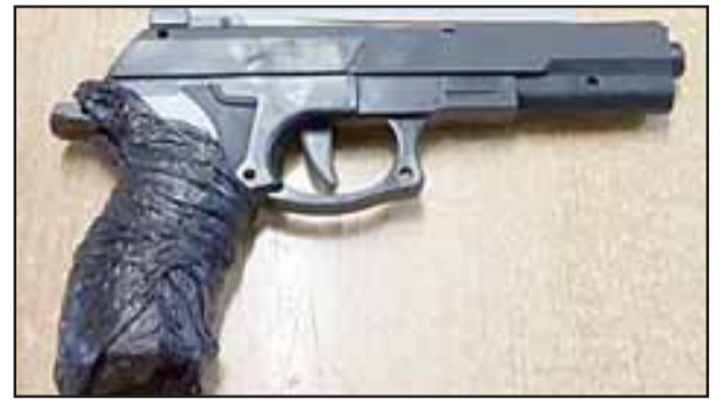
Carabineros incautó esta pistola plástica a balines utilizada para cometer el delito en la comuna de Santa María.