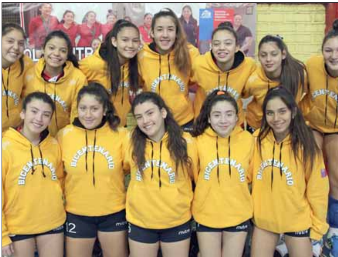
LAS MEJORES DEL PAÍS. - Aquí están nuestras flamantes campeonas nacionales de vóley femenino U16, quienes hoy se juegan en Valparaíso, la clasificación a los Juegos de Integración Andina entre Chile y Argentina.