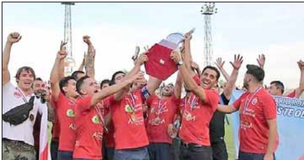
Jugadores de la serie de honor de Almendral Alto levantan la imponente copa del Afava 2019.