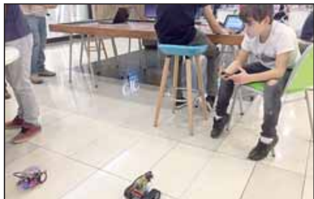
Tras armar los robots los menores pueden jugar con ellos y operarlos incluso desde sus celulares.

un Centro de Innovación, versión de la empresa minera gracias a la millonaria in- ra en la zona.