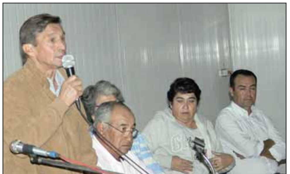
LAS CUENTAS.- El directorio vigente dio sus cuentas, explicó las proyecciones 2019, y contestó las inquietudes de sus socios.