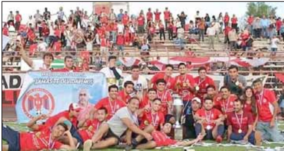
Menos problemas de los esperados tuvo el club Almendral Alto para consagrarse campeón del torneo Afava.

El club Almendral Alto se coronó campeón del torneo Afava 2019, al barrer en la final disputada en el coloso de la Avenida Maipú, al Ulises Vera de la Asociación de Fútbol Amateur de San Felipe.