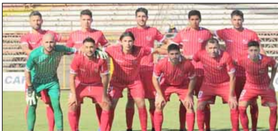
El cuadro sanfelipeño buscará su segundo triunfo en línea en el Municipal.