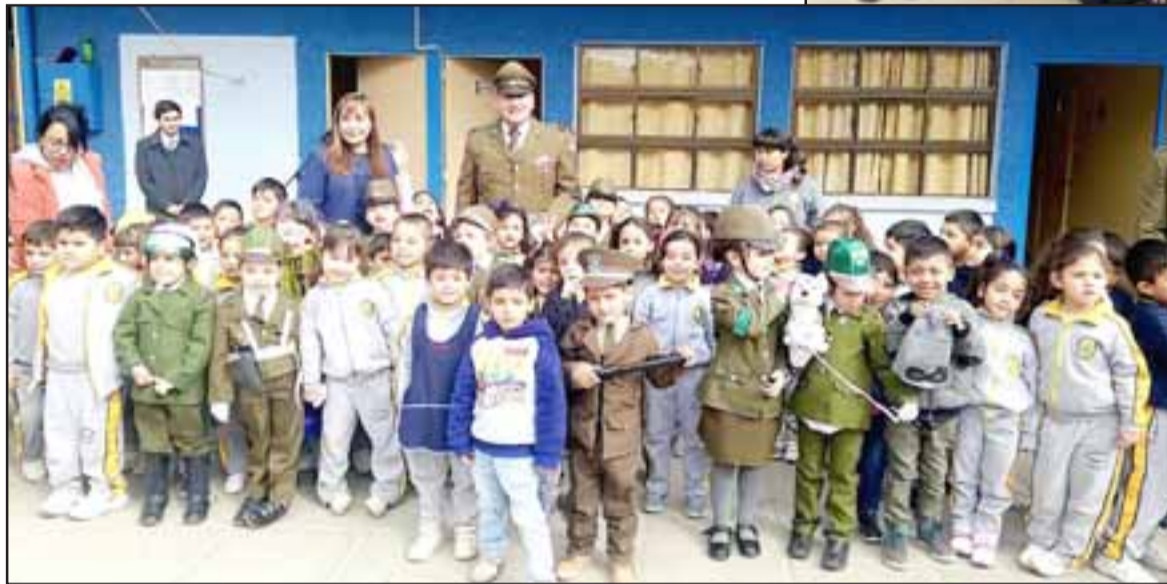
Niños y niñas vistieron el verde uniforme para rendir un homenaje a Carabineros en el marco de su 92° Aniversario institucional.