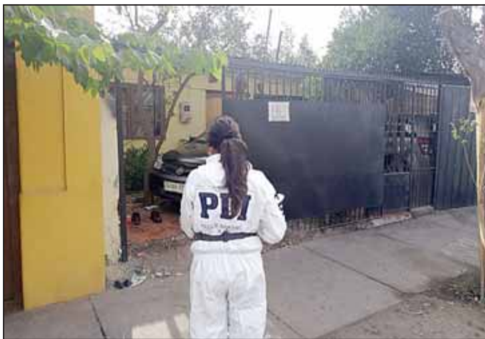
En el interior de este domicilio ubicado en calle 5 de Abril N° 131 en San Felipe, ocurrió la violenta riña protagonizada por la pareja.