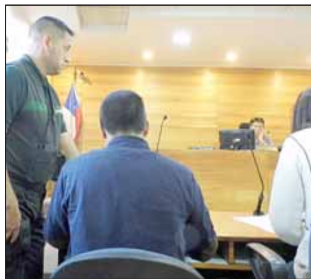
El Técnico Jurídico fue identificado por sus iniciales J.F.G.H. , de 34 años de edad.

Si acepta responsabilidad en los hechos arriesga una pena de 61 días de cárcel, razón por la cual se fijó nueva fecha para la realización del procedimiento.