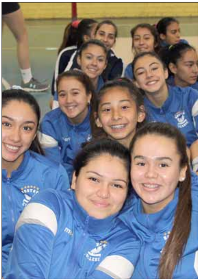
SUBCAMPEONAS. - Estas damitas son las seleccionadas de la Asociación Las Condes Club Deportivo Boston College, quienes perdieron no lograron vencer el poderío deportivo de las sanfelipeñas, en el partido final.