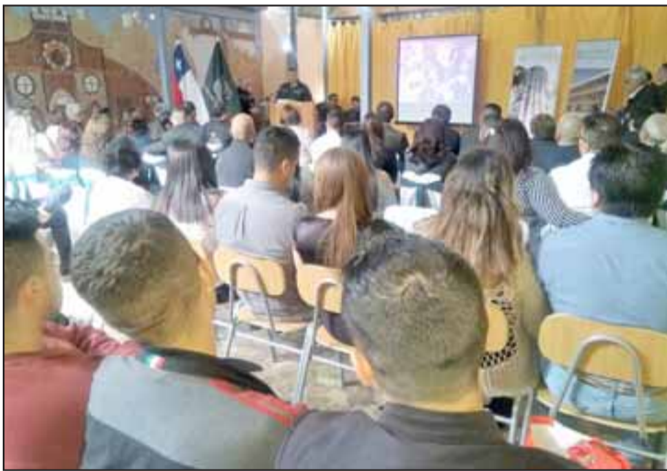
Este martes se realizó la ceremonia de inauguración del año académico en el CCP andino, donde los alumnos estuvieron acompañados de familiares.

mostrado por cada uno de los estudiantes: «Los alumnos han tenido un comportamiento ejemplar. Es una sala de clases envidiable, basta con ver como se han cuidado las dependencias de la sala de clases. Esto habla del interés que la población penal y los alumnos tiene en esta iniciativa. Es una alianza que marca precedentes y creo que es un ejemplo para el resto de las instituciones educativas y el empresariado que también tienen que creer un poco en las personas que tenemos a