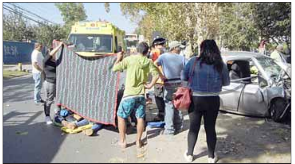
La víctima fatal fue asistida en el lugar de los hechos y trasladada al Hospital San Juan de Dios de Los Andes, donde finalmente falleció debido a la gravedad de sus heridas.

Una vez estabilizados los pacientes, fueron derivados