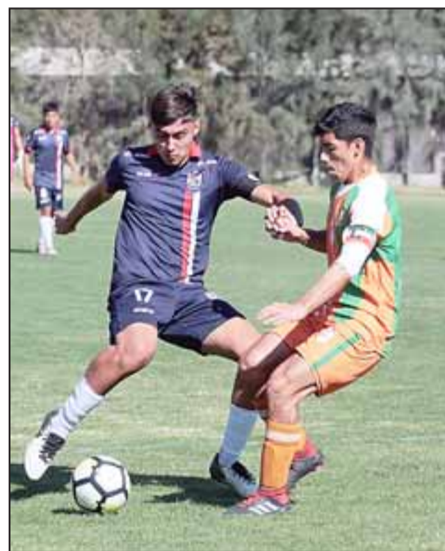
Los juveniles del Uní Uní enfrentaron a Cobresal por el torneo de Fútbol Joven.

U17: Unión San Felipe 1 – Cobresal 3 U19: Unión San Felipe 3 – Cobresal 0