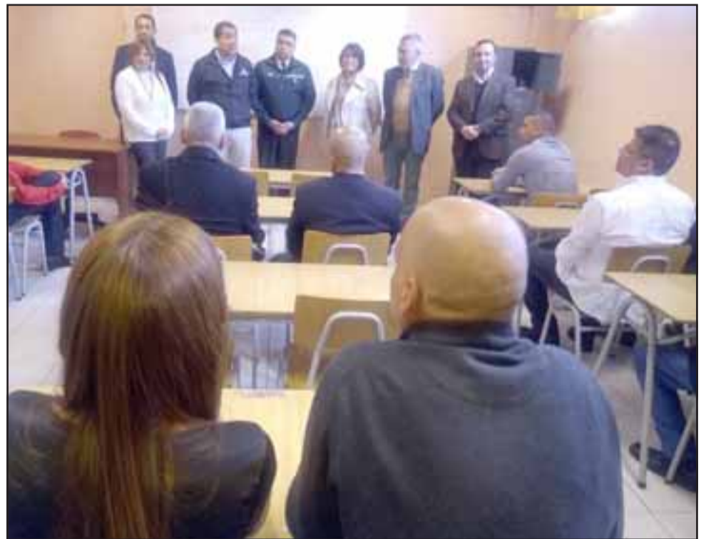
El alcaide de la unidad destacó el compromiso de los estudiantes, demostrado por ejemplo en el cuidado que han tenido con su sala de clases y el mobiliario.

nuestro cargo y en la función que cumplimos como organismo».