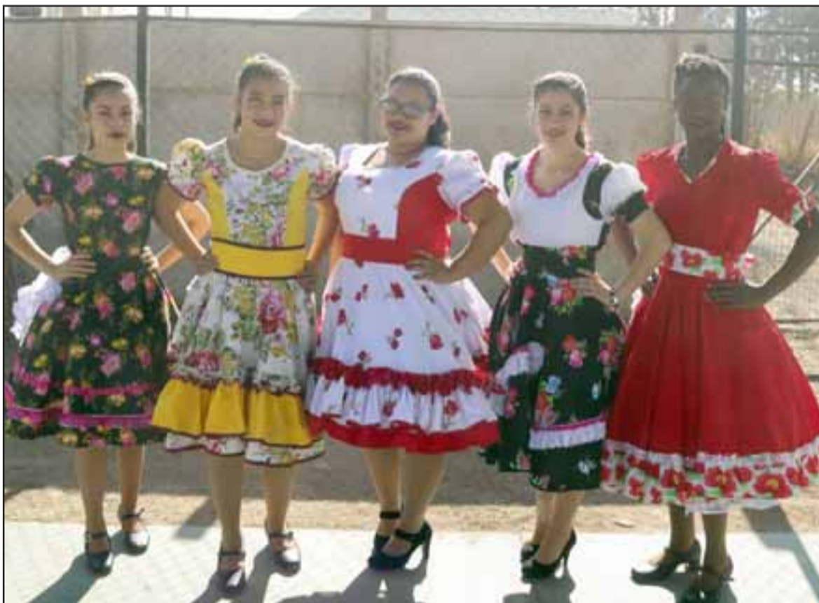
Y CUECA TAMBIÉN. - Estas damitas también engalanaron la actividad del 33° aniversario de la Escuela Renacer.