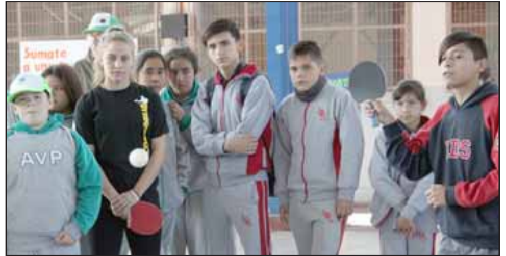
MUCHO INTERÉS.- Varios escolares muestran un buen nivel deportivo en esta disciplina, mientras que otros apenas están empezando.