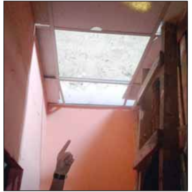
Se supone que por acá bajaron al local después de sacar el panel.

Cabe señalar que frente a este local fue donde se produjo el homicidio de Guido Cabello López el día 16 de junio del año pasado, donde las cámaras de seguridad de la Distribuidora Kiko fueron fundamentales para aclarar el crimen.