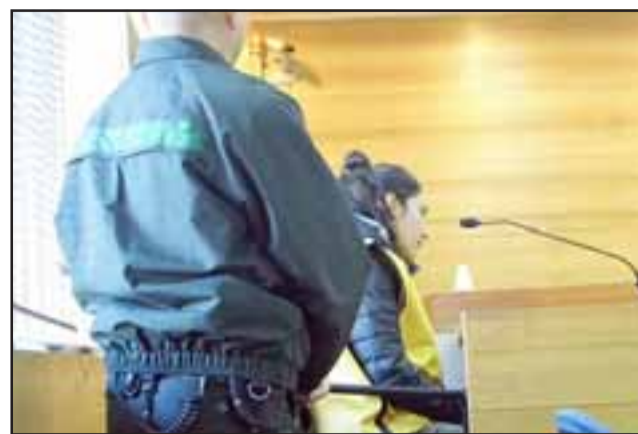
La imputada recuperó su libertad este lunes, quedando con medidas cautelares menores como firma semanal y arraigo nacional.

La Segunda Sala de la Corte de Apelaciones porteña acogió los argumentos de la defensa en orden a considerar excesiva la medida