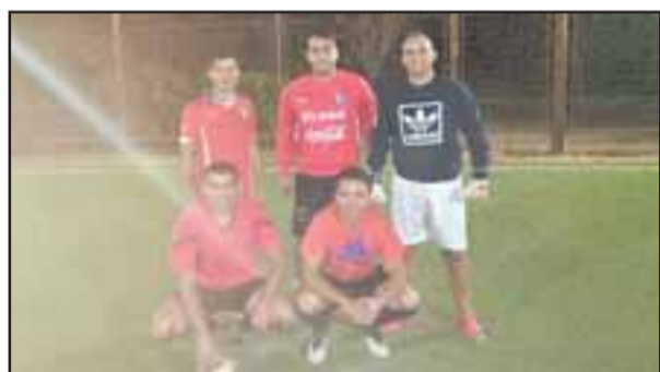
El equipo de Carabineros fue el mejor de todos en un torneo de Fútbol 5 que se realizó en el Club de Tenis de San Felipe.