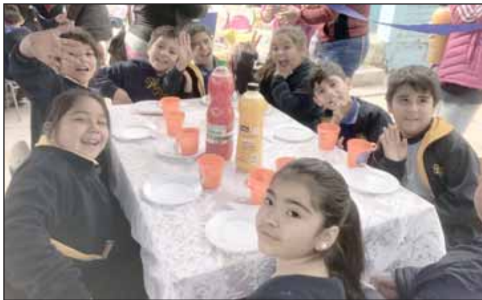
Con un desayuno donde participó toda la comunidad educativa, la Escuela Heriberto Bermúdez celebró 66 años de existencia.