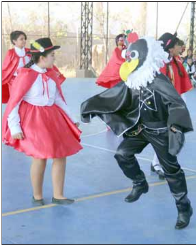
PURO FOLKLORE. - Los estudiantes de esta escuela también desarrollaron varias presentaciones folclóricas como este homenaje a la Virgen de la Tirana.