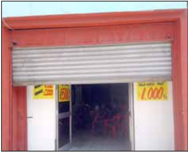
Así lucía este martes en la mañana la cortina del local El Rústico.

Unos trescientos mil pesos se llevaron el o los delincuentes que entraron a robar a un local de comida rápida ubicada en calle Navarro, a metros de calle Merced.