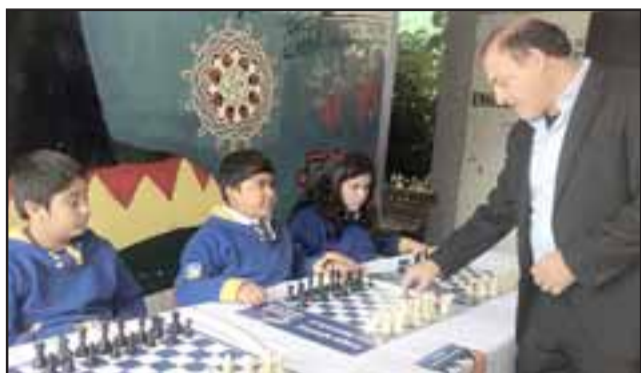
Los alumnos de la Escuela José de San Martín y del Liceo Roberto Humeres participaron en la simultánea con Iván Morovic, donde los mejores fueron seleccionados al nacional de la disciplina.

Promover la práctica del ajedrez a nivel comunal y provincial era el objetivo que tenía la simultánea que realizó el ajedrecista Iván Morovic en la Escuela José de San Martín y en el Liceo Roberto Humeres.