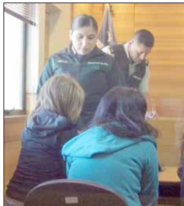
QUEDAN LIBRES.- La defensa se allanó a lo solicitado por el Ministerio Público y ambas imputadas quedaron luego en libertad. Además, el tribunal estableció un plazo de investigación de dos meses.

El persecutor sólo pidió en contra de ambas mujeres la medida cautelar de Prohibición de acercarse al dueño de casa, toda vez que el único medio de prueba para imputarlas era la declaración de la víctima, no habiendo recuperación de especies ni tampoco de la existencia del arma de fuego.