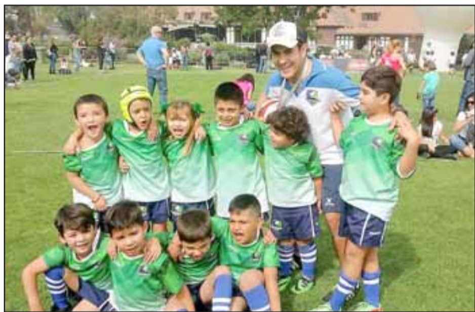
Este fin de semana Los Halcones realizarán una actividad en Los Andes dirigida principalmente a los niños.