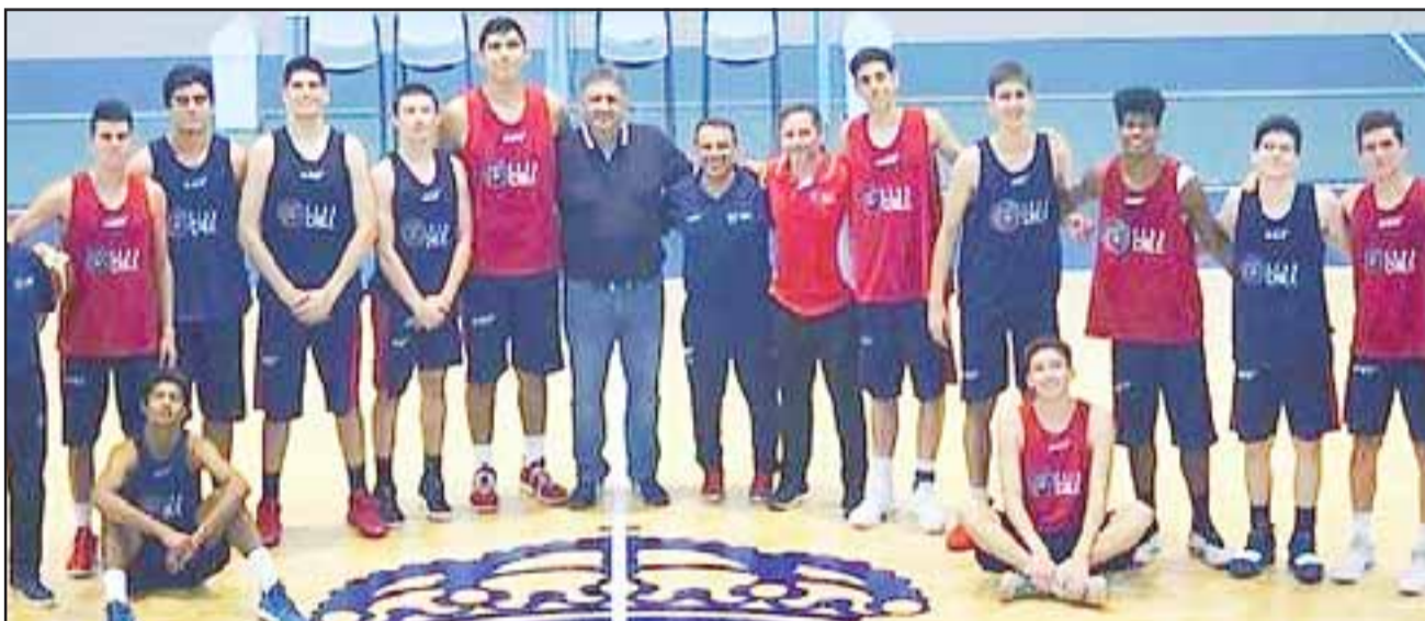
La selección chilena U17 será la gran atracción de la VII edición de la Copa Aconcagua.

Para cumplir con las disposiciones reglamentarias, la organización del evento determinó que la acción se lleve a cabo en los gimnasios del Liceo Politécnico y Corina Urbina; aunque no se descarta que la sala deportiva Samuel Tapia Guerrero también reciba algunos duelos de la competencia cestera que durante tres días convertirá a San Felipe en el polo de atracción de los cestos chilenos.