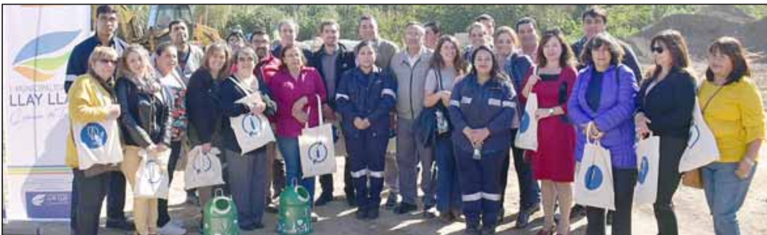
Los dirigentes sociales de distintos sectores se mostraron muy contentos con la construcción de estos 20 mil metros cuadrados de áreas verdes con árboles nativos.

El primer parque urbano de la comuna, tendrá un impacto directo sobre 9 sectores poblacionales, 920 viviendas y 3860 personas e indirectamente en la totalidad de los y las llayllainas. El proyecto tiene un costo total de 1.084 millones 917.384 pesos.