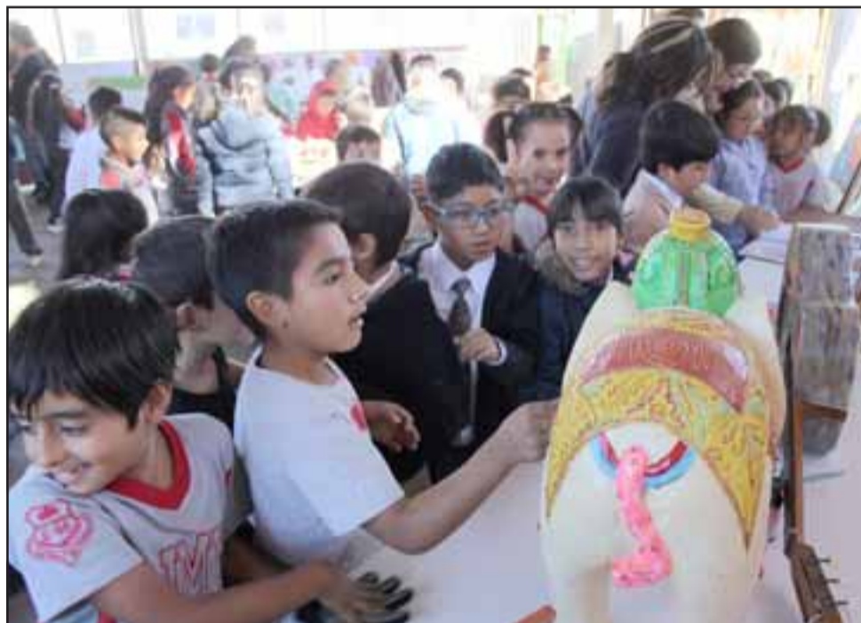
GALERÍA EN LA ESCUELA. - Largas filas de niños se hicieron, curso tras curso tuvo la oportunidad de contemplar estos trabajos artísticos en su escuela.