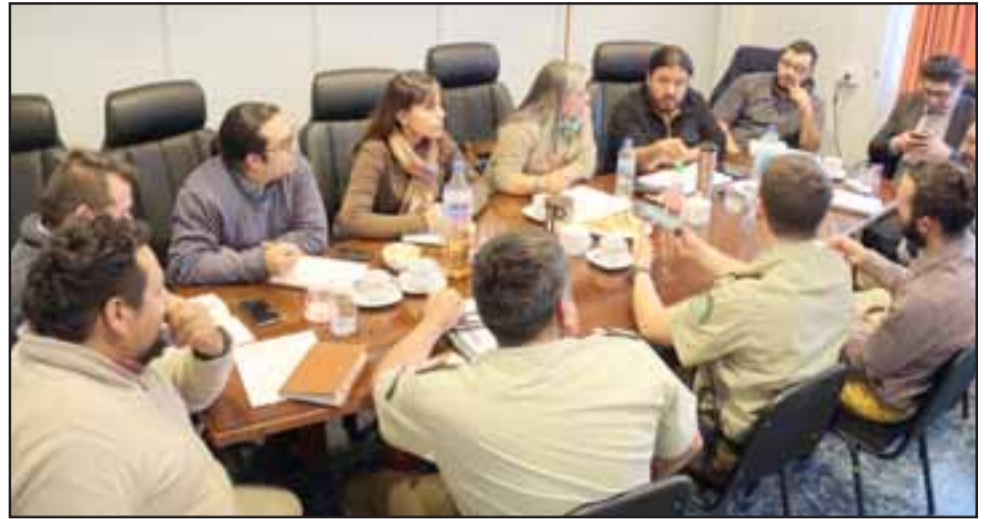
Esta es la segunda reunión de la mesa intersectorial que ejecuta el área de convivencia del DAEM Putaendo junto al Senda Previene, donde además participaron personal del Cefsam Valle de Los Libertadores, de Carabineros, la OPD y encargados de convivencia de los cuatro establecimientos educacionales que tienen enseñanza media.

«Creemos que es necesario aunar criterios en relación de las instituciones con el objetivo de humanizar el trato, bajo un paradigma proteccionista, mejorar las condicio-