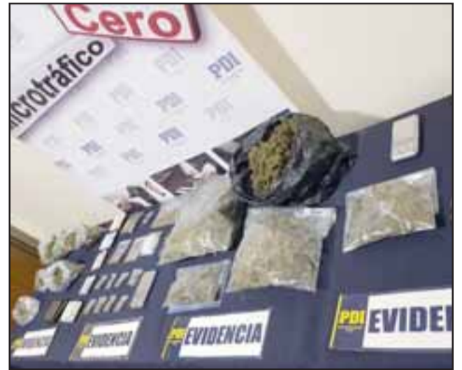
DROGA INCAUTADA.- En total la Brianco decomisó un kilo 175 gramos de marihuana, que alcanzarían para aproximadamente 1.200 dosis, todo con un avalúo de seis millones de pesos.

«Ellos tenían una estructura donde había algunos de los imputados que cumplían el rol de proveedores quienes abastecían a parte de los detenidos y ellos a través de sus contactos se reunían en puntos estratégicos en la comuna de los Andes donde realizaban estas transacciones de drogas», precisó el oficial.