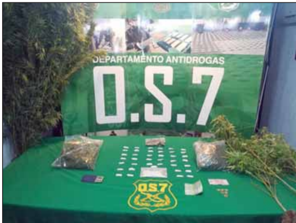
El 3 de abril de 2018 la sección OS7 de Carabineros incautó pasta base, marihuana en cogollos y plantas de cannabis sativa desde el domicilio del sentenciado en calle Comercio de Putaendo.

El sentenciado deberá cumplir la condena íntegramente en la cárcel, descon-