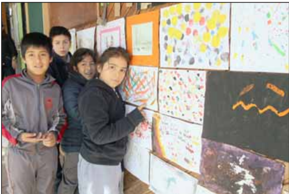
PEQUEÑOS ARTISTAS. - Estos pequeñitos muestran a Diario El Trabajo su trabajo escolar para esta Semana de la Educación Artística.