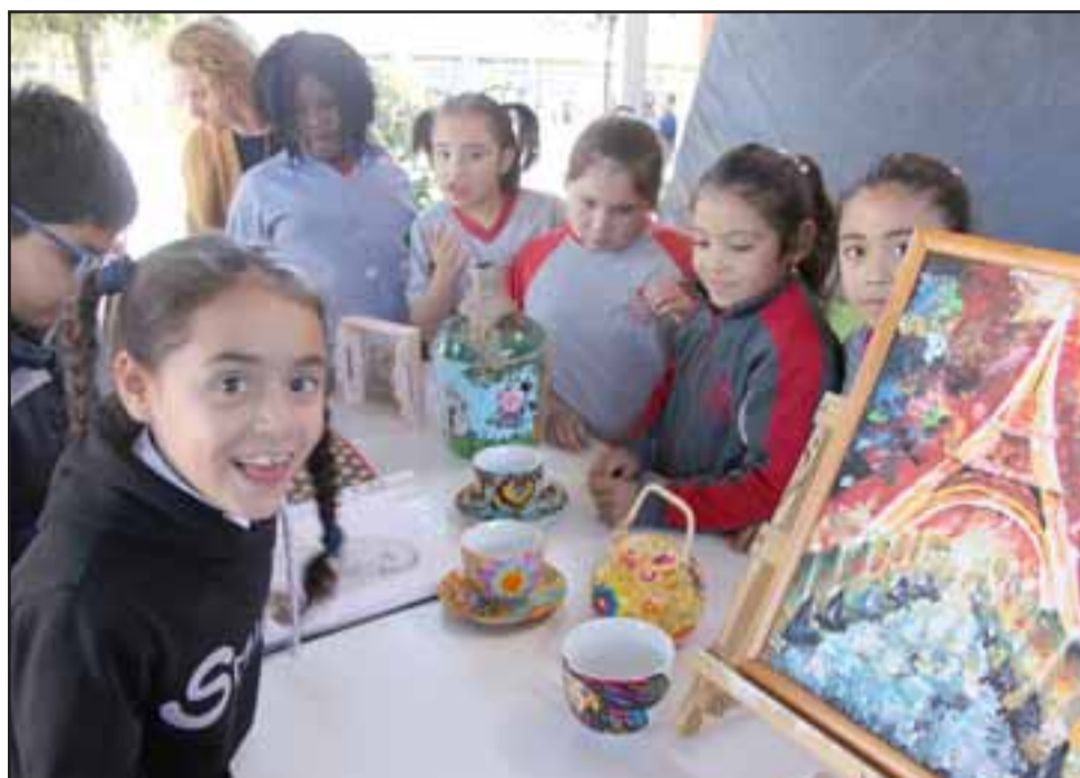
TREMENDA EXPOSICIÓN. - Magia, textura y color son lo que hubo ayer todo el día para el disfrute de los 370 estudiantes de la Escuela José Manso de Velasco.