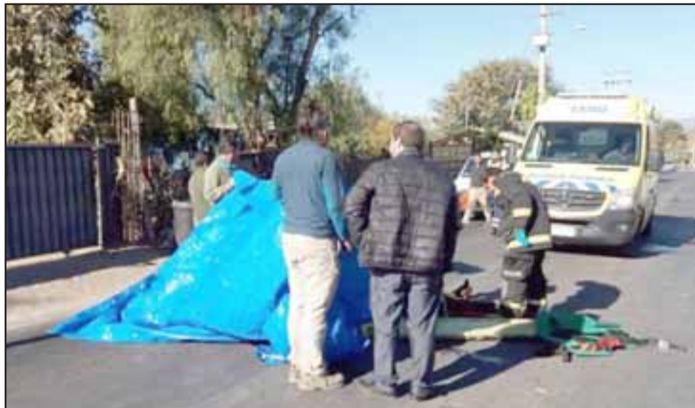
El funcionario de aseo municipal habría sido atropellado por un motociclista que se fugó la mañana de ayer miércoles en calle Principal del sector La Higuera en Santa María.

Con diversas lesiones resultó un trabajador de aseo municipal de 60 años de edad, quien en los momentos en que recolectaba la basura fue atropellado por un motociclista que se fugó sin prestar auxilio a la víctima que quedó tendida en la calle Principal del sector La Higuera en Santa María.