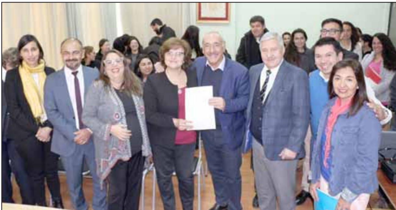
El acuerdo se extenderá por dos años e involucra a la Dirección de Desarrollo Comunitario (Dideco), Salud y Educación (DAEM), además de la Universidad Mayor.

A partir de la primera quincena de julio se materializarán estos operativos, que buscarán entregar más de 4 mil prestaciones a la