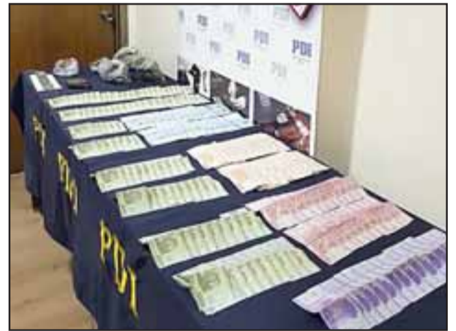
EFFECTIVO TAMBIÉN.- También la Policía de Investigaciones incautó dinero en efectivo, presumiblemente atribuible a la venta de drogas.

Agregó que un cuarto sujeto detenido inicialmente en la diligencia de iniciales L.A.E.I. , de 22 años, fue dejado en libertad a la espera de ser citado a declarar. El Comisario Fuentes preci-