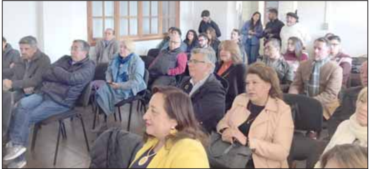
A la instancia asistieron vecinos que se desarrollan en diferentes ámbitos como turismo, educación, arte, arquitectura, cultura, pedagogía, comunicaciones, fotografía y otros, donde cada uno pudo dar su opinión y manifestar sus sueños en cuanto a esta importante iniciativa.

la Corporación de Desarrollo Pro Aconcagua, destacó el interés de los asistentes por participar y entregar sus aportes al proyecto: « Esta es la primera parte de tres que vamos a convocar para la participación de la comunidad del Valle de Aconcagua, para opinar sobre estos temas y qué es lo que se va a hacer precisamente. La idea de estos encuentros no solamente es escuchar sino también