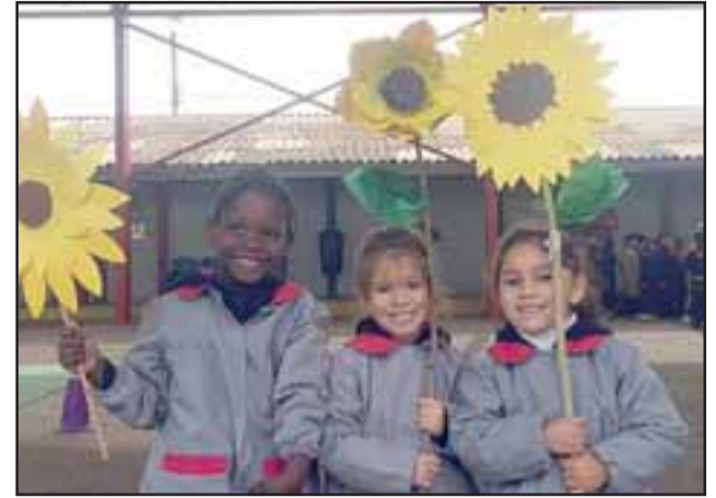
CON SUS PROPIAS MANOS.- Estas pequeñitas muestran a Diario El Trabajo cada una el girasol que hizo para esta original iniciativa.