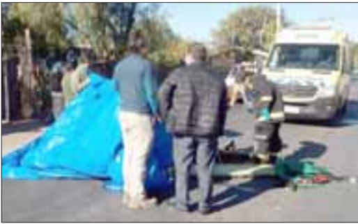
Personal de emergencia atiende al herido