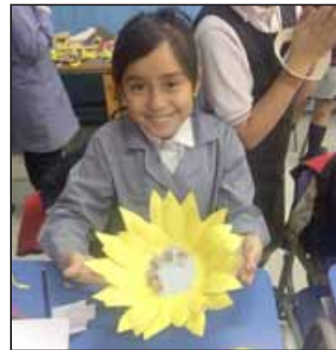
CUMPLIÓ SU TAREA.- Así, cada uno de los estudiantes confeccionó su girasol, el que ahora luce con muchos más en el bandejón de Avenida Miraflores.