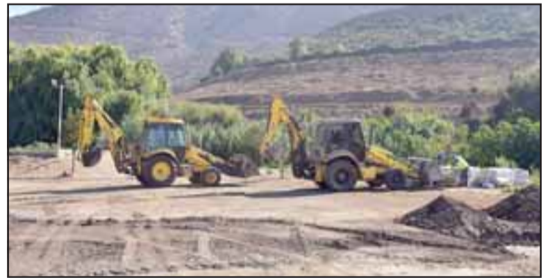
Obras ya llevan un 10% de avance y le cambiarán la cara a este lugar que antes era un microbasural.

para el encuentro. Esta organización será la responsable de ejecutar dos tareas fundamentales para finalizar la construcción del Parque Los Loros.