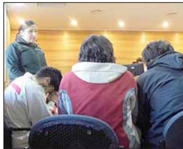
QUEDAN LIBRES.- Sólo por el hecho de no tener condenas anteriores quedaron sujetos a la medida cautelar de Arresto Domiciliario total por el tiempo que dure la investigación.