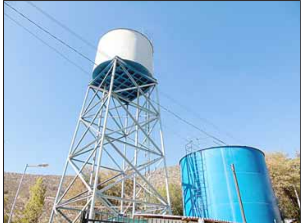
Los trabajos beneficiarán a más de 700 socios pertenecientes a la localidad de Las Calderas, en Calle Larga.

CONTRIBUYENDO AL DESARROLLO El Programa Andina