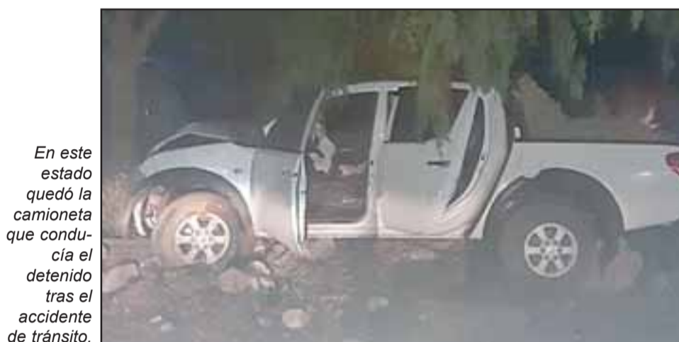
En este estado quedó la camioneta que conducía el detenido tras el accidente de tránsito.