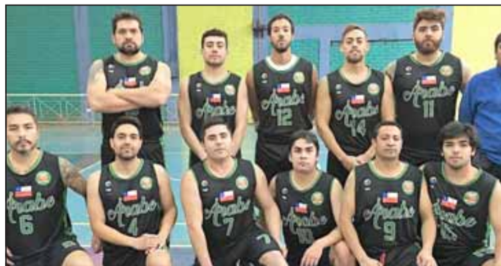
El Árabe de San Felipe enfrentará el domingo a Canguros de Calle Larga.