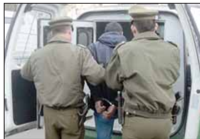
El delincuente fue capturado por Carabineros la tarde de este miércoles, acusado de abuso sexual y robo por sorpresa a una estudiante de 16 años de edad. (Foto Referencial).