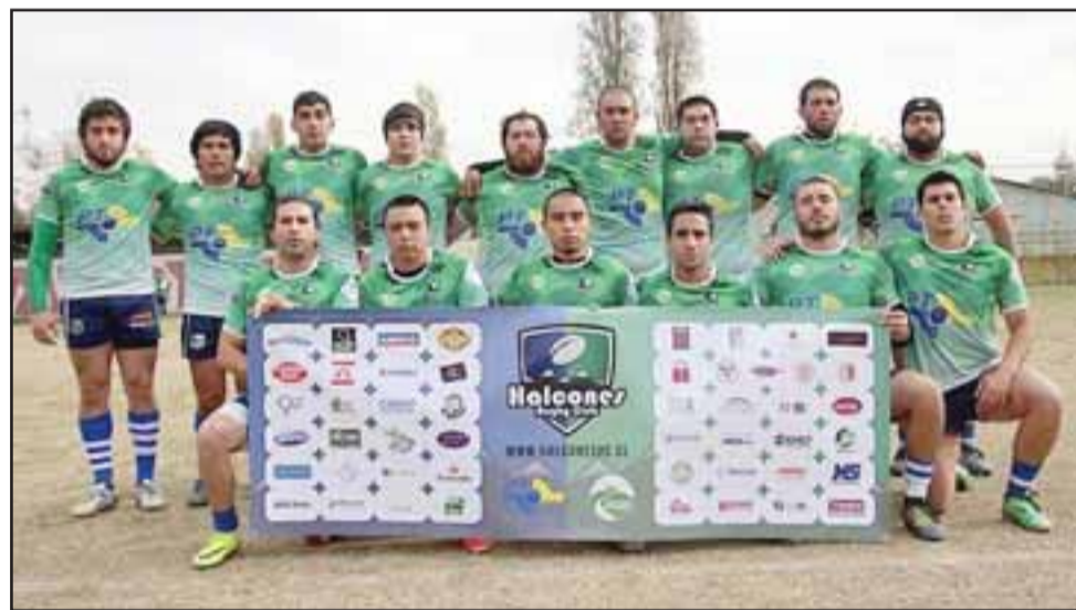
El quince aconca güino será desafiado por el colista del grupo A.