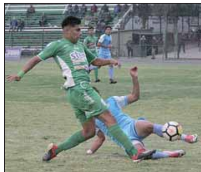
El conjunto andino llegará como sub líder al partido de este domingo con Rancagua Sur.