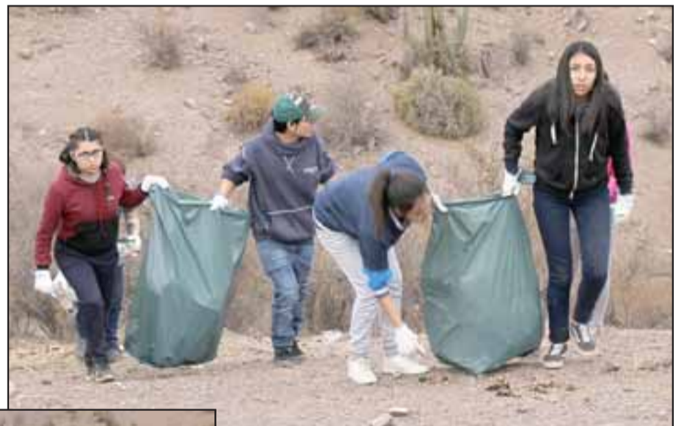
Conscientes de la importancia de preservar el entorno, los estudiantes tomaron la iniciativa y decidieron hacer un ‘Limpieza Challenge’ en lugares utilizados como microbasurales.

de áreas verdes de la municipalidad de Putaendo. De esta forma, muchachas y muchachos lograron recolectar más de 20 bolsas de basura gigantes llenas de desperdicios.