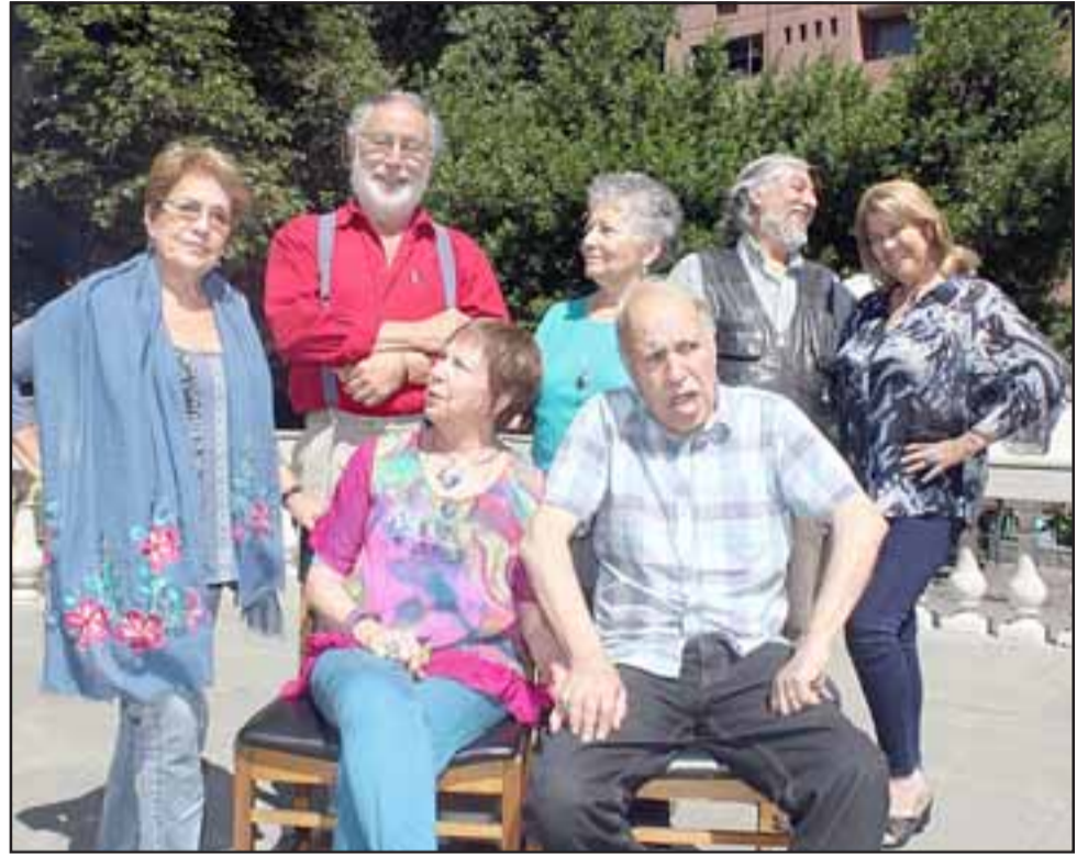
La obra está dirigida a la tercera edad del valle de Aconcagua, que disfrutará y reirá con este trabajo realizado por adultos mayores.

Explicó que relata la vida de Rigoberto , una persona que se ha enriquecido gracias a los aportes de un grupo de amigos cercanos a los que les pide grandes sumas de dinero para 'supuestos' proyectos y negocios; él los invita a celebrar su cumpleaños y vela-