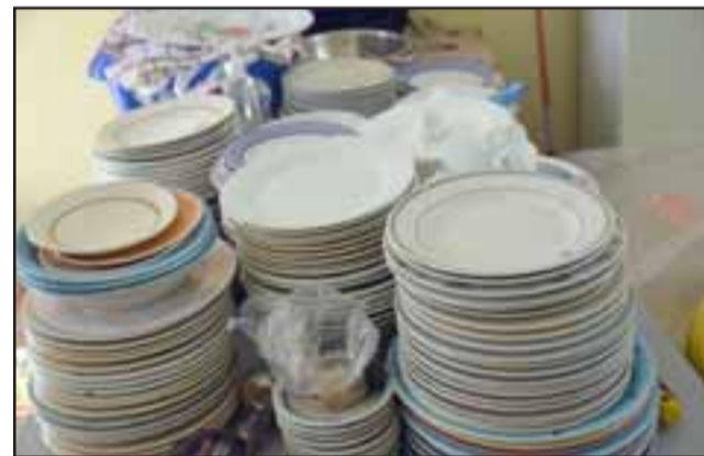
TODO LISTO.- Los platos están listos, serán lavados y puestos a disposición de quienes a partir del lunes 3 de junio lleguen por su almuerzo al Comedor Solidario.