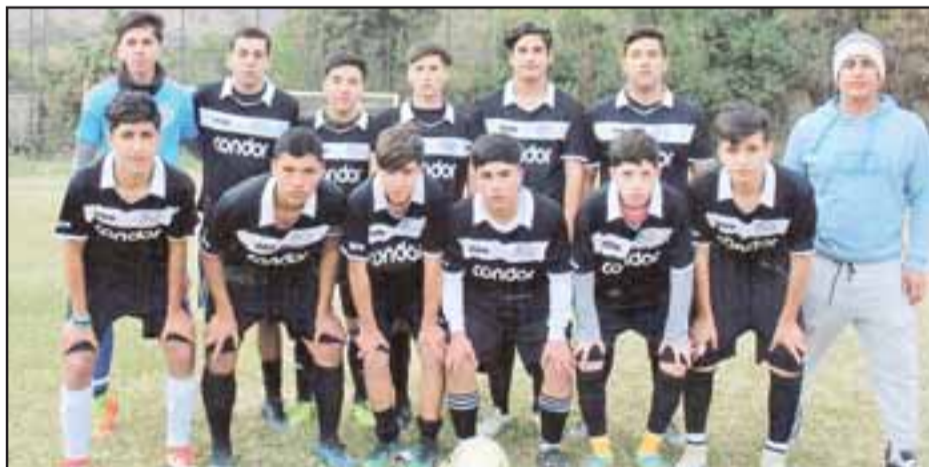
Primera Infantil del club Cóndor de Putaendo.