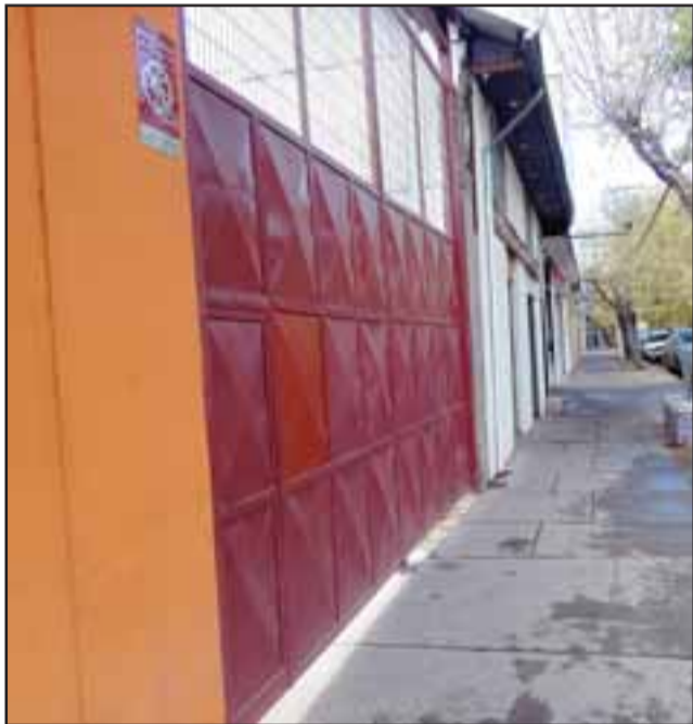
Por este portón dice la dueña que haciendo un orificio entraron los delincuentes.

Cabe señalar que hay mucha inquietud entre los comerciantes por la gran cantidad de robos que los ha afectado últimamente.