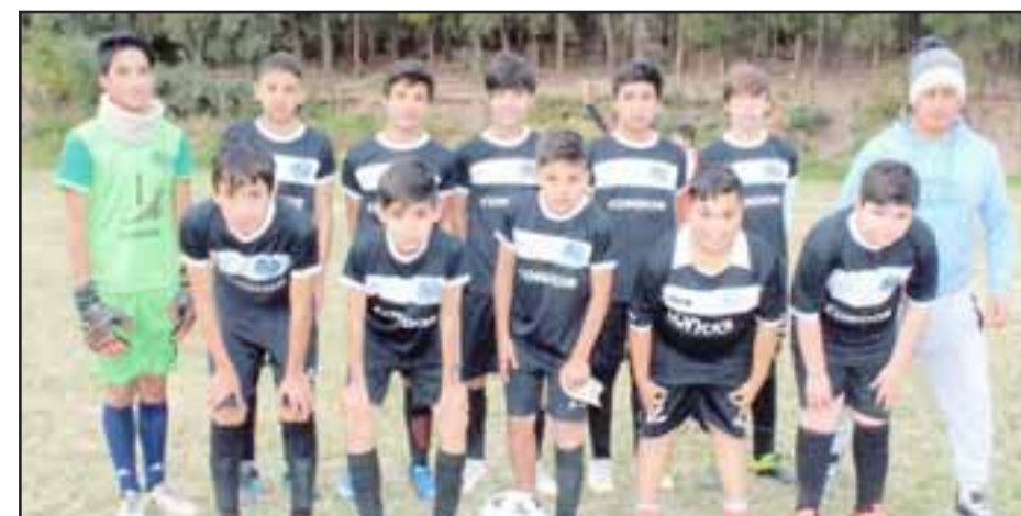
Segunda Infantil del club Cóndor de Putaendo.