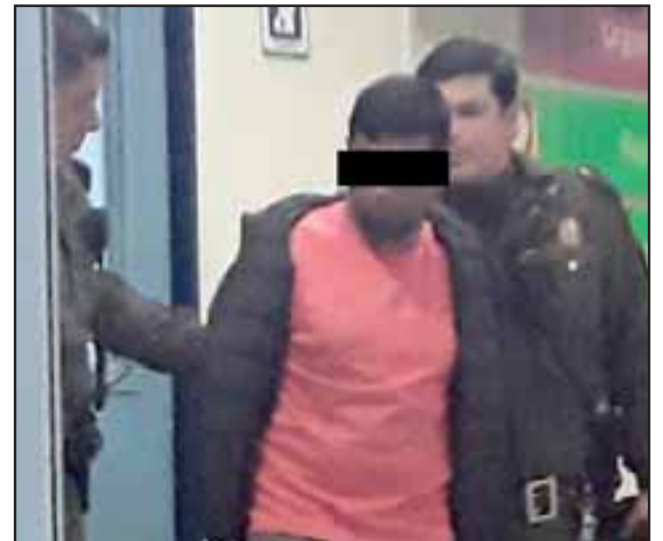
El conductor de 30 años de edad fue detenido por conducción en estado de ebriedad la noche de este miércoles por Carabineros de Putaendo..

El oficial policial añadió que el conductor no presentaba lesiones visibles tras el accidente de tránsito, sin embargo se descubrió que circulaba en estado de ebriedad: «Mantén un fuerte hálito alcohólico, proceden a su detención, realizan el examen de alcotest arrojando 2,15 gramos de alcohol por mil de sangre. Pasó detenido por conducción en estado de ebriedad, se da cuenta al Juzga-