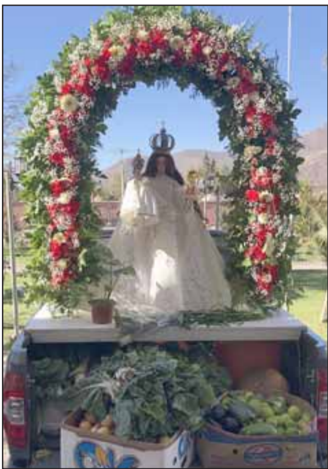
ACCIÓN Y RELIGIÓN.- Aquí vemos una imagen de Nuestra Señora del Rosario Andacollo, a sus pies muchas verduras y frutas para el Comedor Solidario.

«Este es un programa social que busca socorrer en los tres meses de invierno a las personas que están en la calle, a quienes están postradas en las camas, a las familias necesitadas y a todo aquel que solicite el almuerzo diario que con mucho cariño entregamos aquí en la parro-