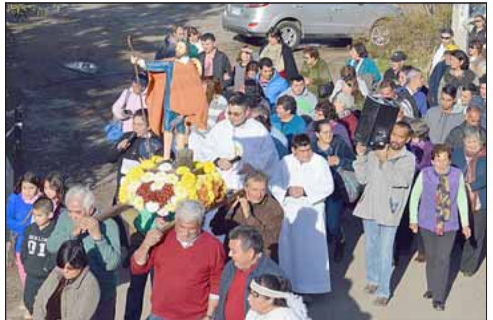
LLEGAN LAS FIESTAS Y LA LLUVIA. - En andas llevarán a San Isidro por las calles de El Asiento, la música y los bailes no faltarán este domingo.

Esta festividad permite realizar un rezo colectivo a través de los saludos ceremoniales de los bailes, la Santa Misa, y las despedidas, donde los 'alférez' de los bailes chinos y los mismos danzantes, pedirán especialmente por las lluvias, tan necesarias para la vida del valle.