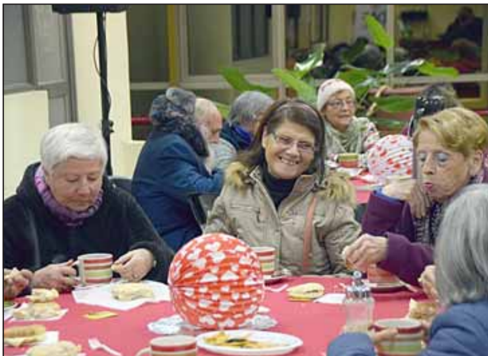
HAY QUE REPETIRLO. - Todos pudieron compartir amenamente de los recuerdos y el presente, unidos por la cercanía de la edad, estos vecinos le sacaron provecho a la fiesta.