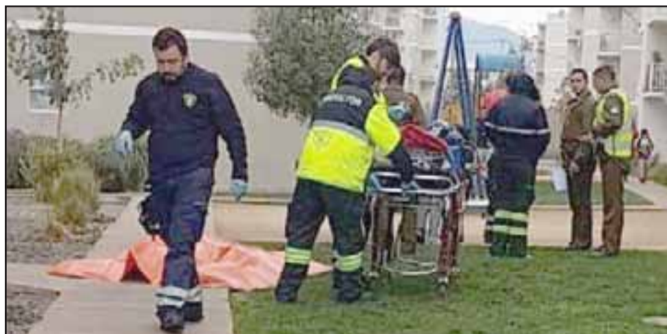
Personal del Samu efectuó maniobras de reanimación a la víctima de 27 años de edad, confirmándose su deceso en el mismo lugar.

«No tiene lesiones externas que sean atribuibles a terceras personas, todo hace indicar de que se trata de una patología de base, la causa de muerte queda indeterminada en este sentido hay que esperar cuál es la causa de muerte. Hay señalamientos de que tenía patologías que tenían que ser tratadas, podría ser una situación de arrastre».