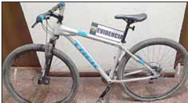
De acuerdo a los antecedentes policiales, pasadas las 00 horas la víctima circulaba en esta bicicleta marca Treck, modelo Merlin 4, avaluada en la suma de 250.000 pesos.

dinero en efectivo y la pistola a fogueo usada para el atraco. El antisocial fue puesto a disposición del Tribunal de Garantía de Los Andes, siendo formalizado por los delitos de robo con intimidación y