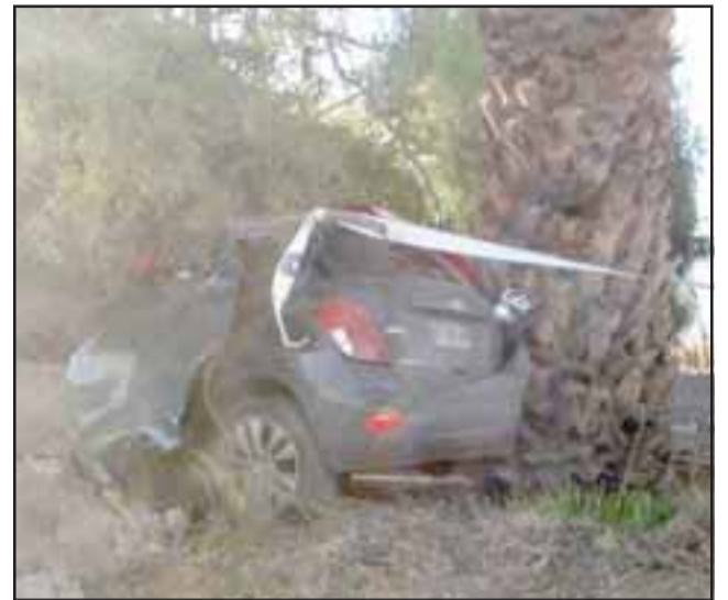
El accidente ocurrió la tarde de ayer domingo en la curva del sector La Peña en Curimón.

Preliminarmente Carabineros informó que el conductor habría perdido el control de su vehículo en la pronunciada curva que ha sido escenario de diversos