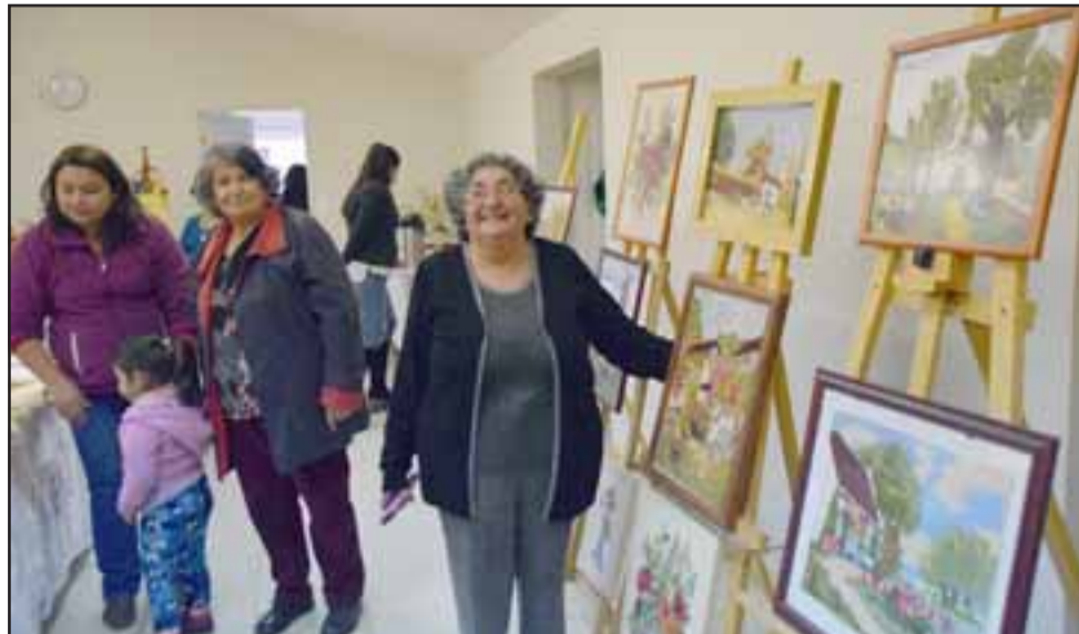
SON 40 AÑOS. - Muchas familias seguirán unidas por el fraternal vínculo de amistad que nace y se fortalece en este Taller.