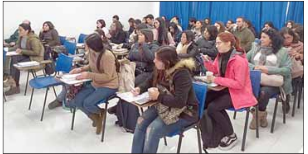
Cientos de personas cada día reciben capacitación sobre el TEA en nuestra comuna.

- Claro, al final somos una gran familia, entonces hay que tomar también la opinión de ellos y la verdad que encontramos la oportunidad que esta casa está más cerca, no es tan chocante para los niños porque son muy de rutina, tampoco es muy chocante estamos cerquita, así es que tomamos la decisión y nos cambiamos, así en este semana estamos en proceso de trasladar cosas, hay que dejar la casa pintada todos los arreglos que ustedes saben que se