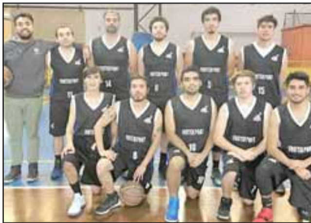
Frutexport debutó con una derrota en el campeonato de la Asociación de Básquetbol Alejandro Rivadeneira.

La fecha dos del torneo jugó de manera íntegra en el Fortín Prat, el recinto de