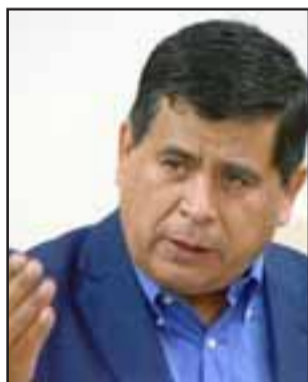
Claudio Zurita Ibarra, alcalde de Santa María.

nando con el tiempo, con los años he visto a jóvenes mujeres llegar al taller, casarse al tiempo y así vienen sus hermanas, hijas y otras vecinas, es un grupo muy unido, y por supuesto que siempre el Municipio y éste alcalde estaremos atentos a brindarles apoyo para que este taller no desaparezca, más bien se fortalezca con el tiempo», dijo Zurita.