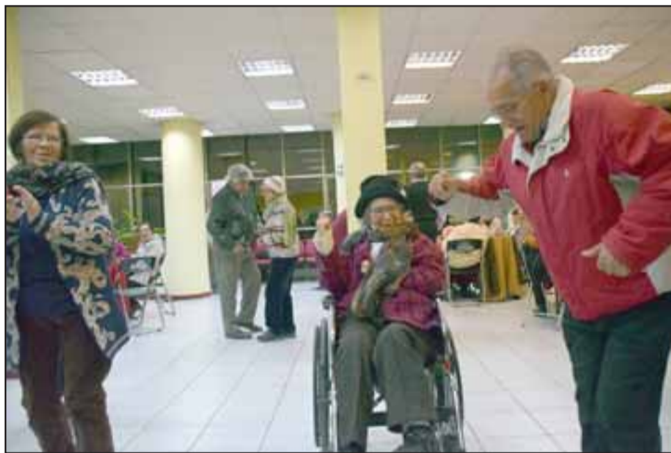
MALÓN PARA TODOS. - Esta vecina y su esposo no lo pensó dos veces y aunque en silla de ruedas, disfrutó de la fiesta y bailaron también.