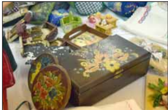
EN MADERA TAMBIÉN. - Aquí vemos estos finos baúles de madera, artísticamente adornados, obras creadas por estas vecinas de La Higuera.