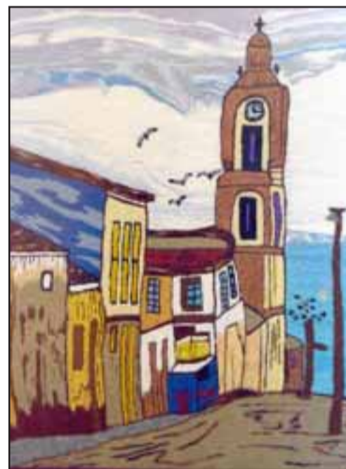
HILO DE ALGODÓN. - Aquí tenemos un excelente trabajo en hilo de algodón, a veces les lleva varios meses para poder terminar una obra como esta.