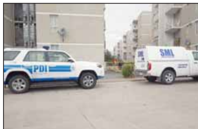
Al sitio del suceso concurrió personal de la Brigada de Homicidios de la PDI de Los Andes y personal del Servicio Médico Legal de San Felipe.

El cuerpo fue derivado hasta el Servicio Médico Legal para la práctica de la autopsia de rigor que establezca científicamente la causa basal del lamentable fallecimiento. Pablo Salinas Saldías