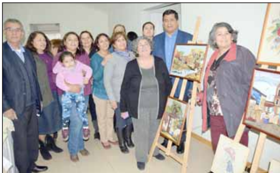
TALENTO FEMENINO. - Estas vecinas muestran orgullosas sus creaciones, algunas las venden y otras son de exhibición permanente de su taller.

«Yo también estoy muy orgulloso de ver cómo estas vecinas se van perfeccio-