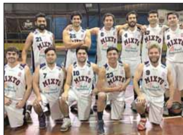
Liceo Mixto fue el equipo más goleador en la segunda fecha del Apertura de Abar.

Más tarde llegó el turno para la victoria de 48 a 38 del Sonic sobre Canguros. La bajada de telón de la larga cita cestera corrió por cuenta de los elencos de Llay Llay Básquet y Lobos, partido que