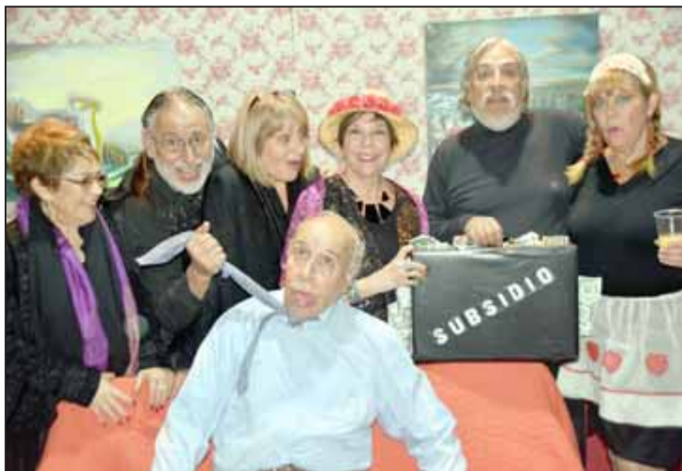
POBRE RIGOBERTO. - Aquí tenemos al elenco de la obra Subsidio , que se presentó en el Teatro Municipal para el disfrute de todos.