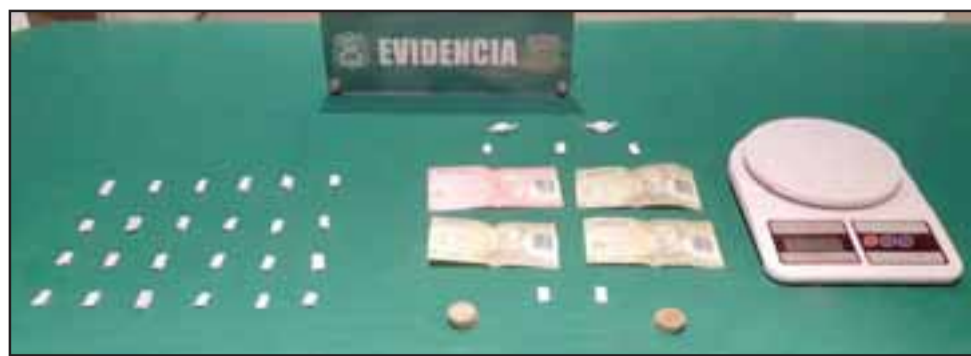
Personal de OS7 de Carabineros Aconcagua, incautó pasta base y clorhidrato de cocaína desde el domicilio de los imputados ubicado en Población Santa Brígida de San Felipe.

Para obtener medios de pruebas sobre este delito, Carabineros procedió a ingresar al inmueble investigado, incautando un total de 29 envoltorios de pasta base de cocaína equivale a un peso bruto de más de 9 gramos de este alucinógeno. Durante el operativo policial, se decomisó además