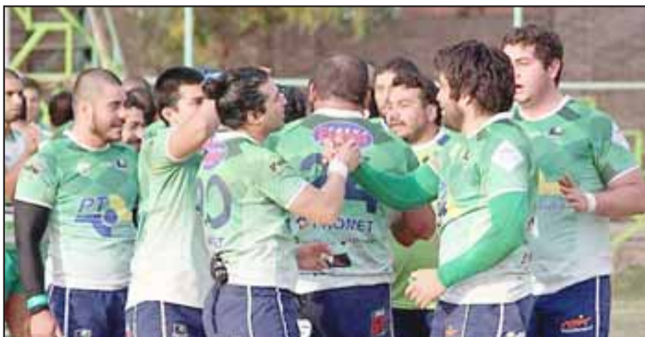
Los Halcones no pudieron mantener su tranco ganador en el Torneo Central A de Arusa.

El próximo desafío del quince del Valle de Aconcagua en el torneo más importante del rugby chileno, será el sábado próximo cuando en el Estadio Municipal de Calle Larga reciban la visita de Gauchos RC.