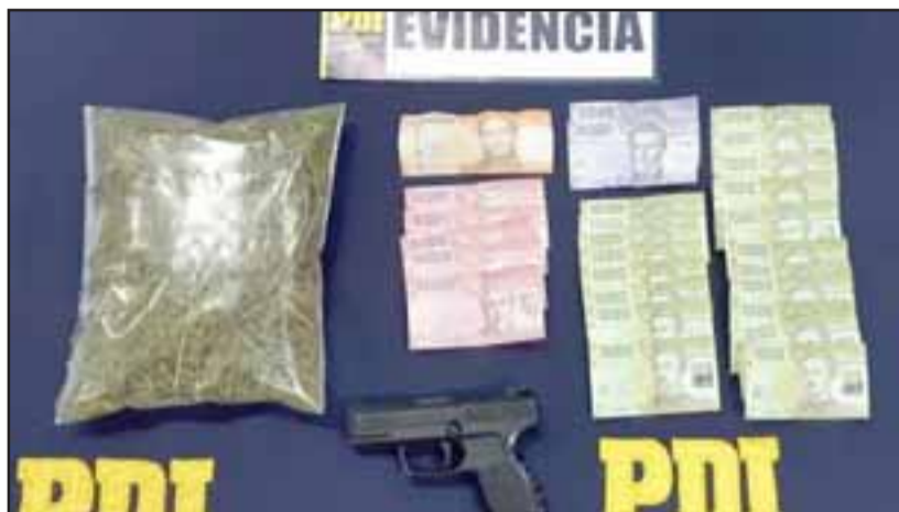
Con esta pistola a fogueo el antisocial perpetró el asalto, la droga y dinero, son 'Bonus Extra' que él tenía en su casa.

En el interior del inmueble se encontraba la bicicleta sustraída a la víctima, además de 128, 22 gramos de cannabis sativa,