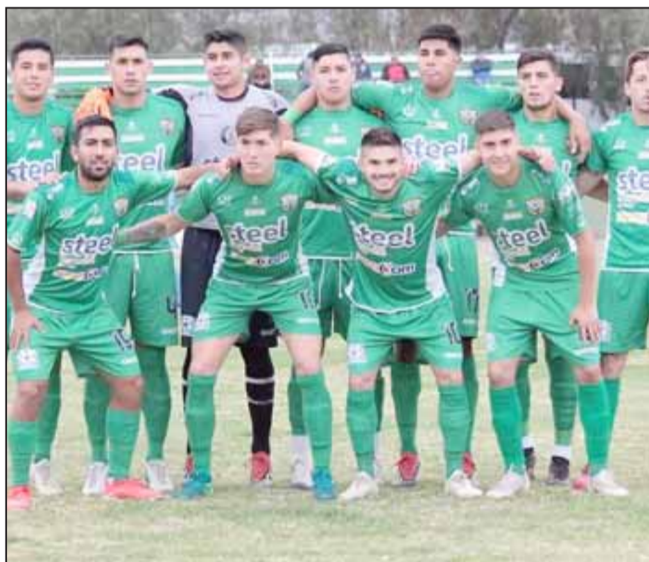
Trasandino enfrentará a Everton por la segunda etapa de la Copa Chile.