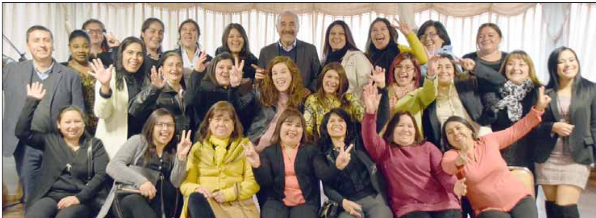
LISTAS Y CAPACITADAS.- Las 36 participantes posan para las cámaras de Diario El Trabajo, luego de haber cursado la capacitación en Manipulación de Alimentos.

Aún quedan cupos para curso de finales de junio: