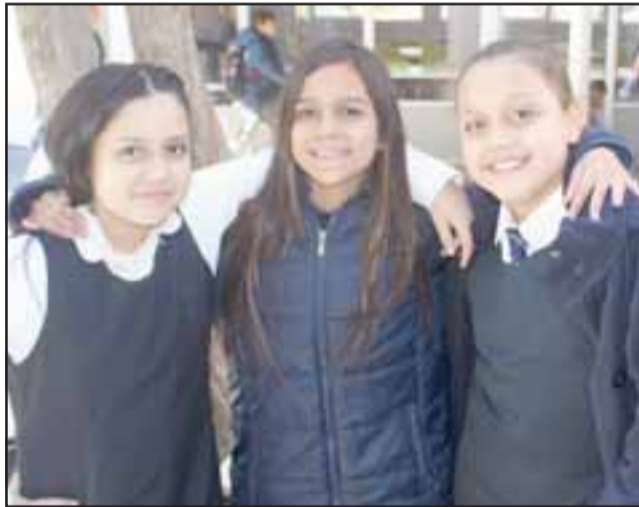
NUESTRO FUTURO.- Estas jovencitas son la cara del liceo, niñas con esperanza de cumplir sus sueños usando la herramienta del estudio y su esfuerzo personal.

años. Por otro lado, Moreno Bustamante agradeció la confianza depositada en él para liderar los cinco años de su nombramiento. La ceremonia de aniversario culminó con un cóctel ofrecido a las autoridades.