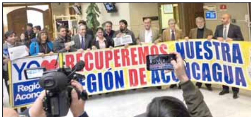
Apoyo de diferentes sectores políticos lograron en el Congreso los movimientos por Aconcagua Región.

La Merced, y su cuerpo descansará en el Cementerio Municipal de San Felipe, en El Almendral. ¡Descansa en paz Arturito! Roberto González Short