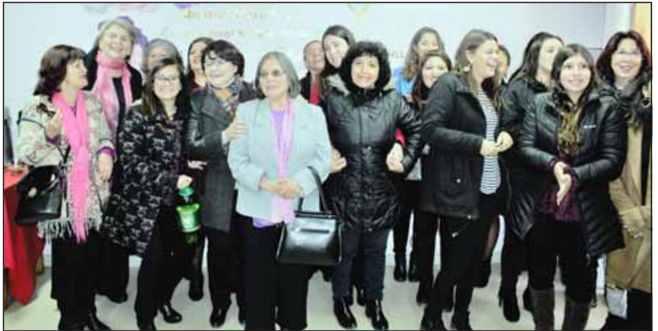
FELIZ CUMPLEAÑOS.- Mucha camaradería se vivió en las dependencias con la celebración del 162º aniversario del Liceo República Argentina.

También en dicha ceremonia se hicieron presentes exdocentes de dicha unidad educativa, quienes aportaron con sus enseñanzas a