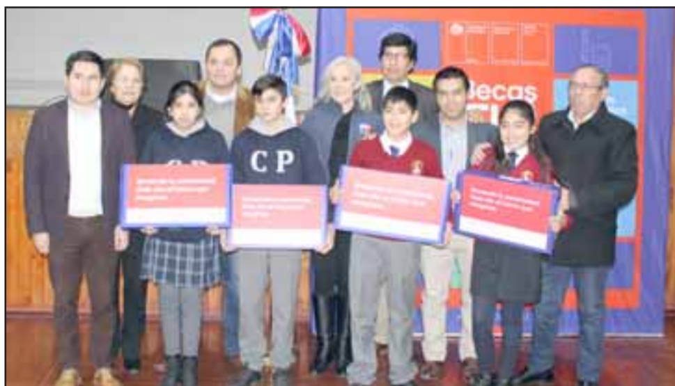
En total fueron 58 los alumnos de Panquehue que recibieron su computador portátil a través del programa 'Me Conecto para Aprender'.

El equipamiento entregado considera un computador portátil con 12 meses de garantía; banda ancha móvil por 12 meses, 1 pendrive, una pulsera inteligente de monitoreo de actividad física, una mochila para transportar el computador, un software de rastreo, un set de cartillas informativas