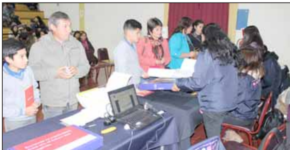
Los alumnos beneficiados junto a sus padres concurren a retirar sus equipos.

sobre el programa y las garantías del equipo, una guía de recursos y portales educativos y acceso a software educativos digitales y pági-