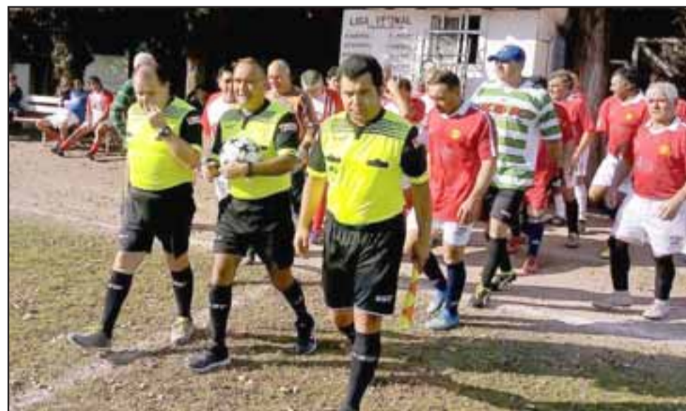
La actual competencia en Parrasía está siendo dominada por equipos poco habituados a estar arriba en la tabla.

Los Amigos 1 - Andacollo 0; Barcelona 2 - Resto del Mundo 1; Unión Esperanza 2 - Hernán Pérez Quijanes 1; Tsunami 2 - Pedro Aguirre Cerda 0; Villa Los Álamos 3 - Villa Argelia 1; Aconcagua 3 - Santos 2; Unión Esfuerzo 5 - Carlos Barrera 2.