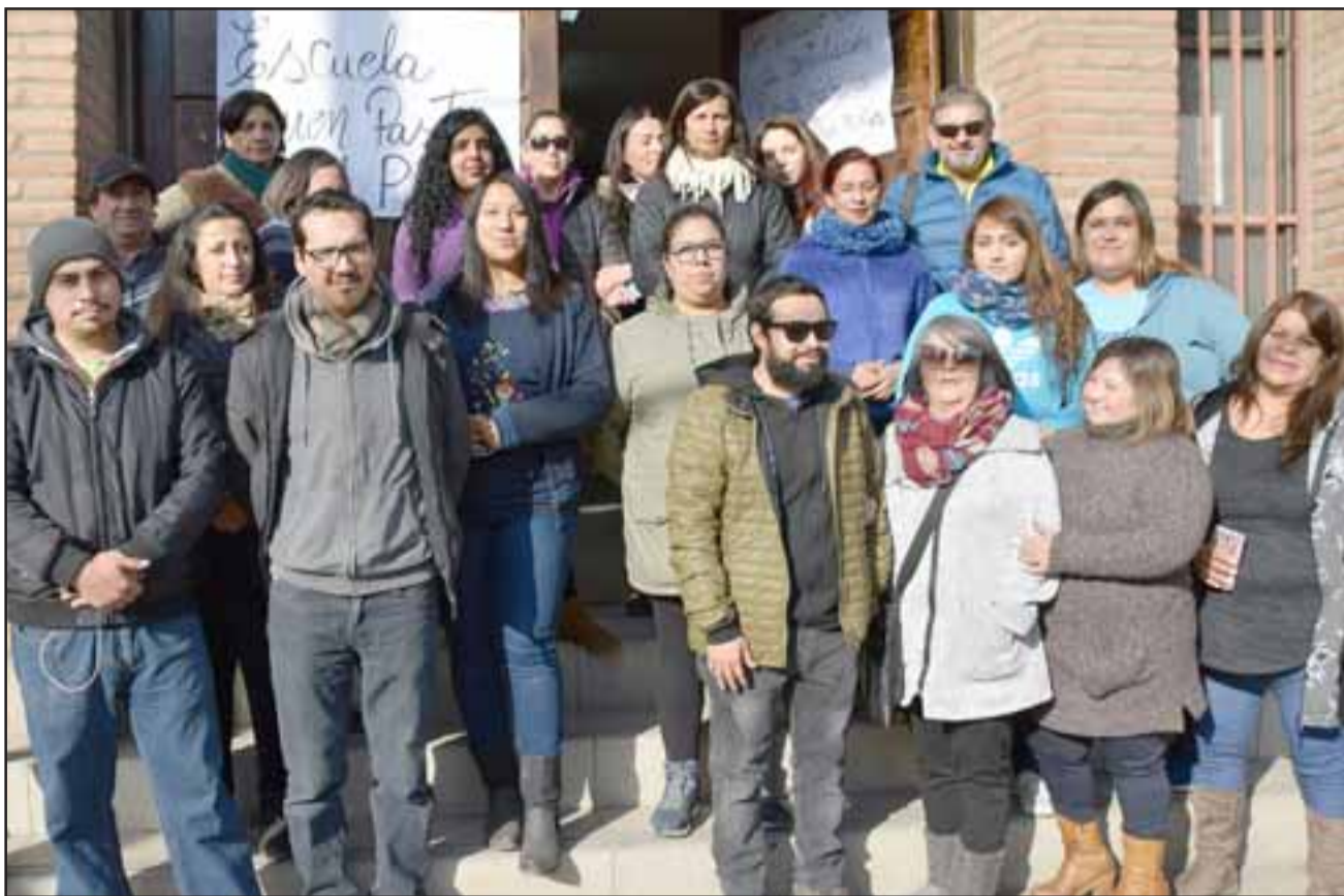
PROTESTAN HOY.- Desde las 10:00 horas de hoy martes, frente a la Escuela Buen Pastor, la comunidad educativa compuesta por estudiantes, profesores y apoderados, protestarán en busca de obtener una declaración de las autoridades que les dé tranquilidad sobre el futuro de su casa de estudios. Ellos son parte del grupo que lidera el movimiento.