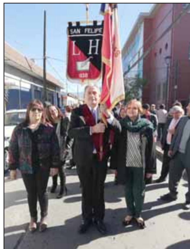
COMO EL PRIMER DÍA.- Ex alumnos y comunidad liceana en dirección a la Plaza de Armas para participar del tradicional desfile que se realiza en cada aniversario.

proyectarse hacia el futuro. Muchos de ellos se encuentran presentes en este lugar, otros ya han partido, nuestro respeto y reconocimiento por la labor realizada durante décadas. En los recuerdos de nuestra infancia, emerge siempre la clara figura de una maestra o un maestro, con quienes tenemos pendientes una deuda de gratitud. Gracias, queridos maestros por guiarnos a ser mejores, ustedes nos enseñaron, el ancho y variado mundo del conocimiento, despertaron nuestras inquietudes, nos dieron los instrumentos y las herramientas para sobresalir, se nos enseñó a estudiar y la responsabilidad de cumplir con el deber, aprendimos a ser autodidactas en mucho, sin más armas que un simple lápiz, un cuaderno y un libro de texto. Nos enseñaron Valores, Principios, Habilidades, y Conocimientos, en-