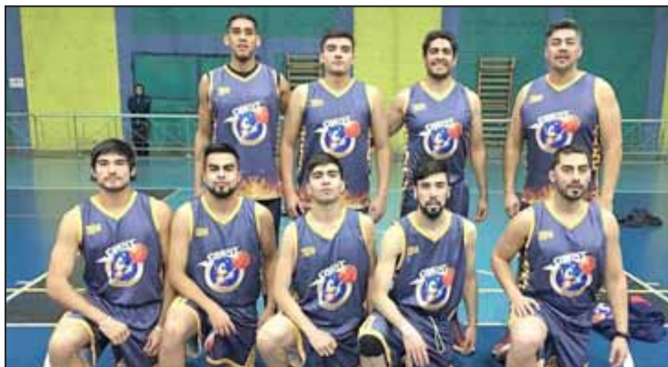
Sonic tiene un plantel muy fuerte en el que destaca la presencia del ex Liceo Mixto Lino Sáez.