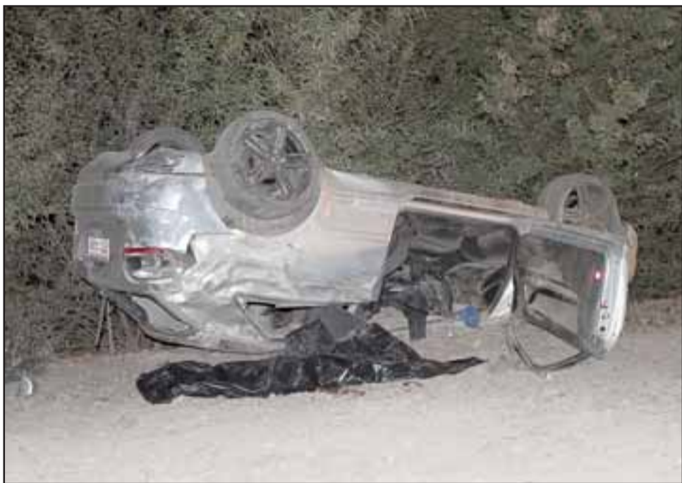
El automóvil marca Audi terminó volcado de campana, arrebatando la vida de la joven en el mismo lugar de los hechos.