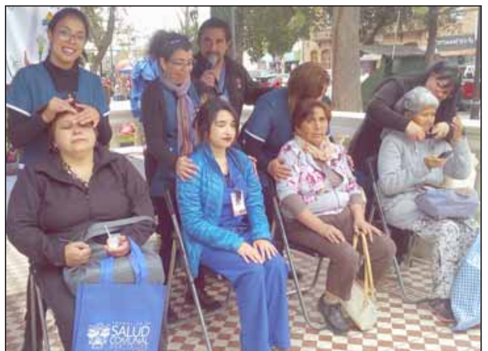
BIEN TRATADAS. - Ellas se dejan regalinear por las profesionales de SER San Felipe, aquí las vemos trabajando en nuestra Plaza de Armas.