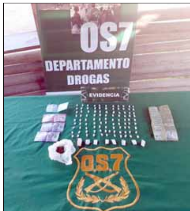
Personal del OS7 de Carabineros incautó pasta base de cocaína y marihuana desde el domicilio de los condenados el año 2017.