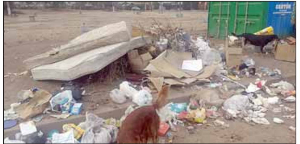
Acá podemos apreciar la gran cantidad de basura alrededor del contenedor del Punto Limpio, donde incluso se pueden ver hasta colchones.

Entre la basura recogida habían hasta colchones que fueron dejados por personas inescrupulosas que lamentablemente no entienden el tema del reciclaje.