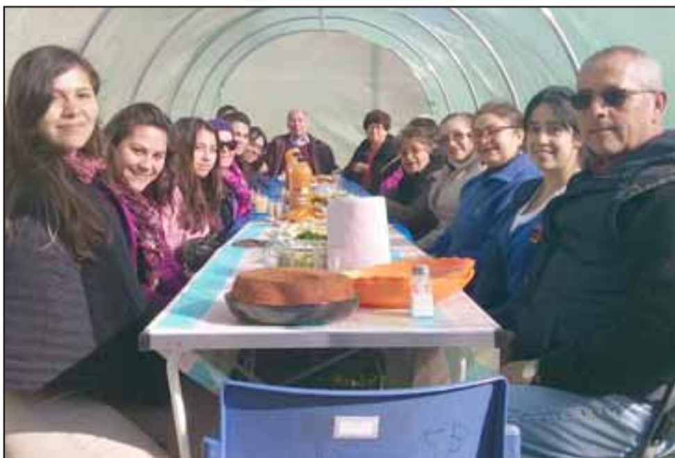
HUERTOS SALUDABLES. - También hay un taller de Huertos Saludables, aquí vemos a varios de sus participantes.