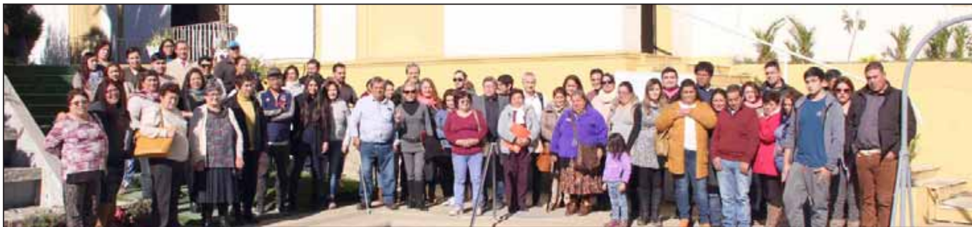
Estas instancias permiten a los dirigentes aclarar dudas y recibir información directa sobre temas que son relevantes en sus comunidades.