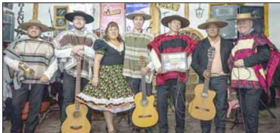
Raíces de Casuto, uno de los grupos invitados a la celebración del Día del Cuequero y la Cuequera.

La celebración en esta ocasión se realizará con una caravana de cuequeros llamada 'La Travesía del Cuequero' el día 6 de julio y que comenzará en Putaendo en la Plaza Prat a las 10 de la mañana, «en donde también se nos sumarán los amigos de la agrupación de 'Cuequeros de Putaendo', para luego dirigirse hasta Rinconada de Putaendo, en donde se estará cantando y bailando a las 11 de la mañana en la Plaza Fernando Aldunce, para luego dirigirse hasta la Plaza de Armas de San Felipe, en donde se estará bailando y cantando cuecas a las 12:30 en calle Salinas, para luego cerrar la caravana en Rinconada de Los