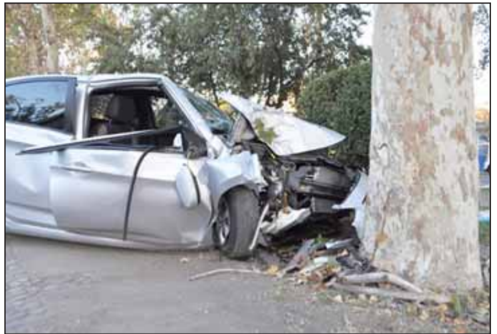
De este vehículo sustrajeron estos deshonestos empleados algunas herramientas que no les pertenecían, fueron pillados en el acto.

Los detenidos fueron identificados como J.A.G.T. , de 25 años y