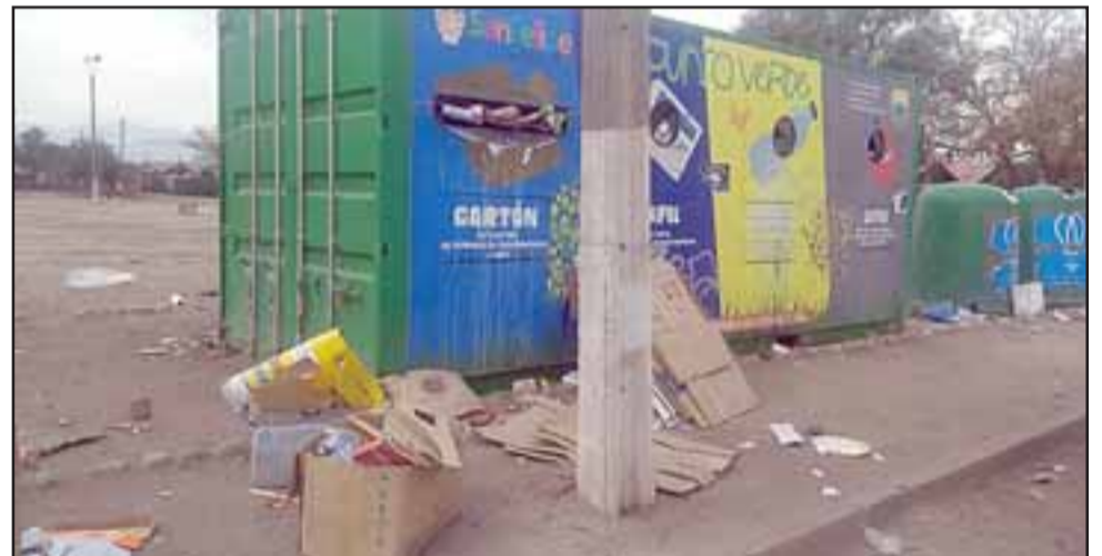
Cartones que están alrededor del punto limpio como se aprecia en la imagen.