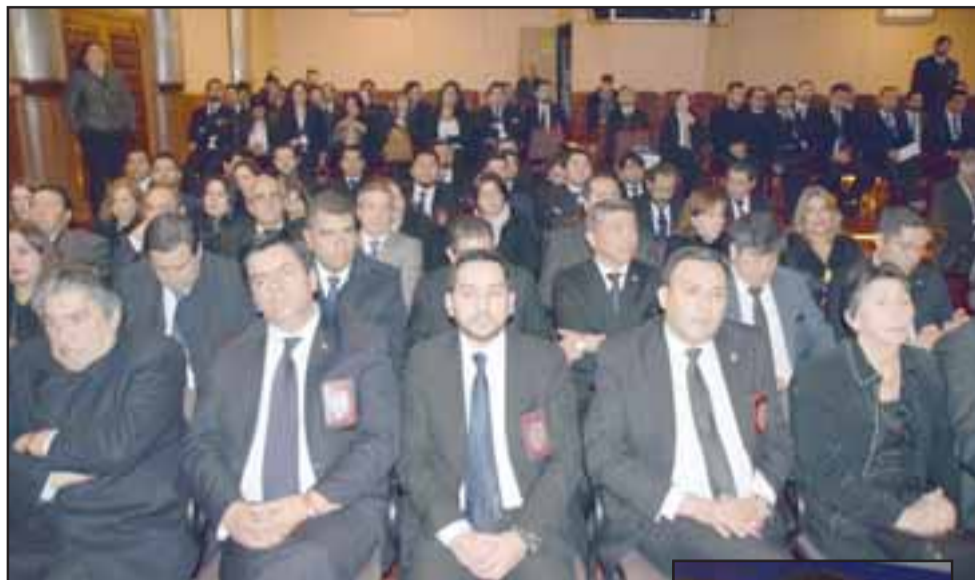
HOMENAJEADOS. - Ellos son parte del contingente de Detectives en Condición de Retiro, quienes ayer fueron homenajeados en el Teatro Municipal de San Felipe.

y felicidad en este día especial, donde homenajeamos a nuestros oficiales en condición de retiro, que entregaron todo su trabajo para cimentar lo que hoy día somos como institución, el estar en la mejor valoración ciudadana en cuanto a desempeño, sin duda que tiene sus bases en el trabajo que ellos aportaron en su tiempo, hoy día