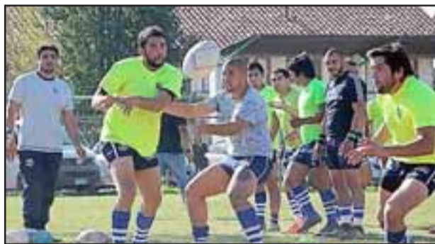
Los Halcones de Aconcagua sufrieron una ajustada e inesperada caída en la cuarta fecha del Central A de Arusa.