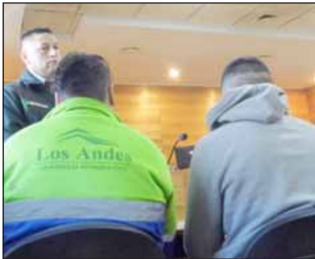
Los detenidos fueron identificados como J.A.G.T. , de 25 años y O.I.M.A. , de 19, ninguno de los cuales registra antecedentes penales anteriores.

dos Unidades Tributarias mensuales. Es por esta razón que se fijó una nueva fecha para la realización del procedimiento correspondiente, quedando en libertad.