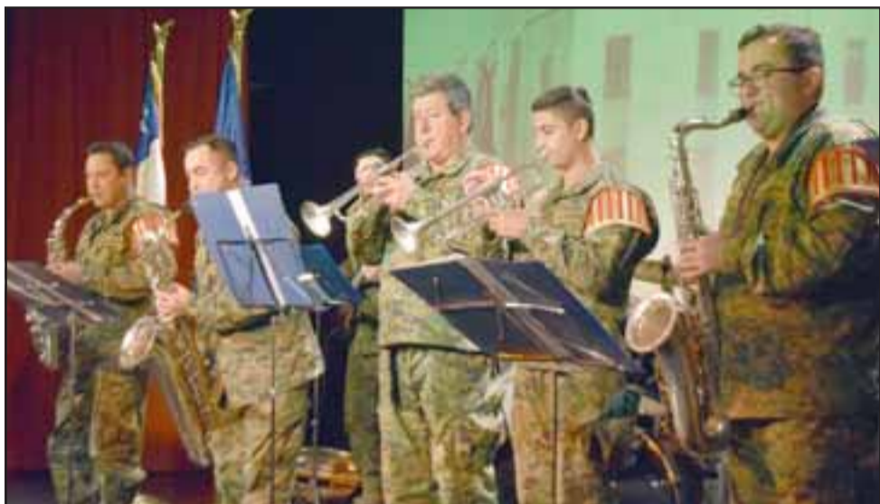
TREMENDA PRESENTACIÓN. - La Banda Instrumental del Regimiento Yungay N°3, de Los Andes, interpretó selectos temas musicales para el deleite de los homenajeados y autoridades invitadas.

les reconocemos a ellos ese trabajo y esfuerzo con este pequeño homenaje pero significativo, toda vez que al cumplir este aniversario número 86 es que estamos haciendo todas estas actividades que nos permiten interactuar con ellos, no olvidarlos, saber que siempre están con nosotros, un detective puede jubilar de