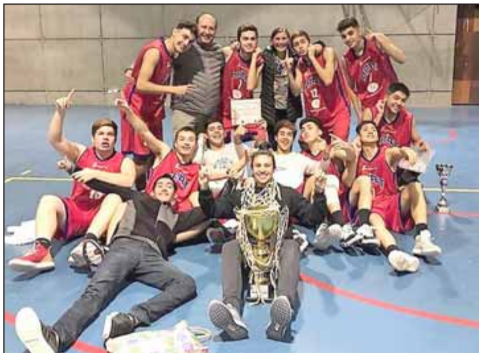
El equipo juvenil del Prat ganó de manera invicta un torneo internacional en Porvenir.