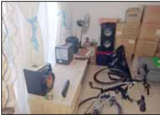
Los delincuentes buscaban dinero y especies

Carabineros logró detener a uno de los asaltantes