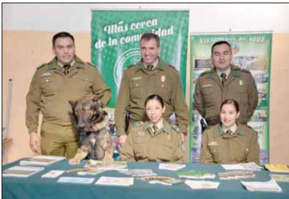
SIEMPRE CARABINEROS.- La Oficina de Integración Comunitaria de la 2ª Comisaría de Carabineros San Felipe también se hizo presente en esta oportunidad.