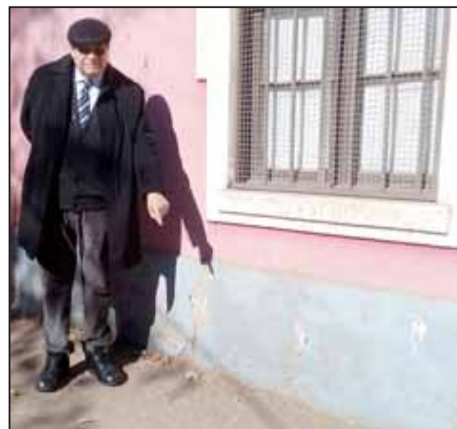
Acá vemos al Core apuntando el lugar que desea se proteja y que está tapado por la tierra.

«En relación a los trabajos que se están realizando en la calle 5 de abril al llegar a Riquelme me permito solicitar su intervención en el resguardo de los vestigios urbanísticos del comienzo