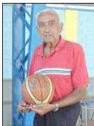
Durante el sábado y domingo próximos se realizará un cuadrangular en homenaje a Samuel Tapia Guerrero.

Damas: Arturo Prat, Fénix de El Bello, Lo As de Calle Larga y Frutexport.