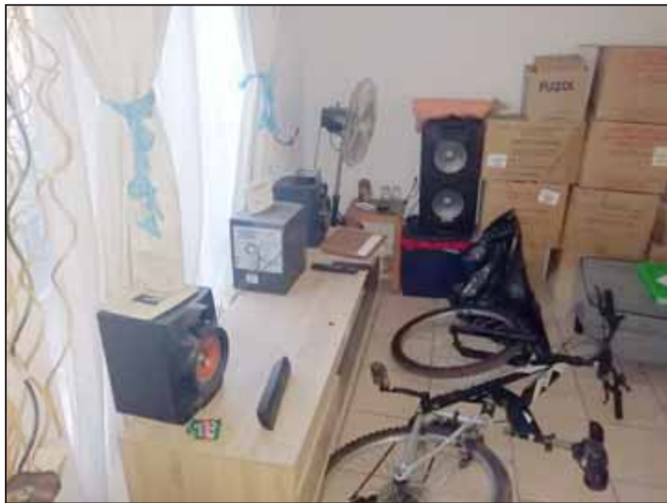
Los asaltantes irrumpieron en una vivienda de la Villa El Carmen de San Felipe en búsqueda de dinero.

Finalmente dicha especie fue reconocida por la víctima de la vivienda asaltada, siendo regresada a su verdadero propietario de la