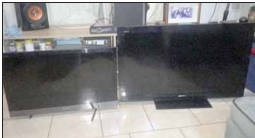
Finalmente las especies sustraídas fueron regresadas a su propietario.