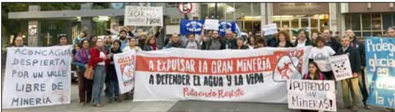
Pese al rechazo que la comunidad de Putaendo ha expresado a la minería y a Vizcachitas Holding, la empresa continúa adelante con sus proyectos, sin que las leyes de este país puedan evitarlo.