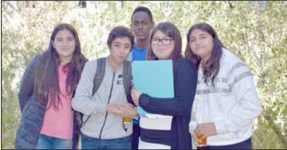
El Consejo Consultivo que es integrado por niños, niñas y adolescentes de la comuna tuvo una activa participación en la elaboración del diagnóstico de infancia.

desarrolladas con profesionales de la red de infancia, salud, educación, autoridades locales, y diversos actores comunitarios que permitieron el levantamiento de información relevante con respecto a la realidad local de la Infancia en la comuna, desde una metodología participativa, donde los niños fueron los principales informantes de su propia realidad local.