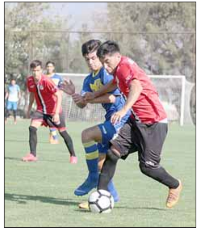
Las series inferiores del Uní Uní enfrentaron a sus similares de tres clubes durante el fin de semana pasado.

Fútbol Joven Sábado 8 de junio Estadio San Bernardo de Mallea U16: Melipilla 3 – Unión San Felipe 1 U15: Melipilla 1 – Unión San Felipe 2 Domingo 9 de junio Complejo Deportivo USF U19: Unión San Felipe 4 – Melipilla 1 U17: Unión San Felipe 0 – Melipilla 1