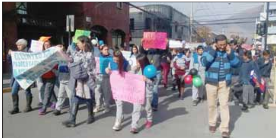
La comunidad educativa del Colegio Buen Pastor salió a la calle a marchar por el centro de San Felipe, para expresar su preocupación y exigir respuestas claras respecto al futuro del colegio.

- Exactamente, hoy día y por primera vez desde