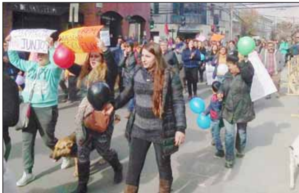
Apoderados también se unieron a profesores, alumnos y auxiliares para manifestarse, conformando una columna importante de personas.

hace tres años se ven luces claras de parte del municipio de movernos a algún lugar.