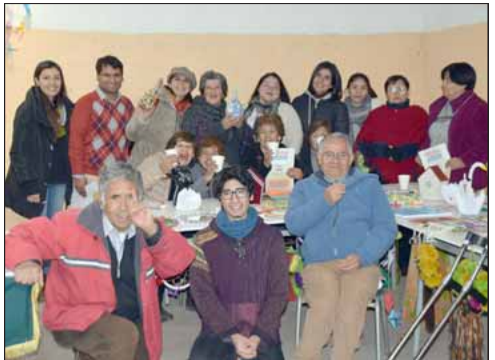
TRABAJO VECINAL.- Ellos son parte del voluntariado que trabajó en este operativo, junto a vecinos que llegaron a recibir atenciones.