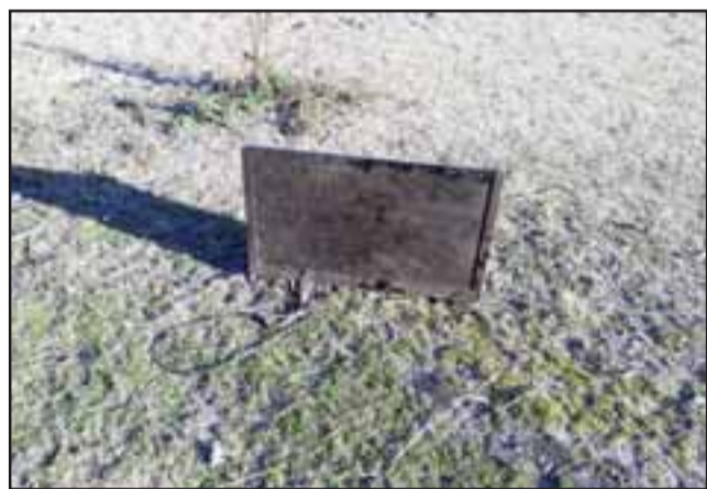
Carabineros recuperó este televisor Led que dejó abandonado uno de los delincuentes en medio de unos matorrales en el sector de la línea férrea de San Felipe.