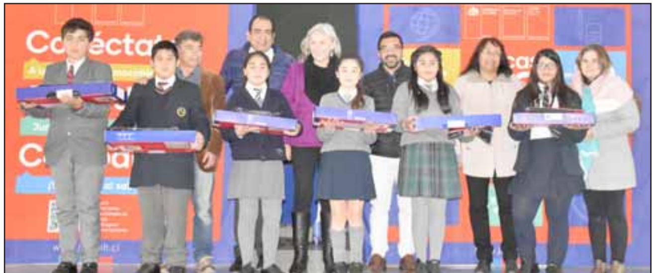
Estos jóvenes tienen ahora mejor acceso al mundo digital, así mejoran sus conocimientos. Además, este programa considera la entrega de una pulsera-reloj de medición de actividad física.

«Estamos contentos como municipio, en mi caso como dueño de casa que nuestros jóvenes de escuelas públicas como particulares subvencionadas en-