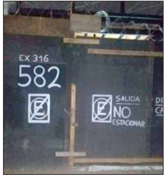
El sujeto pretendía ingresar hasta la propiedad en construcción ubicada en la avenida Chacabuco N° 582 en San Felipe en horas de la madrugada de ayer miércoles.