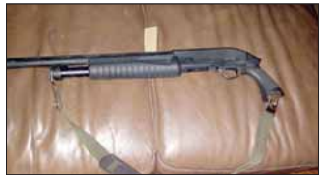
Carabineros en aquella oportunidad incautó la escopeta de propiedad de la víctima.