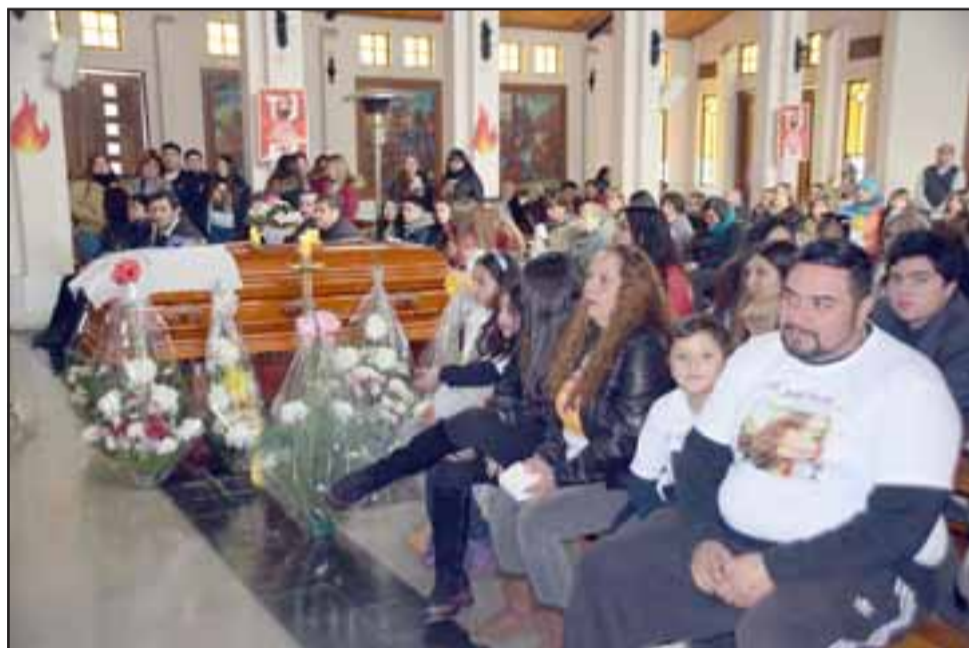
FAMILIA DERRUMBADA.- Por más oraciones, plegarias y palabras de consuelo dichas por el sacerdote en la Misa, cada uno no pudo menos que llorar amargamente la partida de la joven sanfelipeña.