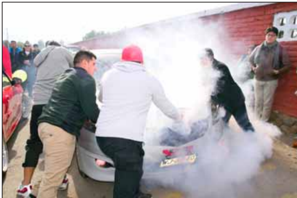
HUMEANTE DESPEDIDA.- Las llantas de los autos echaban fuego y humo, los motores rugían en honor a la chica que voló al Más Allá.