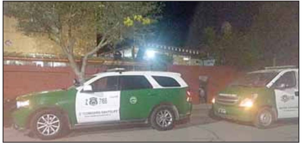
El hecho ocurrió en esta vivienda ubicada en la Villa Las Palmeras de la comuna de Llay Llay el 24 de agosto del año pasado.