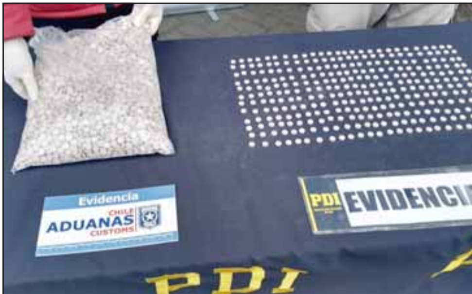
Esta es la tercera incautación de Éxtasis realizada este año en Los Libertadores y representa un incremento del 500% en la detección de este tipo de droga respecto del año pasado.

esta ciudadana española estuvo explorando diversas rutas con la finalidad de poder llegar a Chile».