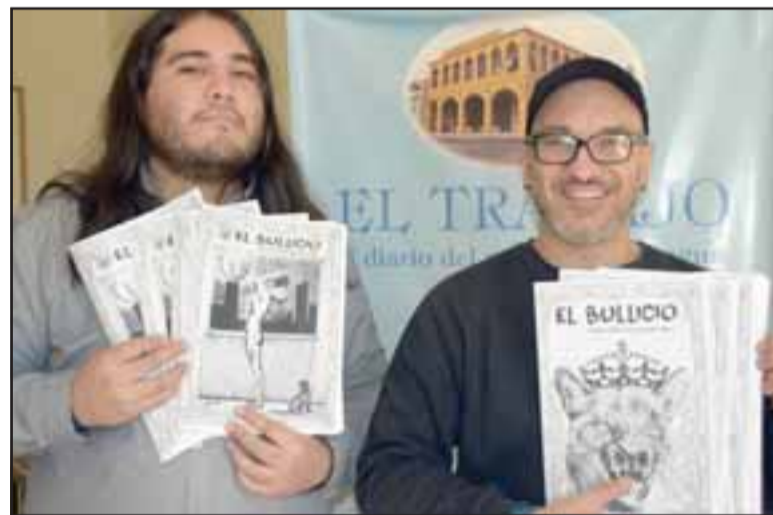
SUS CREADORES.- Los dos escritores visitaron nuestra Sala de Redacción ayer miércoles para dar a conocer la revista que será lanzada este viernes y sábado en San Felipe.