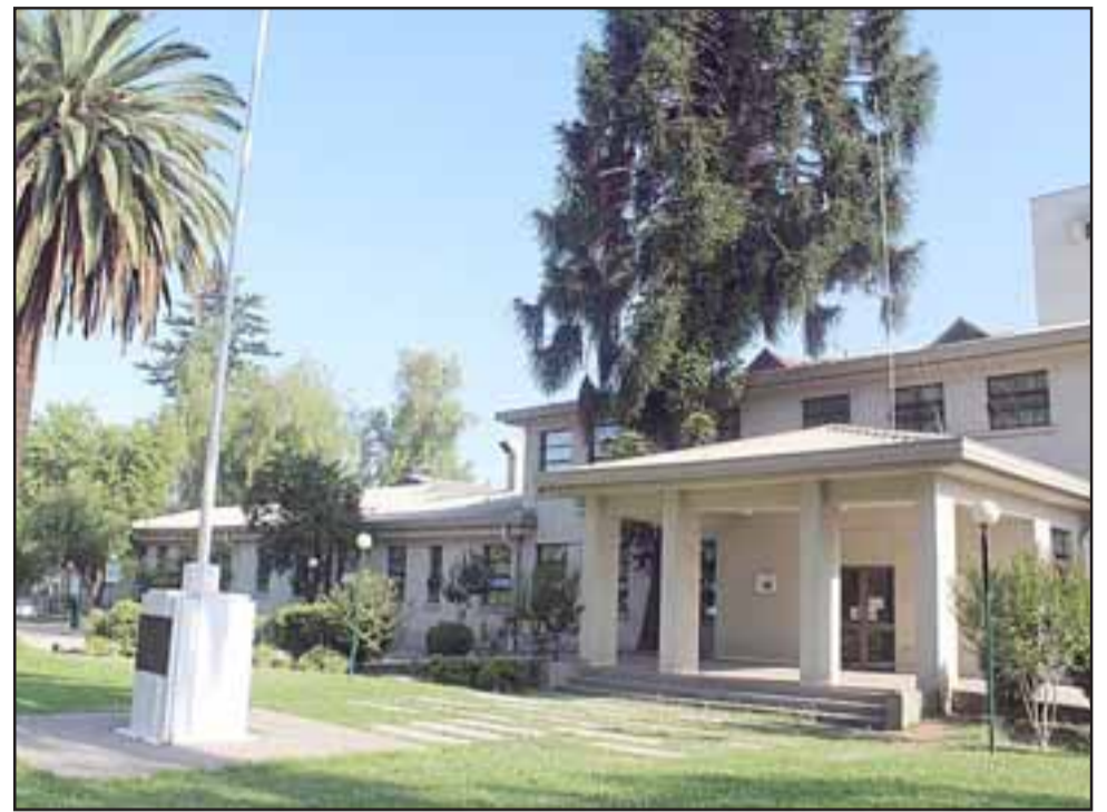
A través de una declaración pública la dirección del Hospital de Los Andes descartó el cierre del Servicio de Pediatría.

«Esta medida obedece a que dicho establecimiento cuenta además con una Unidad de Cuidados In-