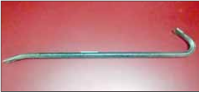
Carabineros incautó este diablo metálico que mantenía el sujeto al momento de la detención.