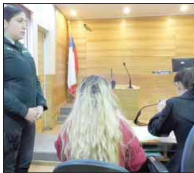
La joven de 19 años de edad, de nacionalidad española, tenía residencia en Londres e ingresó al país proveniente de Mendoza.

El jefe de la Brigada mencionó que esta droga venía directamente desde España, específicamente de la ciudad de Barcelona y su destino era nuestro país, «y