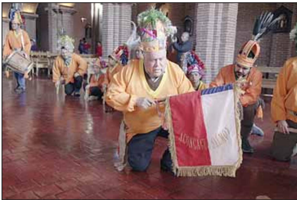
LOS ANFITRIONES.- Este domingo 16 de junio se estará celebrando la fiesta en honor a Nuestra Señora de la Madre Tierra 2019, la que también se instala como la Fiesta Patronal del Baile Chino Aconcagua Salmón.

En la actividad se dispondrá de una feria ecológica y artesanal y food-trackS, que permitirán atender a los visitantes de esta actividad, que pretende ser un encuentro espiritual en torno a la devoción, evidenciando la fuerza del mestizaje que ha permitido la sobrevivencia de los bailes originarios de nuestro territorio a través de este sincretismo religioso.