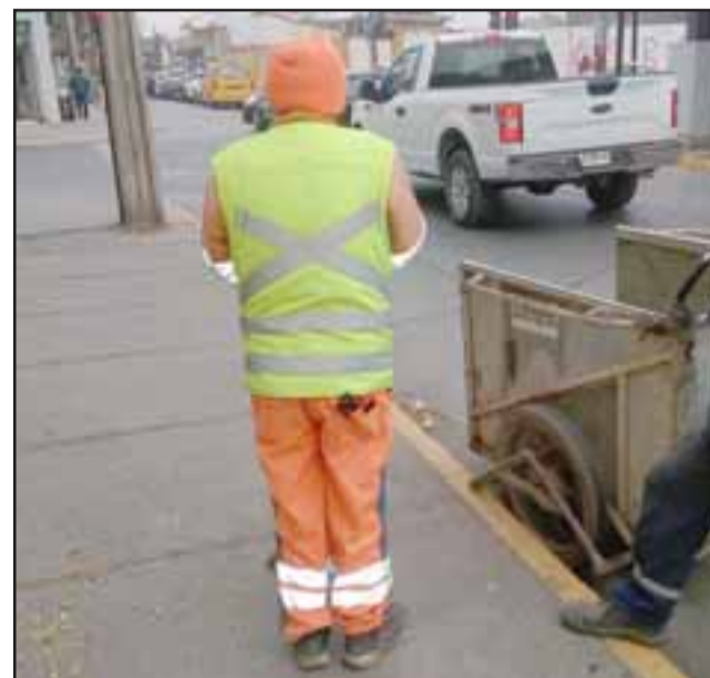
El barredor afectado, quien por temor a represalias pidió no ser identificado.

- Fui a hacer la denuncia a Carabineros, el joven que estaba en la plaza llamó a Carabineros, llegaron a Traslaviña y de ahí me fui a