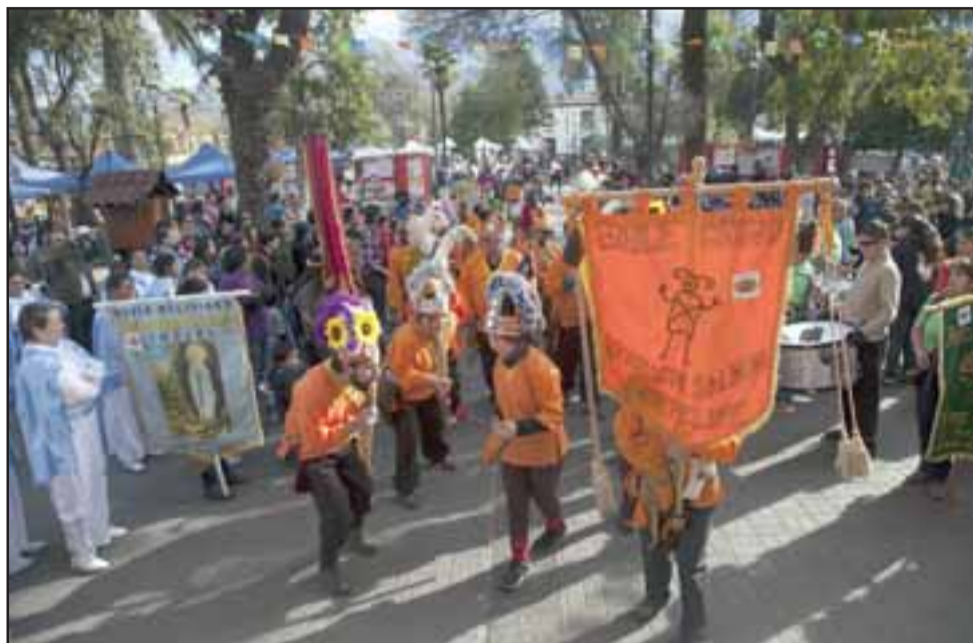
LA FIESTA GRANDE.- Mucho fervor religioso es el que se vivirá este domingo en El Almendral, cuando desfilen en sus calles decenas de bailes chinos.

ya, junto al Baile Aconcagua Salmón, participarán también los bailes chinos Valle Alegre de Calle Larga; Niño Dios y Piedra de La Santa, de Llay Llay, Pectorquita de La Calera, Adoratorio Cerro Mercachas, de Los Andes, San Victorino de San Felipe y los bailes danzantes Morenada Jesús Misericordioso de Algarrobal, y Tinkus Kallpa Akonkawua. Asimismo se espera la participación de cuasimodistas de Almendral y de Quebrada Herrera.