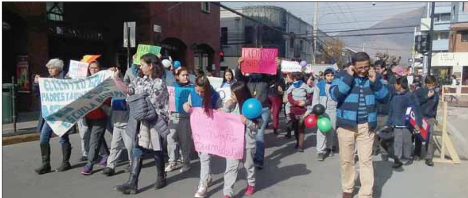
Esta marcha realizada el día martes al parecer está surtiendo efecto.