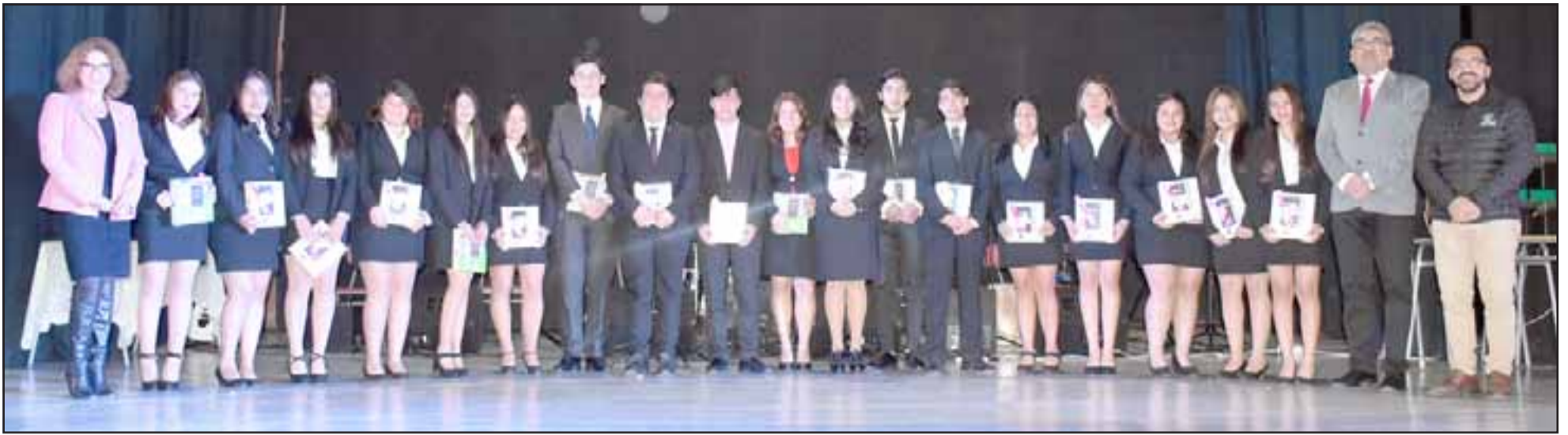
Estudiantes de las carreras técnico profesionales recibieron del DAEM diversos implementos para su desempeño y como estímulo para concretar su especialidad.