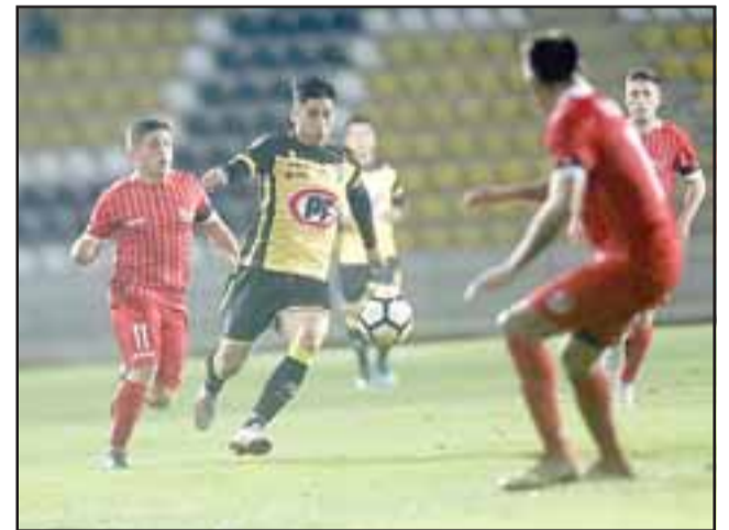
Unión San Felipe se metió en los octavos de la Copa Chile tras eliminar sin problemas a Coquimbo Unido.

Para la ronda de los 16 mejores, los de Corengia tendrán la ventaja de cerrar en casa la serie ante los itálicos. El primer partido debería jugarse en La Florida el 15 o 16 de julio, mientras que la revancha será en el estadio Municipal, el 22 o 23 del presente mes.