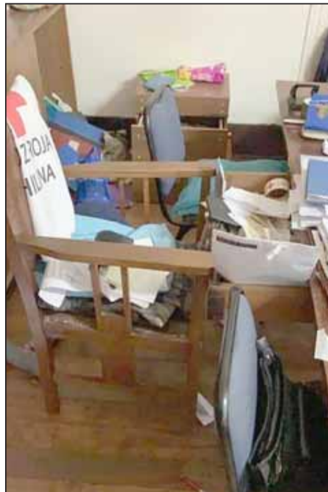
El sujeto ingresó a las oficinas de la Cruz Roja San Felipe en búsqueda de dinero.