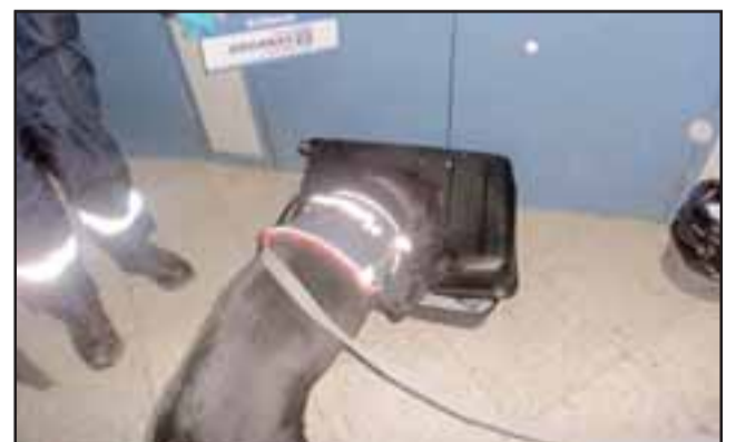
La mujer identificada con las iniciales E.C.P.M. , de 27 años, iba como pasajera a bordo de un bus de la empresa Cata y durante la revisión de su equipaje mediante el escáner de aduana, se detectaron bultos extraños en su maleta.

La mujer fue puesta a disposición del Tribunal de Garantía de Los Andes y formalizada en audiencia privada por el delito de Tráfico de drogas. Por la gravedad del delito se decretó en su contra la medida cautelar de Prisión Preventiva por los seis meses que se fijó de plazo para el cierre de la investigación.