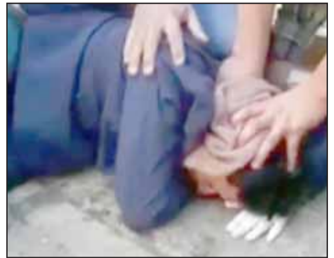
A través de redes sociales se viralizó el video de la detención ciudadana del sujeto, quien fue acusado de agredir a una mujer en las afueras de un supermercado de Calle Merced con Toro Mazote.

El imputado fue identificado con las iniciales N.A.M.M. , de 25 años de edad y vecino de San Felipe, desconociéndose hasta