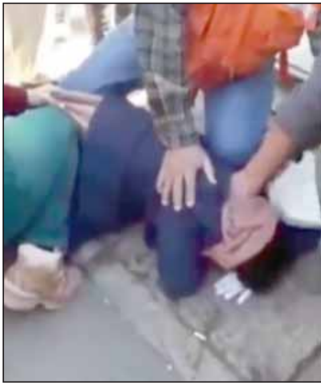
El grupo de transeúntes mantuvo al sujeto inmovilizado para ser entregado a Carabineros al mediodía de este viernes.

Los testigos dieron aviso a funcionarios de Carabineros, quienes procedieron a la detención del imputado.