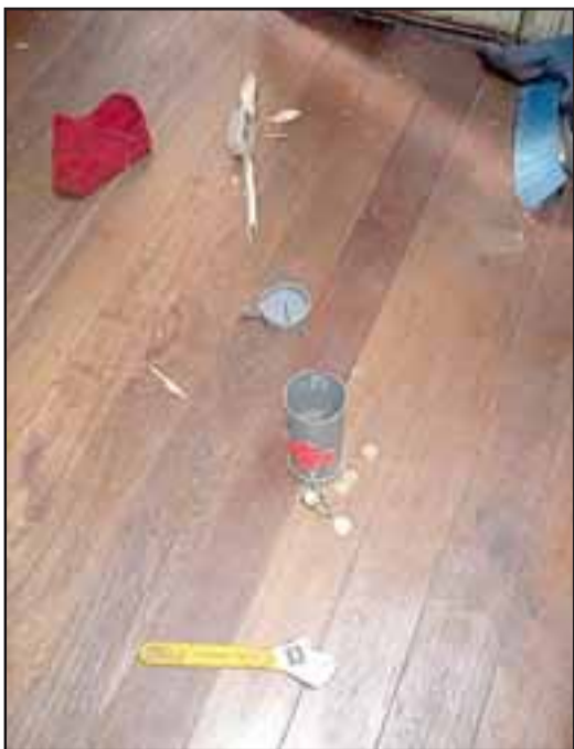
Voluntariado avaluó los daños ocasionados en la suma de $250.000.