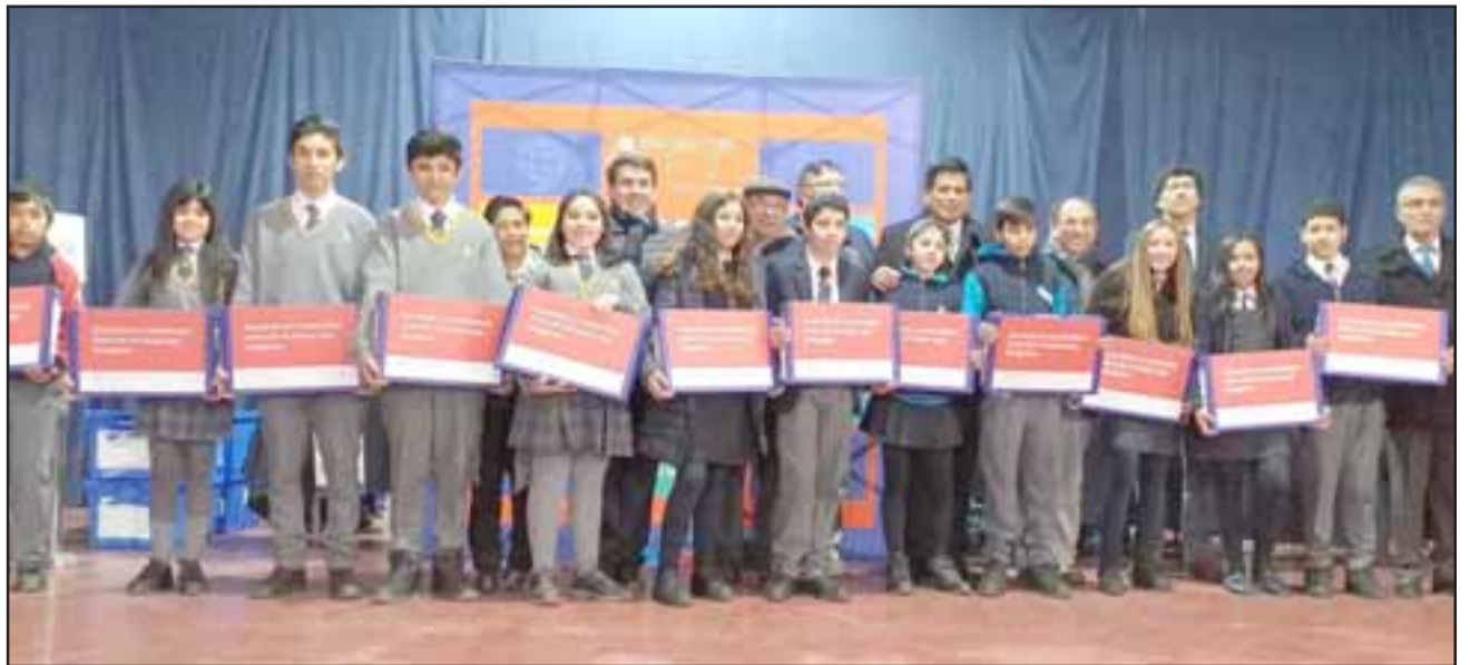
Un total de 78 estudiantes de la comuna de Santa María recibieron un nuevo computador con conexión a internet a través de los programas 'Yo elijo mi PC' y 'Me conecto para aprender', de Junaeb.