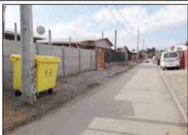
De acuerdo a lo manifestado por el Gerente de la Corporación de Fomento Productivo de Panquehue, la iniciativa tiene como objetivo facilitar el acopio de residuos sólidos.

participativos y cambio de luminarias al sistema Led, sin duda, hemos mejorado la calidad de vida a todos nuestros vecinos de este sector».