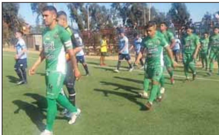
Trasandino no pudo sumar ante Provincial Ovalle en la fecha pasada del Torneo A de la Tercera División.