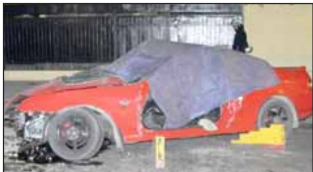
En la intersección de esa arteria con Calle Lagarrigue colisionaron este automóvil Honda que iba de oriente a poniente con un Hyundai que venía en sentido opuesto.

LOS ANDES.- Una persona fallecida y cuatro heridos de diversa consideración dejó como la saldo la colisión frontal de dos automóviles ocurrida la madrugada de este sábado en Calle Esmeralda Poniente. De acuerdo a los antecedentes preliminares, el accidente se registró sólo minutos después de las 0:00 horas, cuando en la intersección de esa arteria con Calle Lagarrigue colisionaron un auto-