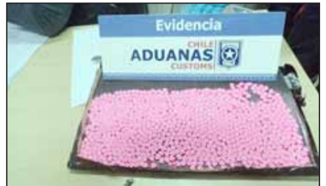
Este can entrenado dio en el blanco cuando marcó esta maleta como positivo para sustancias ilícitas.

Este año Aduanas en conjunto con la PDI de Los Andes han realizado cuatro procedimientos similares en el paso fronterizo Los Libertadores, logrando decomisar en el primero 2.356 unidades de éxtasis, luego 2.010 pastillas y 9.893 el martes pasado. De esta forma, a la fecha el Servicio ha interceptado en total 22.140 dosis de MDMA.