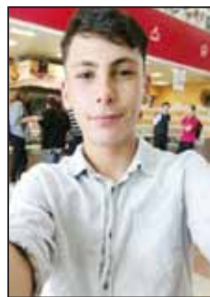
Una de las últimas fotografías que alcanzó retratar antes de su asesinato el 16 de junio del 2018.

- No, porque yo no soy nadie para perdonar, solamente Dios perdona, porque realmente lo que él hizo no tiene perdón de Dios, porque fueron tres heridas, la primera defensiva en la mano, no conforme con eso le perforó el pulmón y no conforme con eso en el tórax, la tercera herida fue la mortal. Por muy drogado que haya estado no se iba a dar cuenta lo que hizo, ¿por qué andaba con esa navaja? ¿Para partir una fruta, un pan? (...) El daño que él me hizo, me cagó la vida para siempre, mi único hijo por lo que más vivía, le den cadena perpetua, eso no me va a devolver a mi hijo. Si te pones a pensar son 10 años, a los 5 años ya va estar afue-