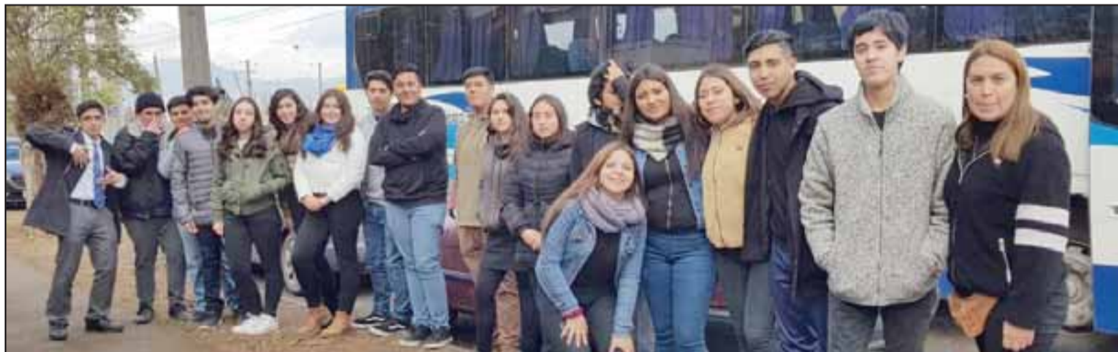
Los alumnos del Liceo Politécnico son los más contentos con esta gran oportunidad de ingresar a la educación superior. Ya comenzaron a viajar a Valparaíso para ser parte de esta novedosa iniciativa.

En cuanto a los alcances de este acuerdo, 22 alumnos se inscribieron para participar en este acompañamiento de la Facultad de Ingeniería de la Upla en Valparaíso, que incluye las carreras de Ingeniería Civil Industrial, Ambiental y Programación. En tanto, con el Campus San Felipe son 28 los alumnos que participan en este acompañamiento.