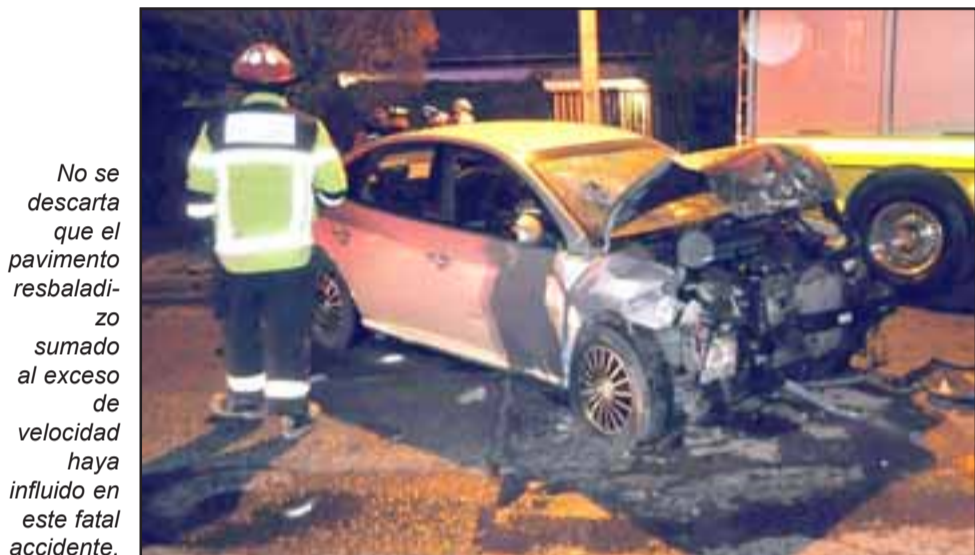
No se descarta que el pavimento resbaladizo sumado al exceso de velocidad haya influido en este fatal accidente.

El docente fallecido había sido reconocido como Andino Destacado por la Municipalidad de Los Andes el año 2018 y en 2017 fue premiado como uno de los mejores profesores de Chile en el concurso Global Teacher Prize.