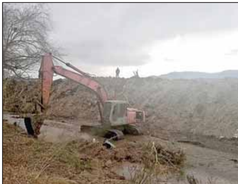
Entre las labores, destacan las más de 450 horas de trabajo de las máquinas retroexcavadoras para retirar desperdicios y despejar los esteros y que podrían afectar el normal curso del agua.