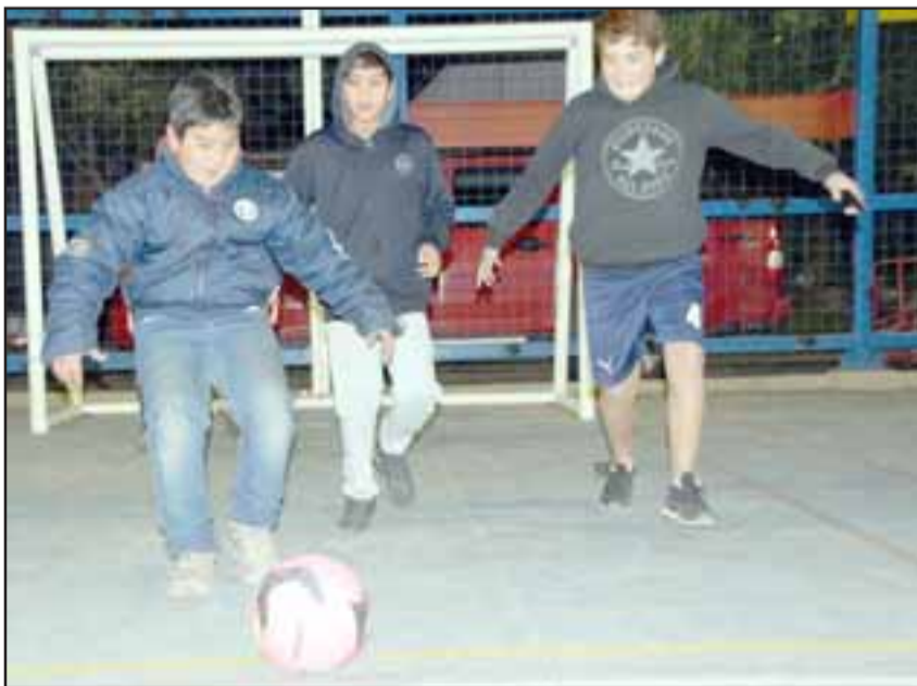
No suelten el balón.- Esta es la gran sonrisa de estos jóvenes de Las 4 Villas, ahora que tienen su propia multicancha.