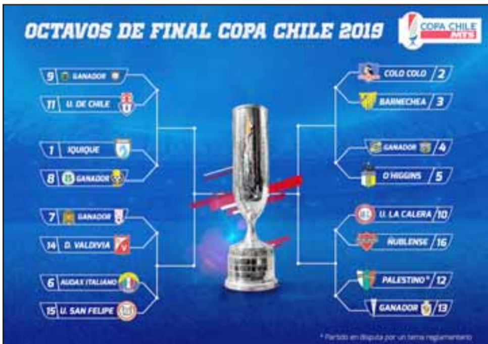
Este es el cuadro final desde octavos hasta la final de la Copa Chile 2019.