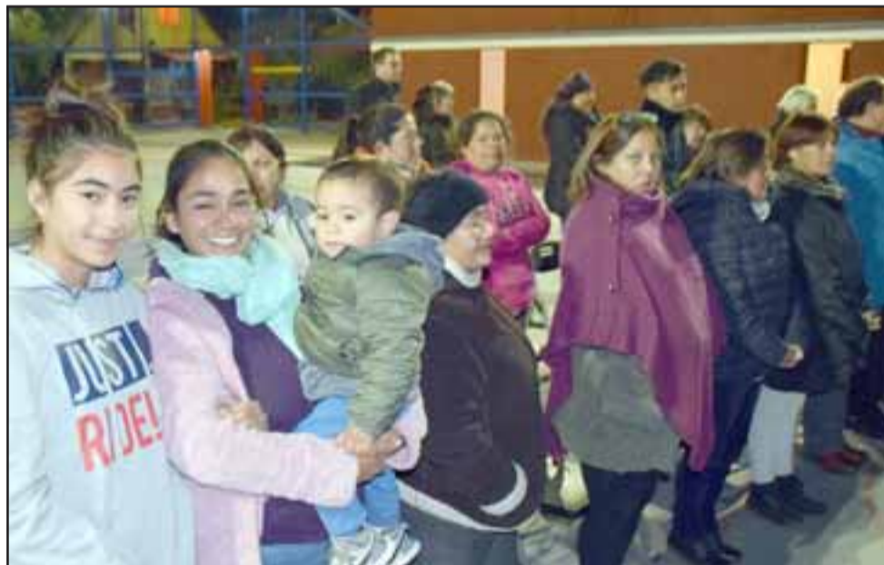
ELLOS SON LOS DUEÑOS.- Aunque con mucho frío, familias enteras permanecieron durante toda la ceremonia a fin de recibir su multicancha de forma oficial.