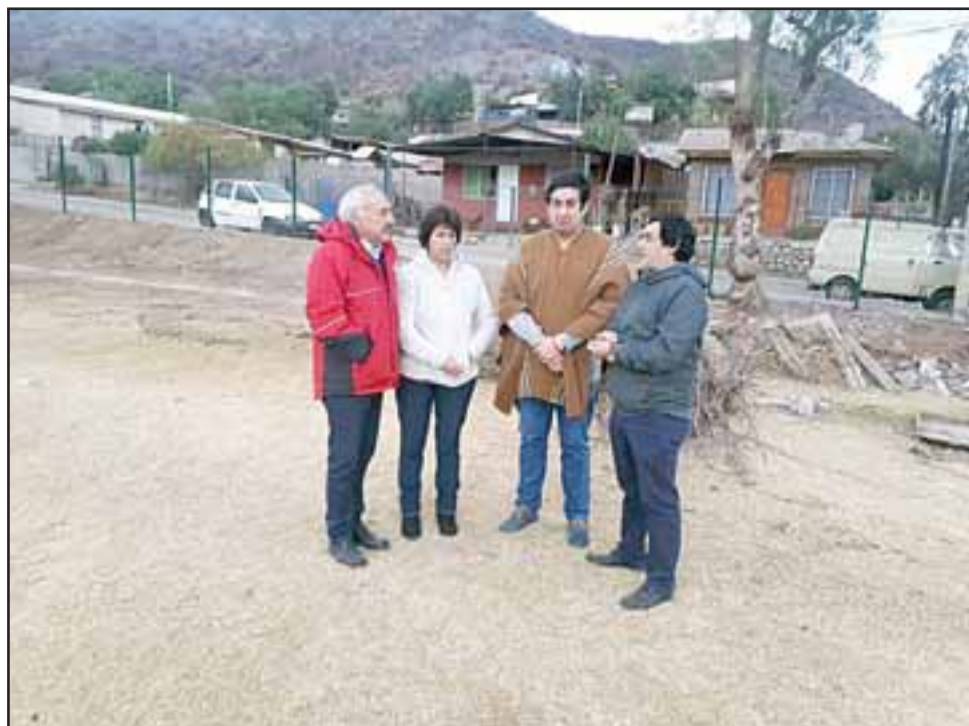
Autoridades municipales visitaron el terreno donde está la obra que forma parte de distintas inversiones ejecutadas en Algarrobal, estas incluyen pavimentos participativos y recambio de luminarias.