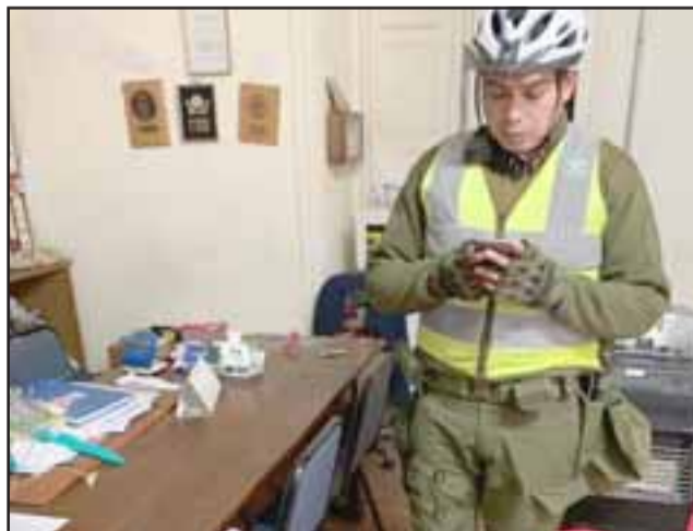
El hecho fue denunciado ante Carabineros de San Felipe.