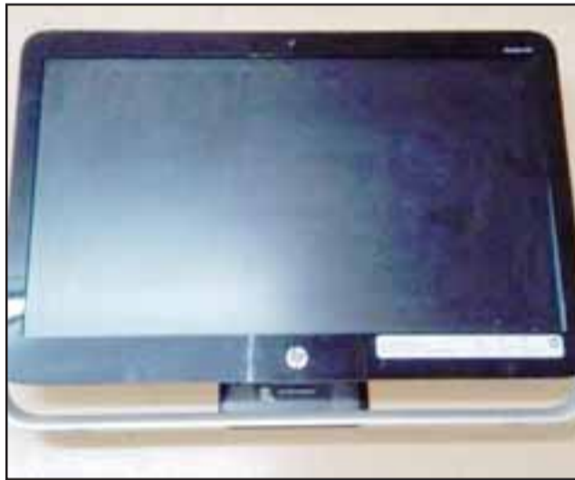
Carabineros logró recuperar esta pantalla de un computador.

Carabineros capturó a un antisocial manteniendo una pantalla de computador oculto bajo un automóvil.