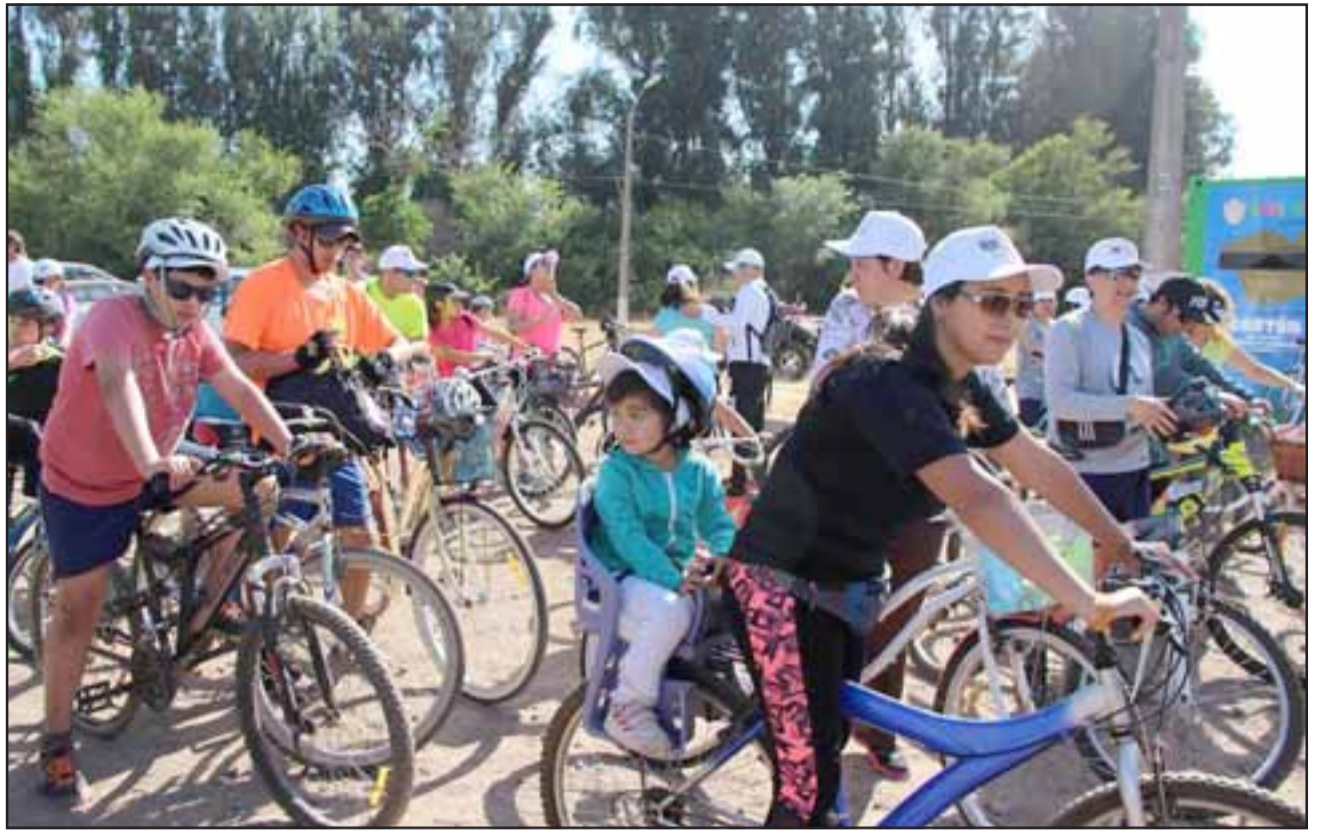
La actividad es completamente gratuita, no competitiva y dirigida a las familias a las que se invita a vencer el frío y participar de la cicletada.

Las inscripciones comenzarán a partir de las 9 de la mañana, por lo que insistieron en que los interesados lleguen temprano, para no entorpecer el proceso de largada. Además, contará con la presencia de diversos servicios que estarán realizando