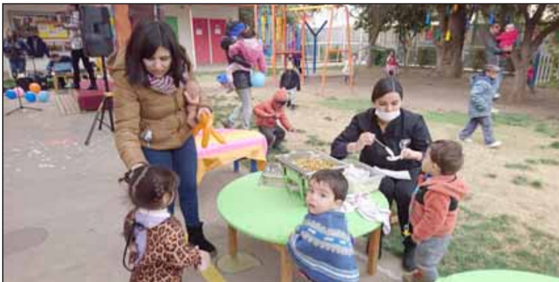
RECARGANDO ENERGÍAS.- Y sobre comer no se diga, ricas ensaladas y bebidas saludables también hubo para todas las edades.