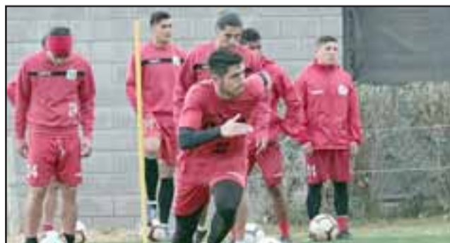
Después de cinco días de descanso, este miércoles Unión San Felipe retornó a los entrenamientos.

El estratega informó además la cantidad de partidos de ensayo que se harán durante este periodo. «La idea es que se jueguen tres, ya que a esos hay que agregarle los dos por la Copa Chile, entonces tendríamos la cantidad ideal (5) para llegar al reinicio del torneo», finalizó.