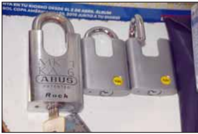
TRABAJA PARA EL LADRÓN.- Tuvo que invertir $60.000 en estos nuevos candados, así ha ocurrido por sexta vez.