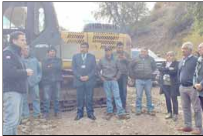
El gobernador Claudio Rodríguez junto al director regional de Indap, Fernando Torregrosa, acompañados del consejero regional Iván Reyes, el alcalde Claudio Zurita y representantes de los regantes y juntas de vecinos de Jahuelito y Santa Filomena, conocieron en terreno el avance de las obras.

Por su parte, el presidente de la Comisión de Recursos Hídricos del CORE, Iván Reyes , expresó que «esta obra es una de las más grandes que hemos hecho a través del convenio GORE-Indap. Las obras están próximas a concluir y esperamos desarrollar en el convenio seis un segundo embalse en este mismo sector con una capacidad de 20 mil metros cúbicos, lo que permitirá acumular casi 40 mil metros cúbicos, lo que dará seguridad de