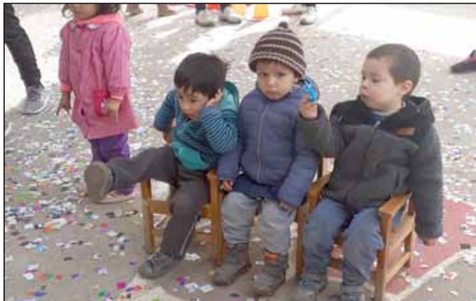
QUE SIGA EL CARNAVAL.- Algunos bailaban sentados en su silla, estaban cansados de tanta fiesta, pero no querían parar de jugar.