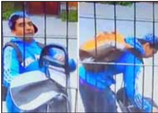
Doce años de cárcel deberá cumplir delincuente

Fue sentenciado a 12 años de prisión efectiva