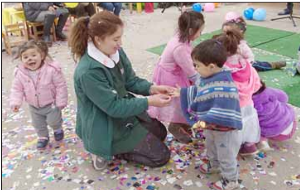
TRABAJO EN EQUIPO.- Las parvularias se recargaron el miércoles de trabajo, pero lo hicieron todas y con mucha alegría.