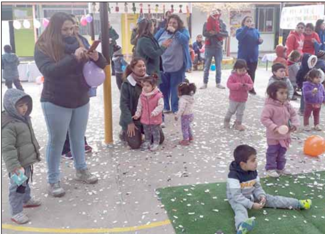
FIESTA EN BLONDÍN.- Estos chiquitines vivieron su gran carnaval infantil en el patio de su Jardín, comidas, chaya y buena música estuvieron a la orden del día.