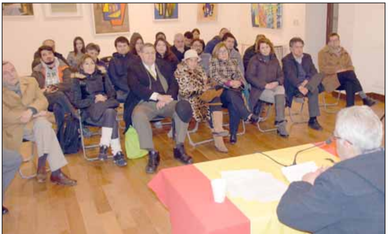
FAMILIA MONTENEGRO. - Ellos son familiares directos y extendidos del insigne periodista, quienes se mostraron satisfechos por los homenajes que el Municipio viene desarrollando sobre su antepasado.