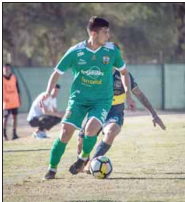
Los andinos enfrentarán en el Regional a uno de los equipos más potentes de la categoría.