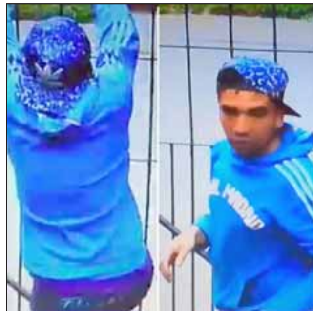
El antisocial al momento de ingresar a una vivienda ubicada en la Villa Aconcagua de San Felipe.