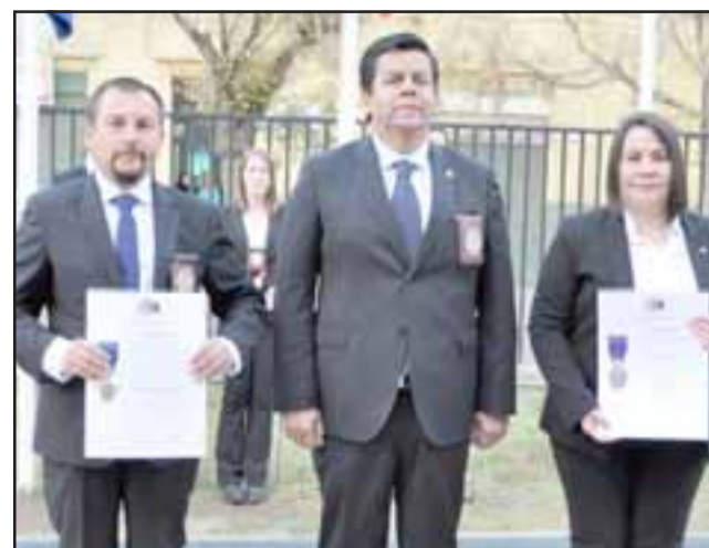
Varios fueron los investigadores y comisarios destacados en la ceremonia del 86º aniversario de la PDI, en Los Andes.

«Somos una de las instituciones más creíbles del país. Esto no es tarea fácil, ya que debemos responder a ese reconocimiento con trabajo, dedicación, esfuerzo y efectuando labores para la ciudadanía, logrando resultados en la investigación de los delitos, ser colaboradores con el Ministerio Público y cooperar con la seguridad ciudadana»,