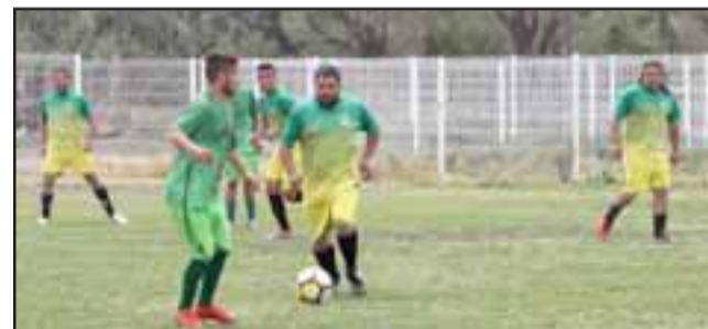
De no haber lluvia este domingo se jugará la fecha cuarta del torneo de la Asociación de Fútbol de San Felipe.

Sábado 22 de junio, desde las 13:00 horas en adelante: