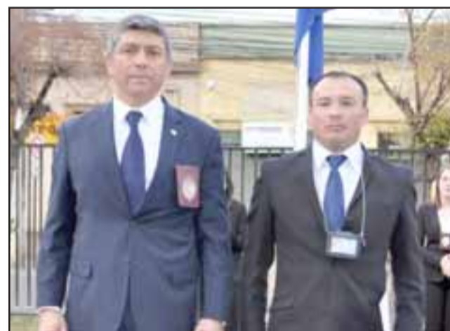
En su momento se resaltó el trabajo del personal y brigadas especializadas de la Prefectura.

«El trabajo que desempeñan es de lo más valioso y que rescatamos dentro del esfuerzo permanente en la lucha contra la delincuencia», señaló la autoridad.