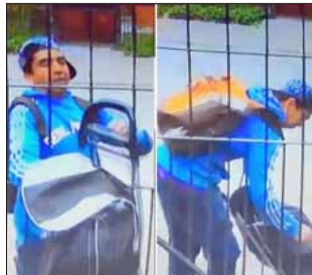
El delincuente llevándose consigo las especies sustraídas desde el mismo inmueble en la Villa Aconcagua.