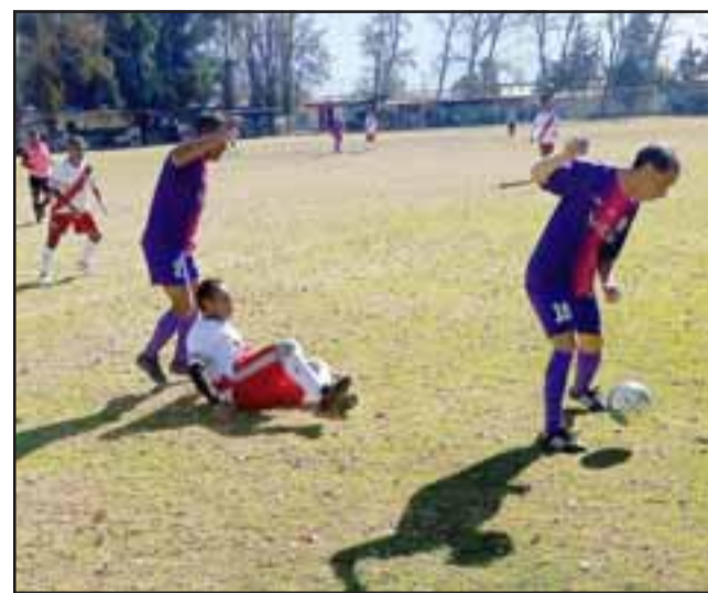
Este domingo volverá a rodar el balón en la cancha Parrasía.