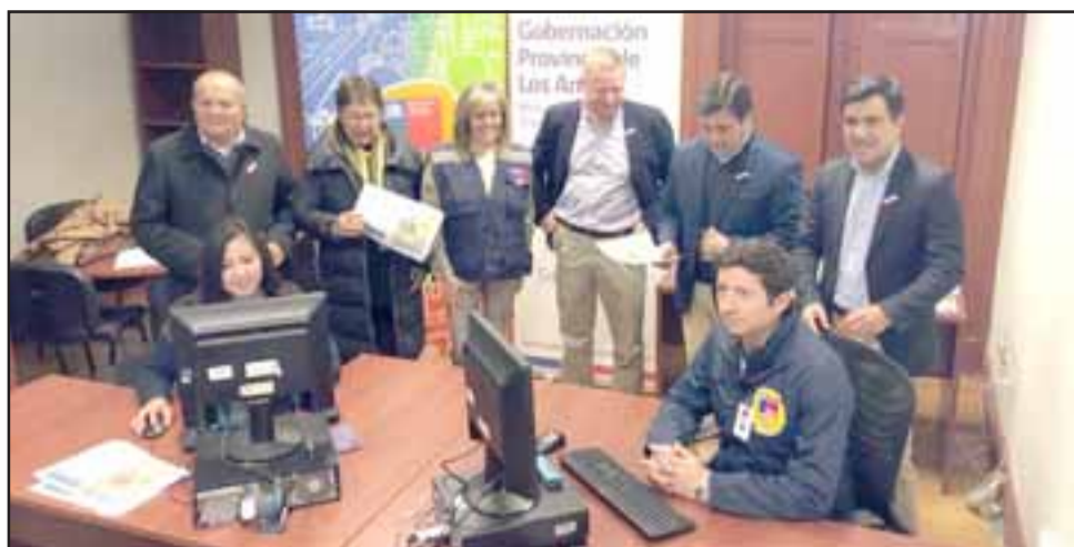
Gobernador provincial, director regional del Serviu y la municipalidad de Los Andes firman acuerdo de convenio de trabajo colaborativo a fin de acercar los programas habitacionales y de desarrollo urbano a la ciudadanía.

La atención de público en estas nuevas dependencias inicia el próximo lunes 24 de junio, en horario de 09:00 a 13:30 horas, en el edificio de la Gobernación Provincial de Los Andes, ubicado en Esmeralda N° 387, Los Andes.