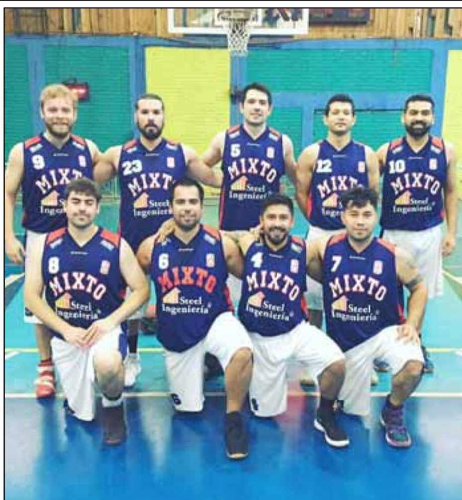
El Liceo Mixto tendrá dos difíciles partidos en el torneo de Apertura de la ABAR.