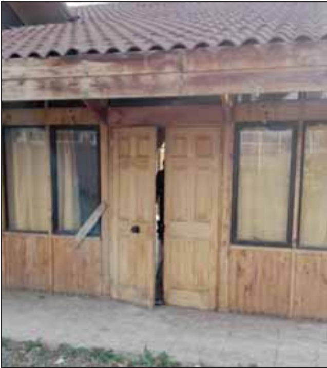
El delincuente habría ingresado forzando la puerta hasta la sede de la Asociación de Fútbol Amateur en Santa María.