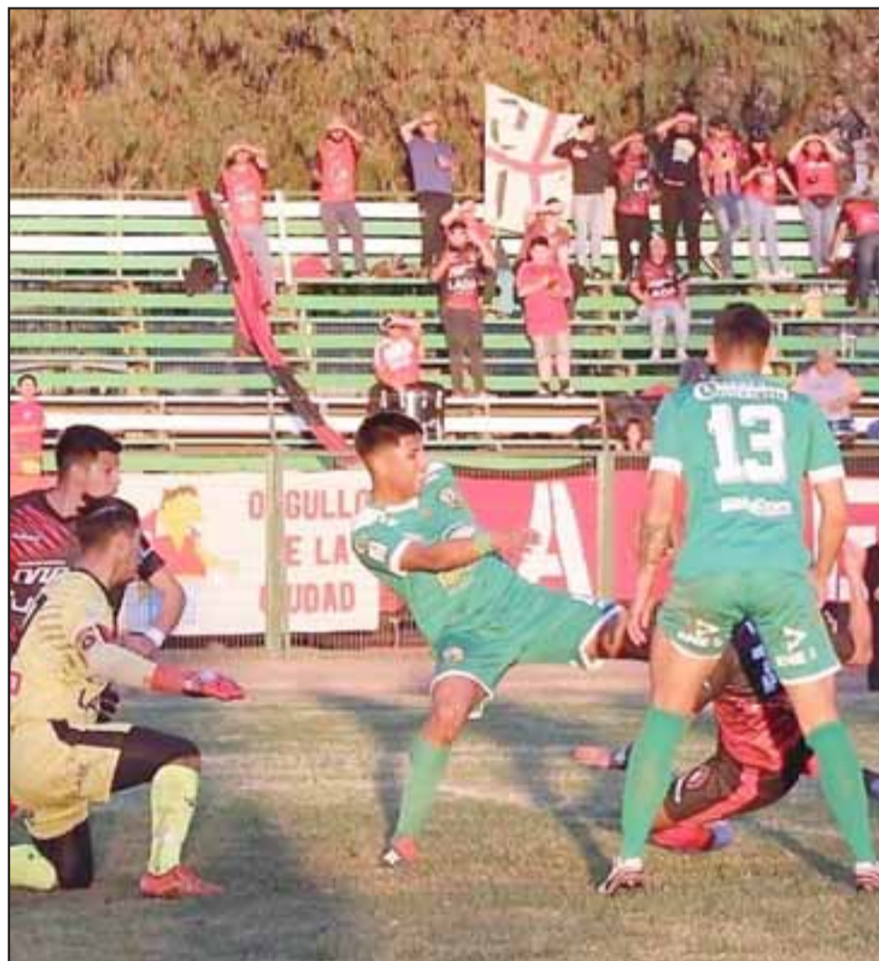
El 3 y 10 de julio en el Regional de Los Andes, Trasandino jugará sus partidos pendientes en la competencia A de la Tercera División.

Fechas reprogramación partidos de Trasandino: Trasandino – Deportes