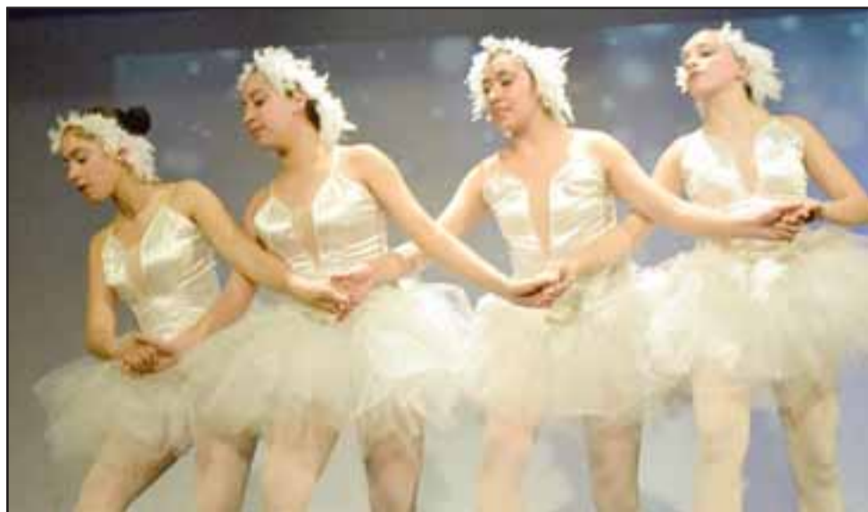
SAN FELIPE TIENE TALENTO.- Las más grandes hacen de las suyas ante el público, pues su dominio escénico fue de lo mejor.

+56997311131, o bien me pueden ubicar en la Oficina de Cultura Yungay 398 de Fundación Buen Pastor en San Felipe.