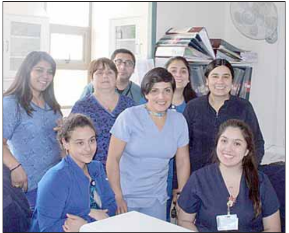
Una de las medidas ha sido reforzar los equipos clínicos, con la incorporación de más personal en la Unidad de Tratamiento Intermedio y el refuerzo de personal en el Servicio de Medicina para atender las necesidades de los pacientes hospitalizados por causas respiratorias.

La tercera medida es el reforzamiento de los equipos clínicos, con la incorporación de más personal en la Unidad de Tratamiento Intermedio, dada la complejidad de los pacientes en esa Unidad; y la continuidad del refuerzo de personal en el Servicio de Medicina, para atender las necesidades de los pacientes hospitalizados por causas respiratorias.