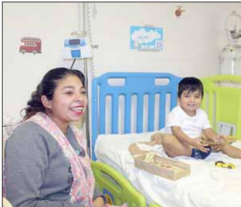
Otra de las medidas implementadas consistió en el reforzamiento de la atención para niños en la Unidad de Emergencia Hospitalaria.

El profesional indicó que también se ha incorporado apoyo de kinesiólogo los fines de semana en la Unidad de Emergencia y en los servicios de hospitalización. Este apoyo kinésico también se extiende al horario vespertino, posibilitando que los pacientes puedan ser atendidos por estos profesionales fuera del horario hábil. Así también se contrató un tecnólogo médico que cumple funciones en Laboratorio Clínico, para apoyar la