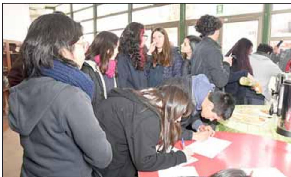
En el encuentro se escuchó a estudiantes de enseñanza media de la comuna, para conocer sus inquietudes y expectativas en relación a esta iniciativa.