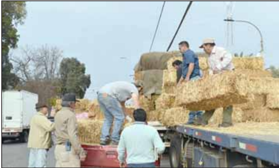
Agricultores beneficiados agradecieron el aporte entregado por la Municipalidad.