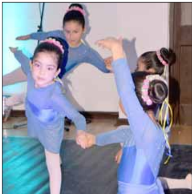
BELLEZA Y TALENTO.- Así ejecutaron cada uno de sus movimientos estas bellas damitas, sólidamente y con gran alegría.