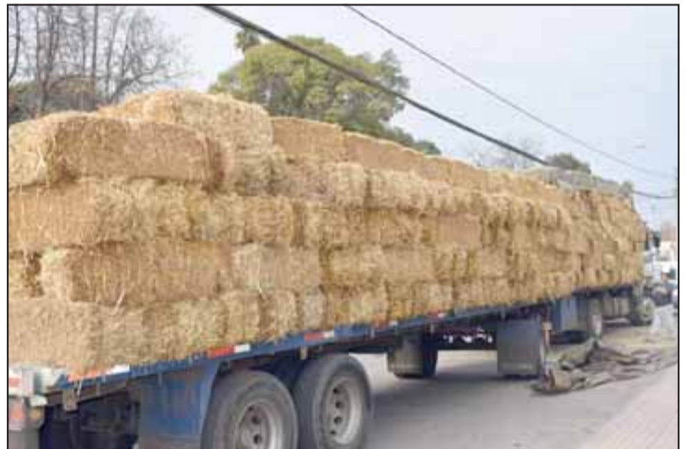
El aporte de forraje fue financiado con recursos municipales, informó el alcalde Claudio Zurita.