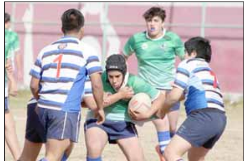
Este deporte cada día toma más fuerza en el Valle de Aconcagua, son jornadas de mucho contacto físico y gran fuerza física.