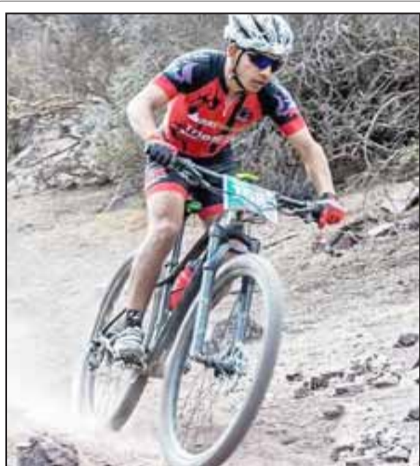
Un competidor pasando por el espectacular circuito en el XCM realizado en Santa María.

de julio, estadio Regional de Los Andes a las 13:00 horas.