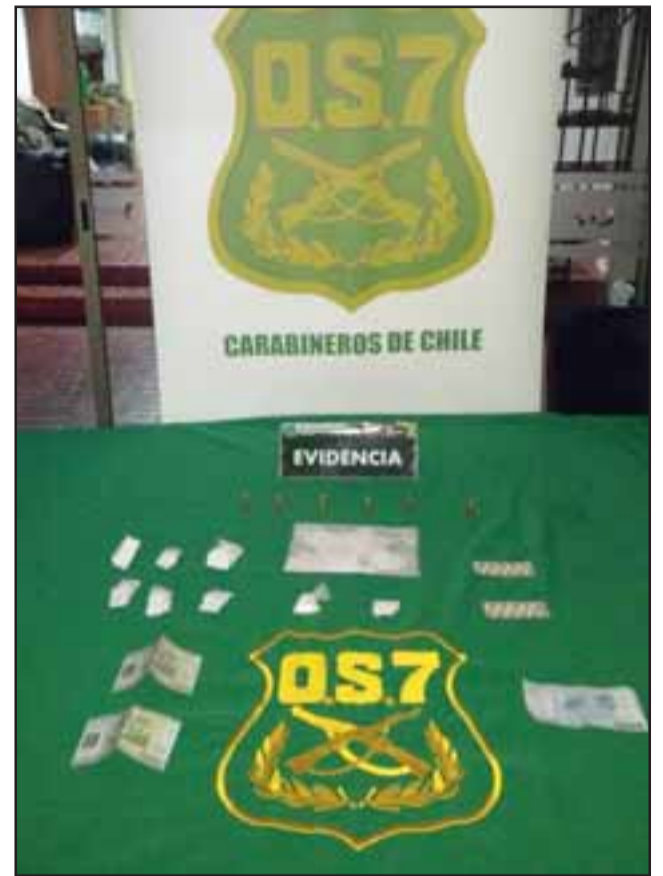
Personal del OS7 de Carabineros Aconcagua efectuó un allanamiento al interior de una vivienda ubicada en la población Bicentenario de Llay Llay, el pasado 1 de junio del 2018.