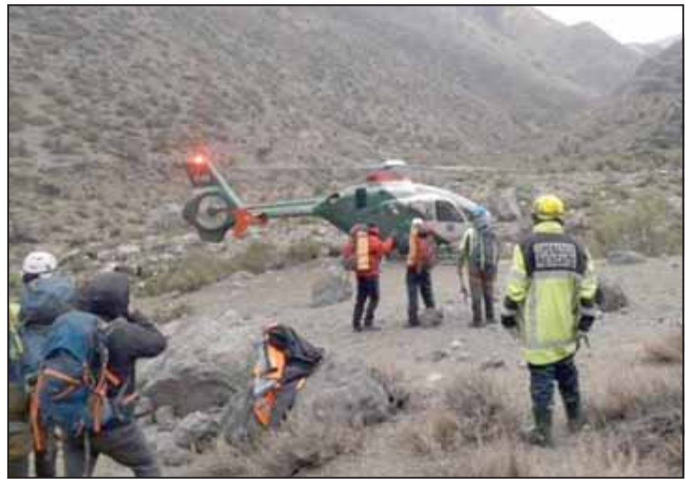
Debido a las lesiones de carácter grave que le generaban mucho dolor, el arriero no pudo ser encamillado para ser descendido vía terrestre, debiendo concurrir un helicóptero para culminar el rescate.

De esta forma pudo ser evacuado desde Riecillos hasta el Estadio Regional, en donde estaba siendo esperado por paramédicos del Samu que lo trasladaron en la ambulancia hasta el Servicio de Urgencia del centro asistencial andino.