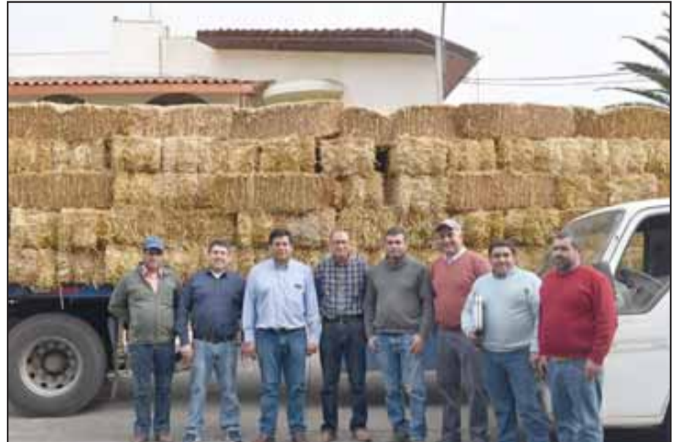
Un total de 442 fardos de pasto fueron entregados a agricultores de Santa María.

Por su parte los agricultores beneficiados agradecieron la ayuda otorgada por la Municipalidad, por cuanto será de suma importancia para alimentar a sus animales, ante el adverso panorama de la sequía que se deja sentir en la zona.