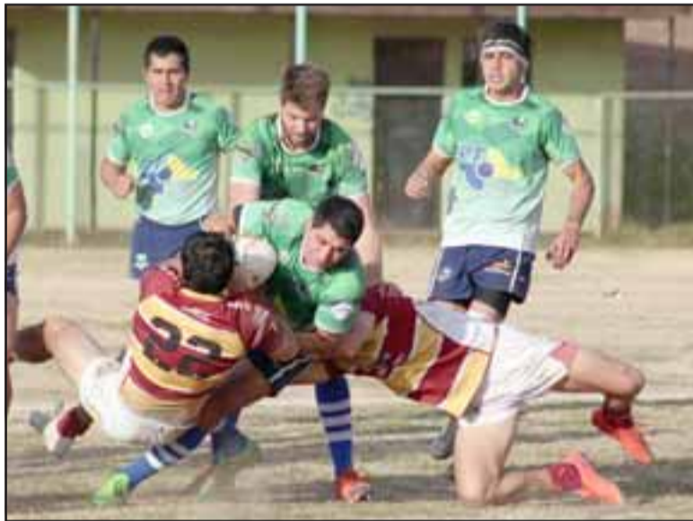
Así enfrentaron los callelarginos a su rival durante en partido, aún así no pudieron aguantar la presión de su rival tras errores y faltas cometidas.

Este deporte cada día toma más fuerza en el Valle de Aconcagua, son jornadas de mucho contacto físico y gran fuerza física.