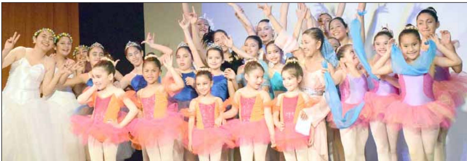
SIEMPRE NIÑAS.- Aquí tenemos a las pequeñitas al lado de su querida profesora de Ballet, las niñas del Taller Experimental de Ballet Clásico posaron junto a su profesora para las cámaras de Diario El Trabajo.