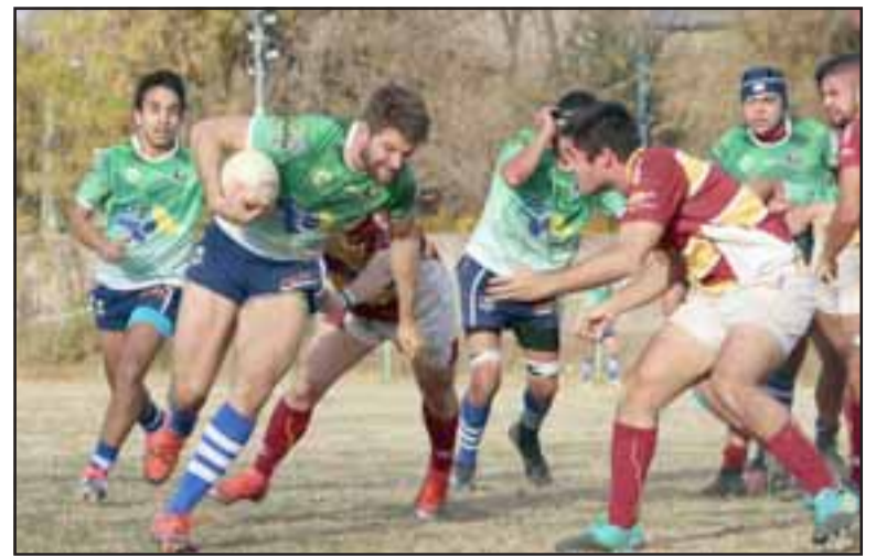
Halcones, de verde, pusieron fuerza y valor en cada una de sus jugadas este fin de semana.