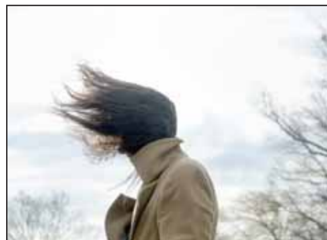
Las ráfagas de viento podrían alcanzar los 80 a 100 kilómetros por hora en el sector cordillerano, lo que de una u otra manera afectará los valles centrales.

dante el monitoreo preciso y riguroso de las condiciones de riesgo y las respectivas vulnerabilidades asociadas a la amenaza, coordinando y activando al Sistema de Protección Civil con el fin de actuar oportunamente frente a eventuales situaciones de emergencia.