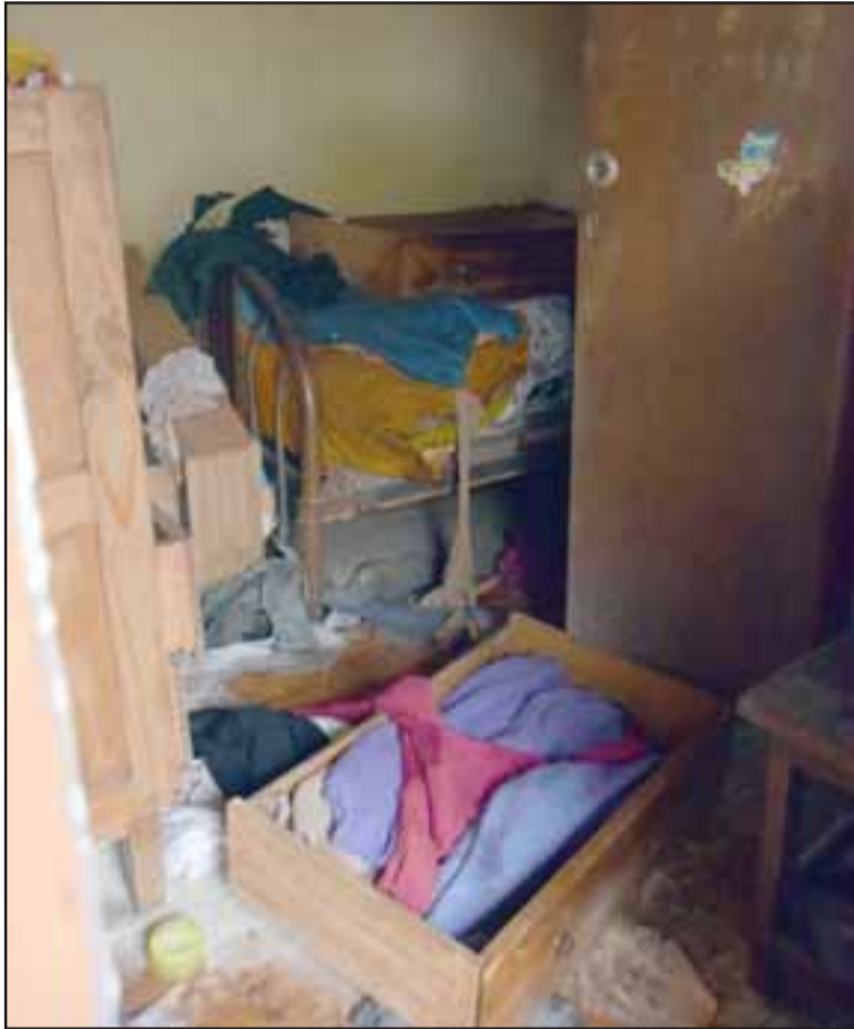
¿ES UN MILAGRO?- Así quedó la habitación de la víctima, una vecina de Santa María de 86 años de edad.