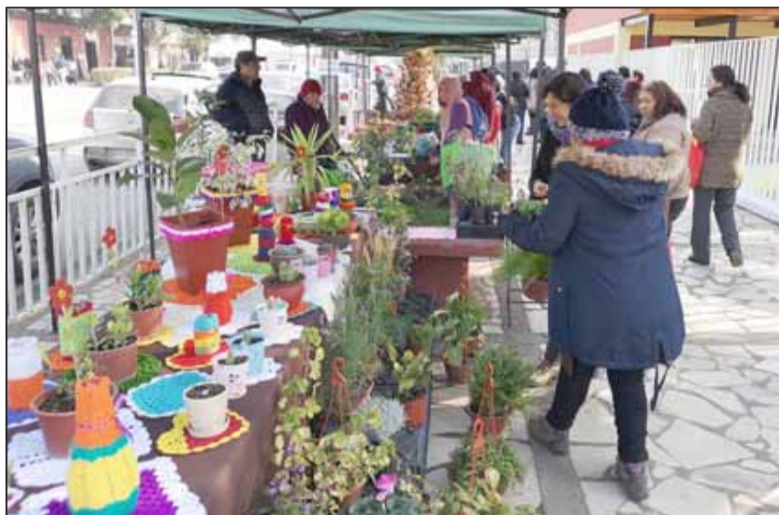
Los visitantes de Illapel conocieron la Charquería, el Plantel Caprino de Alta Producción y la Feria Agropecuaria 'Campos del Viento', con la idea de poder replicarlos en su zona.

Además el profesional explicó que «nosotros, sabiendo la distancia y el esfuerzo que significa venir hasta acá, es que generamos una ronda de visitas técnicas y charlas en temas de su interés, que les permita rescatar experiencias exitosas que ellos pudieran implementar y es por eso que los llevamos a un plantel caprino de alta producción de una de nuestras usuarias, además de una charla de una empresa que fabrica forraje verde y les mostramos nuestra Feria Agropecuaria, que es nuestro proyecto más emblemático, porque permite que los productores vendan directamente al consumidor».