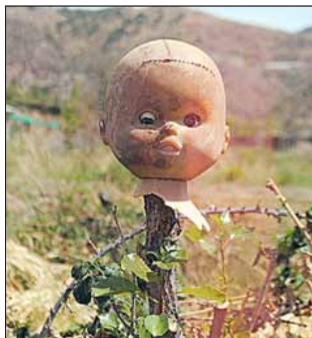
ESE MUÑECO. - Valerie Spinoza hizo esta fotografía, su talento es singular, logra buenas composiciones y tiene mucho para esta exposición.