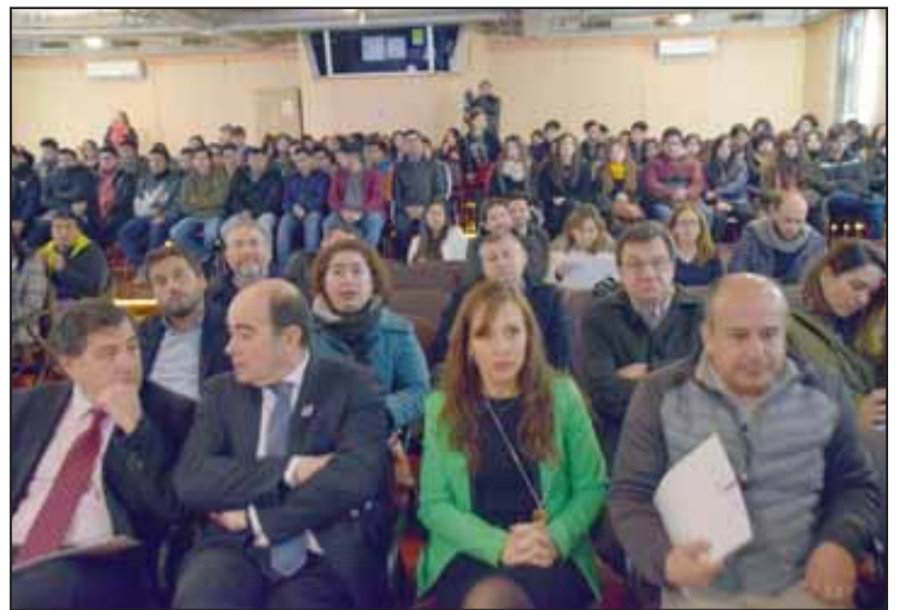
MUCHO INTERÉS.- Cientos de personas del Valle de Aconcagua, estudiantes y empresarios se dieron cita para escuchar a los expertos.