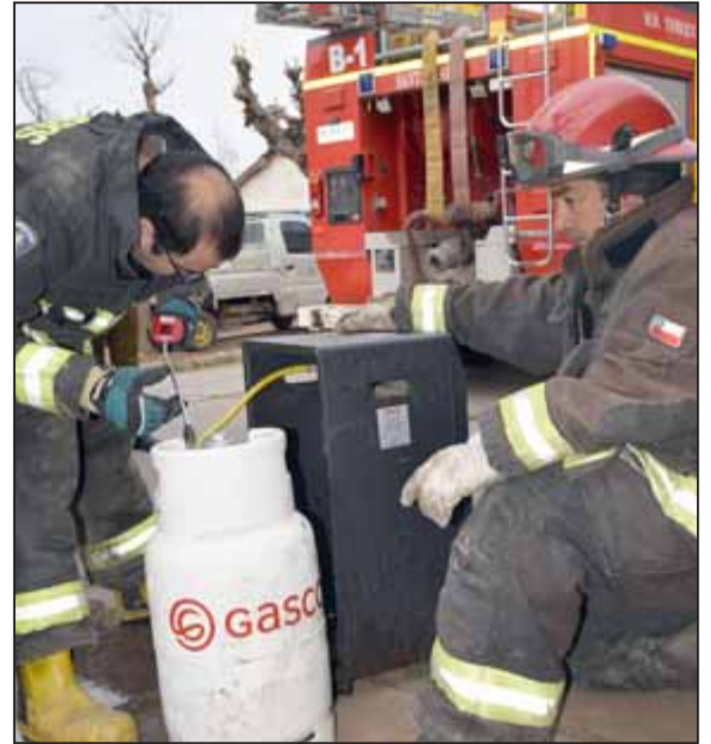
ESTUFA CON FALLAS.- Los bomberos revisaron la bomba de gas, la falla al parecer se originó en la estufa.