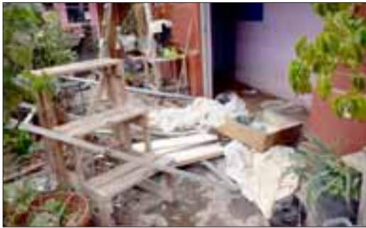
En este estado quedó la vivienda tras la explosión

Estallido destruyó paredes, puertas y ventanas