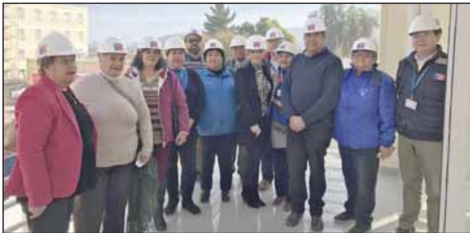
IRRECONOCIBLE.- Los visitantes, miembros de diferentes consejos de participación de la red de salud y autoridades del área, conocieron el avance de la obra, quedando impresionados por la calidad y comodidad de las nuevas instalaciones.

zando la obra. Muchos de ellos sólo habían conocido el antiguo recinto asistencial, por lo que quedaron sorprendidos por el grado de avance, la calidad de las nuevas instalaciones y las comodidades que hoy se aprecian, las que beneficiarán a usuarios y funcionarios.