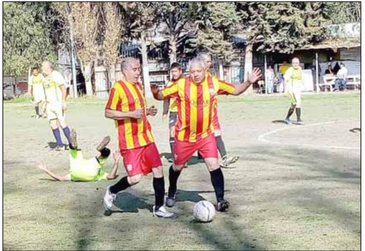
El domingo pasado regresó la competencia futbolística en la cancha Parrasía.

Santos 1 – Villa Argelia 0; Aconcagua 2 – Barcelona 1; Unión Esfuerzo 1 – Unión Esperanza 1; Villa Los Álamos 3 – Andacollo 1; Tsunami 3 – Resto del Mundo 0; Carlos Barrera 4 – Los Amigos 2; Pedro Aguirre Cerda 5 – Hernán Pérez Quijanes 1.