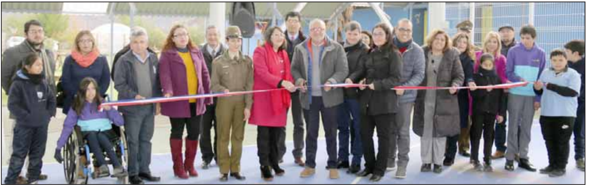
Las obras contemplaron el cambio de techumbres, mejoramiento del revestimiento de muros perimetrales, la construcción de tabiques divisorios, renovación de servicios higiénicos, cambio de artefactos, nuevos patios, renovación del sistema eléctrico, pavimentos en aulas, entre otras obras de conservación.