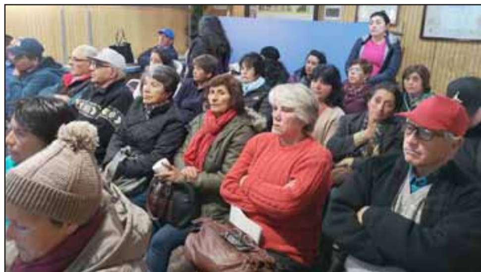
La pasada semana, un grupo de agricultores y ganaderos, usuarios de Prodesal de la comuna de Illapel, visitaron Llay Llay con la intención de conocer tres iniciativas exitosas aplicadas en la comuna.