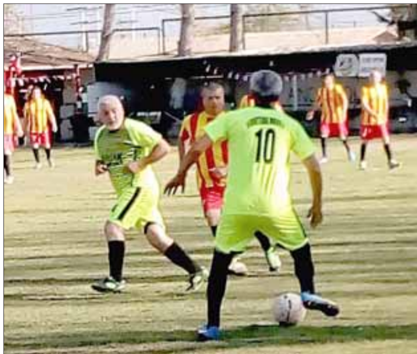
La cita futbolística del domingo en la cancha Parrasía se compondrá de siete encuentros.