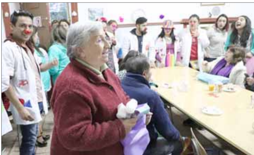
UNA GRAN SONRISA.- La Agrupación de Payasos Clownrisas Aconcagua 'Tito Araña', también aporta mucho para el bienestar de quienes más necesitan acompañamiento.