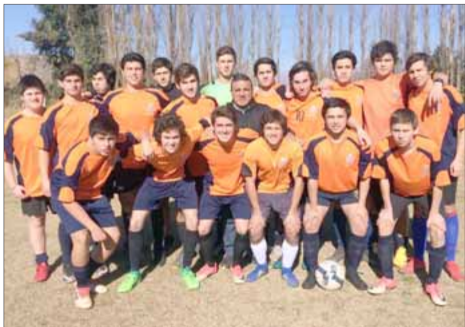
El combinado del Colegio Curimón es sub líder del torneo Escolar de San Felipe.