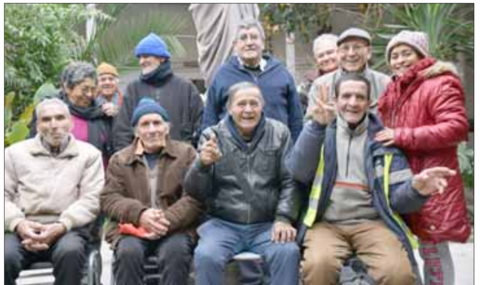
LOS BENEFICIADOS.- Ellos son sólo una parte de los adultos mayores que están recibiendo su desayuno, almuerzo y onces de lunes a viernes, los recursos llegan directamente de voluntarios del Hospital San Camilo a través también de la Agrupación Voluntariado del Valle de Aconcagua.

ayudar de estos funcionarios, que durante su primer mes de funcionamiento organizaron una entretenida actividad en la cual les entregaron diversos regalos y se complementaron con la Agrupación de Payasos Clownrisas Aconcagua 'Tito Araña' , como una forma de demostrar su interés en potenciar el vínculo. De la misma manera, en dependencias del hospital se realizó una ceremonia de formalización en donde esta agrupación se comprometió con el Voluntariado Valle del Aconcagua a entregar los insumos necesarios durante todo un año, por supuesto que con el compromiso de que si todo sigue funcionando tan bien como ha sido hasta ahora, la responsabilidad se renovará por muchos años más.