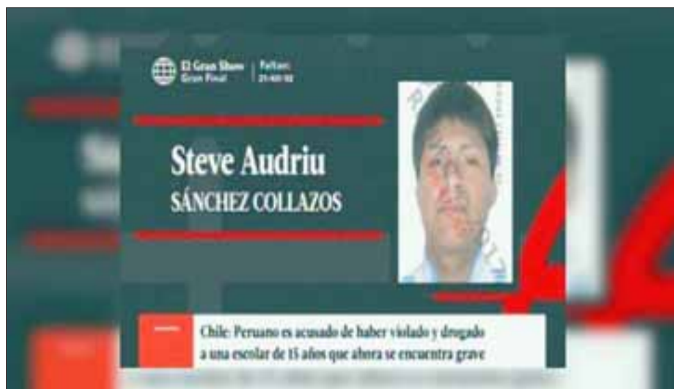
El canal América TV de Perú informó sobre el hecho ocurrido en Santiago, donde una menor de 15 años agredida sexualmente falleció el año 2017.

Sánchez quedó en prisión preventiva y enfrentará los cargos por violación con homicidio por el hecho