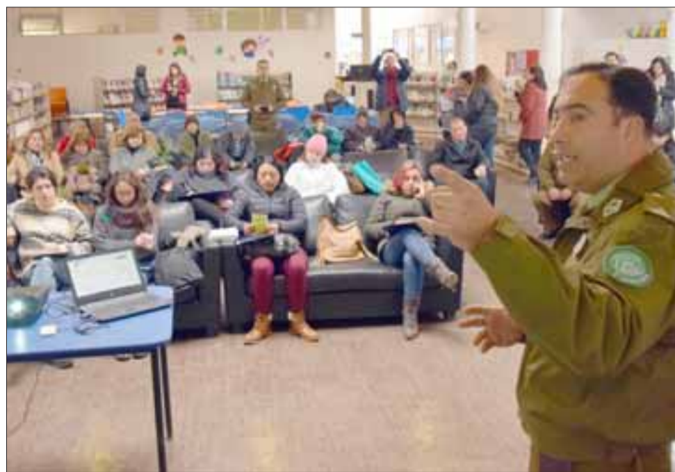
INTERNET SE IMPONE.- La Comisaría Virtual fue uno de los temas fuertes de la jornada, desarrollado por Carabineros y Gobernación de San Felipe.