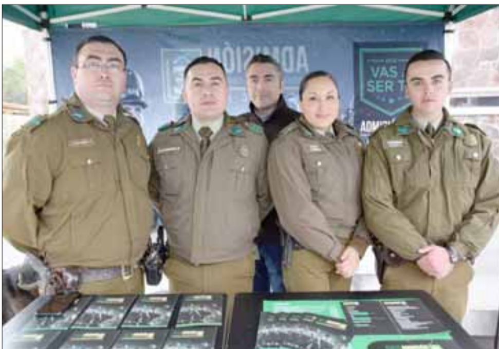
SIEMPRE CERCA.- Carabineros expuso su trabajo, mostró la carrera policial a los jóvenes que consultaron por ella.