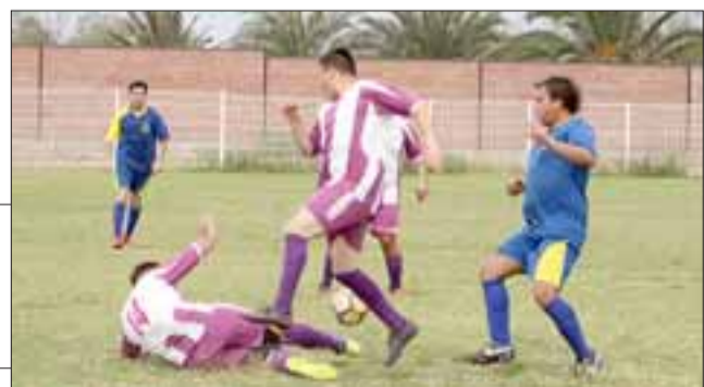
El torneo masculino se la Asociación de San Felipe vivirá su quinta jornada.

troza – Arturo Prat; Manuel Rodríguez – Juventud La Troya; Libertad – Unión Sargento Aldea; Ulises Vera – Juventud Antoniana.