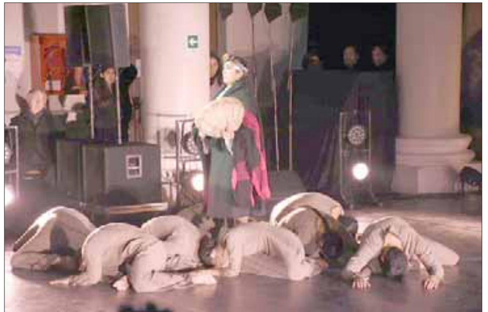
Con gran majestuosidad el Bafona se lució en esta fecha inaugural de las celebraciones de la ciudad andina.

«Nos engalanan en el inicio del mes aniversario, este es un apronte espectacular para lo que será el Festival de Danza en home-