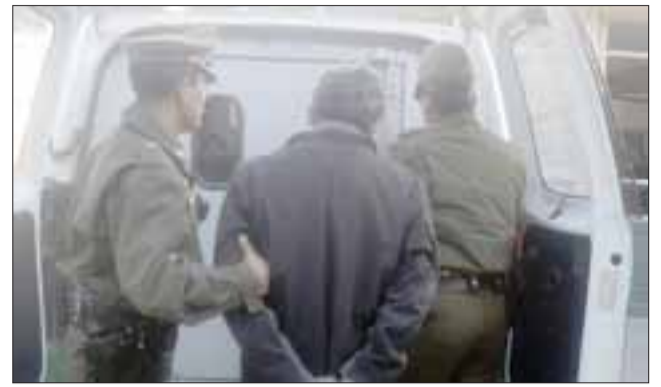
El detenido será derivado el día de hoy viernes hasta el Juzgado de Garantía de San Felipe por el delito de robo en lugar no habitado. (Foto Referencial).

El oficial policial añadió que el imputado, iden-