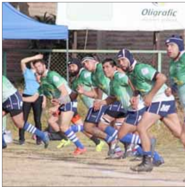
El quince aconcagüino viene de caer en la fecha pasada.

Programación zona A Old Gabs – Old Gergel; Universidad de Chile – Trapiales; Lions – Halcones