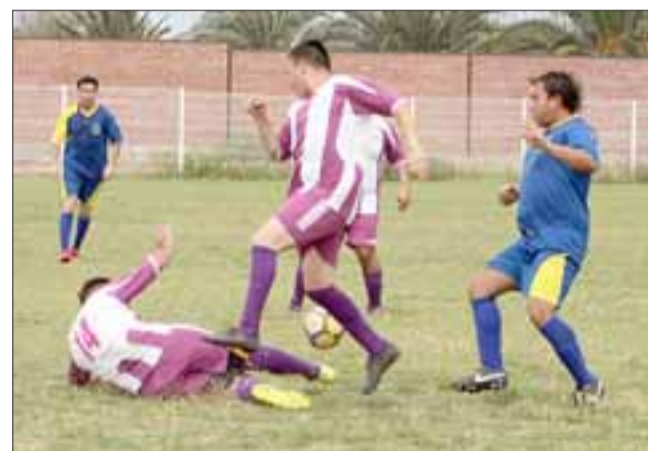
Trasandino enfrentará al sub colista del torneo A de la ANFA.