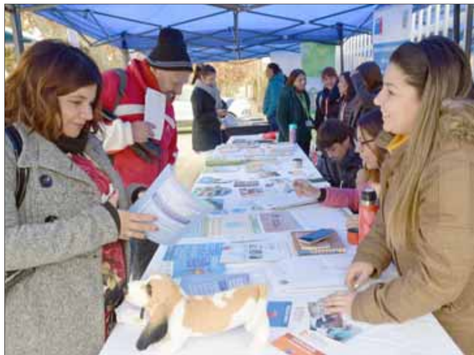
SIN VIAJAR NI HACER FILAS.- Cientos de vecinos se acercaron desde las 10:30 horas a los stands institucionales para recibir orientación, descargar aplicaciones sobre Salud en sus teléfonos, y otros servicios.

Asimismo, Carabineros difundió los alcances de la recientemente implementada Comisaría Virtual, a través de la cual se pueden realizar vía Internet algunas constancias, sin que sea necesario asistir de manera presencial a la unidad policial más cercana: «Hemos tenido una importante concurrencia, donde también a través de breves charlas informativas se abordó el tema de la Comisaría Virtual que ya el presidente Sebastián Piñera ha implementado y que está en su etapa de difusión, reunión con dirigentes sociales para que repliquen con sus vecinos el doble beneficio para los vecinos que en poco tiempo pueden tramitar gestiones y con eso liberamos a carabineros de la carga ad-