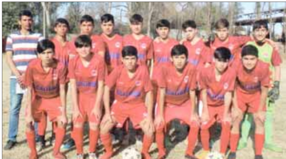
Impecable luce la Primera Infantil del club Almendral Alto.