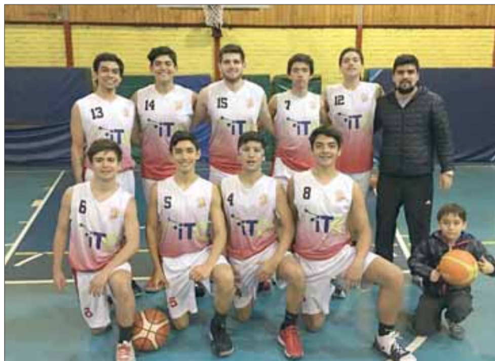
San Felipe podría ascender al primer lugar de la tabla si logra vencer al Prat.