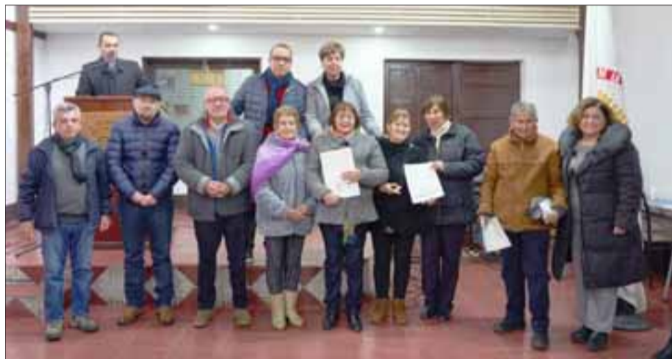
En total fueron 24 clubes de adulto mayor, además de su Unión Comunal, los que recibieron recursos pertenecientes a las subvenciones municipales 2019.