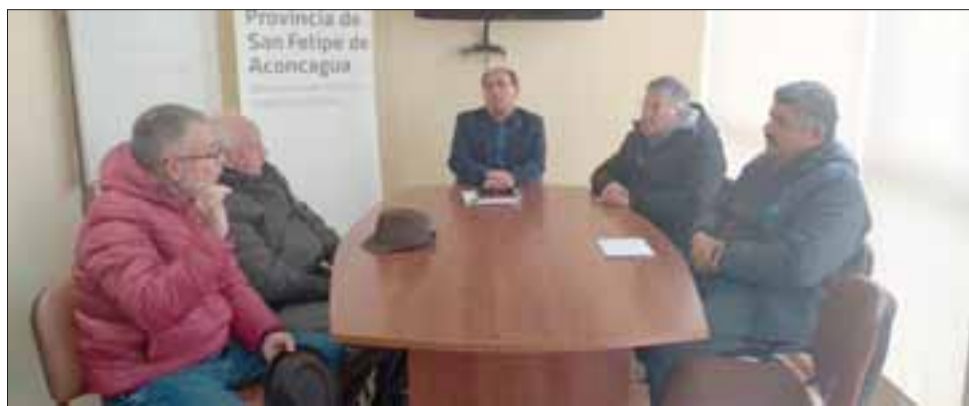
Representantes de comerciantes y vecinos de avenida Maipú conocieron alcances del proyecto de mejoramiento de la Ruta E71 en reunión sostenida con el gobernador de San Felipe, Claudio Rodríguez.

carpeteo asfáltico y la optimización de seguridad de algunas de sus principales intersecciones en el tramo que comienza en el puente El Rey y culmina en el sector Punta del Olivo.