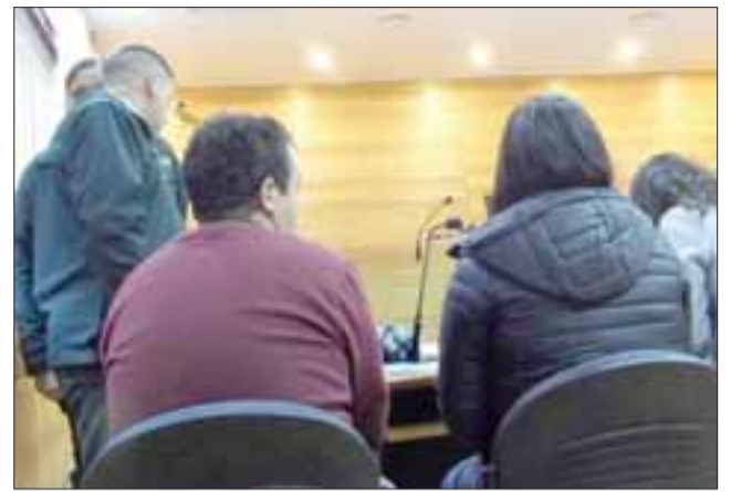
En procedimiento simplificado la singular pareja fue acusada de hurto simple frustrado.

Ambos fueron puestos a disposición del Juzgado de Garantía de Los Andes, siendo requeridos en procedimiento simplificado por hurto simple frustrado.