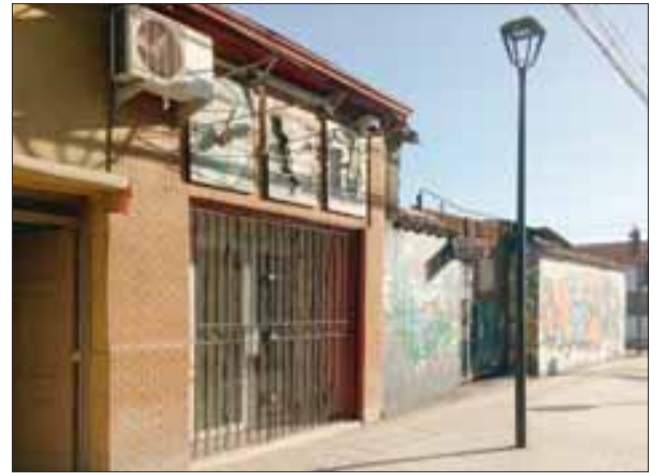
Desde este local delincuentes robaron una caja fuerte vacía.

Luego nuestro medio recibió información que en la intersección de las calles Chorrillos con Balmaceda había una caja fuerte, ignorando si corresponde a la robada en el local de control de plagas.