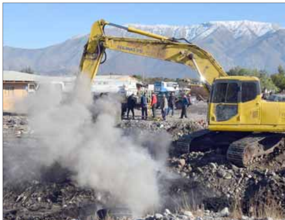
POR FIN APAGADO. - La retroexcavadora municipal fue empleada a fondo para remover escombros y apagar así el foso en llamas.