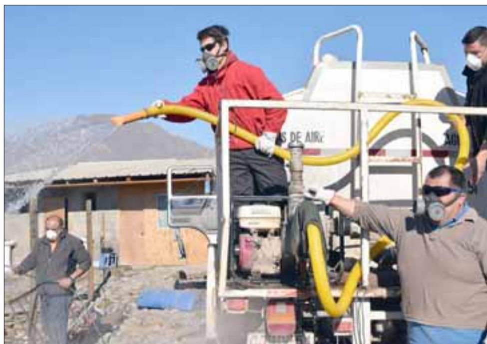
INFIERNO OCULTO. - Misión cumplida.- Ellos son parte del personal municipal que ayer miércoles se emplearon a fondo para solucionar este problema medioambiental.