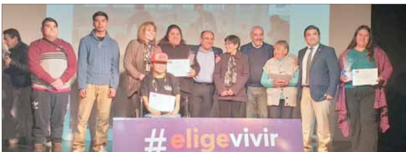
En la oportunidad también se distinguió a diversas organizaciones y representantes de la comunidad del barrio Las 4 Villas y Hogar de Cristo, quienes colaboraron en la implementación de trabajo preventivo en este territorio