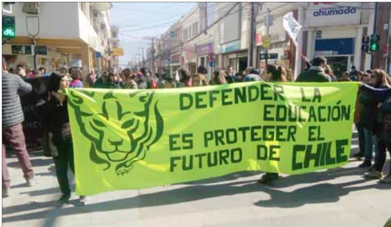
Los profesores se instalaron inicialmente en calle Salinas con Prat, donde interrumpieron el tránsito por algunos minutos, situación que repitieron en las demás intersecciones de la Plaza de Armas.

El profesor reiteró los motivos de la movilización: «Primero la falta de diálogo por parte del Ministerio de Educación con los docentes, la falta de respuestas concretas a ciertos puntos importantes para nuestro magisterio, pero como lo dijimos ayer en la declaración pública, tiene que ver principalmente con el reconocimiento de la deuda histórica, además el pago a las educadoras diferenciales de párvulos sobre la cual no hay una solución concreta, sino que se está alargando el plazo, no hay compensación, no hay nada que sea concreto; no hay una fecha, estamos en discusiones del presupuesto para el año 2020 y el momento de conversar sería éste, hay una negativa respecto a eso, además el abandono de la educación pública, hablamos de 15 mil millones para