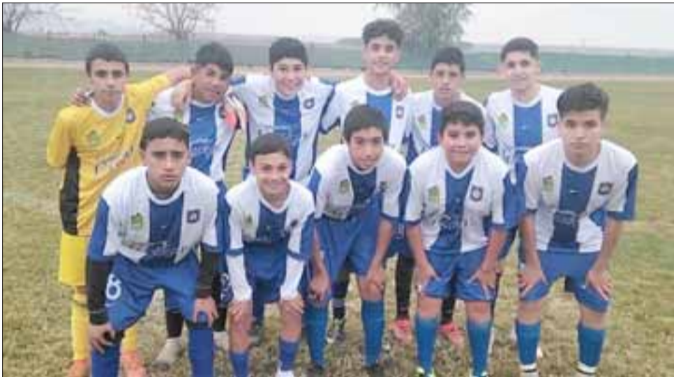
La lotería de los lanzamientos penales impidió al Colegio Industrial quedarse con el título.

Tras las vacaciones de invierno, el fútbol de la Liga Escolar de San Felipe retornará con una competencia en la categoría 2001.