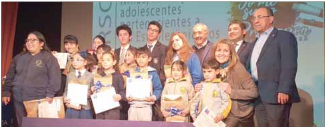
También fueron premiados los mejores dibujos realizados por estudiantes y que fue parte del concurso 'Elige Vivir Sin Drogas'.