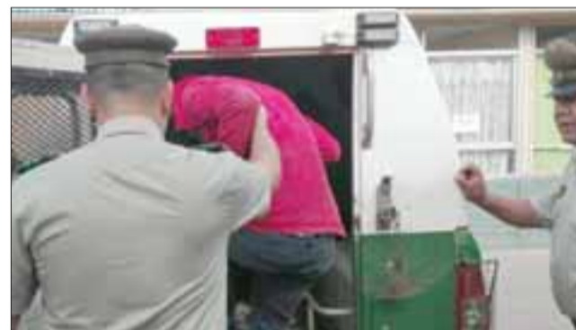
El sujeto fue detenido por Carabineros el 6 de septiembre de 2018 en avenida Sargento Aldea de San Felipe. (Foto Referencial).