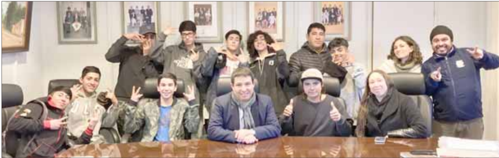
Los jóvenes riders junto a autoridades municipales de Putaendo.

contó que hace mucho tiempo estaban tratando de postular a algún espacio para realizar su deporte. «Estuvimos harto tiempo esperando y en este instante gracias a Dideco y Senda, que hicieron las gestiones, pudimos ganarnos estos proyectos. Yo como representante de Endo Ride he estado diciendo que poco a poco va saliendo a flote este proyecto y, obviamente, los cabros están felices porque son nuevas generaciones y necesitan hacer deporte y no meterse en drogas, ni alcoholismo», manifestó el joven rider putaendino.