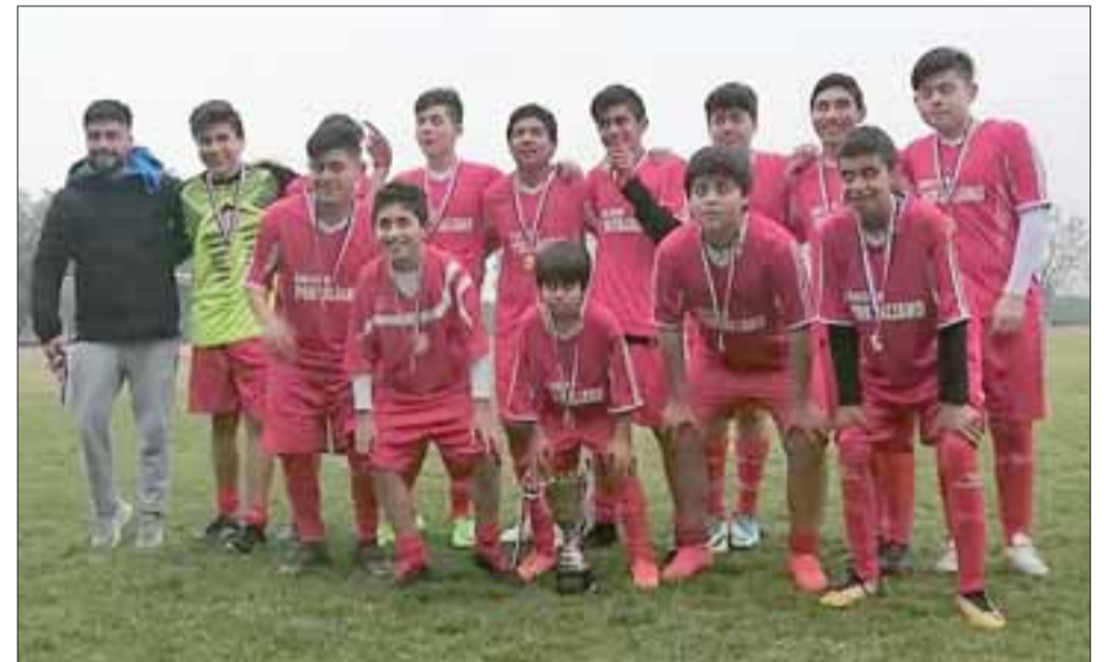
El Colegio Portaliano es el monarca en la serie sub 14 del fútbol en la Liga Escolar de San Felipe.