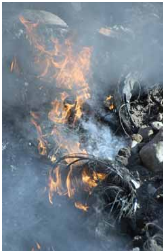
ARDÍA POR DENTRO. - Así estaba en el interior este foso, un problema que de haber árboles en las cercanías, pudo afectar más territorio si se quemaban las raíces.

este punto de contaminación detrás de su casa evidentemente como Dipma nos preocupaba mucho esta situación, de la cual solamente fuimos notificados este lunes, este miércoles concurrimos personal de la Dipma para eliminar este foco de contaminación, hemos podido observar que hay muchos neumáticos prendidos y estaban medianamente tapados por lo que no terminaban de realizar la combustión (...) destacar también el apoyo que los funcionarios municipales de Talleres, quienes nos también trabajaron en el control de este foco de contaminación, la retroexcavadora usada en este operativos es la que tenemos en el proyecto de limpieza de este-