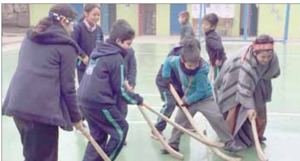
NUUESTRO PALÍN. - Aquí vemos a los pequeñitos de la Escuela San Rafael, dando rienda suelta a la diversión.