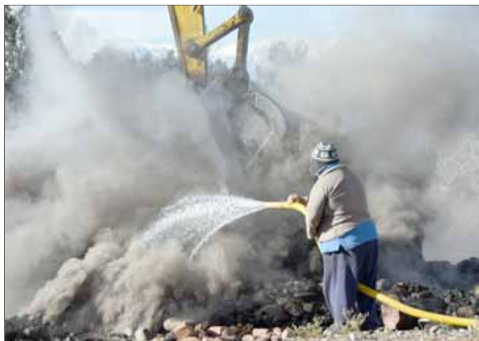
DE INFARTO. - El foco contaminante hizo imposible de respirar el sector durante el operativo que estos empleados de la Dipma y Talleres desarrollaron en la 21 de Mayo.