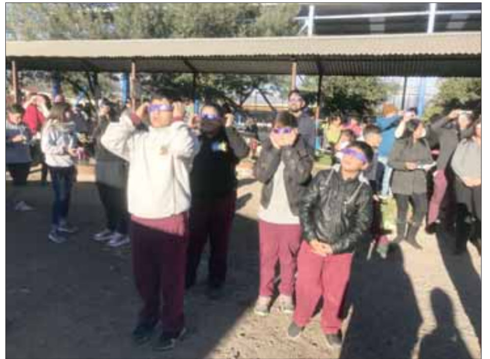
La comunidad de Bellavista disfrutó el eclipse, que pudieron apreciar con un acto realizado en la Escuela Carolina Ocampo.

Una opinión similar manifestó Ayelen Mu-