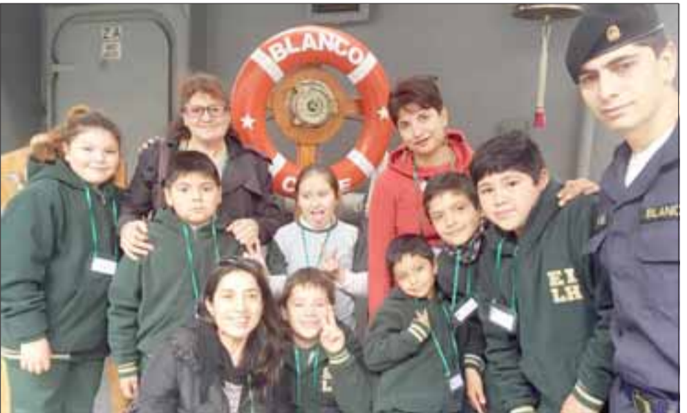
TREMENDO PASEO. - Aquí vemos a los alumnos de la Escuela La Higuera visitando el Buque Blanco Encalada de La Armada.

También en la Escuela San Rafael, en San Felipe, la escuela del lugar celebró con alegría esta jornada cultural, entregándose los niños completamente a jugar Palín, disfrutar las ricas