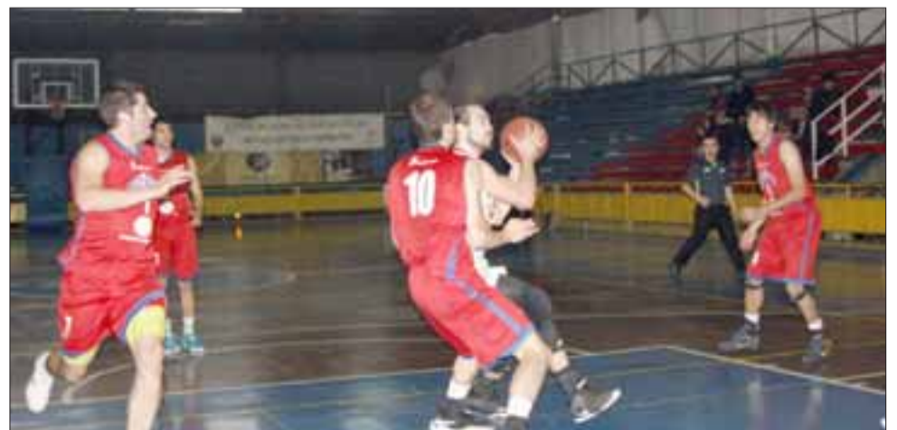
El Prat confirmó el nombre de su nuevo entrenador para la competencia de la LNB.