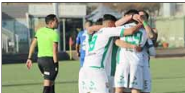
Trasandino se impuso por la cuenta mínima a Deportes Concepción.