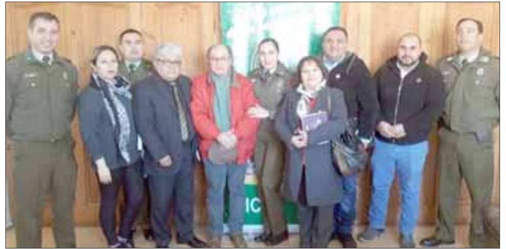
COMERCiantes ANGUSTIADOS.- Varios comerciantes afectados por la ola de robos imperante en nuestra comuna, solicitaron a Carabineros reforzar la vigilancia en las calles y poblaciones de nuestra ciudad.

El comerciante de Tienda de aperos de huaso 'Don Lalo', a quien le han robado ya dos veces, solicitó que se ponga un vehículo de Carabineros estacionado en Calle Prat entre Navarro y Traslaviña, Carabineros accedió a esta petición, mientras que los asistentes tuvieron la oportunidad de conocer las oficinas de la Cenco, y ver cómo funcionan las cámaras de seguridad desde allí manejadas. Se acordó solicitar una reunión para el comercio en las dependencias de la Cámara con Carabineros y la Municipalidad; la Cámara de Comercio gestionará esta instancia.