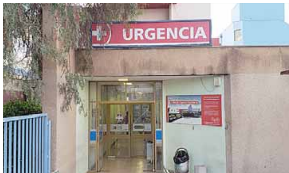
Al cierre de esta nota, el adulto mayor había sido ingresado al servicio de urgencias del Hospital San Camilo de San Felipe, con diagnóstico reservado.

Preliminarmente se informó que el adulto mayor se encontraría solo en el domicilio al momento del incendio, resultando lesionado producto de las llamas, siendo asistido por personal del Samu para