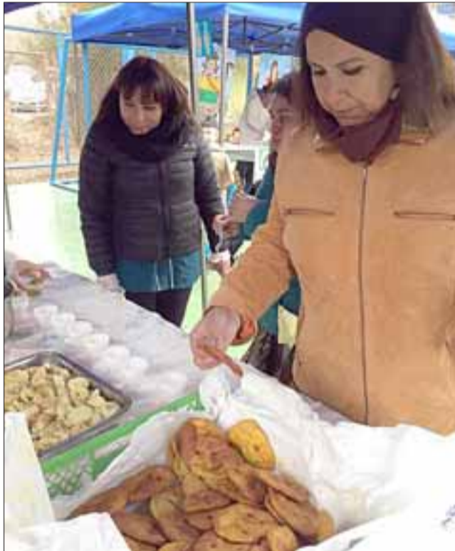
COMIDAS ORIGINARIAS. - En la Escuela San Rafael los apoderados, escolares y profesores disfrutaron de las comidas tradicionales ofrecidas.