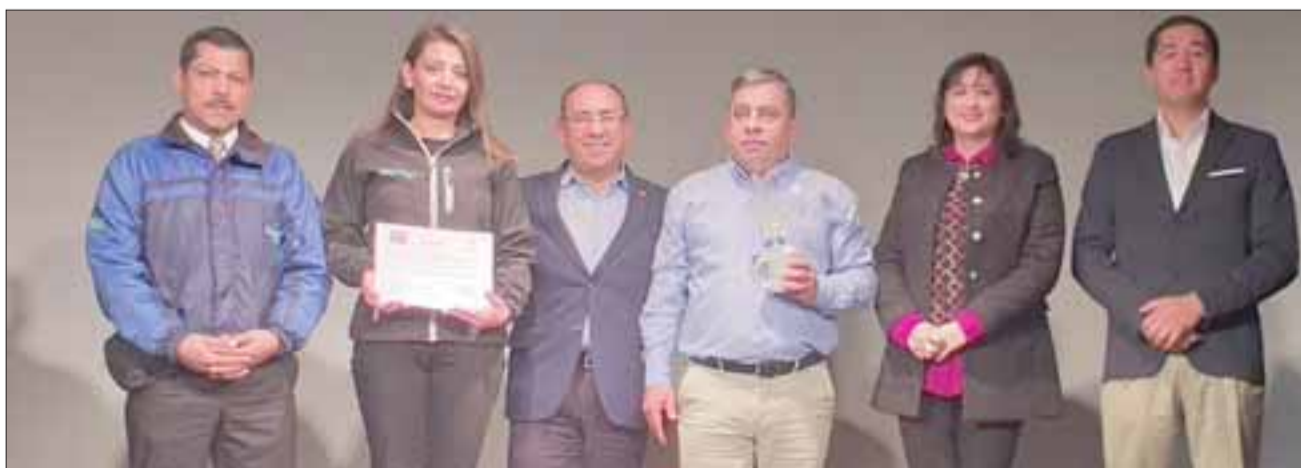
La empresa de transportes Vera Arcos fue certificada como parte del programa Trabajar con Calidad de Vida, a través del cual se busca evitar el consumo de estupefacientes y alcohol en ambientes laborales.