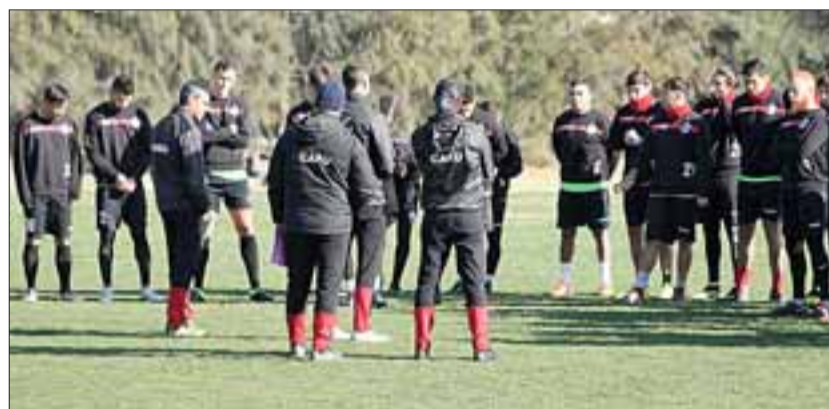
La escuadra albirroja hará su reestreno como local en la segunda rueda del torneo oficial de la Primera B.

Fecha 23; sábado 14 de septiembre, 15:30 horas: Unión San Felipe – Deportes Copiapó.