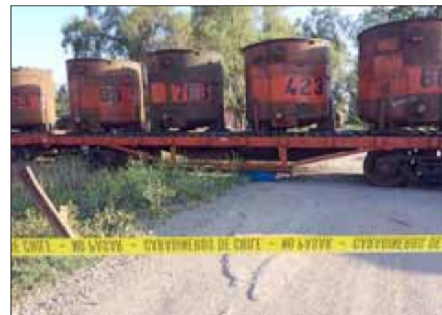
El caso se encuentra en investigación por parte de la Brigada de Homicidios de la PDI de Los Andes. (Referencial).

La mujer quedó en Prisión Preventiva por ser considerada un peligro para la sociedad. En caso de ser encontrada culpable arriesga una pena que parte en 3 años y un día de presidio.