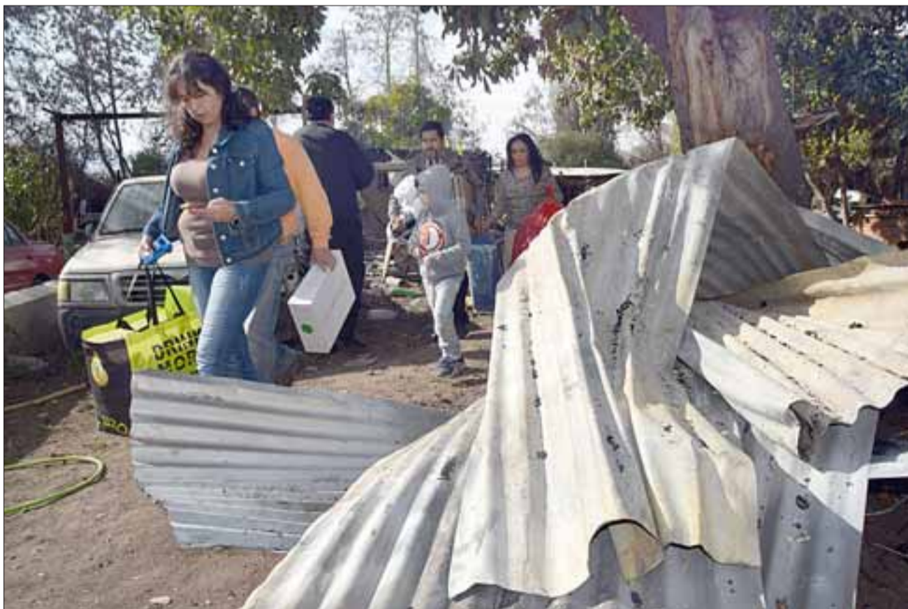
AYUDA EN CAMINO.- Rápidamente las manos amigas fueron y siguen llegando para traer ayuda a esta familia siniestrada.