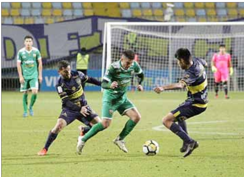
En el duelo de revancha de la Copa Chile jugado en Sausalito, Trasandino cayó 1 a 0 ante Everton.

cibida para los de la costa, ya que en Viña Del Mar, cayeron muchas críticas sobre Everton, debido a las dificultades que estos tuvieron para poder deshacerse de un Trasandino, que ahora solo fijará su mirada en el campeonato A de la Tercera División.