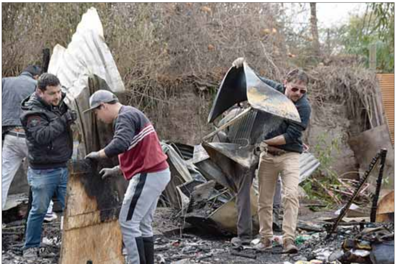
NUEVO COMIENZO.- Vecinos de los afectados y funcionarios municipales removiendo escombros de lo que fue la vivienda.