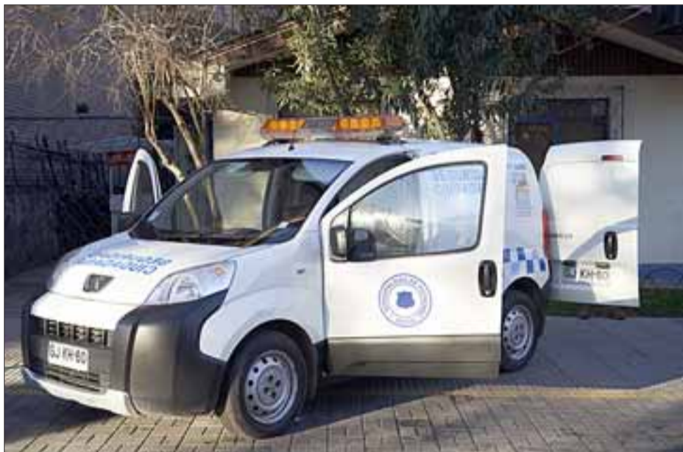
Este carro es fruto del Plan Comunal de Seguridad Pública y tendrá una función disuasiva destinada a vigilar los espacios públicos del centro de Putaendo.

«Se pretende controlar los hechos en la vía pública, vigilar el daño a la infraestructura pública, también la coordinación con carabineros para apoyar esa función. No vamos a