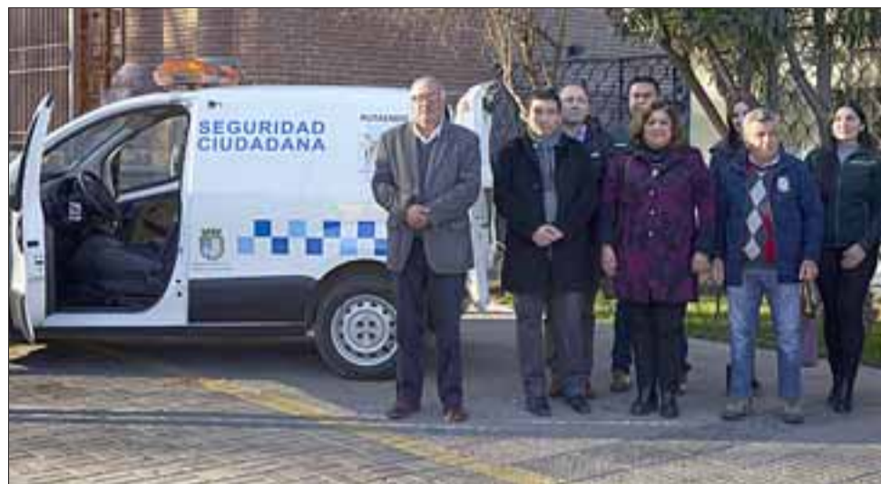
Las autoridades putaendinas están muy satisfechas con la puesta en acción este vehículo de seguridad ciudadana.

reemplazar el importante rol que tiene Carabineros de Chile, pero vamos a ser un ente que va estar con la comunidad para vigilar ciertos hechos menores en coordinación con Carabineros y la central de cámaras de televigilancia», explicó Muñoz.