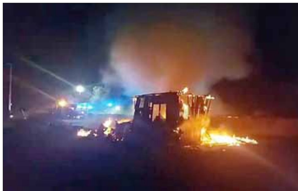
El fuego consumió en su totalidad una vivienda pre fabricada en el sector La Higuera de Santa María la tarde noche de este viernes.

tensión y una de las líneas explotó cayendo el cable acerado al suelo. Trabajaron las tres compañías de Santa María y al llegar la primera unidad se declaró alarma de incendio, no