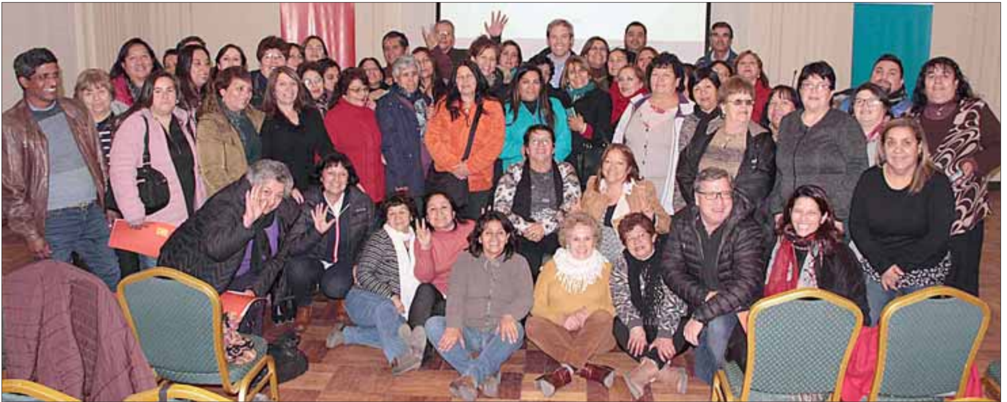
Durante dos días cerca de 70 dirigentes sociales estuvieron participando en una nueva Jornada de Diálogo, organizada por Codelco División Andina.