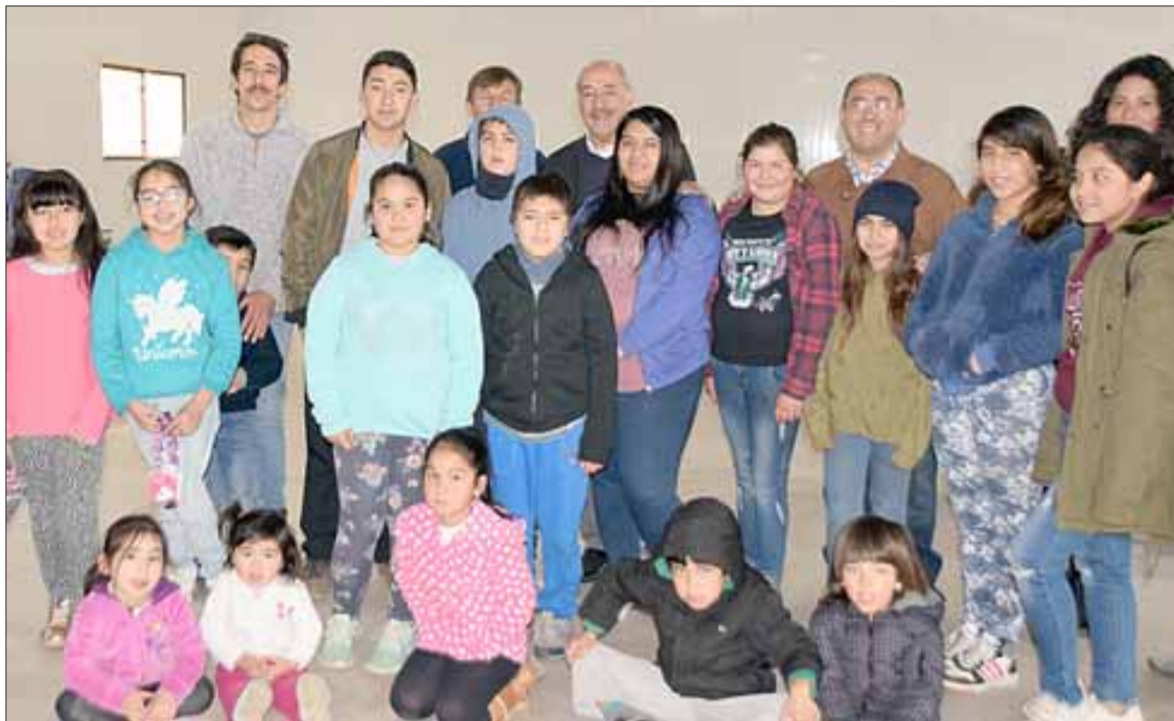
SALEN ADELANTE.- Cerca de 60 niños y jóvenes de La Troya se ven beneficiados con estas becas y programa educativo que la Cooperativa de Agua Potable La Troya.