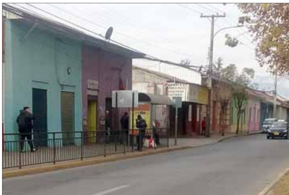
Desde el día 19 de julio ya no se podrá tomar locomoción en paradero de Esquina Colorada.