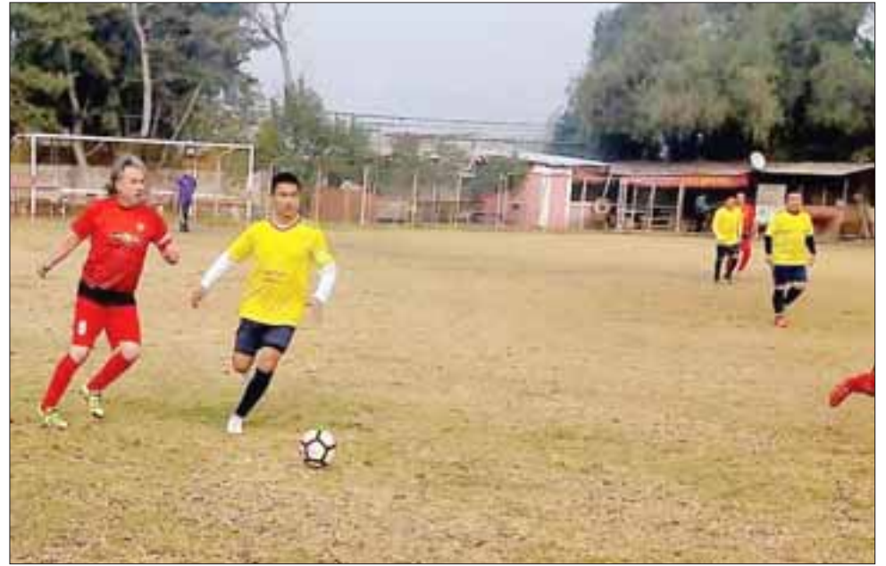
La fecha 8 del Apertura de la Liga Vecinal no arrojó mayores novedades en los dos extremos de la tabla de posiciones.

Resto del Mundo 1 – Villa Argelia 1; Andacollo 1 – Pedro Aguirre Cerda 1; Villa Los Álamos 2 – Unión Esfuerzo 1; Santos 2 – Hernán Pérez Quijanes 1; Tsunami 2 – Barcelona 0; Carlos Barrera 2 – Aconcagua 0; Los Amigos 3 – Unión Esperanza 0.