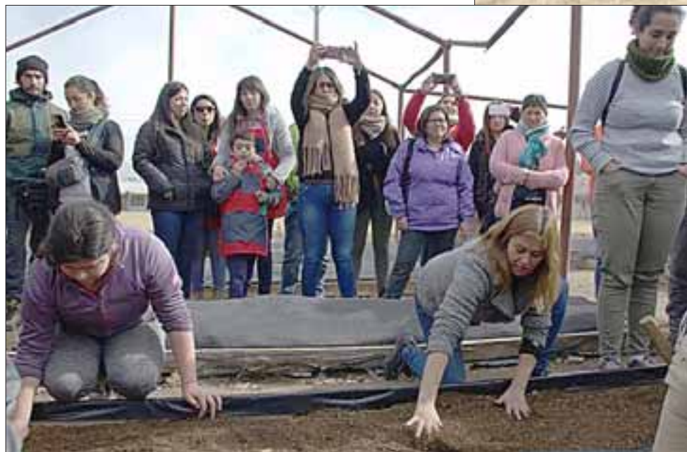
MANOS A LA OBRA.- Cada uno aportó ideas, trabajo, entusiasmo y muchas horas de trabajo para estos proyectos.