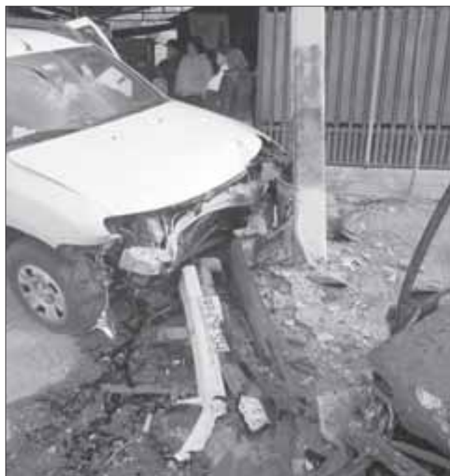
DORMIDA AL VOLANTE.- Los daños materiales son cuantiosos para ambas partes, al parecer la conductora se quedó dormida al volante.

resultando las primeras con lesiones leves y la asesora con una fractura de la muñeca izquierda de carácter