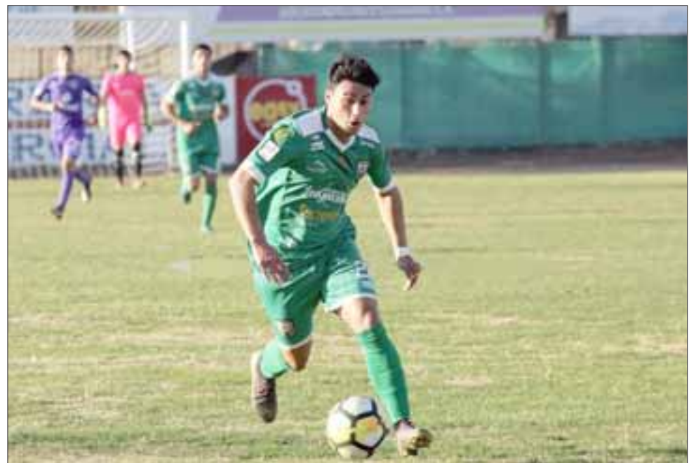
El equipo de Los Andes recuperó el primer lugar del torneo al imponerse por 2 a 0 a Osorno.