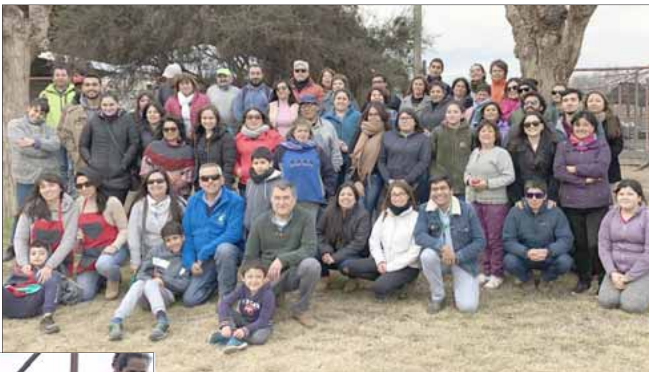
AMIGOS DEL MEDIOAMBIENTE.- Vecinos de todas las edades siguen participando en estas jornadas y Talleres de Compostaje y Lombricultura, en la Escuela Agrícola.

Este taller se dividió en una parte teórica y otra práctica, donde los asistentes pudieron construir una compostera y un lecho de lombricultura. Además, visitaron el plantel de lombricultura y compostaje de la escuela, donde observaron distintas formas de compostar, comprobando que es posible compostar los desechos orgánicos de la casa y complementarlo con una unidad de lombricultura para poder también producir humus.