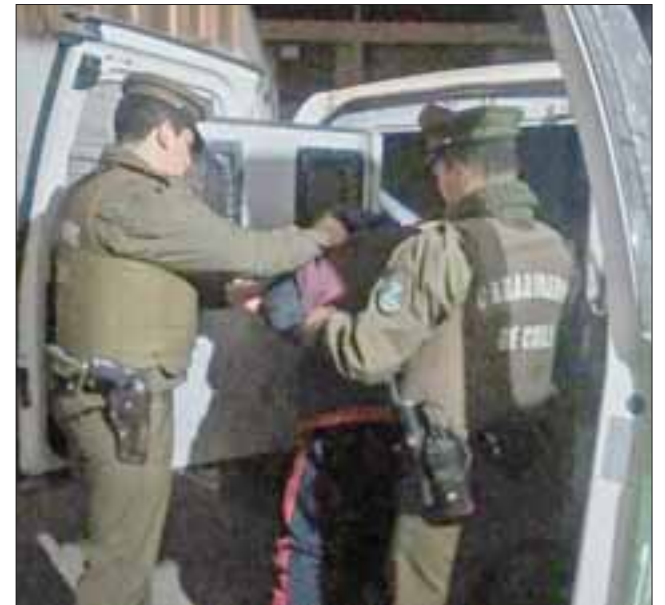
El antisocial fue detenido por Carabineros por el delito de robo por sorpresa ocurrido en la Esquina Colorada de San Felipe. (Foto Referencial).

El actual sentenciado fue sometido a juicio en el Tribunal Oral en Lo Penal de San Felipe, siendo considerado culpable del delito de robo por sorpresa ocurrido el año pasado.