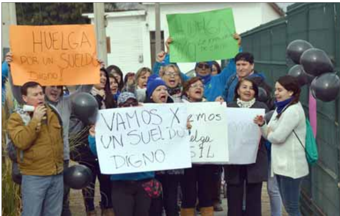
HUELGA NACIONAL. - Cerca de 10.000 empleados de la empresa multinacional Walmart iniciaron una huelga indefinida el día de ayer miércoles en todo el país, los empleados de Líder San Felipe también se manifestaron.

Esa es la situación nacional, crisis que también encuentra eco en el Valle de Aconcagua, puntualmente ayer las cámaras de Diario El Trabajo registraron las manifestaciones que los trabajadores de esta gigante comercial realizaron en las afueras de sus respectivos lugares de trabajo.