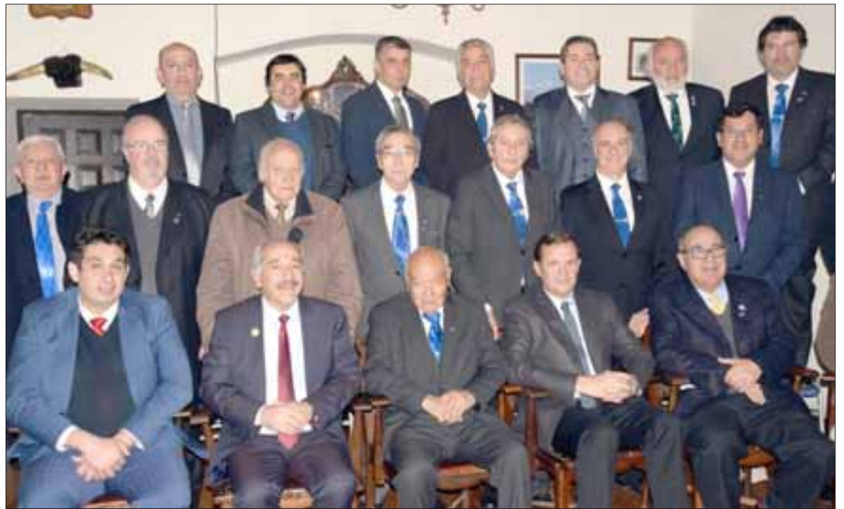
SIEMPRE ROTARIOS. - Ellos son parte de la gran Familia Rotaria de San Felipe: empresarios, académicos, docentes y líderes comunales al servicio de nuestra sociedad.

- La visión de Rotary es que juntos construimos un mundo donde las personas se unen y toman acción, para generar un cambio perdurable en nosotros mismos, en nuestras comunidades y en el mundo entero, en este perio-