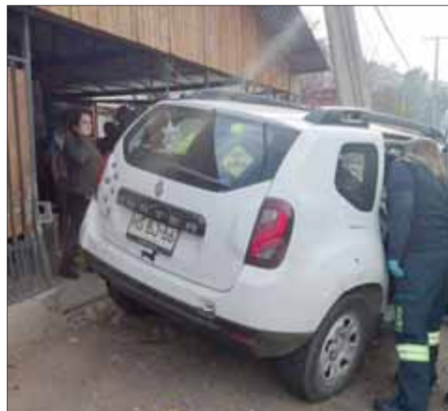
FUE FORMALIZADA.- Profesionales del Samu atendieron a los pasajeros del auto, la conductora fue detenida en el Servicio de Urgencias horas después de la atención por Cuasidelito de Lesiones.