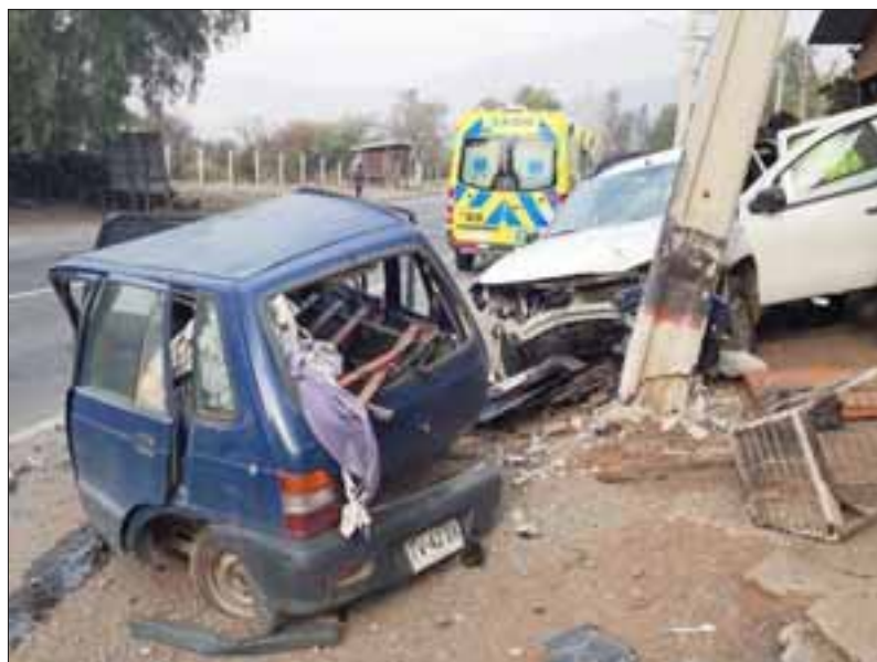
TREMENDO IMPACTO.- Este es el triste escenario tras el choque del vehículo marca Renault modelo Duster, matrícula HS BJ 56 contra un poste, reja y auto estacionado.

Al lugar del accidente concurrió una ambulancia de la base Samu de esa comuna y también de la Tenencia de Carabineros de Rinconada. La conductora, su hija y la asesora del hogar fueron derivadas hasta el Servicio de Urgencia del Hospital San Juan de Dios para su evaluación médica,