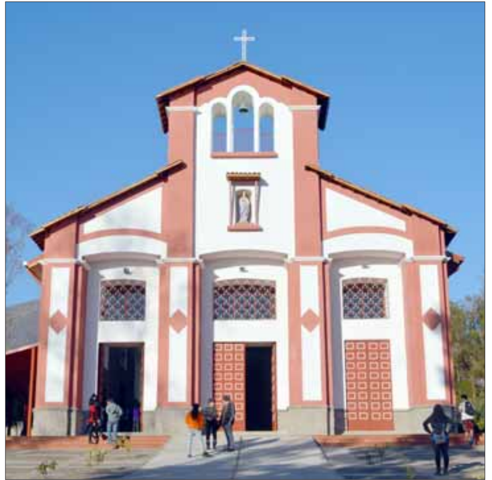
Momentos religiosos y puestos de especialidades campesinas, contempla la 'Fiesta Chica Santa Filomena', este sábado 13 y domingo 14 de julio.