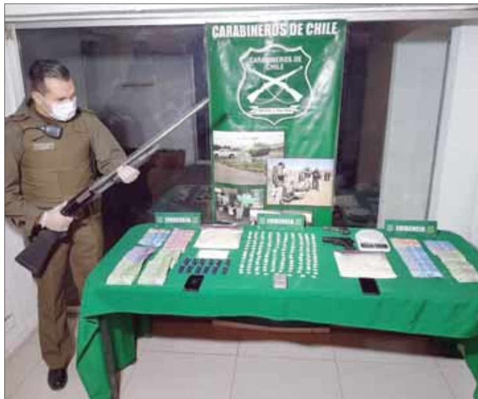
Más de un kilo de pasta base de cocaína, armas de fuego, municiones y dinero en efectivo fue el resultado de allanamientos efectuados por el OS7 de Carabineros en tres domicilios de Los Andes.