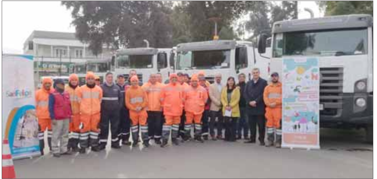
Representantes del municipio y de la empresa Veolia presentaron la nueva flota de camiones recolectores de basura que operarán en San Felipe.