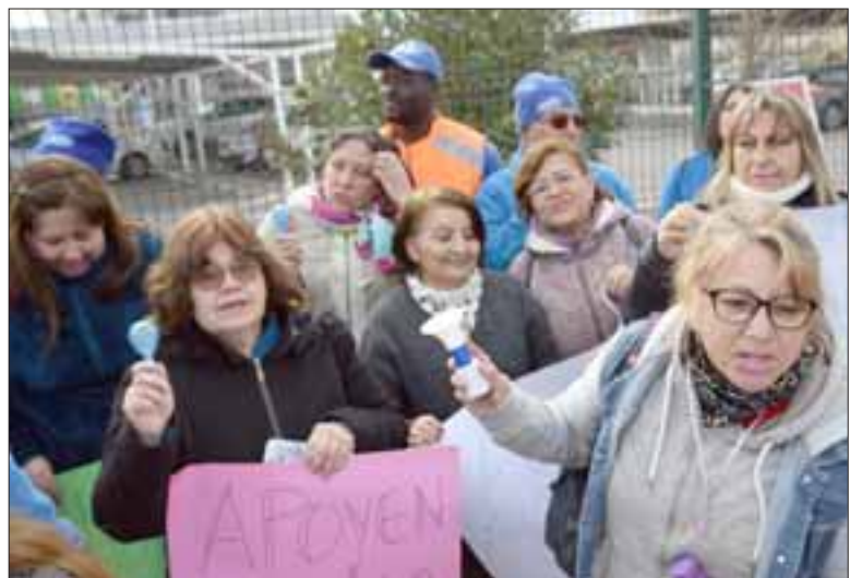
¿Y CÓMO ES LA WÁ? - Gritan los manifestantes a la empresa Walmart, 'Hay plata pal Negocio y no pa negociar'.