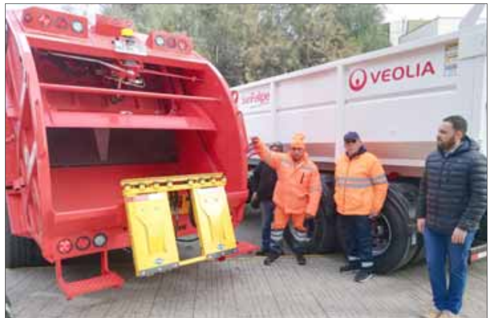
Trabajadores de Veolia, empresa a cargo del contrato de extracción de basura en la comuna, junto a uno de los nuevos camiones recolectores.

miones se mejora el estándar de compactación y también de levante, lo que significa avanzar en el proceso dirigido a un servicio de calidad en beneficio de la comuna.