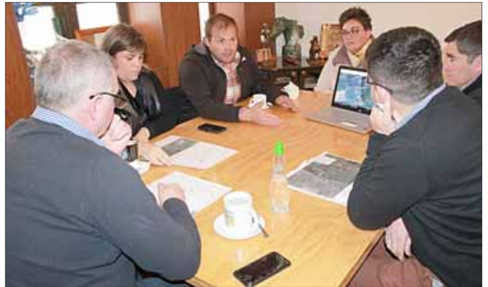
La reunión estuvo orientada a evaluar la aplicación de una serie de medidas de mitigación para minimizar el efecto que tendrá la construcción de un nuevo puente en la población.

Del mismo modo valoró la disposición que existe de parte de los profesionales de