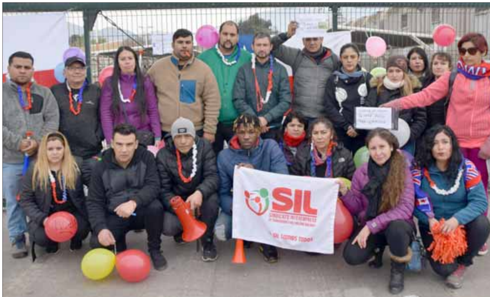
ACUENTA TAMBIÉN. - Los sindicalistas de Acuenta, también en San Felipe, se plegaron también a esta movilización nacional.