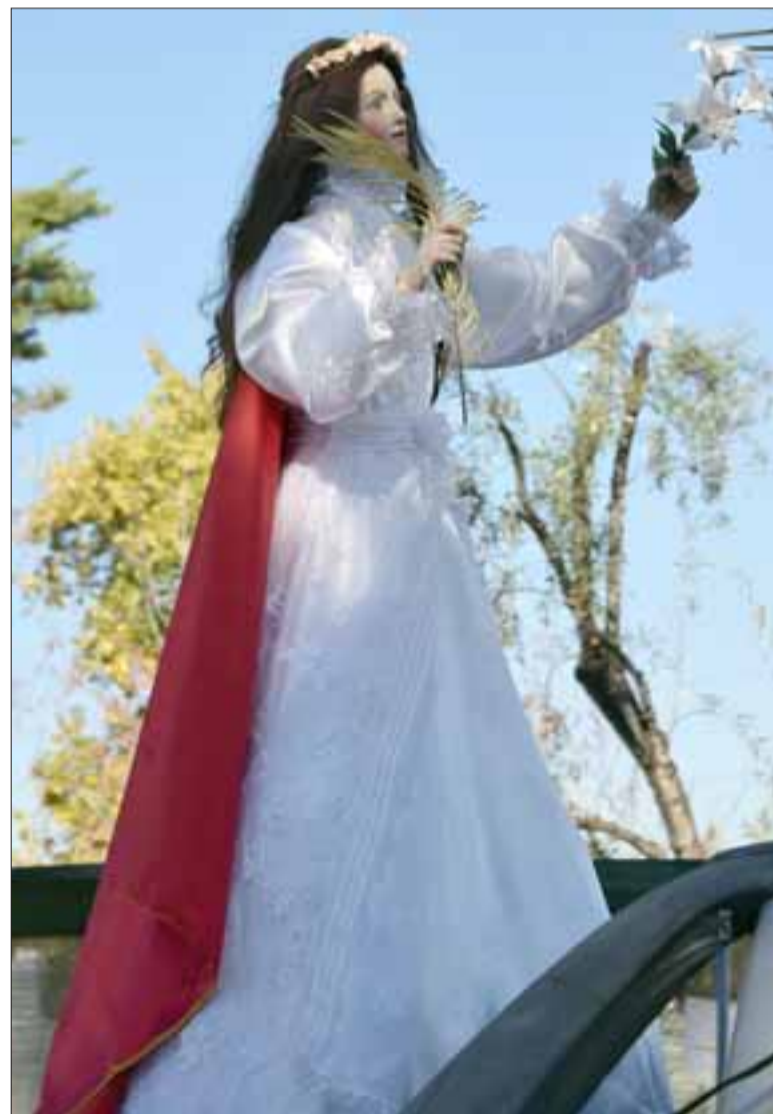
LA SANTA DE PASEO.- Ella es la reina de la comunidad, este sábado fue llevada de paseo por los rincones de Jahuel y Santa Filomena.