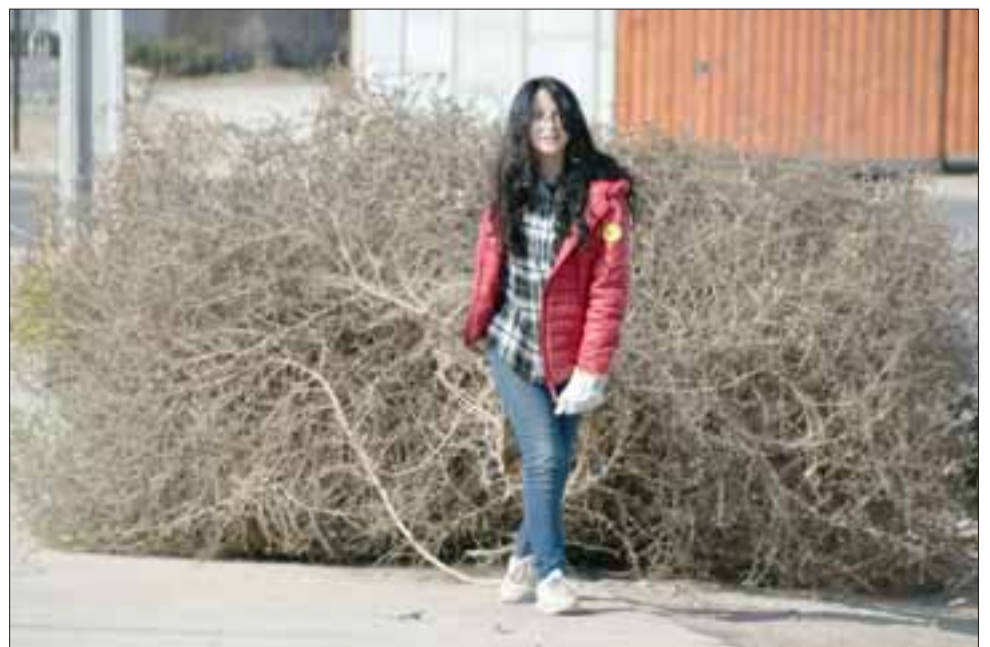
JUVENTUD PRESENTE.- Esta joven vecina se las ingenió para arrastrar grandes arbustos hasta la batea municipal.