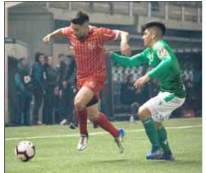
En el estadio Municipal de Florida se jugó el partido de ida por cuartos de final de Copa Chile entre Audax Italiano y Unión San Felipe.

El duelo que abrió la llave de cuartos de los octavos de final de Copa Chile, en-