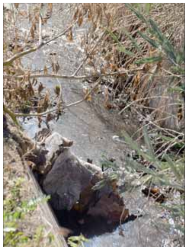
BASURA EN CANALES.- Así estaban los canales en esas plazoletas de la población, ahora el panorama es diferente.