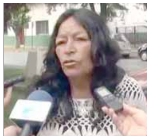
El vídeo se mantiene en las plataformas de internet como Youtube, Facebook y Twitter, transformándose en uno de los fenómenos populares a nivel nacional.

Según informó Carabineros, se efectuaron allanamientos simultáneos tras previa coordinación con la Fiscalía en dos domicilios, donde se estaría distribu-