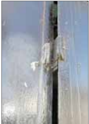
Acá estaba el candado que sacaron, destruido.

Unos $80.000 en efectivo, más de $300.000 en joyas, más varias cámaras de seguridad, fue el botín que dos reconoci-