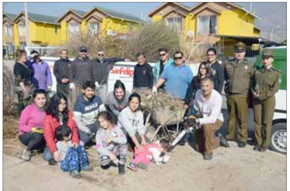
TRABAJO COMUNITARIO.- Ellos son parte del gran contingente de personas que limpiaron este sábado el borde estero en Población Carlos Pezoa.

total fueron entre ocho y diez bateas las que se recolectaron de basura, la que impedía una buena visibilidad del sector, participaron también las empresas Veolia y Proactiva», indicó el funcionario.