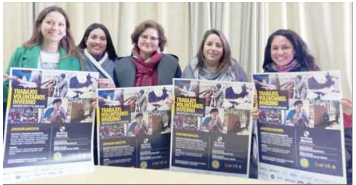
Estos profesionales pertenecen al equipo multidisciplinario del municipio que apoyará los Trabajos Voluntarios de Invierno, a desarrollarse en la comuna, desde el 17 y hasta el 20 de julio.

«Se efectuarán atenciones de medicina general, obstetricia, kinesiología, psicología, entre otros