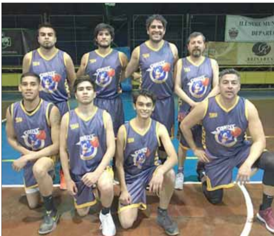
El experimentado quinteto del Sonic se impuso a la juventud del Prat.