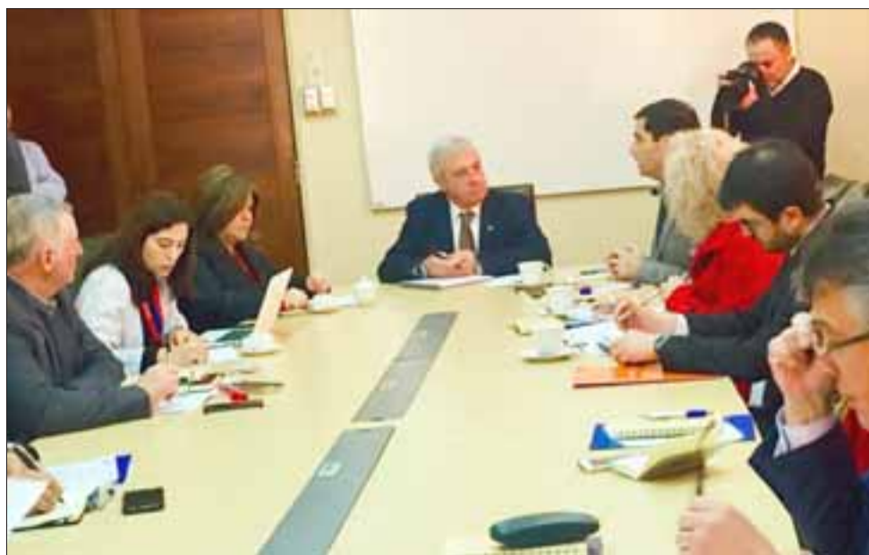
La autoridad comunal se reunió con el Secretario de Estado, tras una audiencia gestionada por la Amuch.