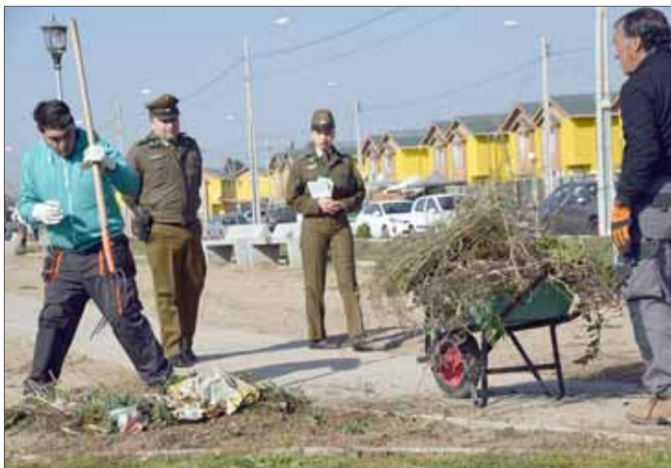
TODOS TRABAJAN.- Carabineros también estuvo coordinando con los vecinos y autoridades municipales para este operativo.