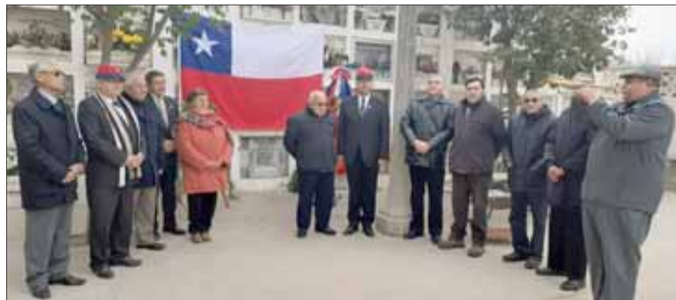
La directiva junto a los socios durante la ceremonia de homenaje a los seis sanfelipeños que participaron de la Guerra del Pacífico.