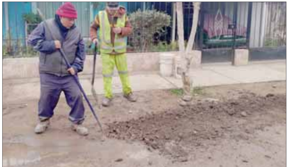
El municipio fiscalizará por ejemplo, la instalación de las conexiones domiciliarias bajo cota en 70 viviendas, además de los análisis de prueba necesarios para determinar si el sistema de alcantarillado funciona correctamente y otros detalles menores.

«Todo esto producto de un trabajo que hemos