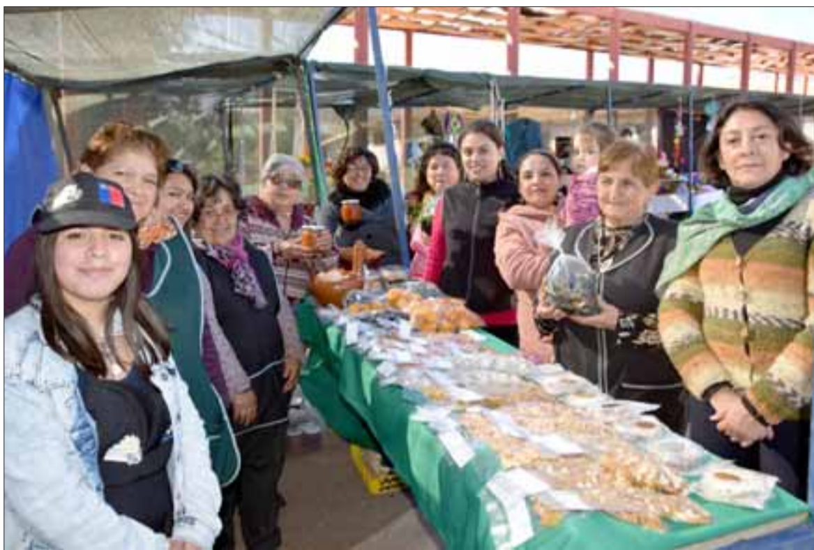
AGRICULTORES COMPROMETIDOS.- Ellos son algunos de los agricultores que en Santa Filomena estarán todos los meses ofreciendo sus productos y servicios en las afueras del templo.