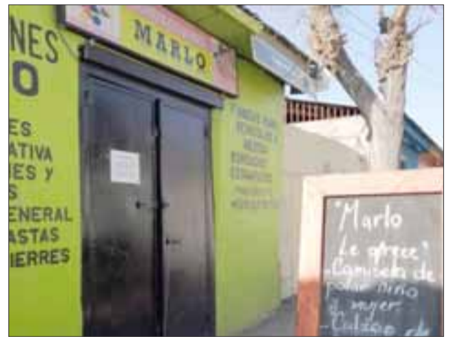
Este es el taller donde dos delincuentes muy conocidos entraron a robar la madrugada del jueves.

como dueña del local como para que estos tipos lleguen y se metan así sin ningún pudor roben las cosas que uno con tanto esfuerzo consigue, ellos lo más probable es que se la hayan consumido en drogas, eso esperando luego la detención, se están recopilando otras cámaras del sector que están cerca y se está con una abogada para hacer una segunda, tercera denuncia al respecto, porque con la que ya se hizo en Carabineros hay otra paralela con la ayuda de la municipalidad por el tema de seguridad ciudadana, esperamos que apresen a estos tipos y queden adentro y no tengan la puerta giratoria por la que están acos-