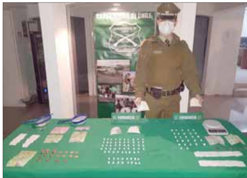
Personal de OS7 de Carabineros Aconcagua incautó diversas cantidades de pasta base de cocaína, una pesa digital y dinero en efectivo desde dos viviendas ubicadas en Las 4 Villas de San Felipe.

Tras juicio en Tribunal Oral de San Felipe: