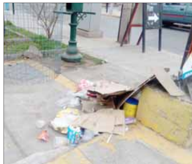
En la imagen se aprecia la basura que queda por las noches y que sería dejada por los operarios que retiran las botellas plásticas, asegura el denunciante.