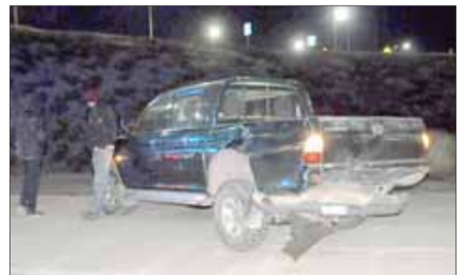
El procedimiento policial fue adoptado por Carabineros de San Esteban y recabó los antecedentes para la investigación que determinarán las responsabilidades.