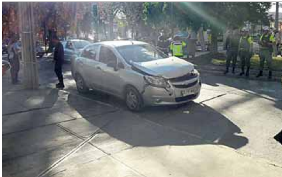
Ambos conductores protagonistas de esta colisión resultaron con lesiones de carácter leve.