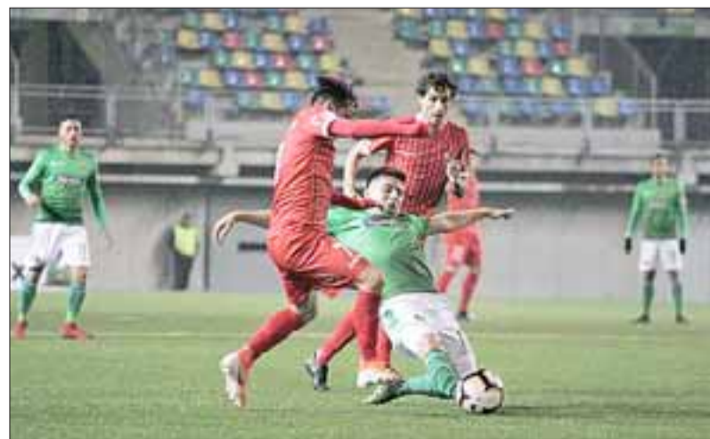
La llave que protagonizan el Uní Uní con el cuadro itálico quedó abierta después del empate en blanco de La Florida.

18:30 horas: Universidad Católica – Santiago Morning