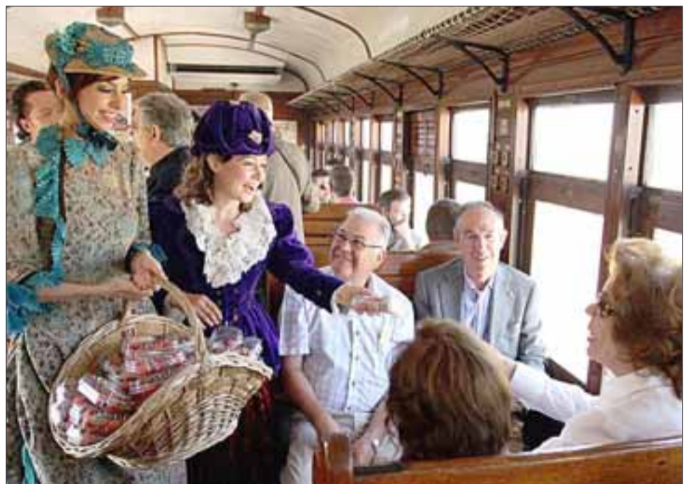
MUCHOS LO SUEÑAN.- Personal vestido a la Época atenderá a los turistas que suban a este tren, posiblemente algunos folcloristas recorran vagón por vagón alegrando a los pasajeros y vendiendo dulces y frutos de nuestro valle. (Referencial)