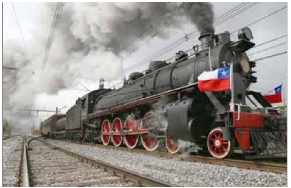
VIENE EL TREN.- Muy pronto un tren más hermoso que este podría estar recorriendo todo el Valle de Aconcagua hasta llegar a Quintero, y regresaría de nuevo a Los Andes en horas de la tarde. (Referencial)

- Este tren haría paradas, la idea es que de diciembre a marzo el tren funcione una vez al día, el viaje será ida y vuelta, ese es el Tour, se parte de Quintero y llega a Los Andes y viceversa. La verdad que estamos bastantes entusiasmados, tenemos conversaciones muy avanzadas, los carros ya están, son propiedad de EFE (Empresa Ferrocarriles del Estado), son carros antiguos, se van a reparar para que queden avejentados con las mismas condiciones de hace 40 años atrás, con un personal que va ser adecuado a la época, habrá atracciones en las paradas con artesanos, comerciantes y todo lo que tiene que existir en una ruta turística de verdad. Desde La Calera serían al menos tres detenciones, estas serían en Llay Llay, San Felipe, Curimón y Los Andes, en donde está el convento donde vivió y murió Sor Teresa. A este