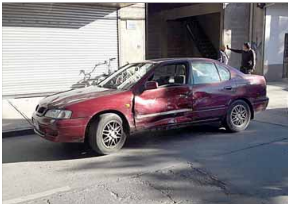
El conductor de este vehículo se desplazaba por Chacabuco al oriente, con paso preferente.