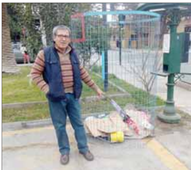
Para dejar limpio el entorno tuvieron que depositar en el interior del aparato la basura.

Bastante molestia existe entre los conductores de taxis que están ubicados en calle Santo Domingo, al llegar a Portus, frente a un supermercado. Lo anterior porque, según ellos, los operarios de la empresa que tiene un dispositivo para recolectar botellas plásticas, al momento de retirarlas dejan basura alrededor.