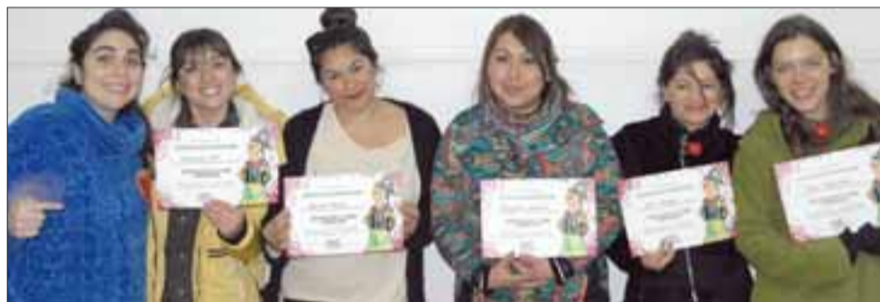
TALLER TERMINADO.- Al final de la jornada vemos a varias participantes con su respectivo diploma y una gran sonrisa.