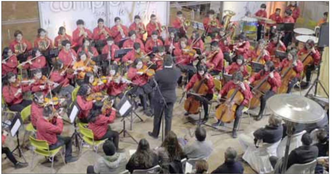
La orquesta interpretó piezas clásicas y folclóricas donde los jóvenes mostraron todo su talento.