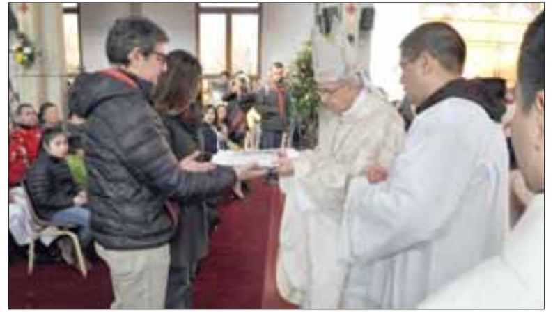
Autoridades, instituciones, religiosas, directivos de Fundación Teresa de Los Andes y peregrinos llegaron hasta el santuario para participar en esta relevante ocasión.

Durante la Misa fue leído el mensaje del Papa Francisco por esta festividad de la santa y, particularmente, lo relativo a la declaración de templo jubilar para el del santuario y monasterios Carmelitas Descalzas; también fue presentado el decreto del Año de Gracia Jubilar y el nuncio apostólico impartió la bendición especial al concluir la eucaristía.