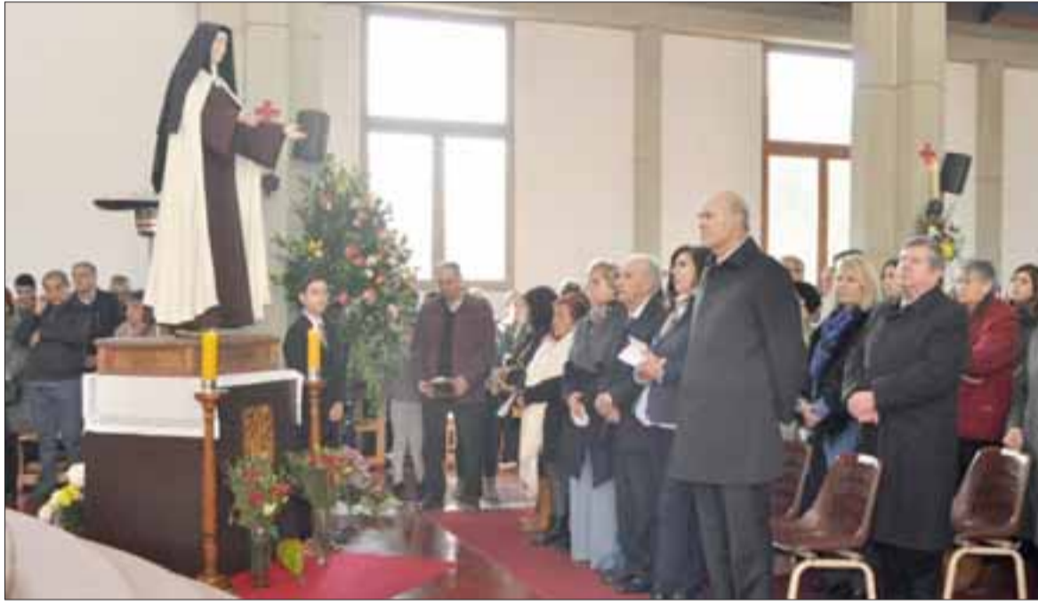
Durante la Misa fue leído el mensaje del Papa Francisco por esta festividad de la santa y, particularmente, lo relativo a la declaración de templo jubilar para el del santuario y monasterios Carmelitas Descalzas.

Autoridades, instituciones, religiosas, directivos de Fundación Teresa de Los Andes y peregrinos llegaron hasta el santuario para participar en esta relevante ocasión.