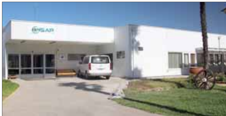
A fines del presente mes se estaría implementando el programa que brindará atención integral a los pacientes, y su entorno, que sufran de algún cáncer terminal.

La implementación de esta prestación estaría en funcionamiento la última semana de julio y forma parte de los compromisos adquiridos por el Hospital San Antonio de Putaendo en su última Cuenta Pública.