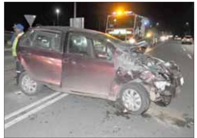
Cinco fueron las personas heridas a consecuencia de la colisión por alcance ocurrida en Avenida Alessandri, en el sector del Enlace San Esteban.

El procedimiento policial fue adoptado por Carabineros de San Esteban y recabó los antecedentes para la investigación que determinarán las responsabilidades, en tanto que hoy los antecedentes del hecho serán puestos a disposición del Juzgado de Garantía de la comuna.