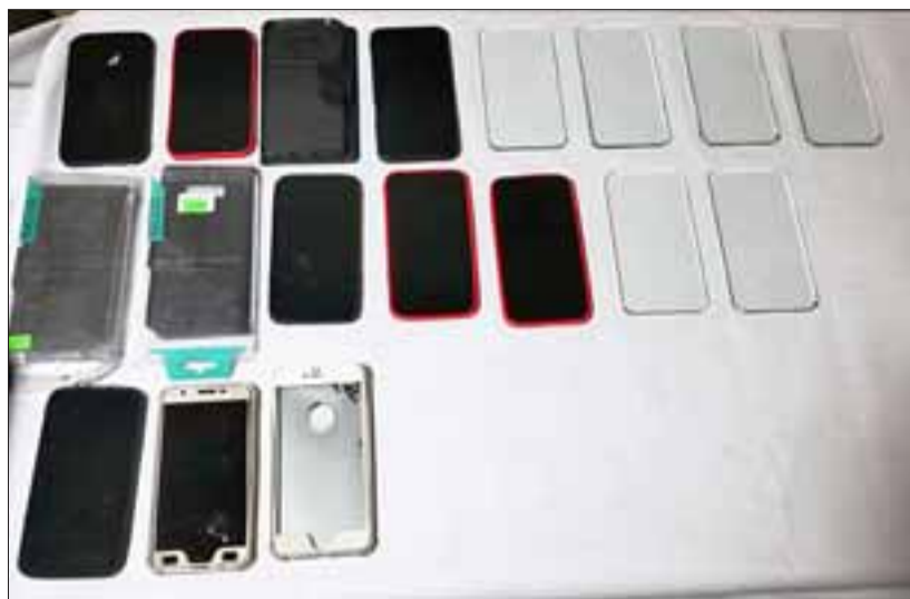
Personal de la Sección de Intervención Policial de Carabineros incautó los falsos celulares con los que se estarían cometiendo las estafas.

«Estas personas andaban acá en San Felipe, efectuando procedimientos de estafa, pero primero fueron sindicados que ellos habían cometido un robo. Posteriormente al ser fiscalizados se logró establecer que estarían efectuando la venta de teléfonos celulares, finalmente lo que le entregaban a las personas era un trozo de vidrio con carcasa de celulares (...) Una persona al momento que le iba a entregar el dinero se perca-