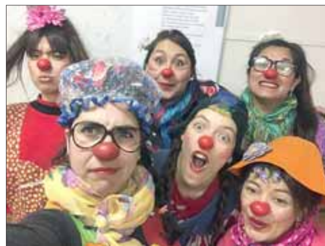
A REÍR SE HA DICHO.- Estos vecinos de Putaendo lo pasaron regio con esta profesional de Clown, posiblemente volveremos a saber de ellos muy pronto.