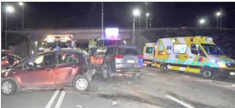
Los protagonistas en esta triple colisión son la camioneta Mitsubishi modelo Katana, matrícula ZX-9513, el automóvil Toyota Yaris Sport, patente CTTX-61, y la suv Mitsubishi Montero Sport, placa JBKJ-37.