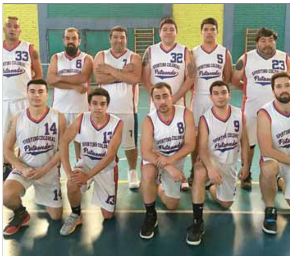
Los putaendinos del Sporting Colonial no pudieron con la jerarquía de uno de los favoritos del Apertura de la ABAR.

El cuadro de Los Andes no pudo vencer al porfiado equipo de Salamanca.