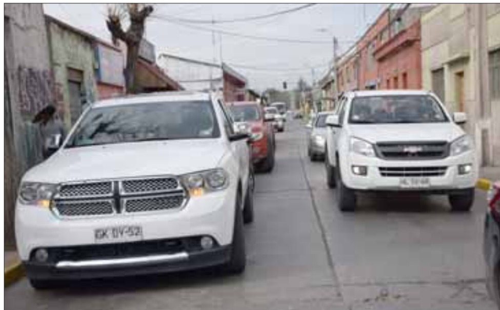
NUEVO ORDEN VIAL. - Así luce Calle Freire en la actualidad, veremos cómo estará a partir del amanecer del sábado.