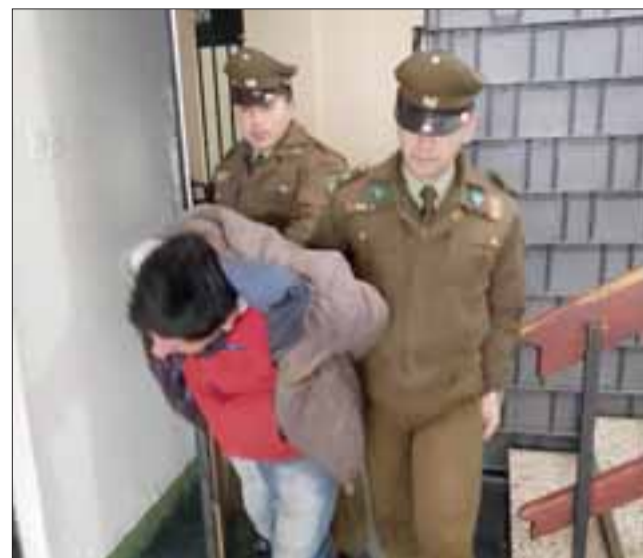
El antisocial conocido como 'El Cota' fue capturado en flagrancia por Carabineros de la Tenencia de Santa María.