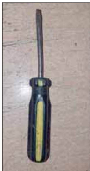
Carabineros incautó este destornillador que habría sido utilizado por el delincuente.