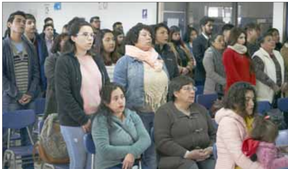
Los estudiantes beneficiados concurren acompañados de sus familiares a la entrega de becas.

fuerzo que realizan estas familias para financiar los estudios de sus hijos, es por eso que como municipio hemos intensificado nuestros esfuerzos para apoyarlos con esta beca municipal y la residencia universitaria. Pese a ser un municipio pequeño hemos hecho grandes esfuerzos para ayudar a nuestros jóvenes, comprometiendo cada año más recursos para apoyarlos en su formación académica», anunció el edil.