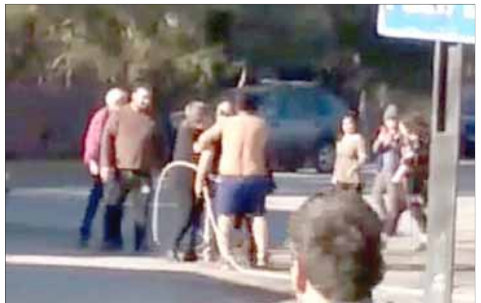
Los vecinos del sector debieron intervenir la tarde de este martes en la vía pública, debiendo solicitarse la presencia de la Policía de Investigaciones.