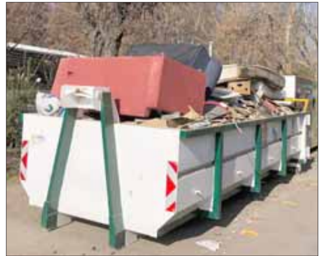
Con el fin de evitar la proliferación de micro basurales, el municipio dispuso una batea que está en constante tránsito por los sectores de Panquehue.

Para el profesional, es muy importante que los vecinos de Panquehue asuman el cuidado y protección con el medio ambiente, «pues ya hemos logrado resultados en el sentido que ha ido paulatinamente disminuyendo la cantidad de toneladas de basura que se envía hasta el relleno sanitario de San Felipe, lo que repercute en el menor gasto por parte del municipio en este concepto», concluyó.