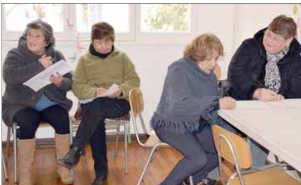
MENTES ACTIVAS.- Muchas dinámicas de estudio, pasatiempos, ejercicios y vida social es la que logran desarrollar estos adultos mayores en el Centro Diurno.