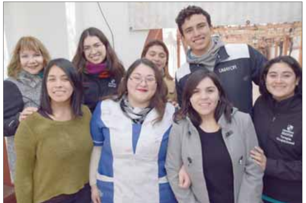
ELLOS AL FRENTE.- Aquí tenemos personal municipal del Centro Diurno, y estudiantes de la Universidad Mayor, quienes atienden este grupo etario de nuestra comuna.