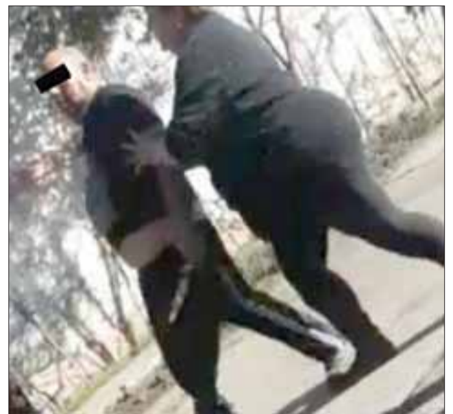
El registro audiovisual daría cuenta que el agresor mantenía en sus manos un cuchillo.