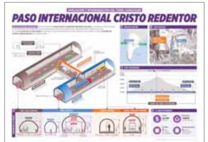
La ampliación y modernización del Paso internacional Cristo Redentor beneficiará a más de 2.600 usuarios que circulan a diario entre Argentina y Chile.

La ampliación del Cristo Redentor se realizará en dos etapas -en las que se ejecutarán obras en ambos lados de la cordillera- y serán licitadas de manera independiente por Argentina y Chile. La primera etapa de ampliación del lado chileno se encuentra en la fase de preparación final y se estima que será licitada antes del fin de año.