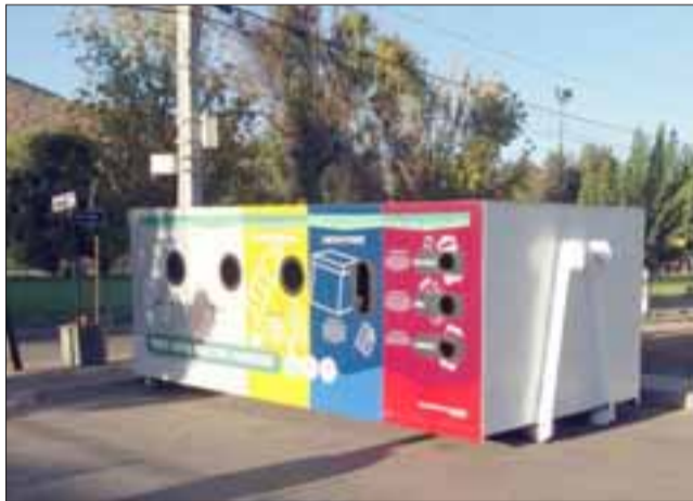
Ahora los panquehuinos cuentan con puntos verdes de reciclaje, ayudando a reciclar al separar la basura en latas, cartón, vidrios, botellas plásticas, pilas y baterías en desuso.