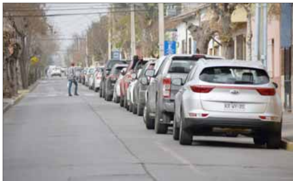
COSA DEL PASADO. - Esta es Calle San Martín, a partir del viernes en la noche cambiará de sentido la dirección del tránsito, y estos autos no podrán estacionar más en la vía.

los van a volver a encender una vez que ya se produzca el cambio del sentido de tránsito del damero, toda vez que la posición de los semáforos sea invertida (...) luego de las 18:00 a las 20:00 horas es estará en los ejes Yungay y Hermanos Carrera con Tocornal-Prat y con Bernardo Cruz-Santo Domingo, y ahí vamos a provocar el primer cambio del sentido de tránsito a las 20:00 horas , eso es en el eje Bernardo Cruz con Tocornal y entre Yungay con Hermanos Carrera (...) Luego pasadas las 20:00 horas, después de provocar ese cambio del sentido de tránsito, los equipos de esta empresa se trasladarán al eje Maipú para implementar los semáforos de Maipú con Prat, Maipú con Merced - que ya no van a tener el tercer tiempo para virar- y luego van a encender los semáforos de Santo Domingo y Freire, que son los que incorporan el tercer tiempo para el viraje a la izquierda (...) una vez que eso haya ocurrido (22:00 horas) estaremos en condiciones de poder ir ejecutando el cambio al interior del damero y también hacia las afueras con calles como Cajales, Santa María Eufrasia. Esperamos terminar