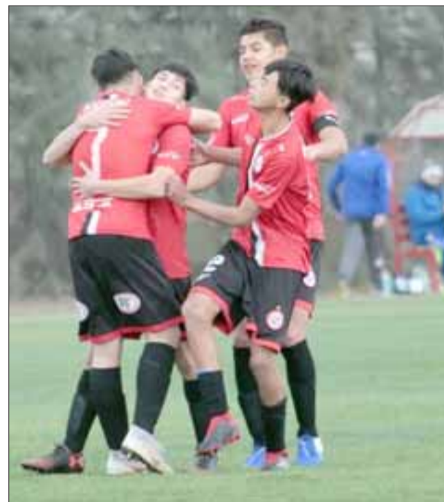
Mañana muy temprano Unión San Felipe realizará una prueba de jugadores para sus series menores.