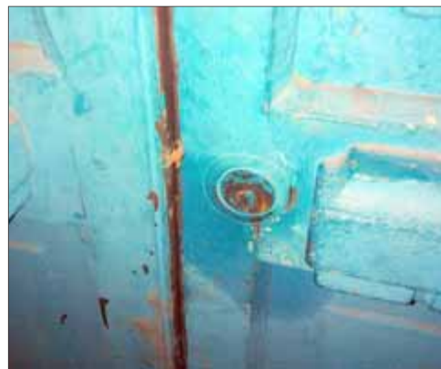
El sujeto intentaba abrir la puerta principal del local comercial ubicado en calle Almirante Latorre de Santa María, lugar donde reside su propietario.