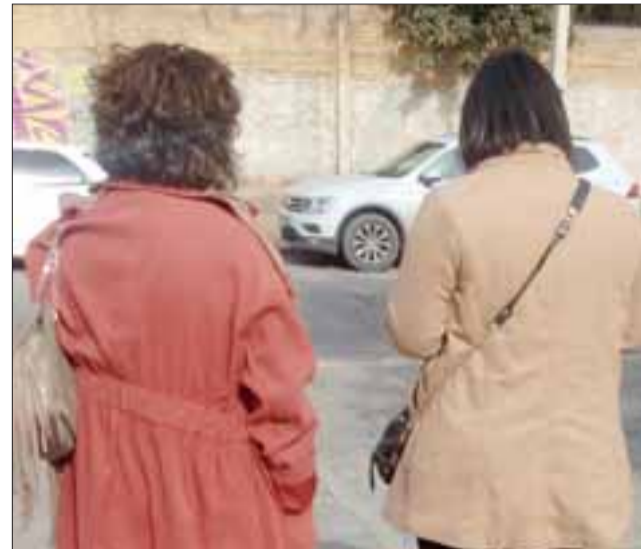
Las hermanas saliendo de tribunales donde fueron a averiguar la situación vivida por su hermano. (Por seguridad no mostramos sus rostros).