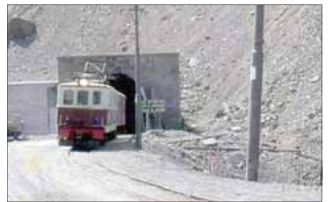
Este túnel actualmente se encuentra inhabilitado para el paso de vehículos, a pesar que en los años 90 se usó para el tránsito de camiones.