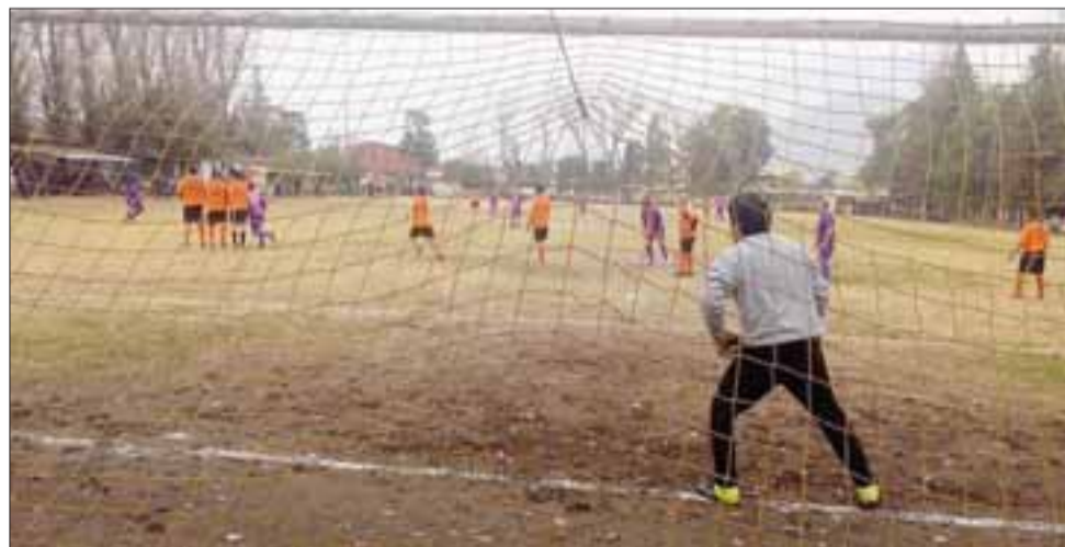
En la Liga Vecinal se estrechó la lucha en el torneo de Apertura.

Carlos Barrera 1 – Unión Esperanza 1; Andacolco 0 – Santos 0; Los Amigos 0 – Villa Los Álamos 0; Barcelona 1 – Villa Argelia 0; Pedro Aguirre Cerda 2 – Unión Esfuerzo 1; Tsunami 3 – Aconcagua 2; Hernán Pérez Quijanes 4 – Resto del Mundo 1.