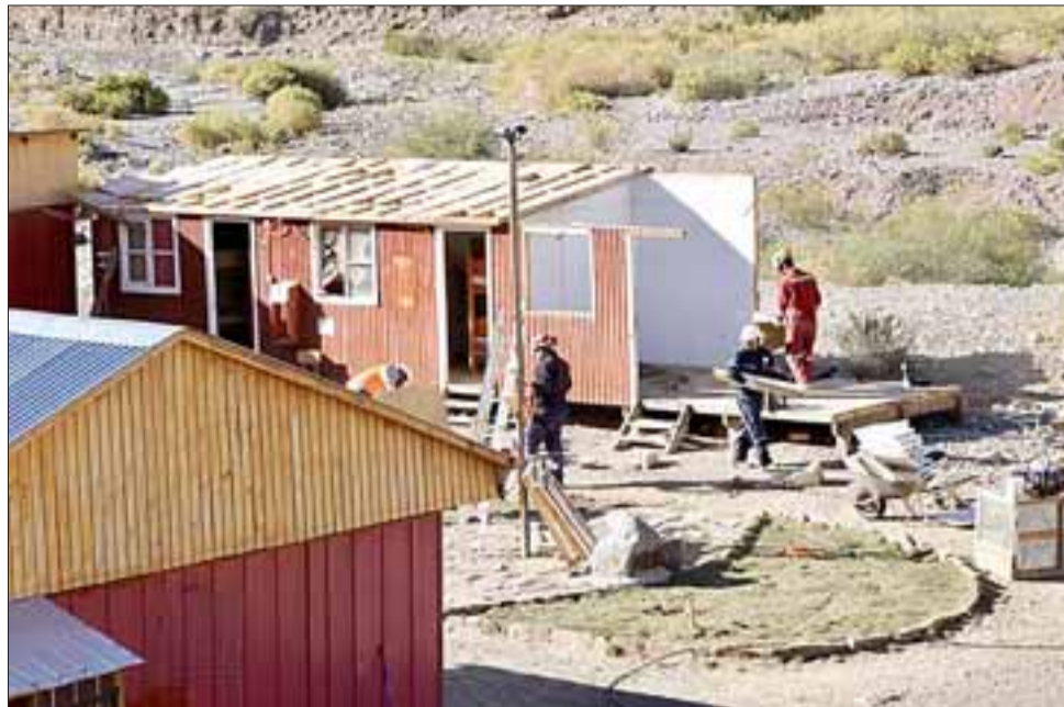
Así lucían las obras hace pocos meses cuando desmantelaron campamento minero de compañía Vizcachitas Holding.

Un proyecto minero rechazado por las autoridades y comunidad putaendina, quienes han intensificado sus líneas de acción para seguir rechazando éste y otros proyectos mineros que amenacen la vida y el futuro de Putaendo.