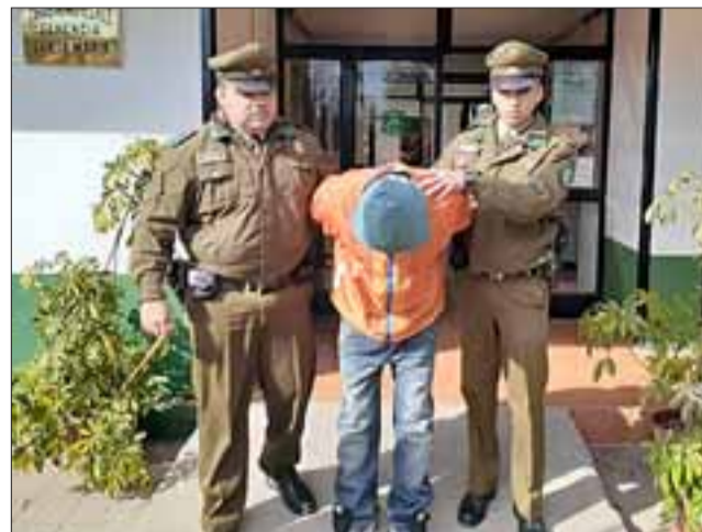
Carabineros de Santa María detuvo al ladrón luego del reconocimiento de la víctima como autor de robo en lugar habitado.

Labores se extendieron por más de dos horas: