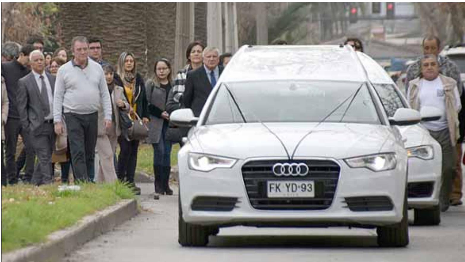
LO DESPIDIERON.- Una extensa muchedumbre de amigos y familiares caravana acompañó los restos mortales del extinto empresario en su último viaje al Más Allá.