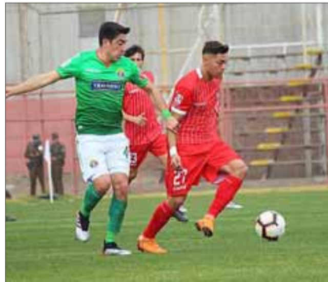
Un gol fue la diferencia que hubo entre sanfelipeños e itálicos en la llave de octavos de final de la Copa Chile.