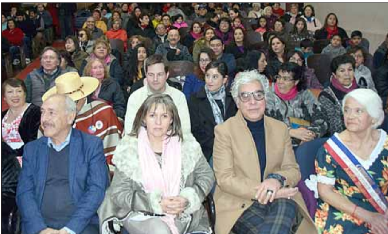
NOCHE DE CUECA.- Concejales y demás autoridades apoyaron con su aplauso cada una de las presentaciones.