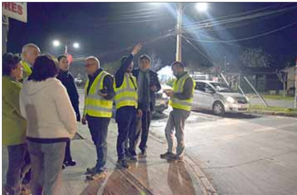
LARGO MONITOREO. - Un gran contingente de empleados municipales y Carabineros, se apostaron durante las siete horas del operativo en las principales vías de nuestra comuna.

En el transcurso de la jornada se implementaron el resto de los ejes, finalizando con los cambios de tránsito en Santa María Eufrasia y Artemón Cifuentes, cerca de las 23:30 horas.