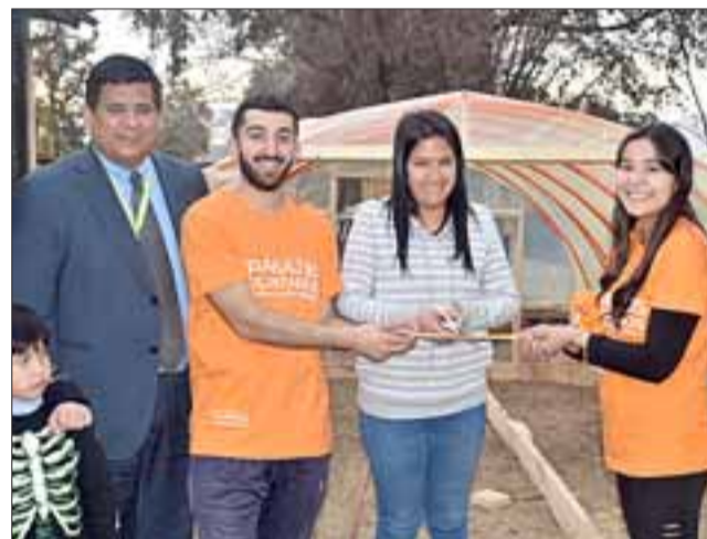
Una hermosa experiencia de convivencia y participación tuvieron los voluntarios que trabajaron en la construcción de un invernadero en la Escuela Especial.

Los trabajos voluntarios de invierno tuvieron un gran cierre en cada una de las localidades, donde los estudiantes resaltaron la participación de las comunidades, el sentirse muy acogidos y felices de haber dejado un legado durante su estadía en Santa María. Para agradecer todo su trabajo, Zurita les brindó un almuerzo de camaradería en los jardines de la piscina municipal, para luego emprender el viaje de retorno a sus hogares.