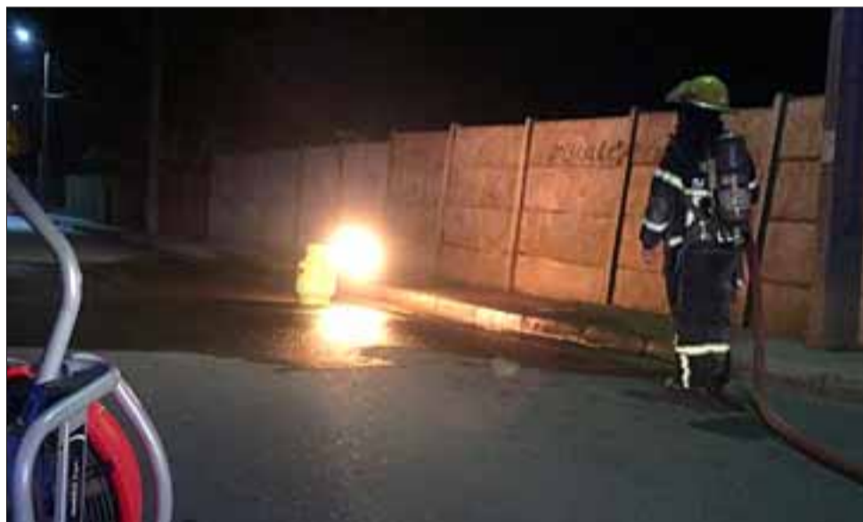
Por más de dos horas, Bomberos debió quemar el gas licuado tras la fuga del cilindro hasta controlar la emergencia.