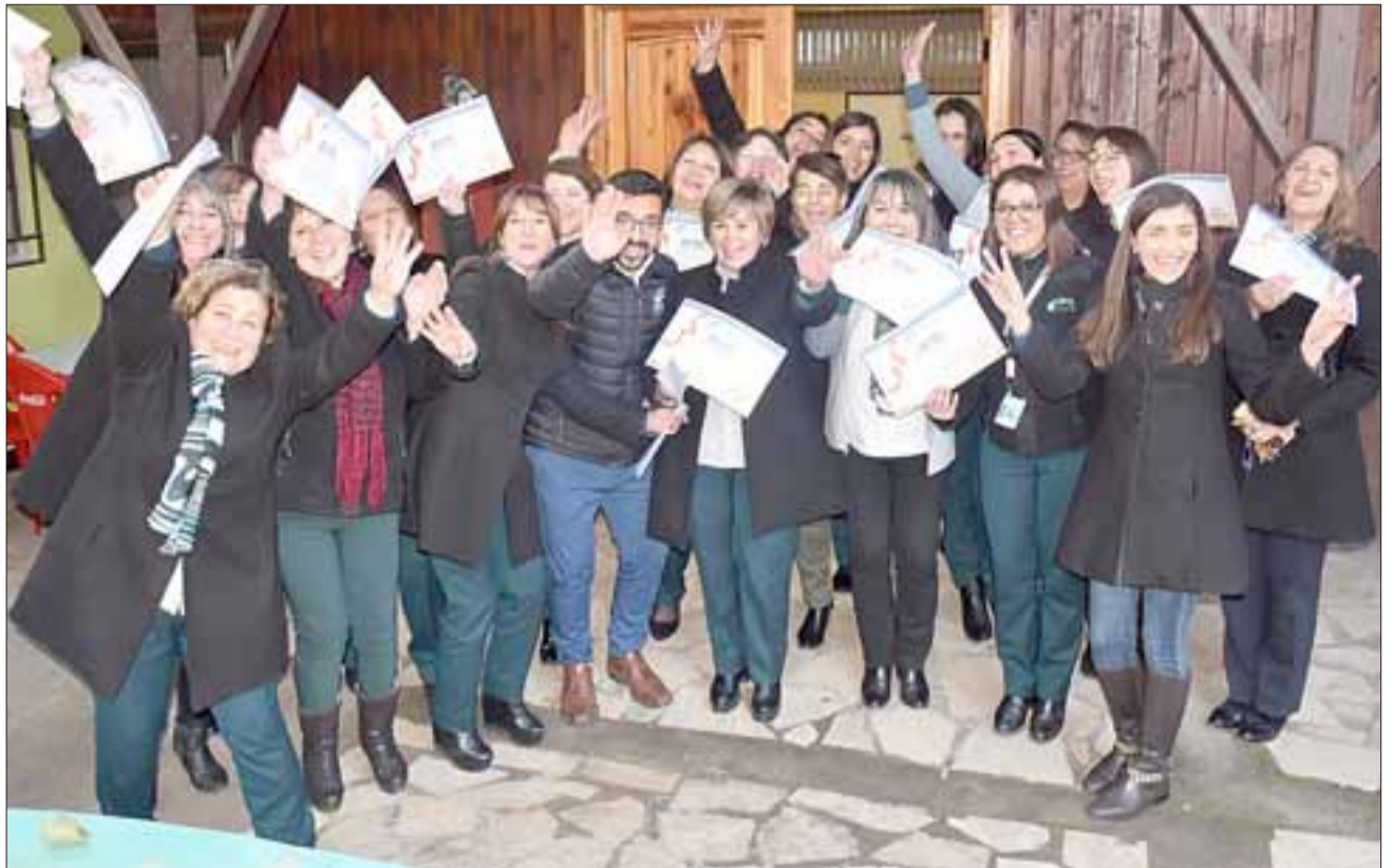
Tras estas jornadas de capacitación, se hizo entrega de un diploma a cada funcionario participante.

La iniciativa se llevó a cabo durante un mes, divididas en cinco sesiones,