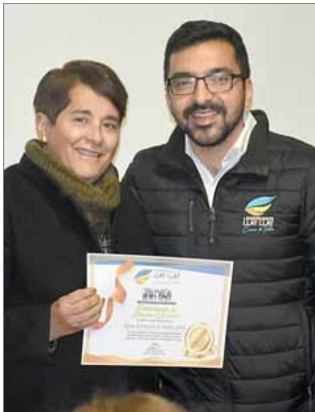
Cada uno de los funcionarios municipales que recibió su diploma, cuenta ahora con mejores herramientas para atender a los llayllainos en el municipio.

donde los representantes de cada departamento explicaron a los asistentes el funcionamiento de sus respectivas áreas y los tramites que se realizan en ellas, para así guiar de mejor forma a los vecinos que llegan al municipio durante cada jornada.