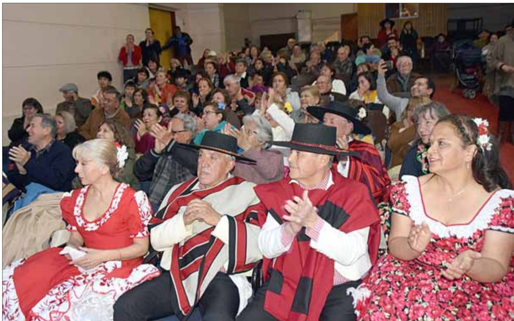
LOS PARTICIPANTES.- Aquí vemos a varias de las parejas participantes en este campeonato comunal, todos lucieron impecables.

Los jurados son de nivel nacional son: Jorge Mar-