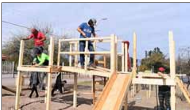
Aquí voluntarios trabajando en sector La Higuera recuperación de espacio público y construcción de juegos infantiles.

vida de nuestros vecinos en sus barrios».