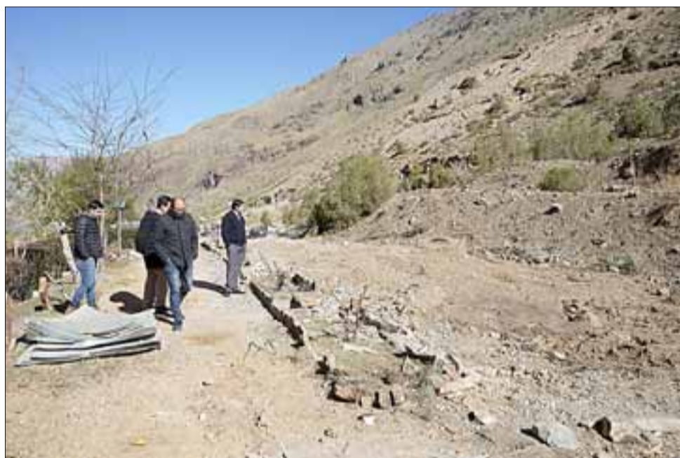
Así quedó ahora el lugar, luego que el fallo judicial se ejecutara por completo, las autoridades así lo confirmaron.