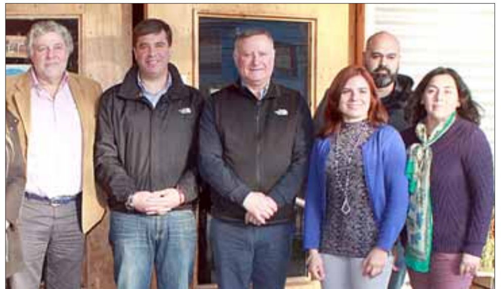
El programa Comuna Energética está orientado a darle ímpetu a la gestión y acción local energética, aquí vemos a varios de las autoridades presentes en esta jornada de trabajo.

La reunión contó con una presentación detallada de cómo los municipios pueden generar una agrupación para postular al programa Comuna Energética, además de informarse sobre los tipos y financiamiento para proyectos de eficiencia energética y de energía renovable que se podrían ejecutar en sus comunas. Frente a esto,