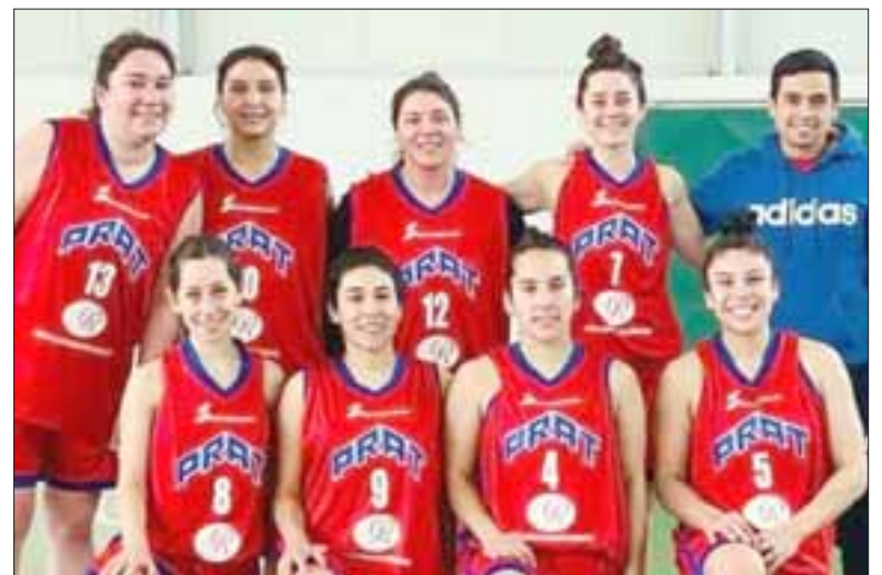
PODEROSAS. - Estas chicas son las más competitivas, las basketbolistas tienen muchas medallas y copas ganadas.

«Nuestra rama de pesca y caza es muy destacada a nivel nacional, y en el caso del básquetbol hoy en día está en el tapete ya que en los últimos tres a cuatro años participa en la segunda liga más importante del país en la categoría semiprofesional en la Liga Nacional de Básquetbol de la Segunda División. Nuestro club también ha tenido logros importantes en pesca y caza con campeonos nacionales, en el fútbol en varios campeonatos y en el Básquet como Campeones del Doma-