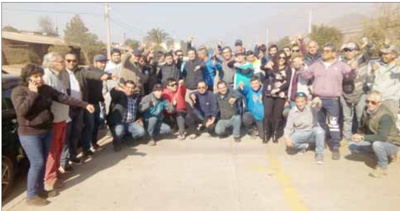
Un grupo de conductores y dueños de taxis colectivos en el bandejón de Avenida Diego de Almagro.