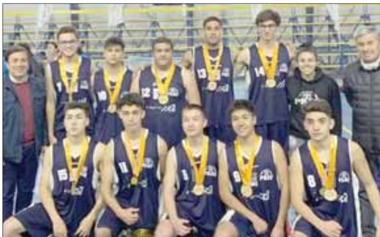
Ellos son los guerreros campeones del equipo adulto, ganaron el Torneo Aniversario de Los Andes.