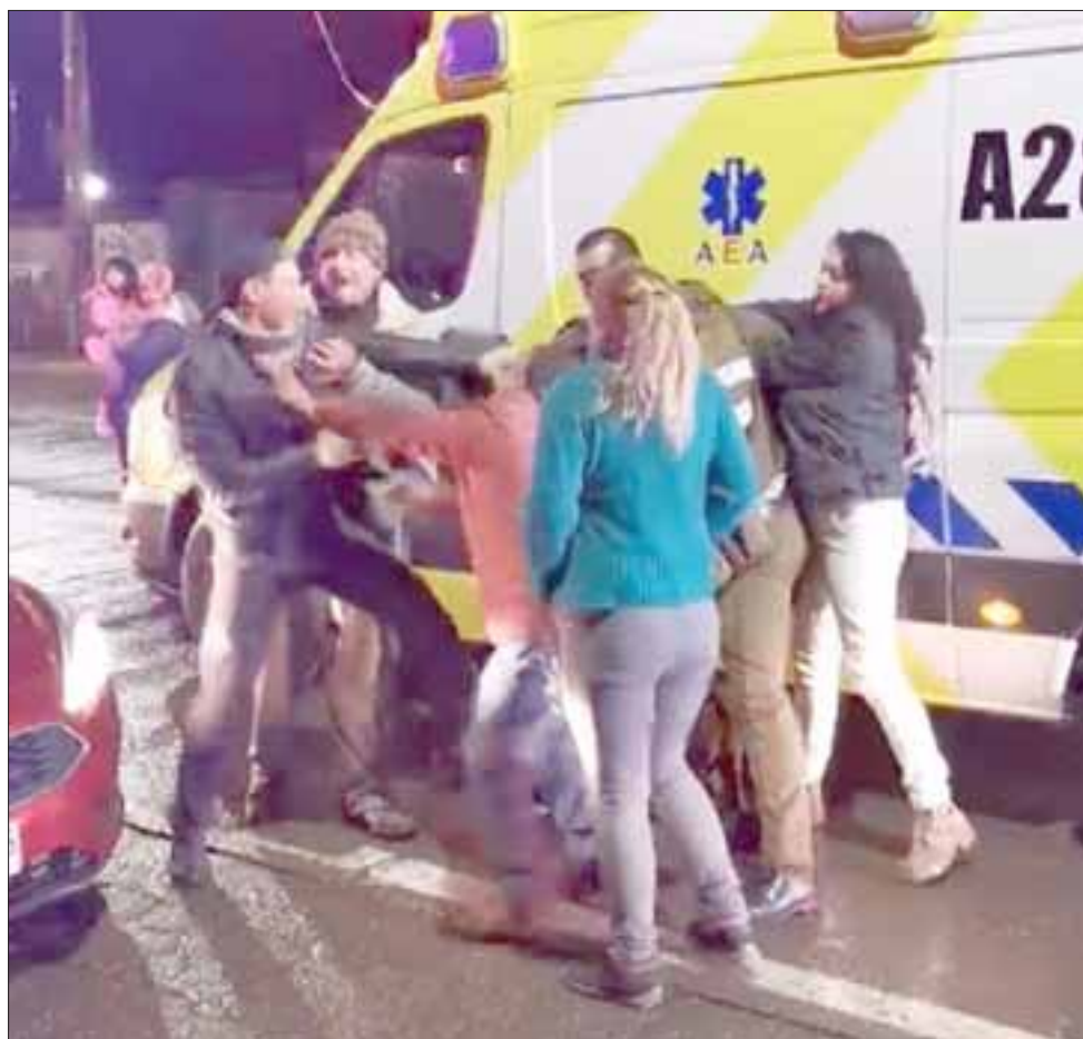
Los protagonistas del accidente se trenzaron a golpes en la esquina de las avenidas Maipú con O'Higgins en San Felipe.