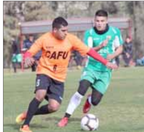
En el ensayo realizado el lunes en la mañana, el Uní Uní se impuso por la cuenta mínima a Trasandino.

El encuentro de preparación constó de dos tiempos de 35 minutos cada uno, en los que tuvieron la oportunidad de actuar gran parte de los planteles de ambos conjuntos que este fin de semana harán frente a desafíos muy importantes en sus res-