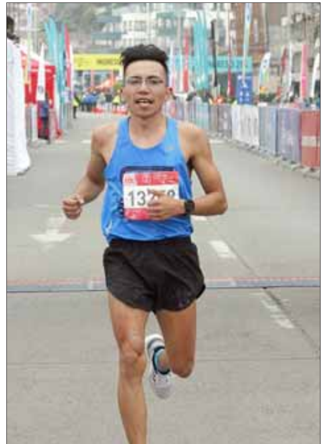
EL NÚMERO UNO. - El esfuerzo que él hace por lograr sus metas ya le ha generado grandes satisfacciones personales.

- Muy emocionado, valoro mucho esta premiación, lo recibo con humildad pues amo mucho a mi ciudad, esperé este premio desde hace varios años, gracias