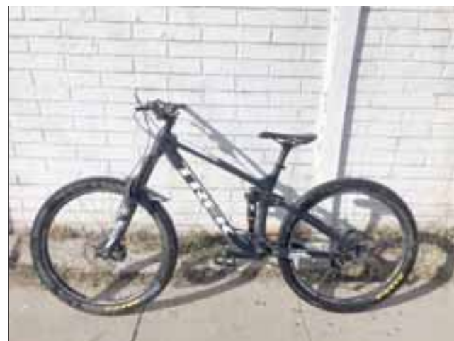
Esta es la bicicleta que fue robada desde un inmueble ubicado en Salinas con Uno Norte.

Reconoce que Carabineros llegó en cuatro vehículos que se dispersaron por