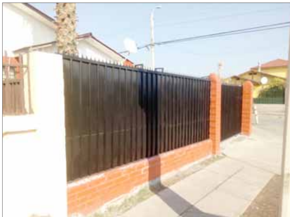
Por acá dice la afectada que los delincuentes sacaron la bicicleta, pese a la protección 'Dientes de León'.

el sector: «Se portaron súper bien, pero ya era tarde, no encontraron nada», indicó.