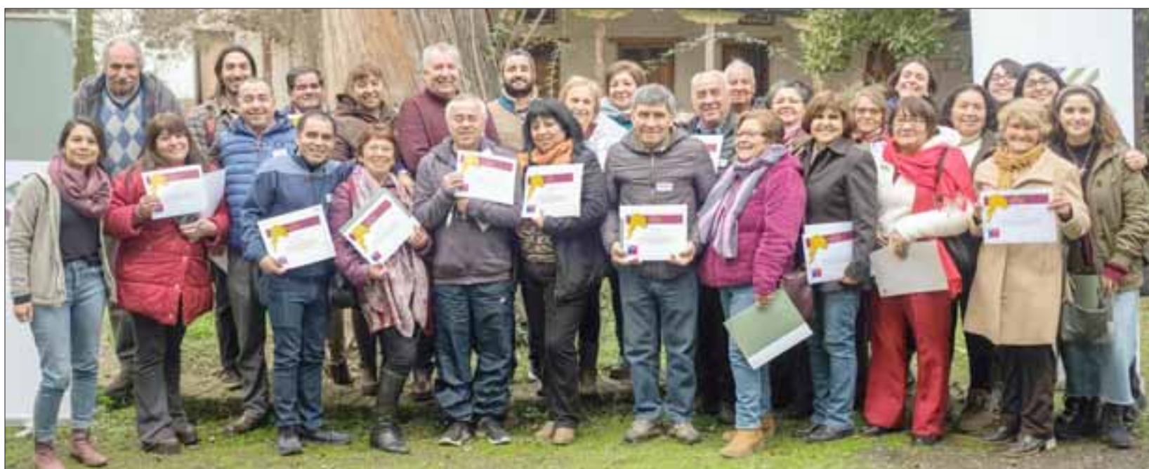
FORTALECIENDO SU IDENTIDAD. - Ellos son varios vecinos de Curimón, en su mayoría muy comprometidos con la gestión patrimonial y turística.

En la instancia, organizada por Fundación Lepe y el Ministerio de las Culturas, Artes y el Patrimonio, se dio espacio para fortalecer capacidades sobre la aplicación de la Convención para la Salvaguardia del Patrimonio Cultural Inmaterial de la Unesco en Chile, indagar en los ámbitos del patrimonio inmaterial y su identificación, sus principios éticos, análisis de casos y medidas de salvaguardia.