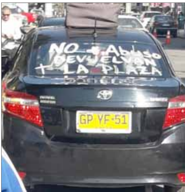
La leyenda sobre uno de los taxis colectivos que se podía apreciar ayer durante la marcha por el centro de la ciudad.