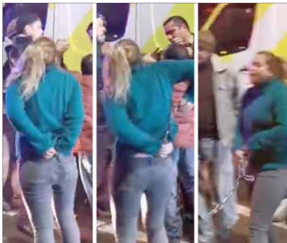
La rubia de las imágenes estaría siendo acusada de agredir a una paramédico del Samu con un golpe de puño la noche del pasado domingo tras el accidente de tránsito.

«Al parecer esta persona que estaba involucrada en el accidente esperaba ser atendida -o alguien cercano- de inmediato, pero en realidad la determinación de quién o qué secuencia son atendidos, es una labor inminente al SAMU. Bajo