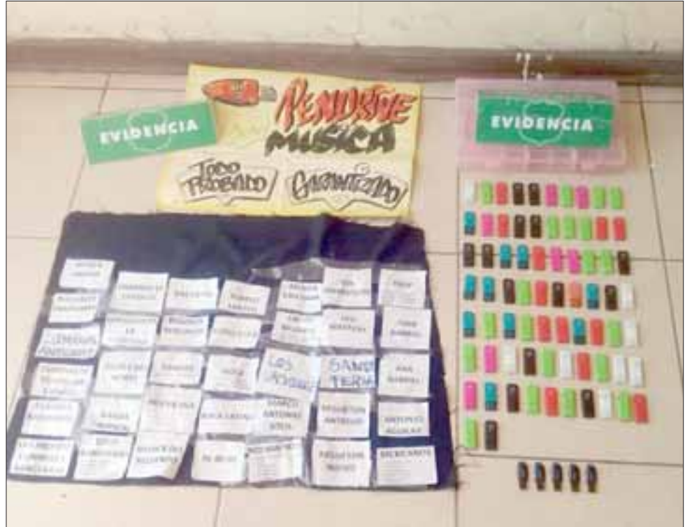
Sujeto llegó de Santiago y se instaló a un costado de los puestos ubicados en la feria de la Plaza de Armas, con esta mercadería.