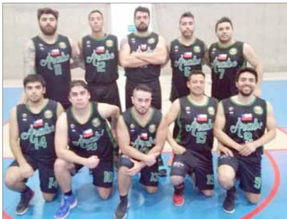
El Árabe se impuso con comodidad al juvenil equipo de San Felipe Basket.