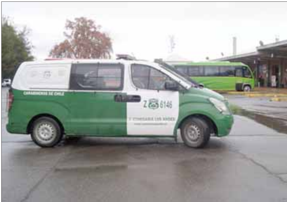
Carabineros dio cuenta del embriagado ladronzuelo a quien le incautaron lo robado.