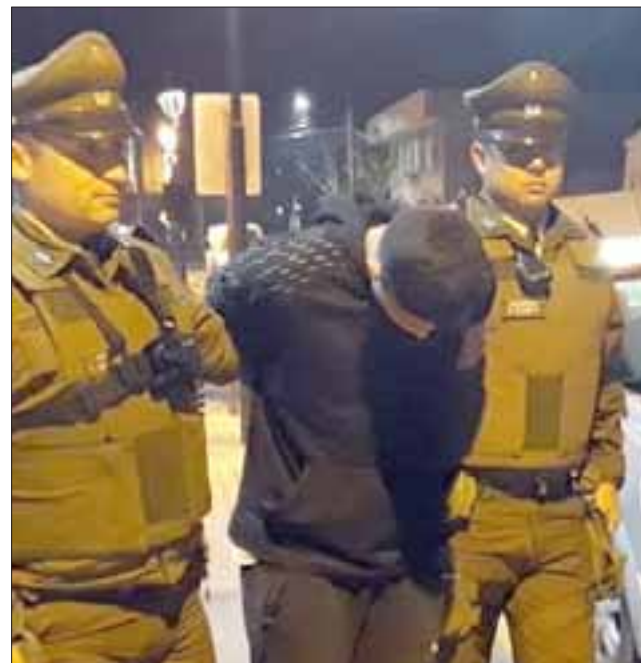
En junio de este año, el delincuente conocido como 'Patito Pate Lija' fue detenido por Carabineros, acusado de cometer el robo de especies desde una vivienda ubicada en la población Morandé de Llay Llay.

Pese a que la Fiscalía solicitó la cautelar de prisión