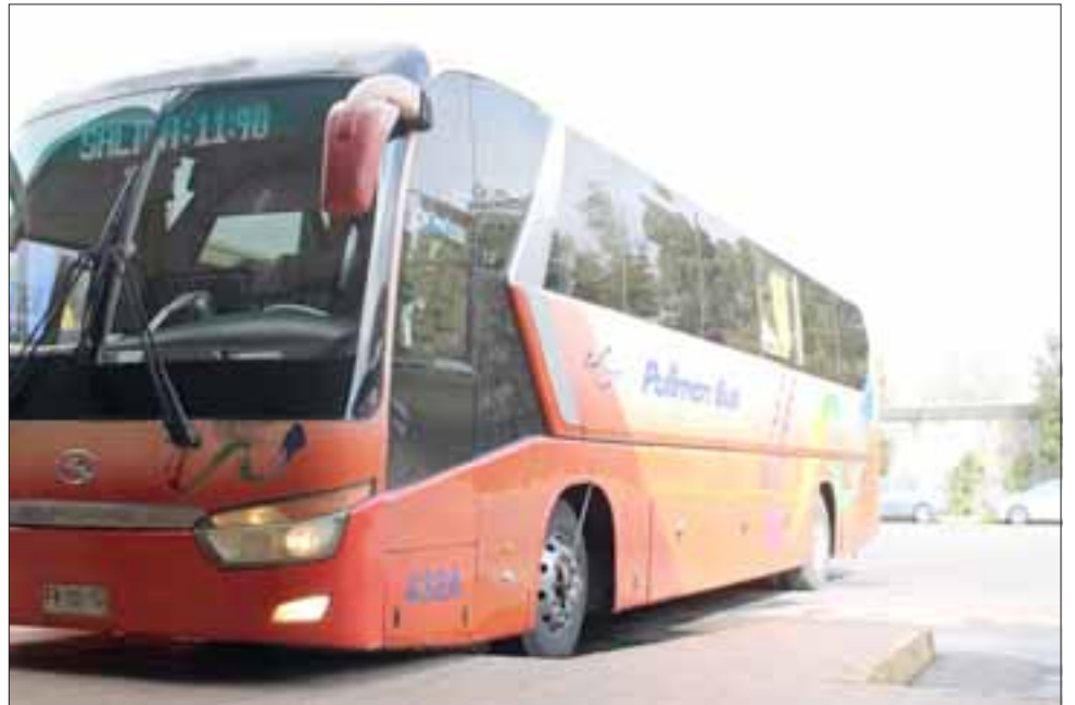
El borrachón fue descubierto por el guardia de seguridad, quien llamó a Carabineros. En uno de estos autobuses ingresó el antisocial.

Como no tenía antecedentes penales accedió a una suspensión condicional del procedimiento por el plazo de un año, debiendo para ello fijar domicilio e informar cualquier cambio de éste.