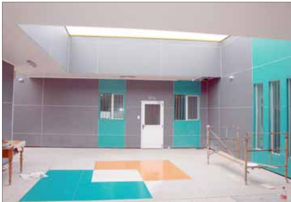
El proyecto que se está ejecutando es de muy buena calidad y demanda una inversión de más de 430 millones de pesos.

bajo con párvulos, a lo que se suman los centros que operan en La Pirca y Panquehue Centro.