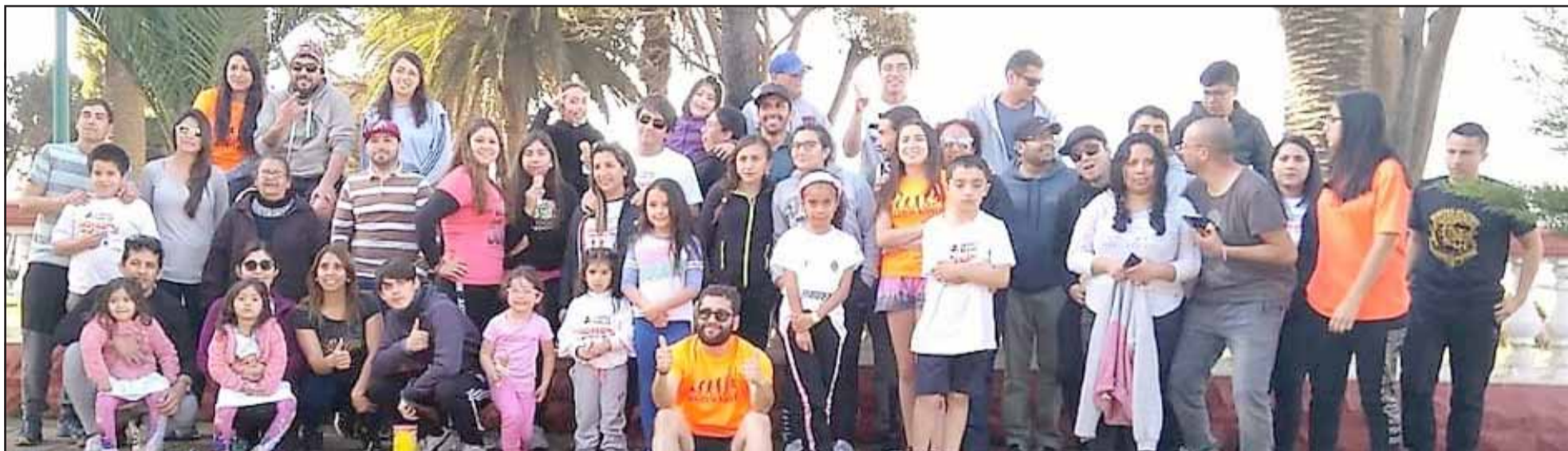
Mucho entusiasmo puso Evolution Runners en Pichilemu.