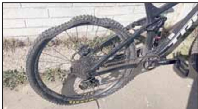
Rueda desinflada como se aprecia en la imagen.

El día del robo la habían dejado en el estacionamiento del inmueble.