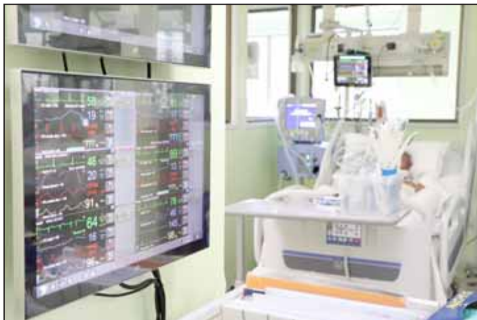
Gracias a la moderna tecnología con que cuenta, el Hospital San Camilo es el único centro de procuramiento de órganos que tiene el Valle de Aconcagua.