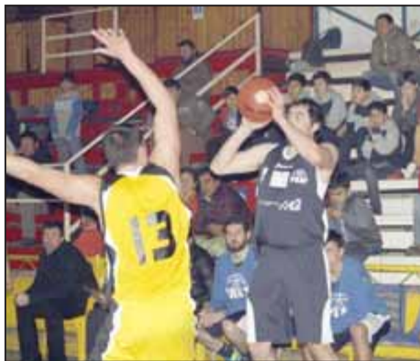
El 10 de agosto el Prat iniciará su incursión en la LNB 2019.

La LNB informó que las semifinales y finales de Play Offs de conferencia se jugarán al mejor de tres partidos, y el ganador de cada una de ellas ascenderá; mientras que el campeón general de la Segunda División saldrá de un partido único.