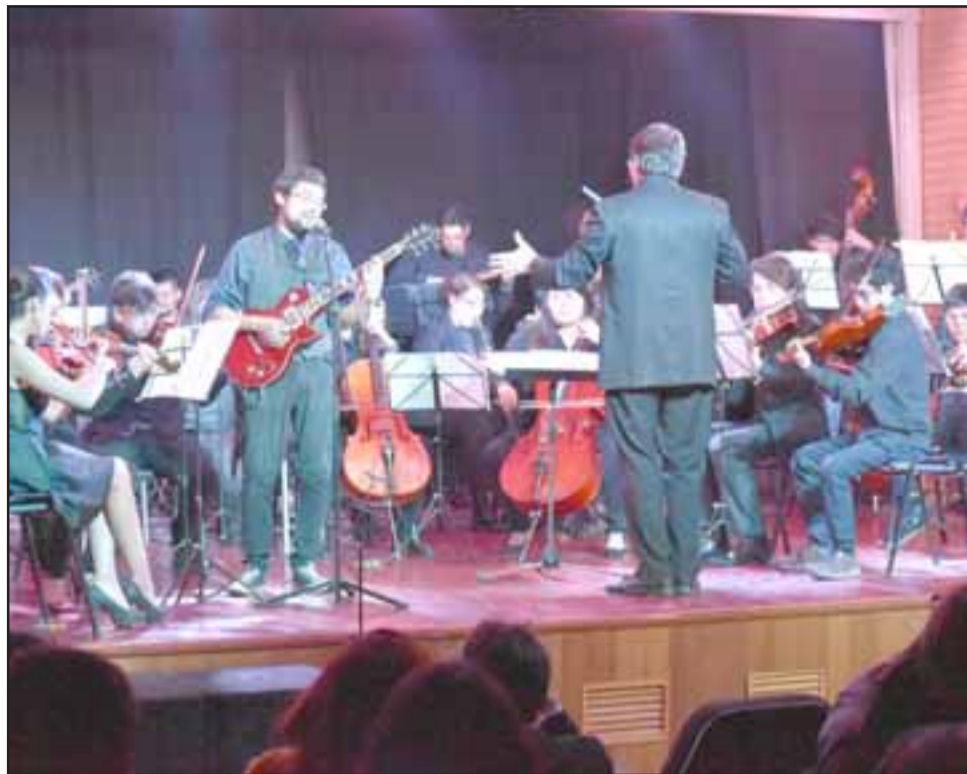
VIBRA LA MÚSICA.- Cientos de artistas locales, del valle y de otras comunas, han presentado su trabajo artístico en este reducto de la cultura.

Este sábado 27 a las 19:00 horas se abren las puertas para celebrar junto a toda la comunidad este nuevo aniversario entregando cultura y arte para todos.