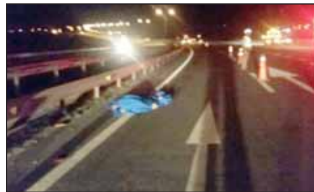
El lamentable accidente de tránsito ocurrió la tarde noche de este martes en el kilómetro 86 de la Ruta 5 Norte en Llay Llay, donde falleció un adulto mayor de 73 años de edad. (Foto Referencial).

El lamentable accidente de tránsito ocurrió la tarde de este martes en el kilómetro 86 de dicha carretera. El conductor de la camioneta, tras haber sido detenido por Carabineros, quedó en libertad a la espera de ser citado ante la Fiscalía.