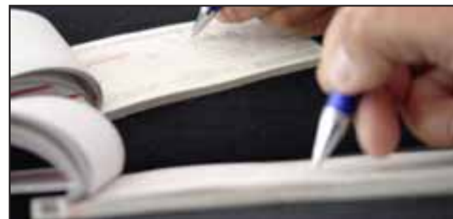
De acuerdo a la investigación de la Fiscalía de San Felipe, el documento fue periciado estableciéndose su falsedad. (Fotografía Referencial).

Fue así que el Ministerio Público imputó el cargo de Falsificación y Uso Malicioso de Instrumento Privado Mercantil, requiriendo ante el Tribunal Oral en Lo Pe-