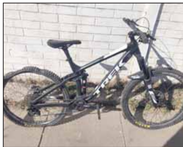
Así se encontró la bicicleta robada desde un inmueble.

Cabe recordar que la bicicleta es de propiedad del hijo de 15 años, el cual la usa para subir a los cerros. Es marca TRECK color negro.