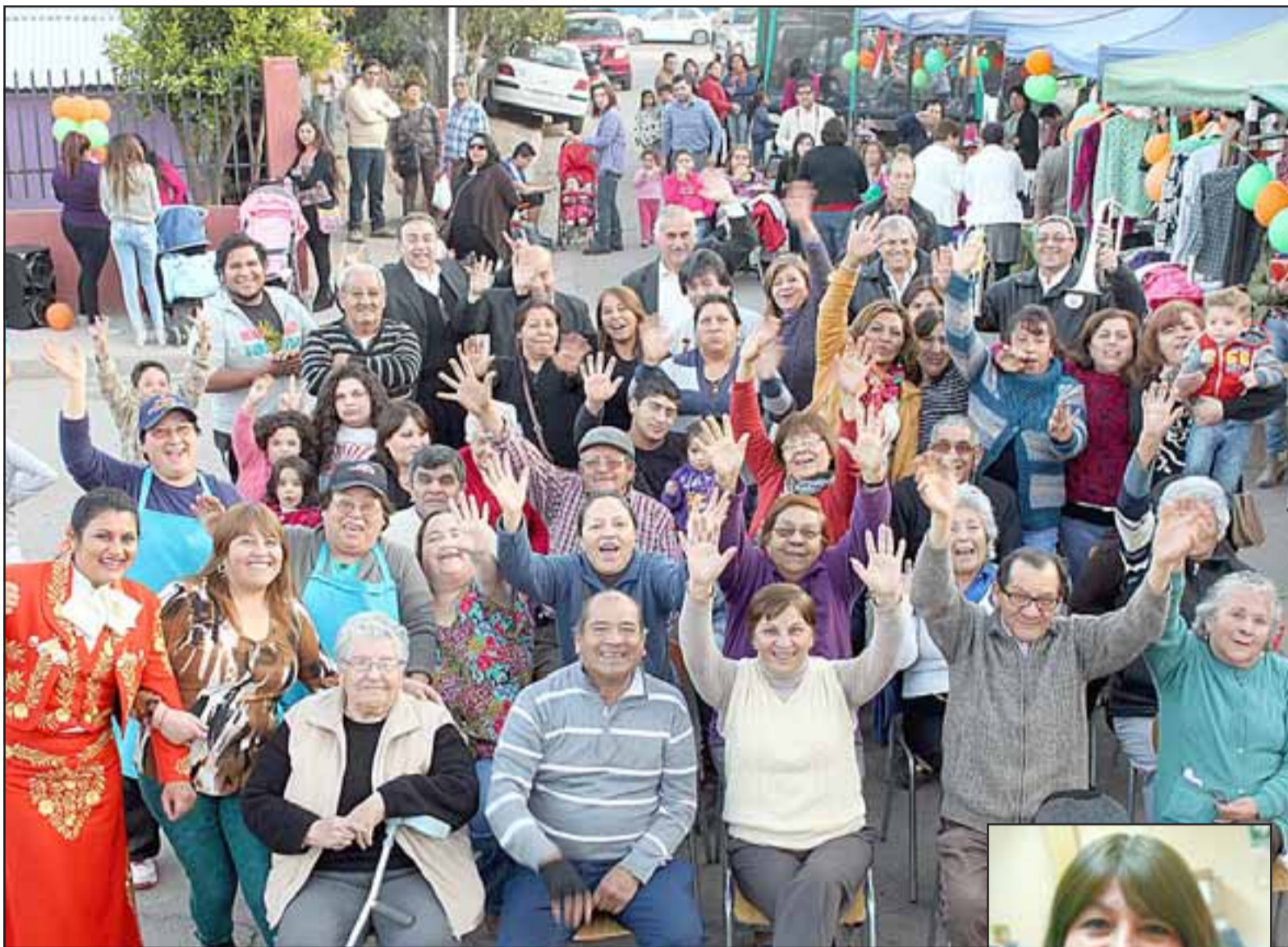
VECINOS UNIDOS. - Ellos son gran parte de los vecinos de Villa Los Naranjos, en Curimón, durante muchos años ellos han confiado en la gestión de su lideresa comunitaria.