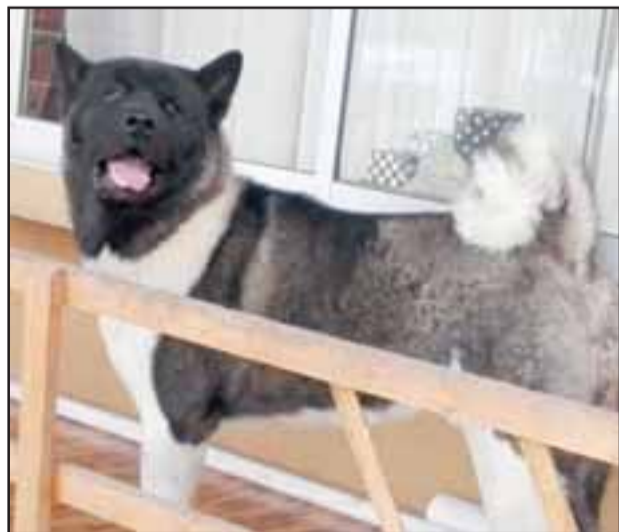
CAPITÁN SE ESCAPÓ.- Este es el tremendo Capitán, aprovechó un descuido de la familia y salió a la calle, su dueño espera que pronto regrese.