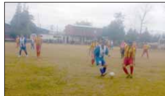
La lluvia no pudo impedir que se llevara a cabo la pasada fecha de la Liga Vecinal.

La jornada no pudo completarse debido a que la lluvia que cayó sobre la ciudad obligó a suspender la cita futbolística en la que