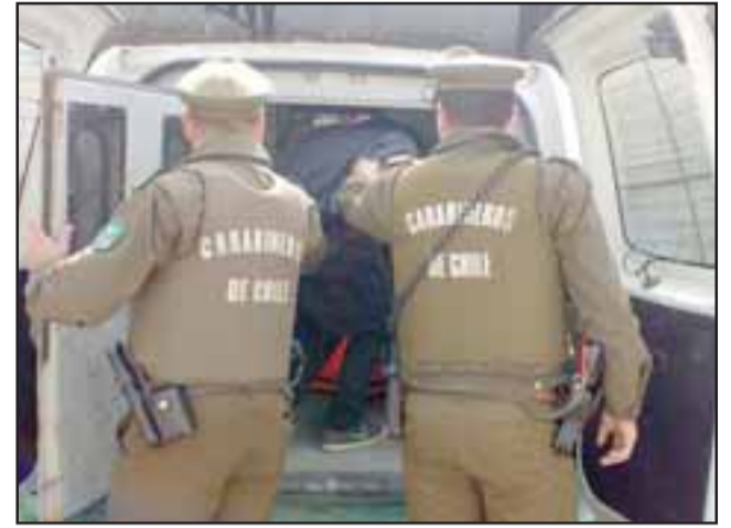
Carabineros de Catemu efectuaron el procedimiento el 20 de junio del 2018 tras la denuncia por robo en un local comercial de esa localidad. (Foto Referencial).

Andrades fue sometido a juicio por la Fiscalía en el Tribunal Oral en Lo Penal de San Felipe, siendo declarado culpable del delito de robo con fuerza en las cosas