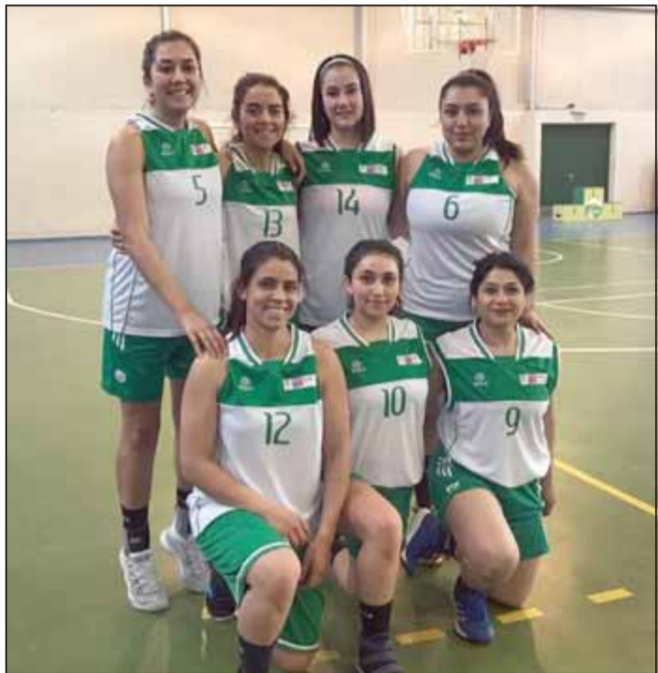
Las anfitrionas de Calle Larga están programadas para el segundo turno.

Prometiéndolo volver, 'El Tata' lanzó las siguientes palabras en su despedida: «Siento estar lejos de ellos (gente), porque los considero como parte de mi familia, siempre los llevaré en mi corazón y a cada uno de ellos le mando un gran abrazo», culminó.