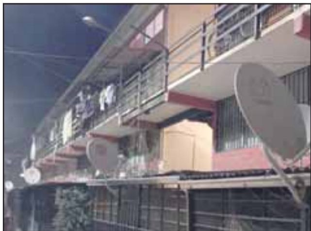
El asesinato ocurrió en los Departamentos Encón de San Felipe, el 7 de agosto del 2018.