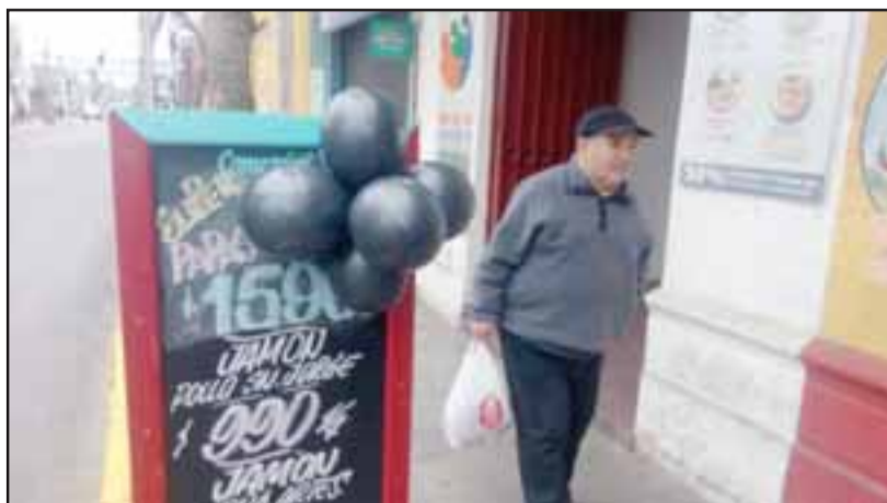
Globos negros en uno de los letreros de Comercial Los Muñoz en Traslaviña.