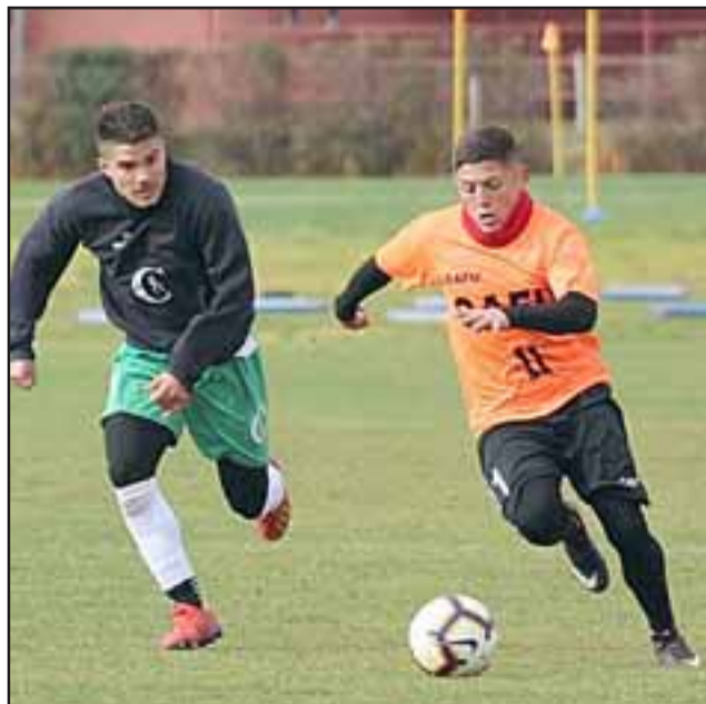
Trasandino disputó a inicio de esta semana un amistoso con el Uní Uní.