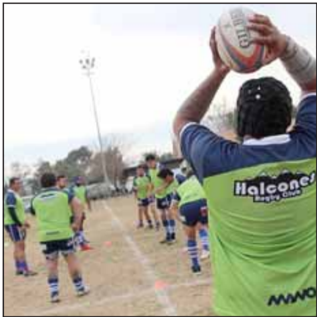
El quince aconcañino en acción en uno de los partidos del actual torneo Central A de la Arusa.