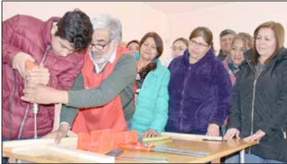
NO HAY EDAD PARA APRENDER. - Un experto en el tema les instruyó a tener confianza con las herramientas, cada uno de ellos fue creando una parte del tendedero.

material, herramientas e instructores, al final son los mismos vecinos los que construyen el proyecto con sus propias manos, en este caso los vecinos de Villa El Señorial eligieron hacer un tendedero de ropa, el que será para el uso de la sede, también la Unco hemos realizado proyectos de reciclaje y otras similares que benefician a sus propios vecinos, por lo que invito a