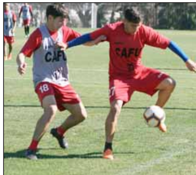
El equipo albirrojo se ha preparado convenientemente para su reestreno de mañana en el torneo de la Primera B.