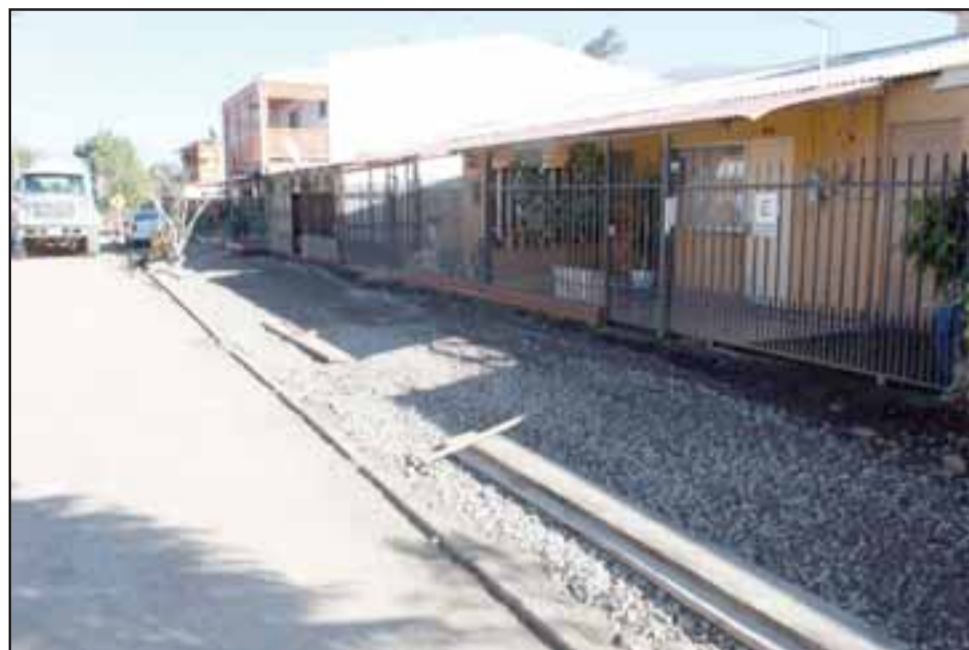
La obra considera la construcción de aceras en todos los pasajes de la Villa El Bosque, los cuales eran de tierra.