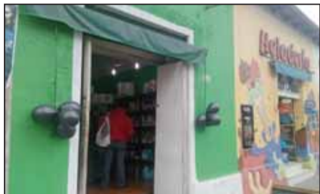
Otro de los locales comerciales que también lucían ayer con globos negros.