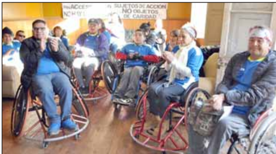
Este club lleva alrededor de tres años de funcionamiento con el respaldo del Centro Esperanza Nuestra de Los Andes.

fondos concursables para crecer a nivel regional y nacional», manifestó el dirigente, agregando que el propósito es que más deportistas se integren y practiquen las diversas disciplinas, «porque queremos seguir desarrollándonos ya que