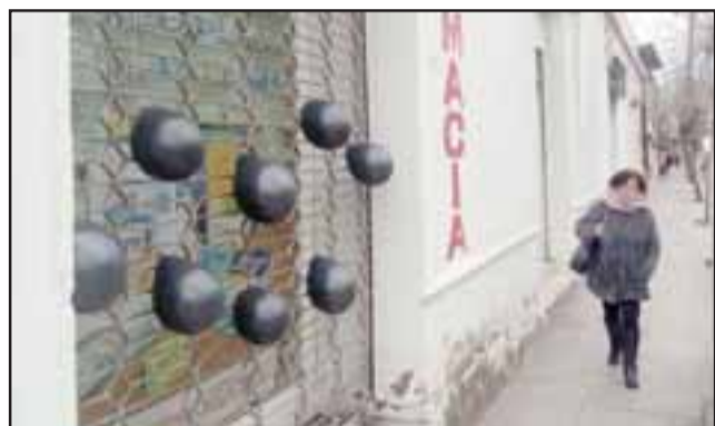
Globos negros en las afueras de una farmacia ubicada en la intersección de Merced con Traslaviña.