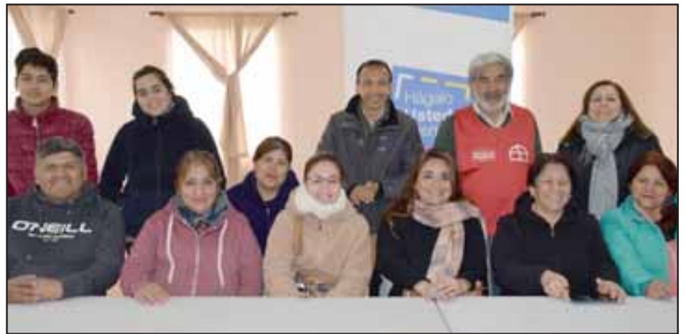
MANOS A LA OBRA. - Ellos son parte de los vecinos de Villa El Señorial que ayer aprendieron a usar herramientas y construir un tendedero de ropa.