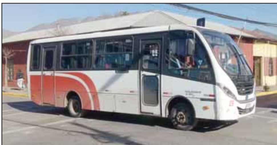
Una de las máquinas de transporte de pasajeros desplazándose por calle Portus, en sentido contrario al tránsito que tuvo probablemente desde toda su historia.

- El diseño nosotros como transportistas en forma general lo calificamos con una nota de 5,5. Ahora dentro de la participación que nosotros pudimos tener o de la forma como nosotros