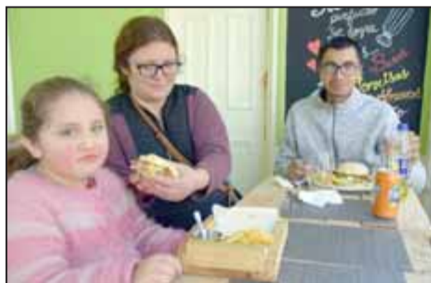
FUSIÓN DE SABOR.- Esta familia sanfelipeña permitió que las cámaras de Diario El Trabajo registraran este suculento instante en Inka Burguer.

Una singular fusión culinaria es la nueva atracción para los amantes de las comidas rápidas, se trata de Inka Burguer , única comida venezolana-peruana que combina el sabor de ambos países en un solo lugar: Salinas 348 en San Felipe . Pero no crean nuestros lectores que se trata de comidas tradicionales de cada uno de esos países, es más bien una fusión de sabores.