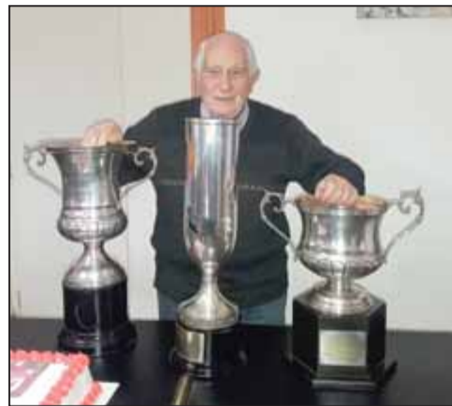
El entrenador estuvo el fin de semana pasado de visita en San Felipe.