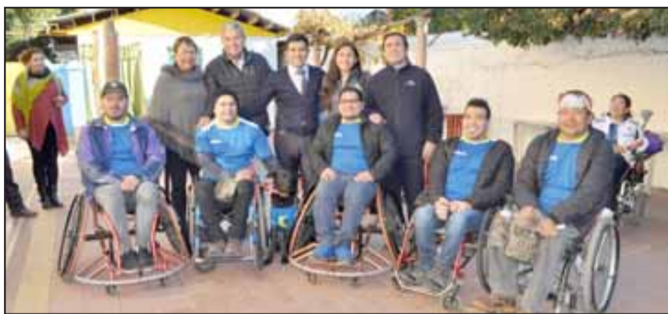
NACE UN MOVIMIENTO.- Ellos son parte del nuevo Club Deportivo Milord, de Los Andes, recientemente fundado.

«El objetivo principal del Centro Esperanza Nuestra era que Milord Deportes Adaptado quedara bajo el alero del Ministerio del Deporte y, de esta forma, poder postular a los