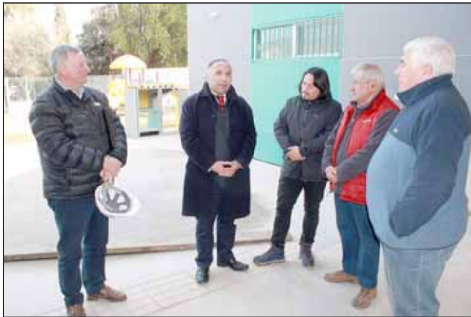
‘Sueño Dorado’ implica una construcción que abarca 334,86 metros cuadrados, y cuya inversión supera los 450 millones de pesos, con capacidad para 24 niños y niñas, siendo este el primer establecimiento Junji que tendrá la comuna.