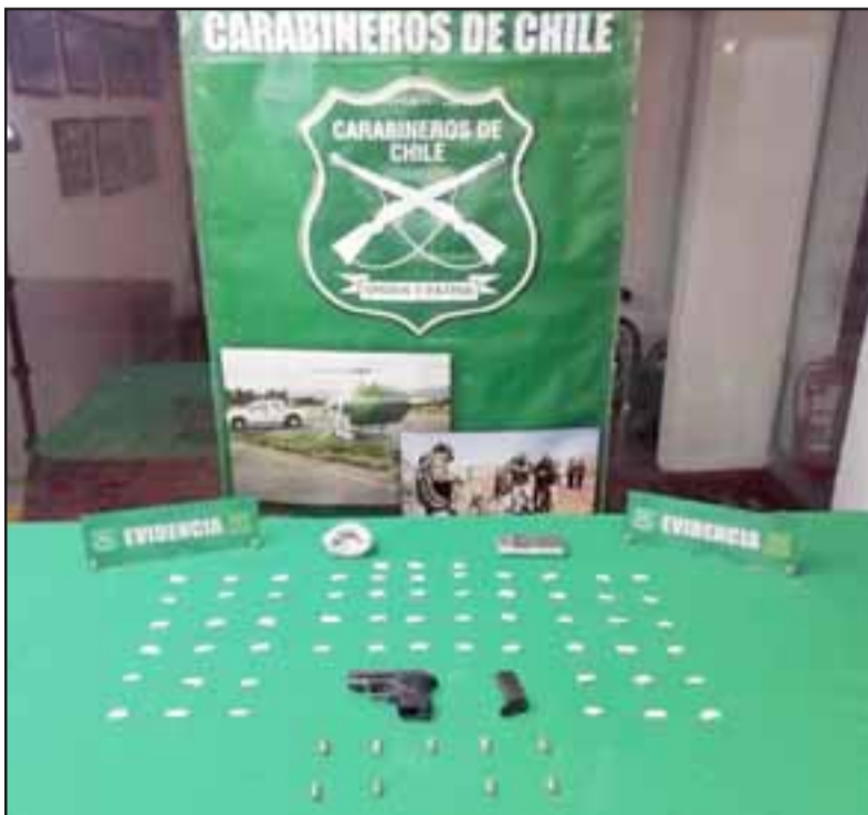
Funcionarios de Carabineros de la sección OS7 Aconcagua decomisaron pasta base de cocaína, un arma de fuego y municiones desde un departamento ubicado en la Villa El Totoral de San Felipe, siendo detenidos tres sujetos que fueron formalizados en Tribunales.

En el inmueble fueron detenidos tres sujetos identificados con las iniciales