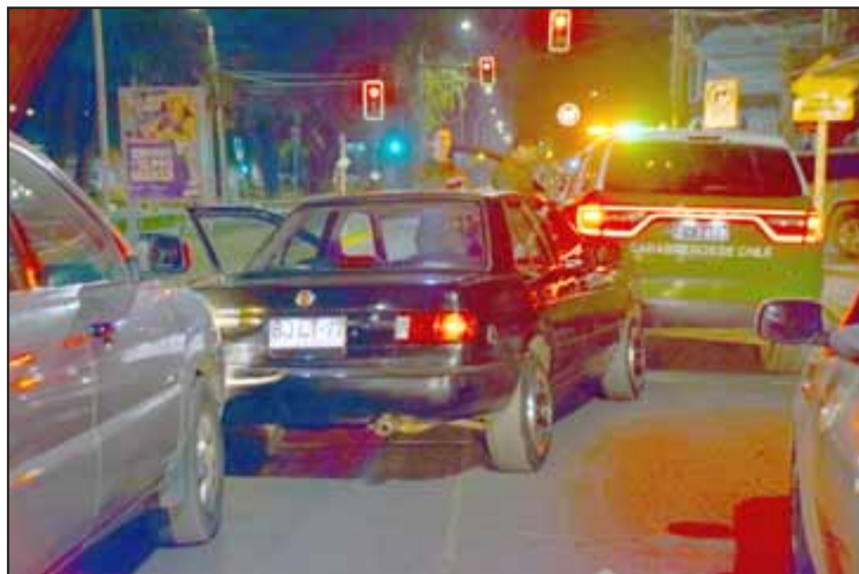
El accidente ocurrió la tarde noche de este lunes en Avenida Yungay de San Felipe.