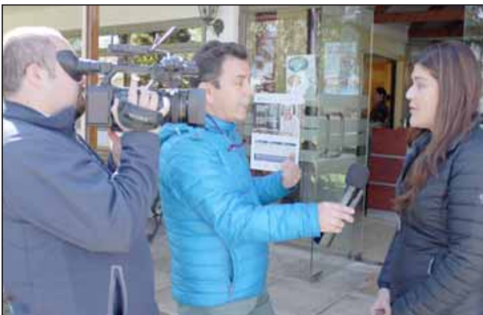
REPORTERO DEL AÑO. - Aquí lo tenemos reportando en una de las tantas mañanas a distintos vecinos del Valle de Aconcagua.