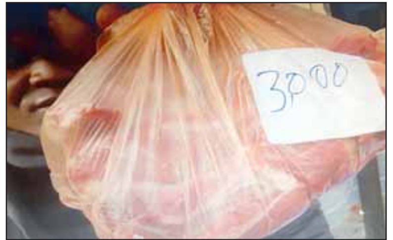
Acá vemos una bolsa con carne por un valor de tres mil pesos.