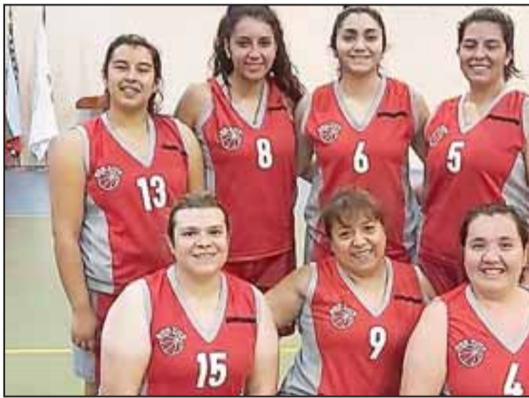
Frutexport fue la sorpresa de la jornada al imponerse al hasta entonces líder invicto del torneo.

Durante la cita cestertera hubo espacio para un partido amistoso entre los quintetos masculinos de Amigos de Orange y Los Andes Basket, el que arrojó un 62 a 36 a favor los primeros.