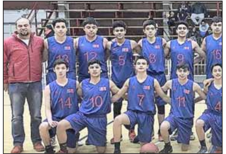
Las selecciones U15 de San Felipe quedaron fuera de los Nacionales de su serie.