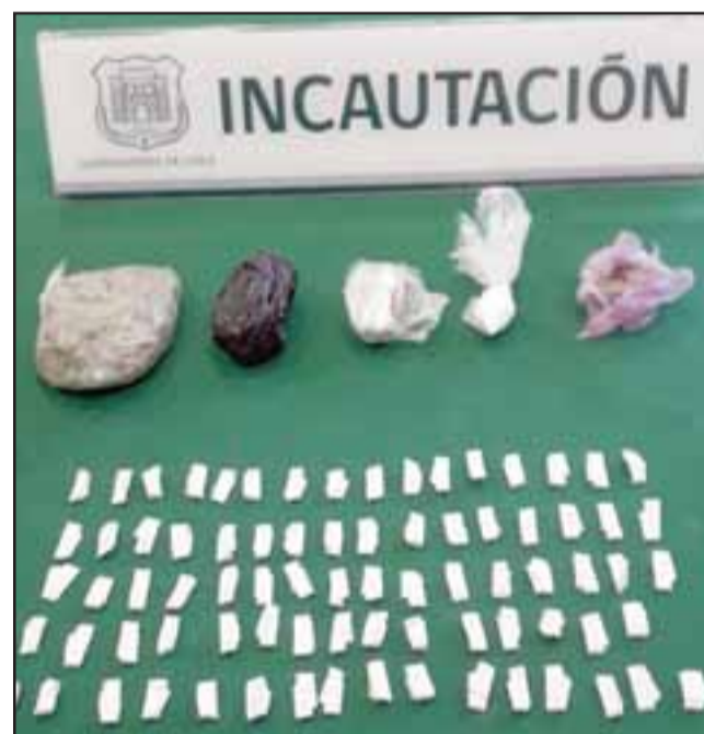
En el entretecho del baño de la antigua cocina se encontró la bolsa con 79 envoltorios contenedores de pasta base, tres bolsas con marihuana y otra con clorhidrato de cocaína.

Posteriormente, personal de Carabineros llegó hasta el CCP para realizar las pruebas de campo, las que resultaron positivas.