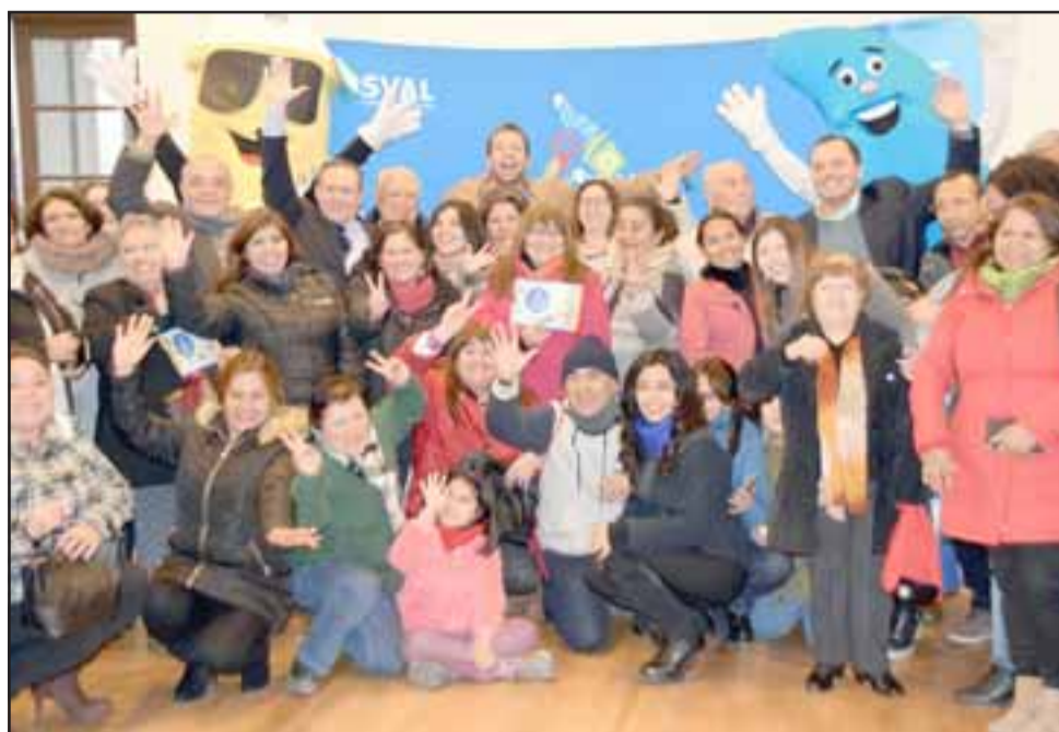
Líderes comunitarios de San Felipe y Los Andes en el lanzamiento del 'Fondo Concursable Regional Contigo en Cada Gota' que se realizó a fines de junio. El plazo para postular vence este viernes 2 de agosto.

A este fondo pueden postular organizaciones sin fines de lucro y con personalidad jurídica vigente, además de comunidades educativas, con un máximo de $2 millones de asignación para cada iniciativa. Los interesados podrán descargar las bases y toda la información en www.esval.cl , donde encontrarán el detalle de los requisitos, criterios de evaluación y características de los