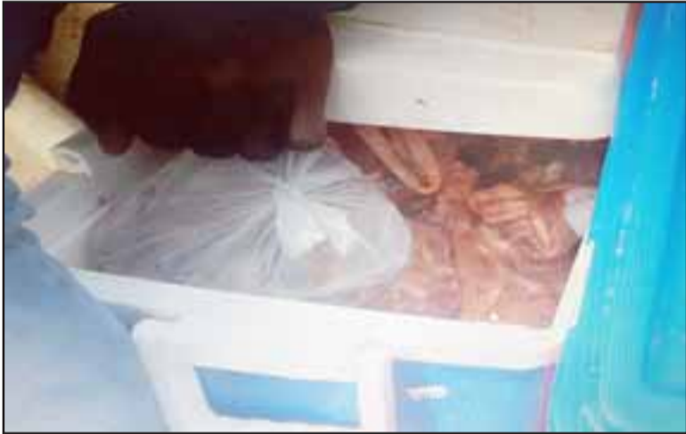
La carne dentro un 'cooler', lista para vender aunque no en las condiciones óptimas.