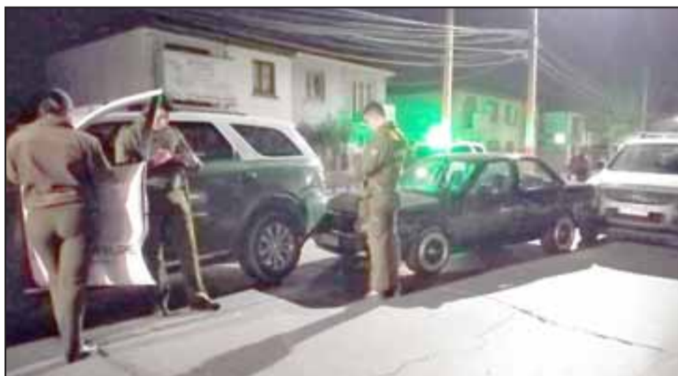
Solo daños a las carrocerías de los móviles se originaron tras la triple colisión.