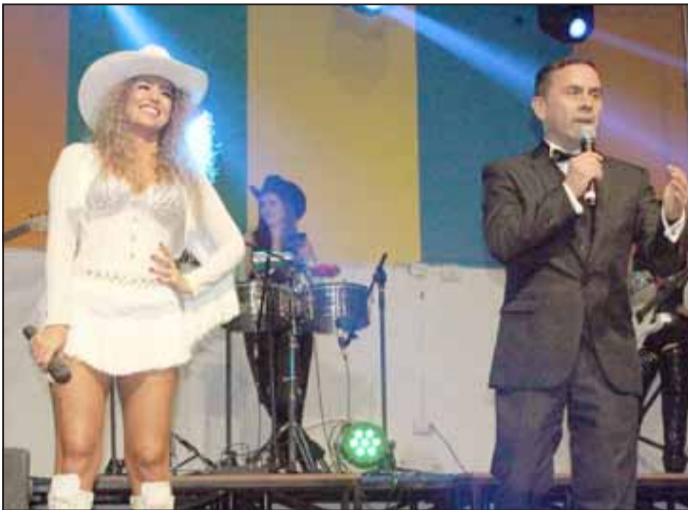
GRANDE PEPE. - Aquí tenemos al presentador y animador profesional anunciando a sus artistas invitadas.