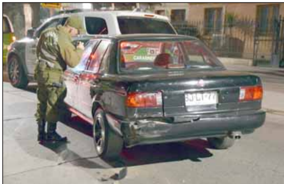
Personal de la Siat de Carabineros en la investigación del caso.