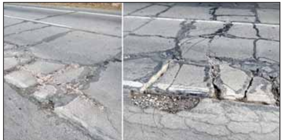
El tramo entre San Felipe y Lo Campo es el más afectado, pues luce enormes baches que causan serio riesgo de accidente.

hacen mantención adecuada. Van a ocurrir accidentes frontales por la necesidad de esquivar los baches. Juan José Vargas