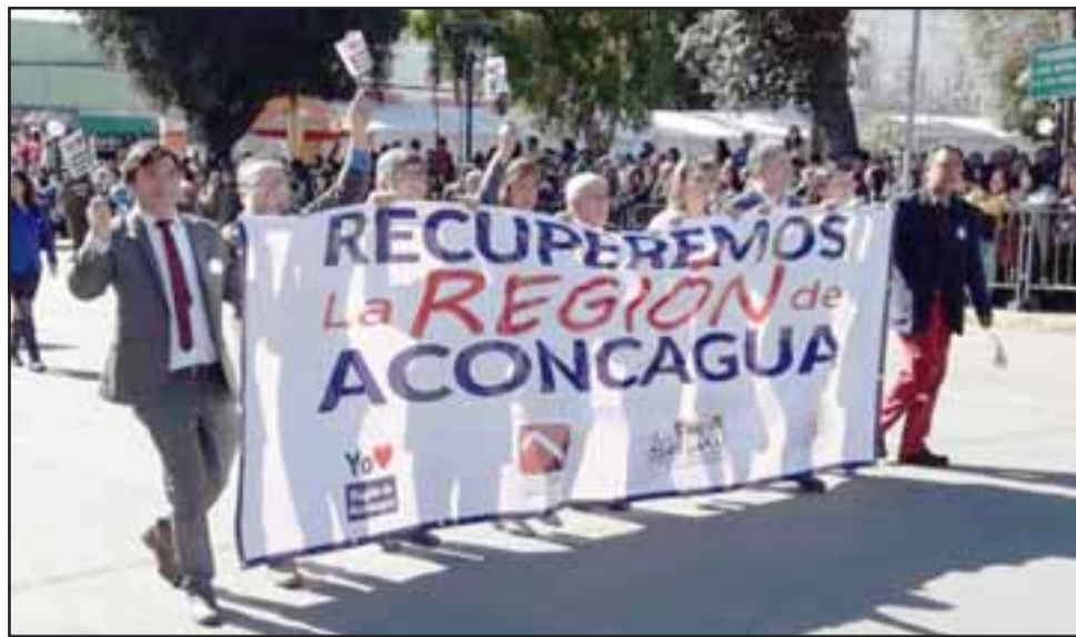
Ciudadanos proclives a la Región de Aconcagua desfilaron portando un lienzo este sábado en la Plaza de Armas.