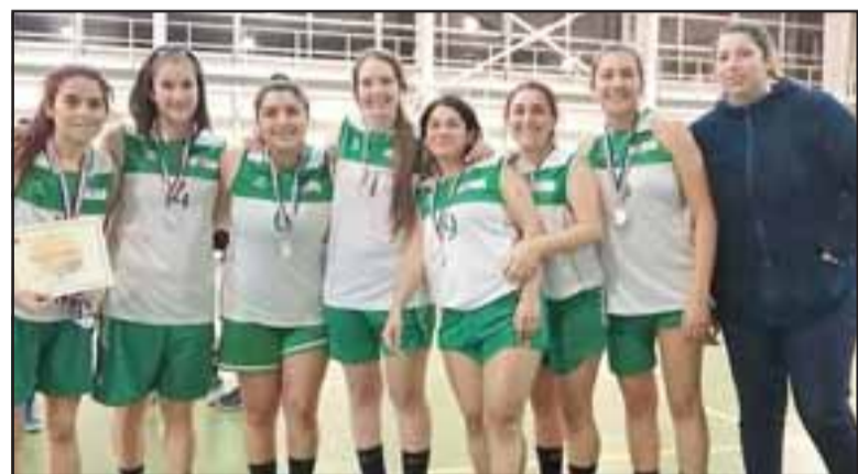
Las Lobas de Calle Larga igual quedaron felices con su segundo lugar.

Durante la jornada del domingo también se definió el tercer lugar, y Frutexport se quedó con esa ubicación en el podio al vencer 58 a 32 a Martinas. La mejor mano de ese pleito fue la jugadora de las exportadoras, Va-