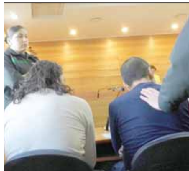
El mayor accedió a una suspensión condicional del procedimiento por no tener antecedentes, mientras que el otro quedó con Prohibición de acercamiento a su tío.

Sin embargo, uno de los sobrinos le propinó un fuerte empujón a la víctima, quien cayó al piso golpeándose la nariz, comenzando a sangrar profusamente. Tras ello, ambos primos se