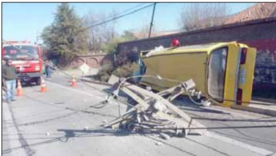
El accidente ocurrió cerca del mediodía de ayer lunes en la ruta Troncal 601 (Ex 60 CH) en Panquehue.

Asimismo durante la emergencia el tránsito vehicular se mantuvo suspendido debido a que la estructura del poste cayó en medio de la calzada, restablecién-