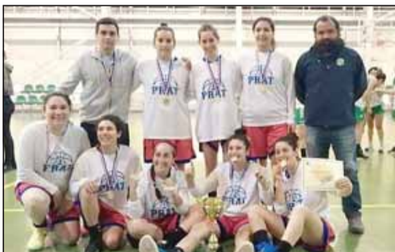
Atlas fue el mejor de todos en el primer torneo de la liga de baloncesto del valle de Aconcagua.

port, y Priscila Pizarro , del Atlas fue la goleadora del campeonato, que fue posible gracias a la gestión de un grupo de árbitros y el apoyo de la Municipalidad de Calle Larga, al facilitar su Polideportivo.