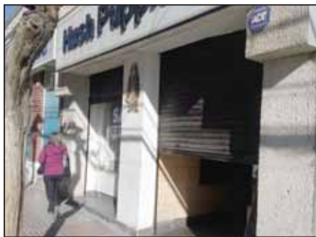
Cortina a medio abrir de la tienda de zapatos Hush Puppies ubicada en calle Salinas, a pasos de la plaza de armas.

Según lo que pudimos averiguar, el o los delincuentes hicieron un forado por el techo de la tienda, ingresando y procediendo a robar esa cantidad aproximada de zapatillas, de alto valor comercial.