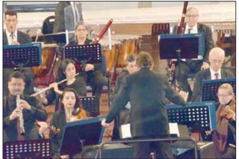
EXCELENCIA. - Esta es la primera vez que la Orquesta de Cámara de Chile se presenta en el Valle de Aconcagua.