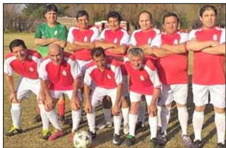
El representativo del Escorial ganó el torneo sub-50 en Panquehue.