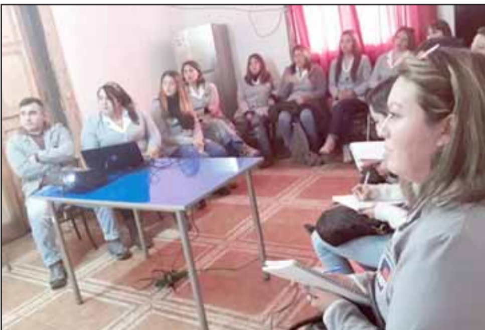
En la oportunidad los alumnos recibieron una charla y una posterior visita guiada por todas las dependencias de la unidad.