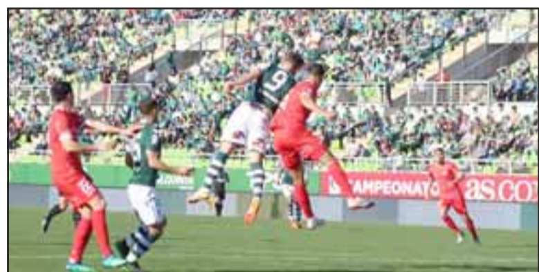
La escuadra albirroja llegará al duelo contra Rangers, precedido de un gran triunfo sobre Santiago Wanderers.

*Jugaban al cierre de la presente edición de El Trabajo Deportivo .