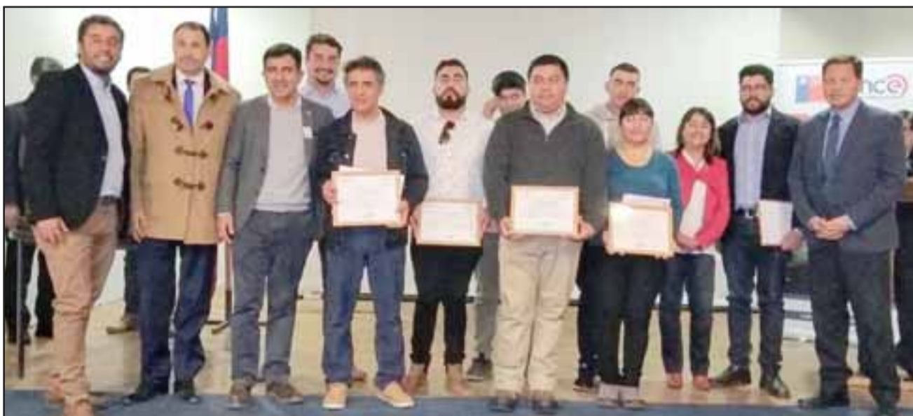
Acá vemos a las autoridades y alumnos certificados.

porque en el tema público no es fácil asignar recursos (...) Esta cuestión no terminó bien... Pescamos platas de otro lado. Es muy difícil, o sea en la parte pública hay que justificar, solicitar y hay que tratar de alguna manera de solucionar los problemas, como estaba planteado inicialmente, cosas así; siempre hay un análisis, una investigación, pero gracias a Dios todo eso salió adelante por la voluntad de la misma Universidad, se puso siempre a disposición, solamente nos alargamos en los tiempos, así es que hoy recibieron su certificación por haber cursado sus cursos y además recibieron sus licencias habilitantes de SEC y el certificado de competencias que fue otorgado y gestionado a través de la Universidad