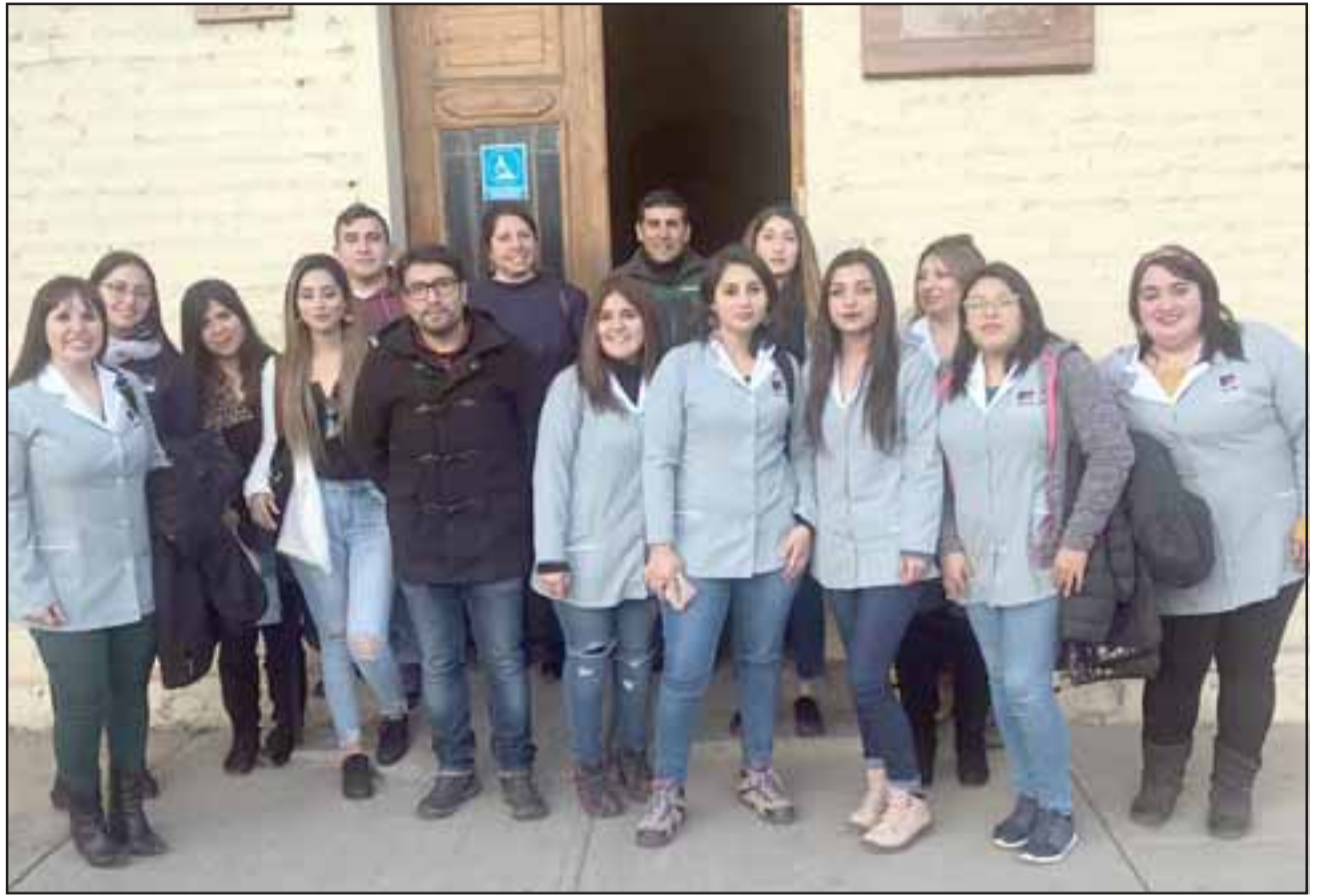
Alumnos de Desarrollo Social del instituto profesional visitaron el CET de Putaendo para conocer el trabajo que se desarrolla ahí en materia de reinserción social.