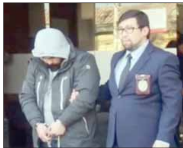
Los sujetos capturados registran domicilio en la comuna de Colina en Santiago.

Los detenidos tras ser formalizados en Tribunales quedaron en Prisión Preventiva.