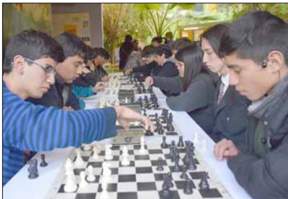
SILENCIO ABSOLUTO. - Nada pudo desconcentrar a estos ajedrecistas durante las partidas que disputaron en este torneo.