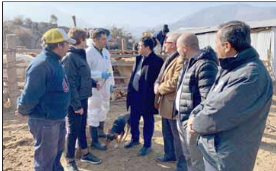
Las autoridades del Valle de Aconcagua y en especial de Putaendo, reaccionaron satisfechos con la declaratoria de Emergencia de la V Región.

«Este jueves iniciamos nuestro Plan de Sanidad Animal, que incluyó desparasitación, vacunación y vitaminas a más de 250 vacunos y 800 caprinos de los sectores de La Orilla y Las Minillas respectivamente. Asimismo, este día nos llegaron los primeros estanques con capacidad para 10.000 litros de agua, que instalaremos en doce puntos de la comuna para el consumo de los animales. Estamos frente a una dramática situación, por eso las medidas deben ser in-