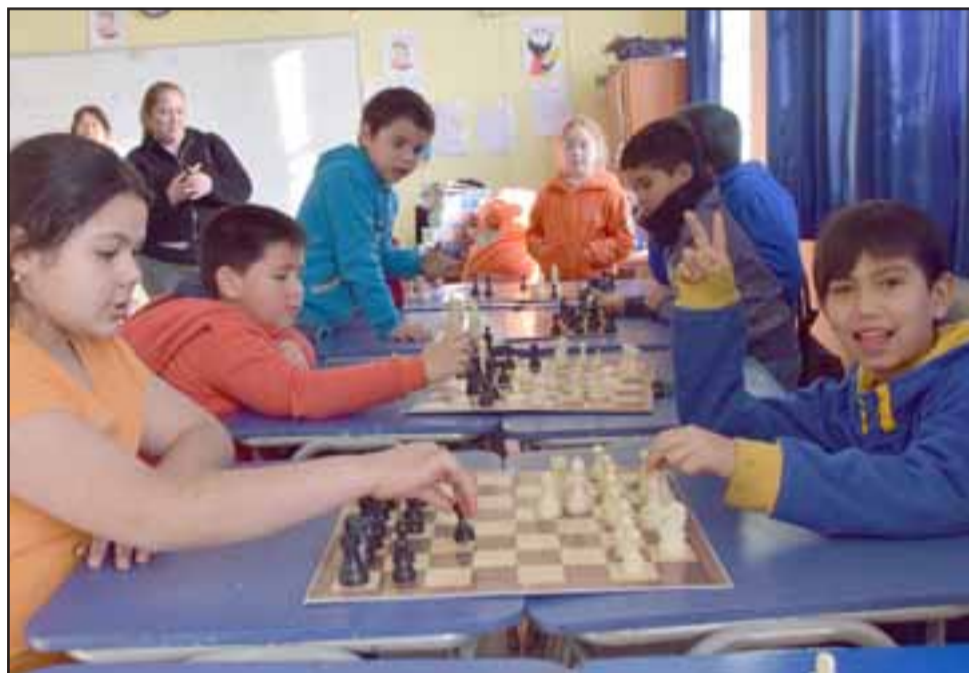
ELLAS TAMBIÉN. - Las niñas también dieron mucha pelea en este campeonato, en ajedrez la edad no importa, sólo ganan los que aprovechan mejor los errores del contrincante.