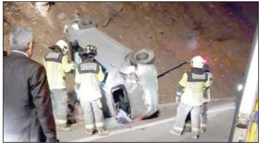
Este accidente se produjo cerca de la 1:30 de la madrugada en la autopista Los Libertadores a la altura del Casino Enjoy.

En primera instancia fue trasladado hasta el Servicio de Urgencia del Hospital San Juan de Dios, en donde se le diagnosticaron lesiones leves y se le realizó el respectivo examen de alcoholemia. Informado el Fiscal de Turno dispuso que quedara en libertad a la espera de ser citado a declarar.