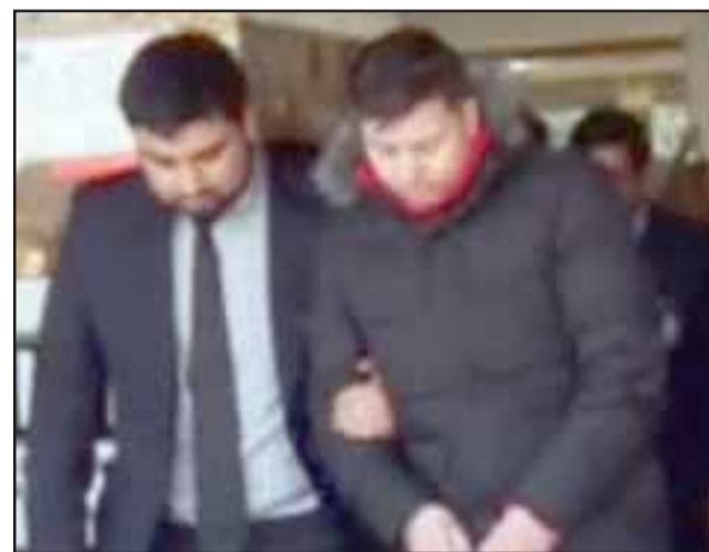
Los imputados conformarían parte de una banda dedicada a asaltar a clientes bancarios en San Felipe y Los Andes.