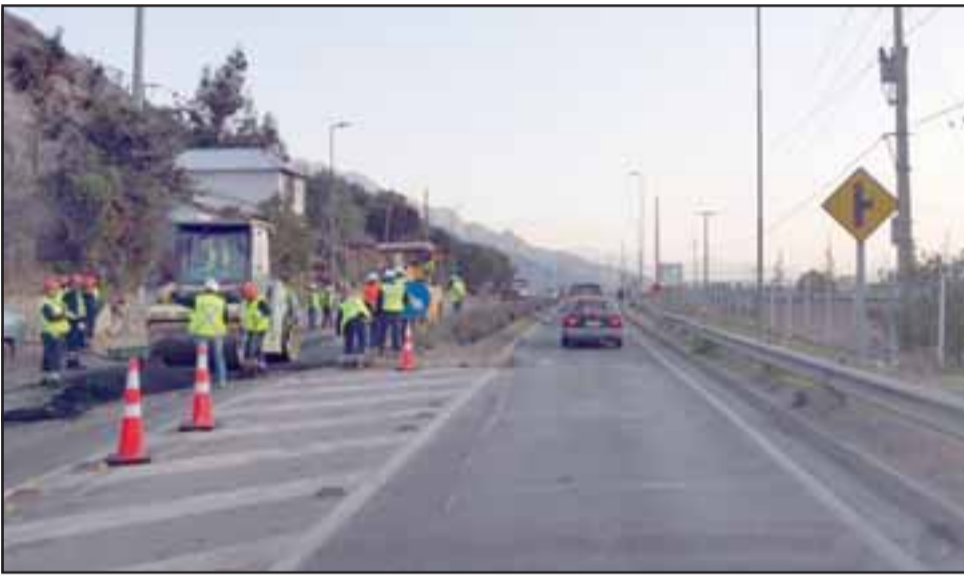
Acá las personas trabajando en el sector de Punta El Olivo.

- Bueno en la mañana no es el problema, el problema es cómo a las nueve a esa hora cortan el tráfico y ahí estamos, en el día hacen un panel de unos diez metros y es muy poca gente, ahí debieran haber buscado una empresa más grande que hubiera traído camiones para haberlo hecho en menos tiempo, porque es mucho el tiempo que van a estar.