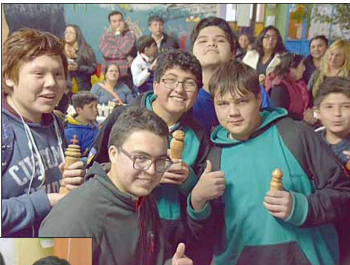
MUY ANIMADOS. - Los jóvenes ajedrecistas se mostraron muy contentos al saber que saldrían publicados en Diario El Trabajo.