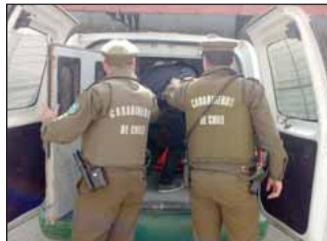
El imputado fue detenido en el mes de julio del año 2017 por Carabineros de la comuna de Llay Llay. (Foto Referencial).

En medio de un juicio oral, los Magistrados del Tribunal Oral en Lo Penal de San Felipe resolvieron concebir dudas razonables respecto a la efectividad de