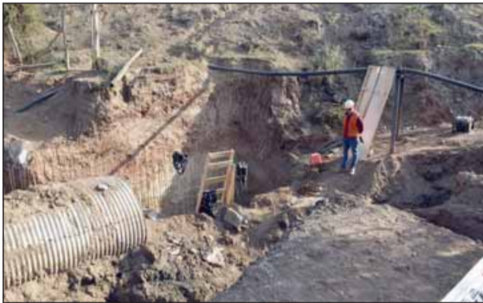
Aquí vemos uno de los puentes que se están construyendo en la Ruta E-426, y Cruce E-420 en el Porvenir Alto.

al reemplazo de los atravesos de tubos circulares metálicos, por puentes tipo losa con calzada vehicular de 6 metros de ancho y un pasillo peatonal de 1,5 metros.