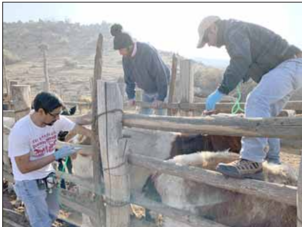
El Municipio ha estado trabajando desde hace varias semanas con los crianceros y agricultores de la comuna.

«Esta declaratoria de emergencia agrícola es un gran avance, no obstante, hay que prepararse para un escenario peor. Creemos que en las próximas semanas deberá, necesariamente, sumarse la Declaración de Catástrofe por parte del Ministerio del Interior, porque, en la práctica, la mayoría de los sectores económicos se verán afectados. Así como en años anteriores, es el Estado de Chile en su conjunto, el que debe responder ante un fenómeno catastrófico como el que estamos viviendo», manifestó el alcalde Guillermo Reyes.