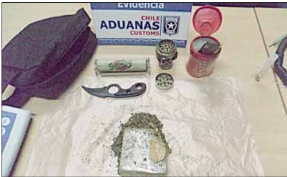
Los funcionarios aduaneros hallaron bajo el asiento del conductor un paquete rectangular contenedor de 184 gramos de marihuana prensada.

LOS ANDES.- Un ciudadano brasileño que ingresaba al país junto a su familia, fue detenido en el Complejo Los Libertadores al ser sorprendido tratando de internar un ladrillo de marihuana prensada.