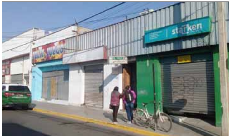
Acá apreciamos la presencia de Carabineros afuera del sitio del suceso.

Cuenta que para mayor seguridad habían colocado un candado más dos chapas «pero reventaron, cortaron el candado reventaron la chapa, entraron e hicieron el forado evitando las alarmas y se metieron a TurBus, -oficina de encomiendas- por suerte no se metieron más allá, la otra vez dejaron la escoba para adentro, ahora no, solamente se metieron acá al lado, mala suerte para ellos y no sé que más daños le habrán hecho a ellos, a nosotros nos hicieron el forado dejando en el lugar un fierro como chuso para poder hacer el hoyo, es lo que