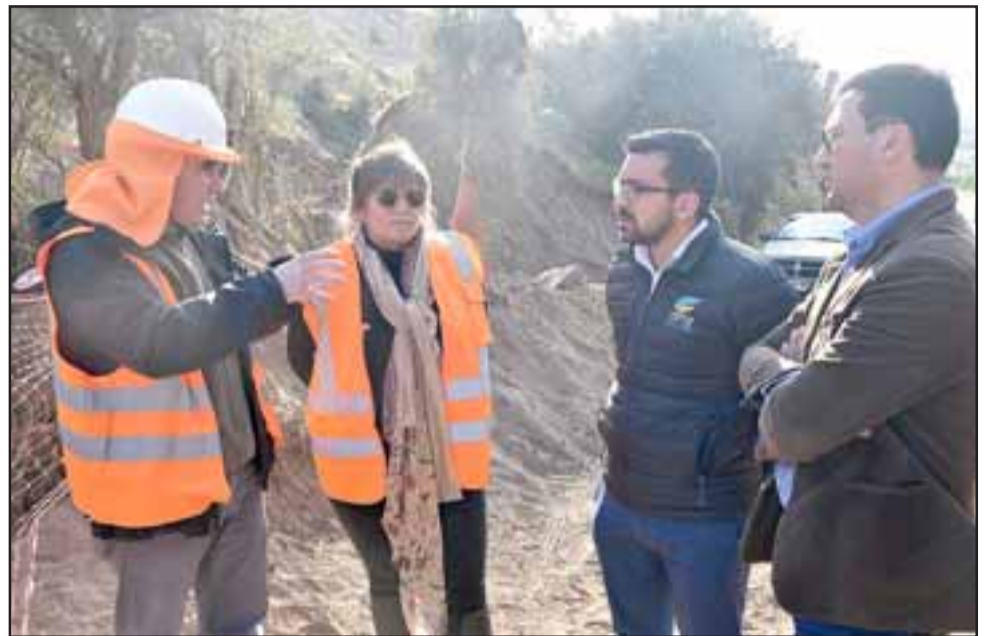
Funcionarios de Vialidad se hicieron presentes en la inspección junto a los equipos municipales de Llay Llay.

A esto se suma los puentes que se están construyendo en la Ruta E-426, y Cruce E-420 en el Porvenir Alto. Estas obras se encuentran comenzando con su ejecución y en ella se invertirán más de 200 millones de pesos. Se esperan que estén terminadas antes de fin de año. Específicamente, las obras se refieren