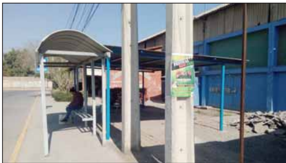
Acá vemos el techo, una parte del nuevo paradero rural.

Sigue denunciando el administrador la presencia de mucho ladrón, teniendo en cuenta que están al lado del Tribunal de Garantía de San Felipe, lugar donde pasan a control de detención muchos imputados por diferentes delitos, algo que ya