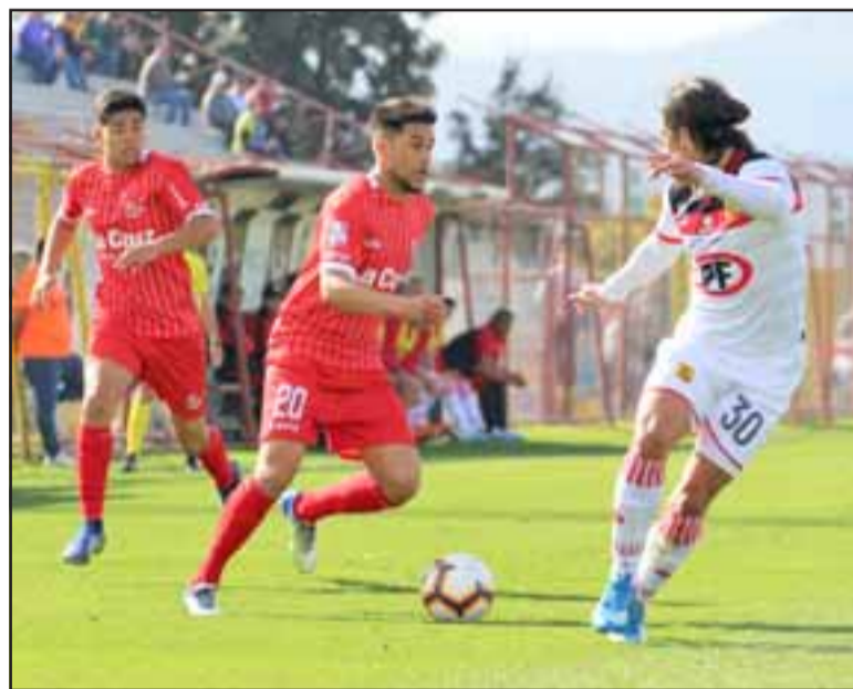
Una actuación maciza que ilusiona para el futuro fue la que cumplió el Uní Uní frente a Rangers.