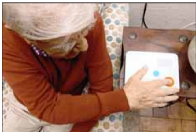
Ahora varios adultos mayores de San Felipe y Santa María podrán contar con este dispositivo para estar más seguros.