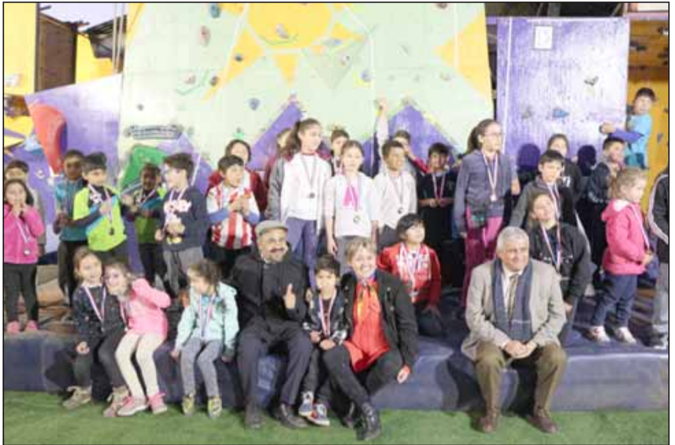
Más de cien vecinos y vecinas participan de estos talleres de escalada deportiva durante la semana, lo que llevó al municipio a mejorar las instalaciones ubicadas en el Consejo Local de Deportes.

Es así como más de cien vecinos y vecinas participan de estos talleres durante la semana, razón por la que era necesario mejorar este muro y lograr que más vecinos practiquen este deporte. Con este financiamiento se espera fortalecer la práctica de la escalada deportiva en la comuna.