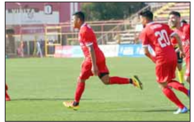
Los albirrojos llegan al partido contra la academia de excelente forma después de apabullar a Rangers.

*Jugaban al cierre de la presente edición