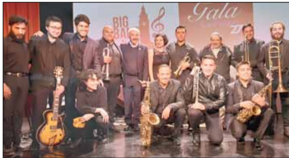
La presentación de esta agrupación musical se realizó el pasado jueves en el Teatro Municipal de San Felipe.