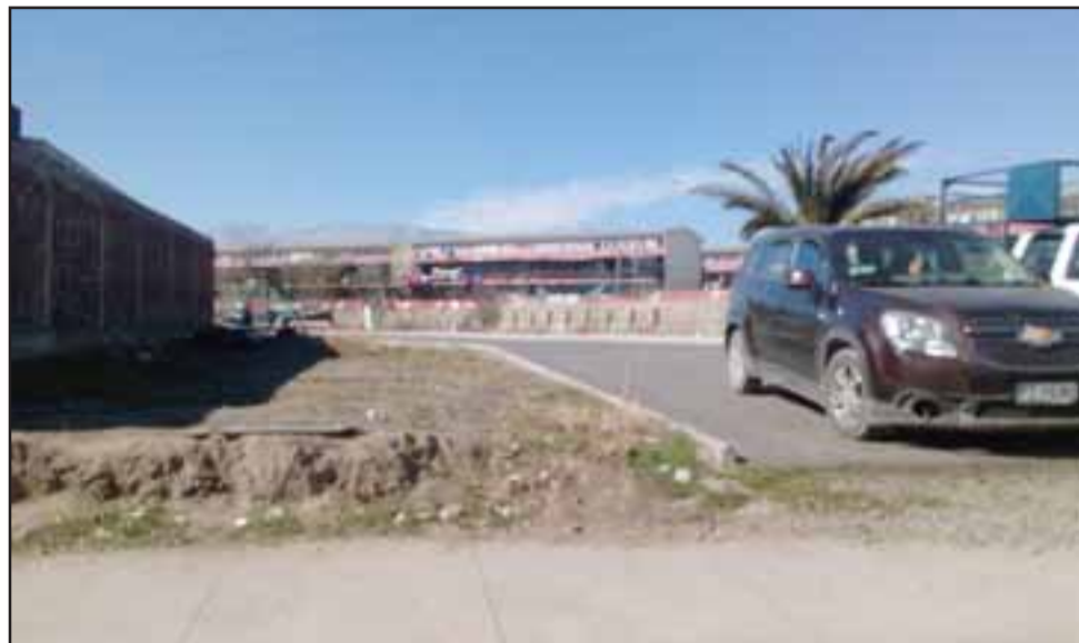
En este lugar iba a quedar situada la nueva planta, la cual debido a los graves problemas de congestión que provocaría en una arteria bastante saturada como Encón, debió desistir de instalar aquí.

- Totalmente resuelto, somos nosotros los que estamos 'aprobados', en