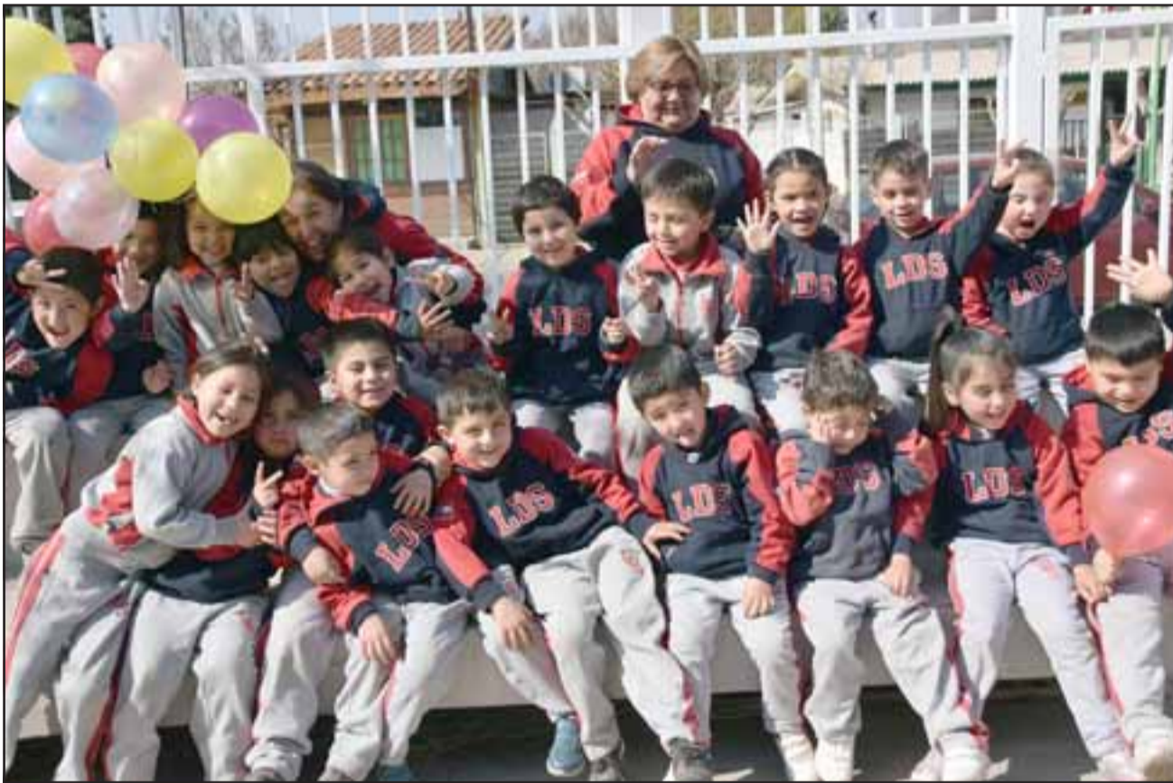
TUVIERON SU FIESTA.- Aquí tenemos a los más chicos del Liceo Darío Salas, también acompañados por sus parvularias.

DÍA DEL NIÑO.- Ellos son los pequeñitos de prebásica del Santa María College, todos disfrutaron de la fiesta del Día del Niño en la Biblioteca Municipal de Santa María.