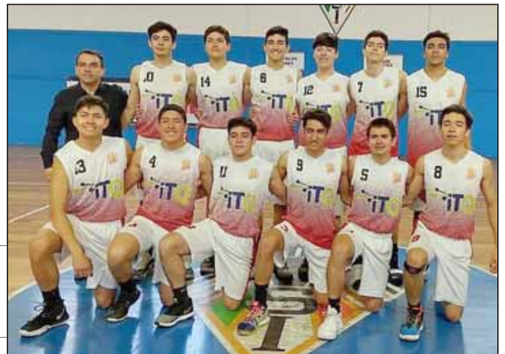
San Felipe Basket se quedó con el título de la serie U17 en la Conferencia Oeste de la Libcentro.