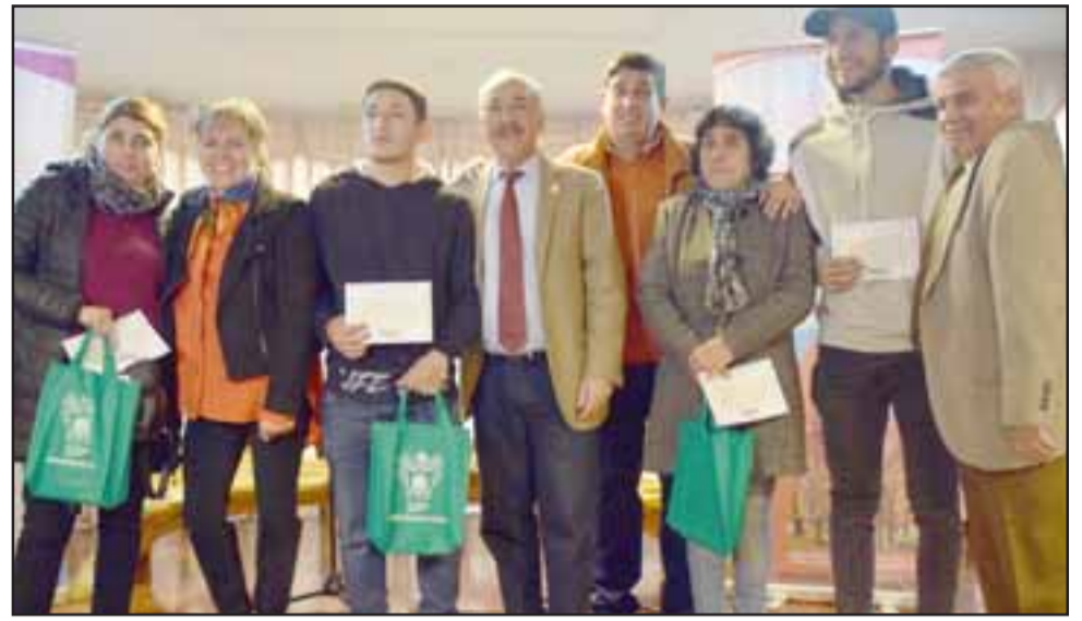
BECA APORTE MUNICIPAL. - Fueron 50 familias las beneficiadas con esta beca municipal, lo que les significa $50.000 mensuales por cada estudiante.

educación superior durante todos estos años, por lo que estamos muy orgullosos porque ya hemos logrado un centenar de profesionales que han logrado obtener su título bajo esta modalidad de becas, que es un aporte realmente importante para las familias sanfelipeñas, destacar que el Concejo Municipal aprobó por unanimidad estos recursos, los que son importantes para estos jóvenes estudiantes universitarios, el aporte se les entrega semestralmente dependiendo de las circunstancias que cada uno de ellos están desarrollando, ya sean exámenes de título que necesitan bastante dinero o también para movilizarse o hasta pagar arriendo incluso, en total son 50 los beneficiados, 22 de ellos renovantes y 28 nuevos becarios con un monto total de 30 millones de pesos», co-