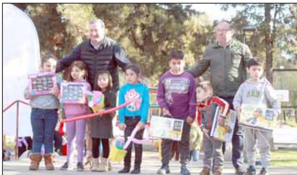
En la oportunidad se realizó una entretenida maratón Zumba-Peque, donde los más osados se llevaron premios de parte de la organización.