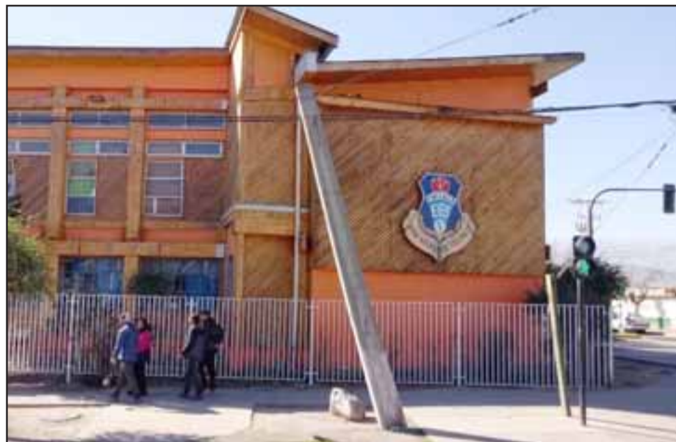
Frontis de la escuela José Manso de Velasco.

- En este caso desmantelan parte de la comida que le corresponde a los niños y eso es un crimen. Yo conversé con Junaeb (Junta Nacional de Auxilio Escolar y Becas), las autoridades al respecto, ellos saben que estoy trabajando en protección, pero bueno, están conscientes que esto puede seguir pasando, la verdad que ya esto ya está escapando los límites de