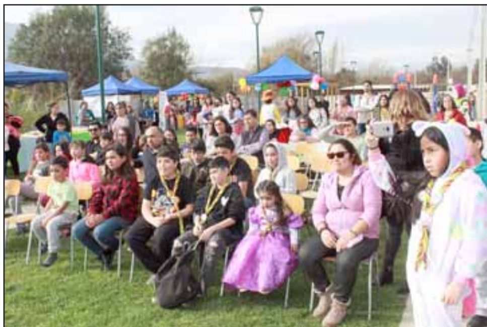
Una masiva participación convocó la celebración del Día del Niño organizada por el Municipio de Panquehue en los sectores El Mirador y La Pirca el fin de semana.

La celebración del día del niño concluirá este jueves 15 de agosto, donde se ha convocado a los menores de Escorial y Lo Campo a reunirse en las instalaciones de la Caja de Compensación Los Andes, desde las 15:00 horas.