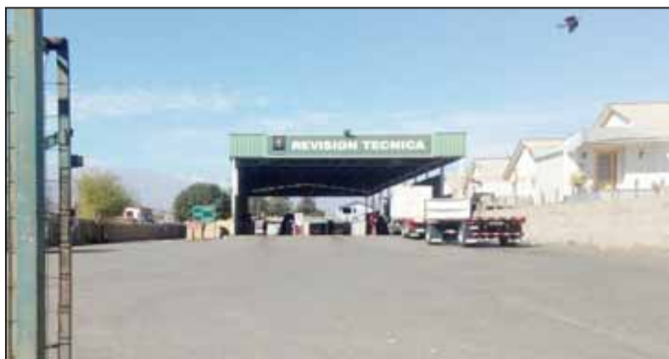
Actual planta de revisión técnica ubicada en Avenida Sargento Aldea, la cual deberá cerrar posiblemente antes de 30 días.