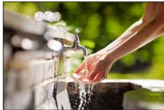
La sanitaria destinará recursos que superan los $5.400 millones, para el mejoramiento del sistema productivo de agua potable, la renovación de redes de distribución en diversos sectores y el refuerzo de la red de aguas servidas.

también el trabajo y disposición permanente del municipio de San Felipe, para avanzar en conjunto en la coordinación y ejecución de estas iniciativas, además de la difusión realizada con la Unión Comunal y los dirigentes vecinales.