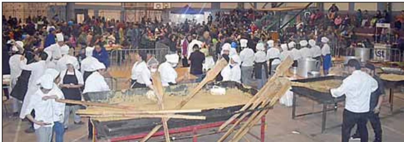
Más de 1.500 porciones fueron repartidas en el evento, el gimnasio estuvo lleno de gente durante la masiva actividad.