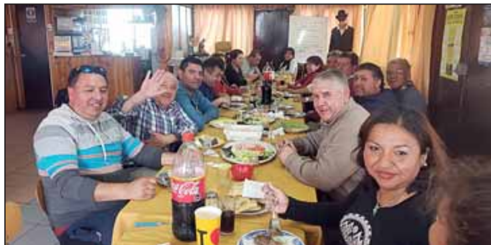
Los conductores reunidos en un almuerzo organizado por cada línea.

- Hay más desafíos que cuentas, porque en el fondo