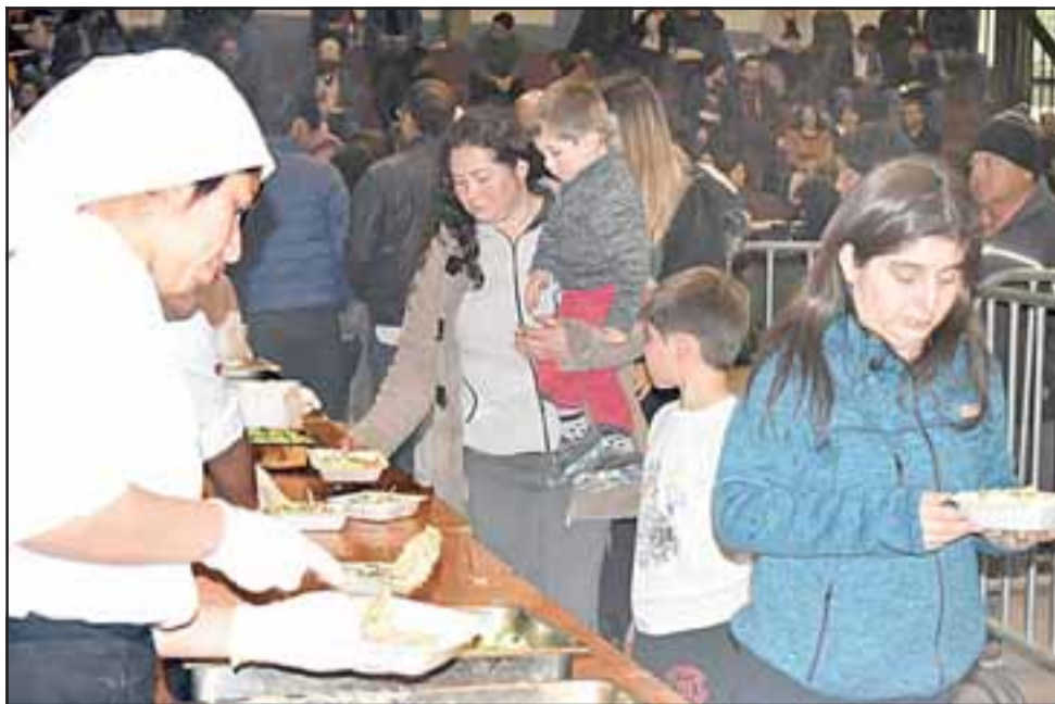
Los vecinos hicieron fila para recibir su chupe de guatitas.