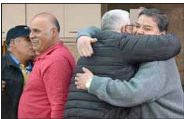
TIEMPO DE ABRAZAR.- Muchos se fundieron en un cálido abrazo, luego de volverse a encontrar tantos años después.