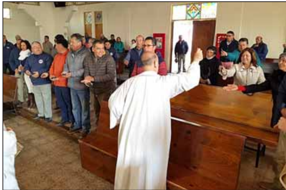
Conductores de taxis colectivos durante misa oficiada en parroquia de Sagrada Familia.

Era del sector El Asiento, pero su familia vive en Población Los Araucanos. El fallecimiento se produjo el día 14 de agosto en horas de la tarde.