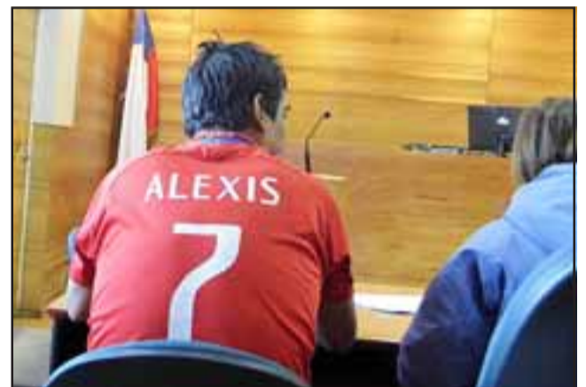
Como no hubo denuncia de la víctima, el sujeto sólo pasó a control de detención por el delito de Porte ilegal de arma cortante punzante.

El sujeto fue identificado como P.A.M.H. , de 38 años, quien se encuentra actualmente en situación de calle y registra un amplio prontuario policial por diversos delitos, siendo el más