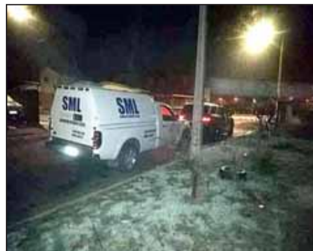
Personal de Carabineros, Brigada de Homicidios de la PDI y el Servicio Médico Legal se constituyeron de madrugada tras el hallazgo de muerte en el cruce ferroviario de Llay Llay..