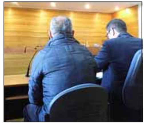
El imputado quedó en libertad, no obstante que se fijó un plazo de investigación de dos meses.

A solicitud del fiscal Raúl Ochoa se pidió fijar nueva fecha para una audiencia de discusión de medidas cautelares o salida alternativa, donde además será citada la dueña del perro.