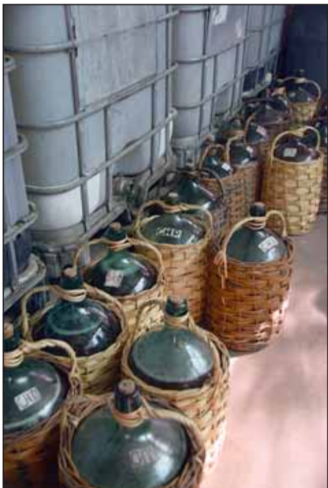
LA GRAN TENTACIÓN.- Miles de litros de chicha, vinos y otras misturas permanecen ya listos para las Fiestas Patrias.

Pacientes de Pediatría del Hospital San Camilo: