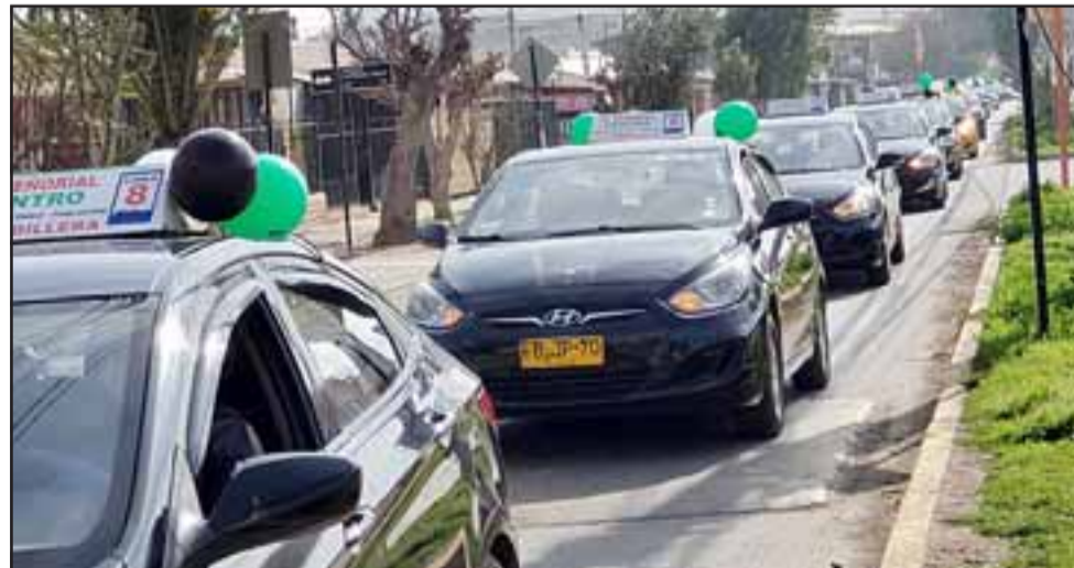
Los taxis colectivos paseando por distintas calles de San Felipe celebrando su día.