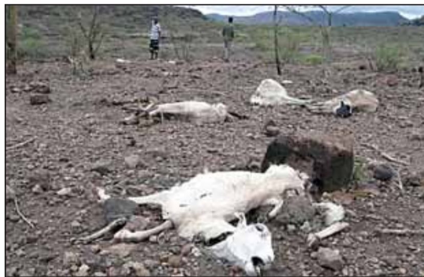
En la imagen animales muertos en el potrero.

nistro, pero parece que no se encontraba, pero esperamos que tenga buena acogida eso en un plazo no más allá de una semana, sino nos vamos a ver en la obligación de tomar otras medidas, no sé, de llegar de a caballo, sinceramente ya no sabemos qué puerta golpear; fuimos al municipio, el municipio nos prestó apoyo; en la gobernación, el gobernador no se ha hecho presente en la comuna de Putaendo; solicitamos reunión con el intendente, se comprometió a agilizar; se declaró Zona de Emergencia, pero la zona de emergencia prácticamente a no-