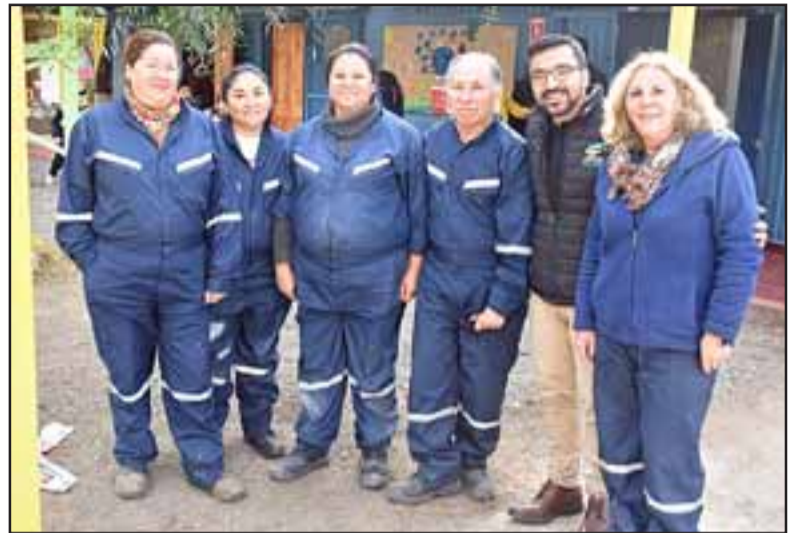
El alcalde Edgardo González junto a un grupo de apoderados de la Escuela Las Palmas que recibieron capacitación.

«Esta es una nueva obra que gestionamos con la Empresa Arrigoni, quienes está construyendo el encale O'Higgins y que nos ha permitido hacer obras en la escuela ya demás capacitar a apoderados y vecinos del sector de Las Palmas. Eran obras muy necesarias, porque todas las escuelas tienen más necesidades que recursos, y en ese contexto siempre andamos