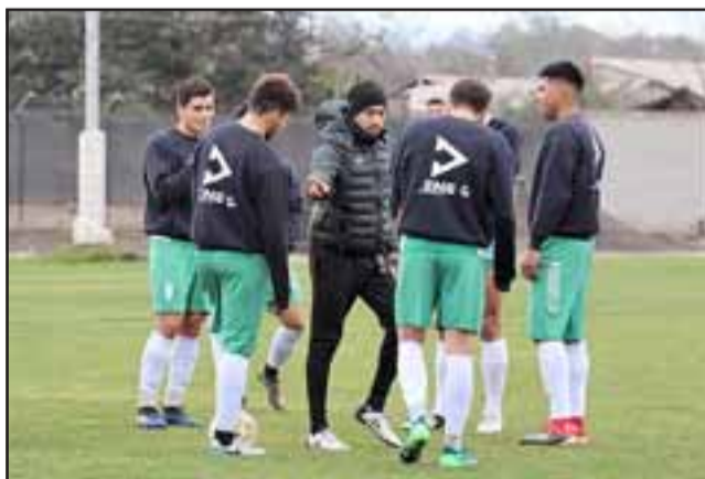
La escuadra andina no pudo imponerse como local a Municipal Santiago.

Rengo 0 - Pilmahue 0; Salamanca 1 - Ferroviarios 0; Real San Joaquín 3 - Mejillones 0; Limache 2 - Rancagua Sur 3; Ovalle 1 - Concepción 0.