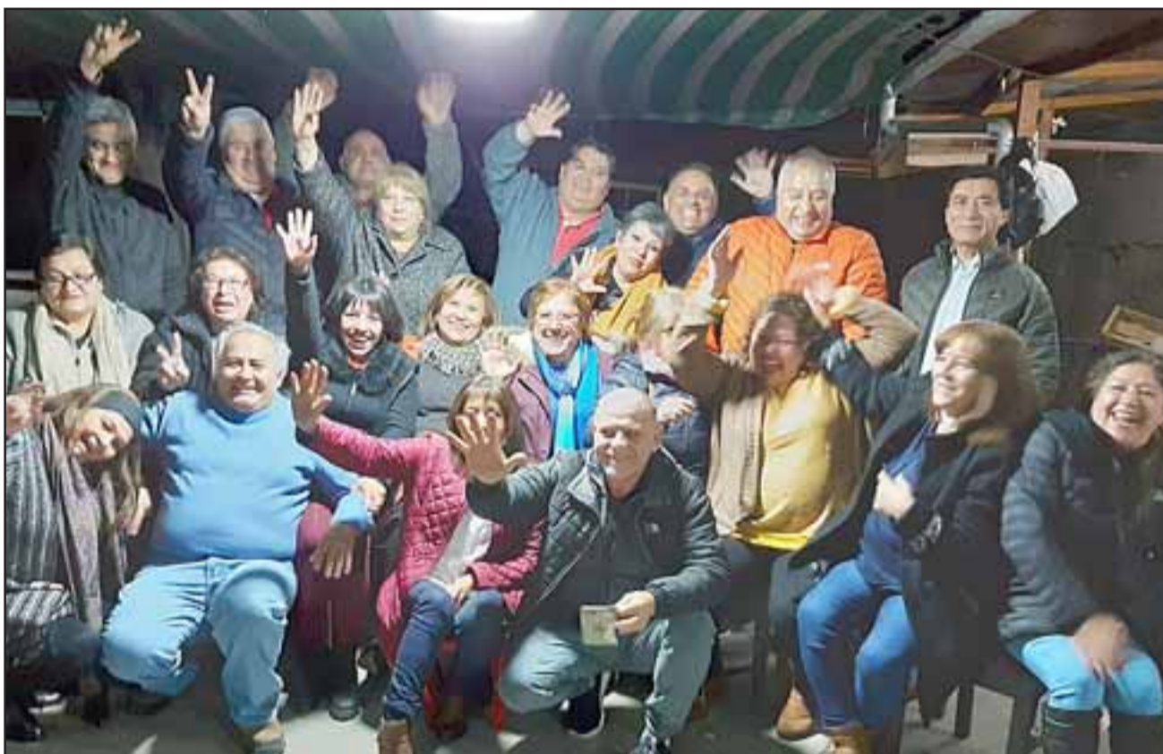
GENERACIÓN 75.- Aquí tenemos a nuestros amigos, todos protagonistas de la Generación 1975 de la antigua Escuela Uno, hoy llamada Escuela Bernardo O'Higgins.