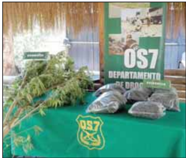
Personal del OS7 de Carabineros incautó siete plantas de cannabis, más de dos kilos de marihuana y una escopeta desde el domicilio de la actual sentenciada en el sector de Tierras Blancas de San Felipe. (Fotografía Referencial).