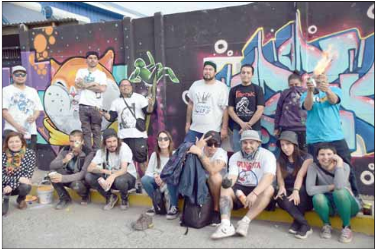
ARTISTAS URBANOS. - Aquí tenemos a un buen grupo de muralistas de distintas ciudades de la V Región, quienes llegaron a San Felipe para embellecer la comuna.

Cada día el muralismo cobra más protagonismo en el Valle de Aconagua, son también muy experimenta-