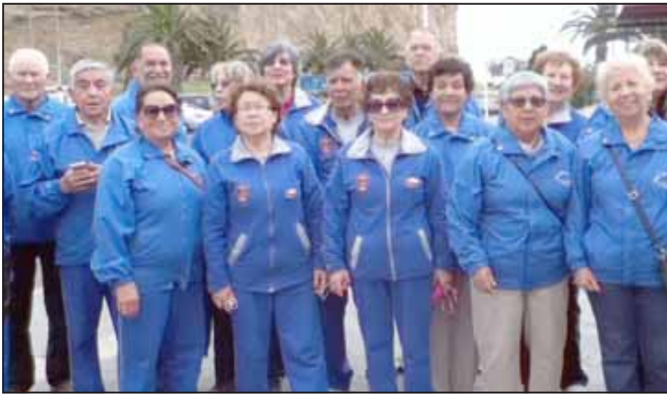
VIAJEROS.- En estos ocho años estos sanfelipeños han viajado a muchas partes de la región, aquí los vemos en El Morro de Arica, en una de sus giras.