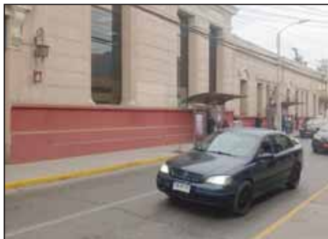
En este paradero los cuatro sujetos abordaron el taxi colectivo hacia La Troya

Realizó la denuncia correspondiente en Carabineros de la Segunda Comisaría de San Felipe.