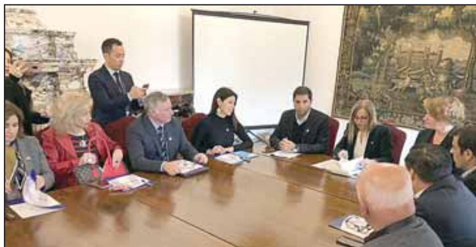
El alcalde Luis Pradenas estuvo presente en la firma del convenio que tuvo lugar en el salón 200 del Palacio de La Moneda, en presencia de la Ministra de la Mujer y Equidad de Género, Isabel Plá Jarufe.

Por su parte el alcalde José Miguel Arellano , presidente de AMUCh, la firma del convenio permitirá que en cada municipio miembro de la asociación, se podrá intensificar políticas referidas a la promoción de la generación de procesos e incorporación del enfoque de género en las municipales, asimismo visibilizar los problemas sociales que afec-