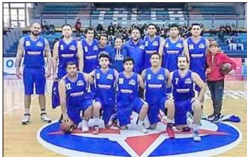
El Prat sufrió dos severos reveses en el comienzo de la competencia B de la LNB.