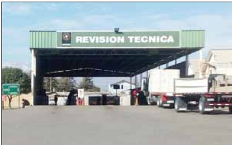
Esta es la actual planta de revisión técnica de San Felipe, que debe cerrar sus operaciones el próximo 30 de septiembre.

Cabe recordar que la actual planta de revisión técnica ubicada en la avenida Sargento Aldea, debe finalizar sus labores el día 30 de septiembre.