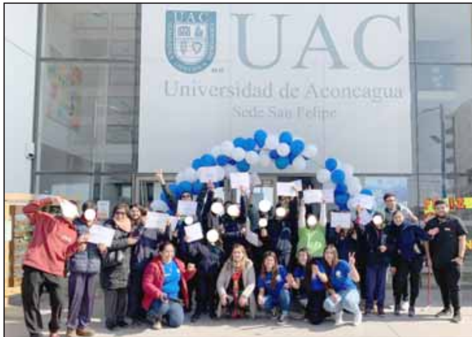
El departamento de asuntos estudiantiles y la red de voluntariado de la Universidad de Aconcagua se sumó a la celebración del Día del Niño, llevando juegos, regalos y diversión a los más pequeños de la Escuela Sagrado Corazón de San Felipe, para al día siguiente recibir a los estudiantes de niveles superiores en la sede universitaria donde todo el equipo los esperaba con un tour interactivo por las dependencias.

«Permitir que nuestros estudiantes desarrollen estas acciones, que en su mayoría nacen de su propia