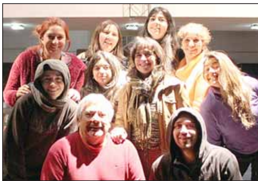
TALLER DE TEATRO.- Ellos son actores de nuestra comuna, quienes en verano de este año presentaron su trabajo en Barrio Escuadra-Argelia.

Actualmente, la compañía Rioseco ensaya en el Teatro Roberto Barraza del emblemático Liceo Roberto Humeres; proyectan el rees-