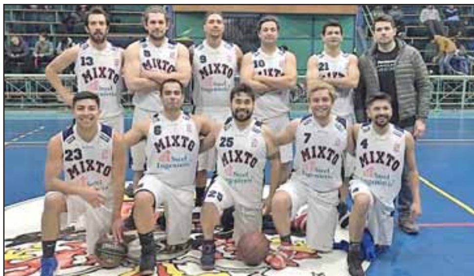
Con categoría y de manera aplastante Liceo Mixto se quedó con el título del torneo de Apertura de la ABAR.

Por el Título: Liceo Mixto 75 – Sonic 47