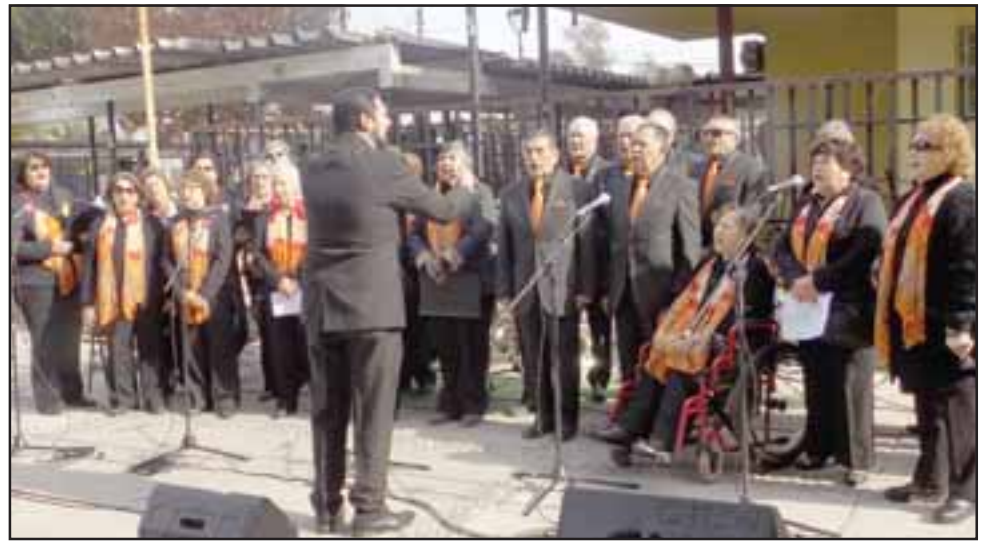
CORISTAS LISTOS.- Desde hace varias semanas estos coristas sanfelipeños ensayan y mejoran para poder lucirse en el 20° Encuentro Latinoamericano de Coros de Adultos Mayores de Argentina 2019.