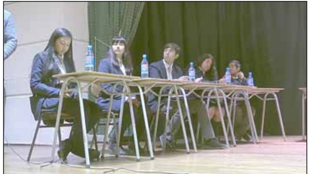
Los alumnos defendieron sus distintas posiciones, entregando argumentos a favor o en contra de los temas planteados.

un llamado a la Municipalidad de San Felipe a «agilizar la gestión del terreno donde se construirá la nueva planta de revisión técnica», con el objetivo de evitar que más de 26 mil personas, que utilizan vehículos motorizados en la provincia de San Felipe de Aconcagua, se vean afectados por el próximo cierre.