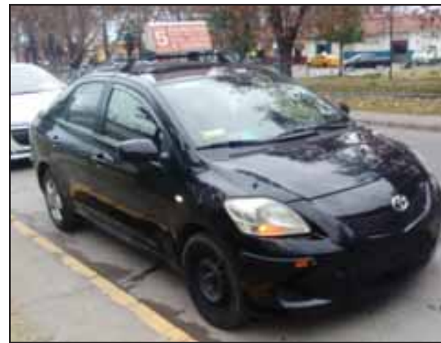
Este es el taxi colectivo que maneja la víctima.

Comenta que mientras iba en el recorrido, como una forma de alertar a sus compañeros, envió algunos mensajes por WhatsApp: «Llegaron varios colegas al lugar, ya no estaban, ya me había agarrado con ellos,