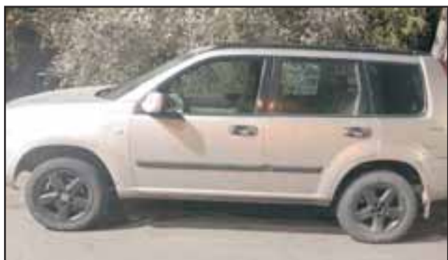
El vehículo donde se encontraban las presuntas víctimas fue abandonado en el lugar.