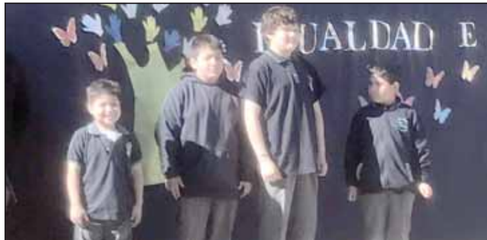
Los estudiantes de la Escuela San Rafael celebraron animadamente esta fecha especial.

La escuela además se ha convertido en un espacio de encuentro entre la comunidad de San Rafael, por lo que mantiene sus puertas abiertas para que los vecinos conozcan el trabajo educativo que ahí se realiza.