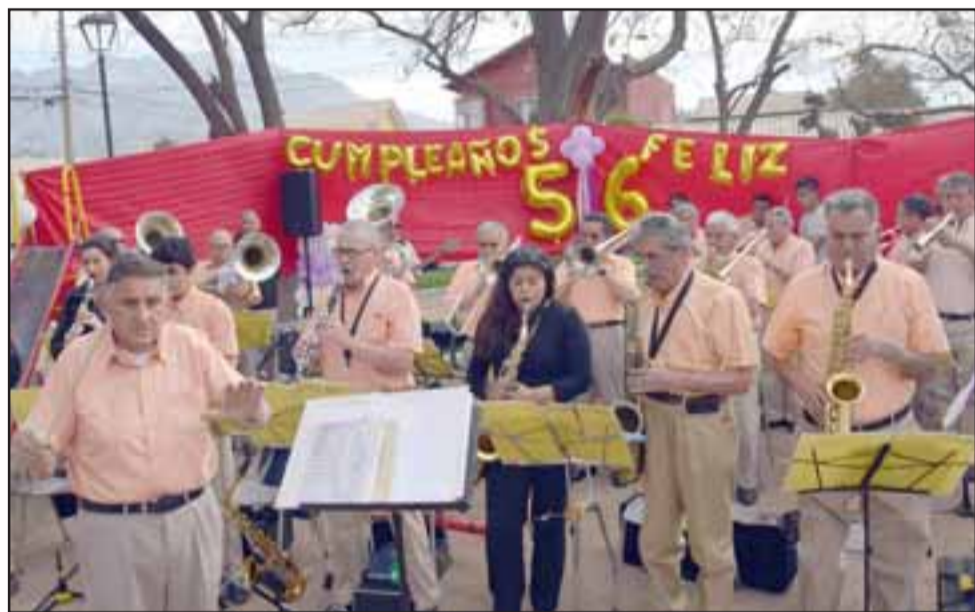
NUESTRO ORFEÓN. - El Orfeón Aconcagua estuvo encargado de alegrar la fiesta comunitaria.