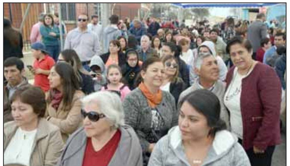
AÑOS DE LARGA ESPERA.- Fueron muchos años los que estas personas debieron esperar para ver cumplido su sueño de una casa propia.