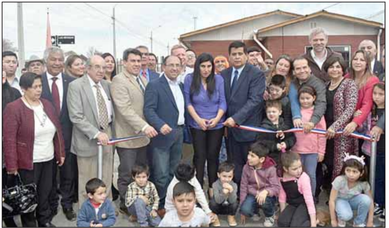
MISIÓN CUMPLIDA.- Las autoridades y nuevos propietarios de estas viviendas cortaron con alegría la cinta, naciendo así oficialmente la nueva Villa Cumbres de Aconcagua, con 84 viviendas.

bre Aconcagua, después por ahí nos apareció a poco menos de tres cuadras de la Plaza de Armas, un terreno para la época bastante barato, y trabajamos por ello como los tres comités, que los unimos en dos: Esperanza y Mirador, y el objetivo fue que a partir de hoy día esta villa se llama Cumbres de Aconcagua, ya nos olvidamos del nombre Villa Esperanza, un tremendo nombre muy bonito, una villa a tres cuadras de la plaza, todo céntrico todo central, este comité comenzó a trabajar entre 2012 y 2013, siete años son bastante trabajo y gracias a la empresa San Esteban hoy día estamos entregando estas casas a 84 familias, las que tienen cifradas sus esperanzas en vivir en estas casas, y nosotros como Municipio y yo como alcalde quiero felicitarlos y pedirles a ustedes que construyan sus hogares, van a ser sus hogares, son gente de nuestra comuna quienes van a estar trabajando y viviendo acá, es un barrio muy lindo, hemos revisado la población y quedó muy bien enclavada con hartos juegos para los niños, una