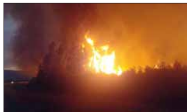
En total fueron unas 16 hectáreas las que fueron consumidas por el fuego.