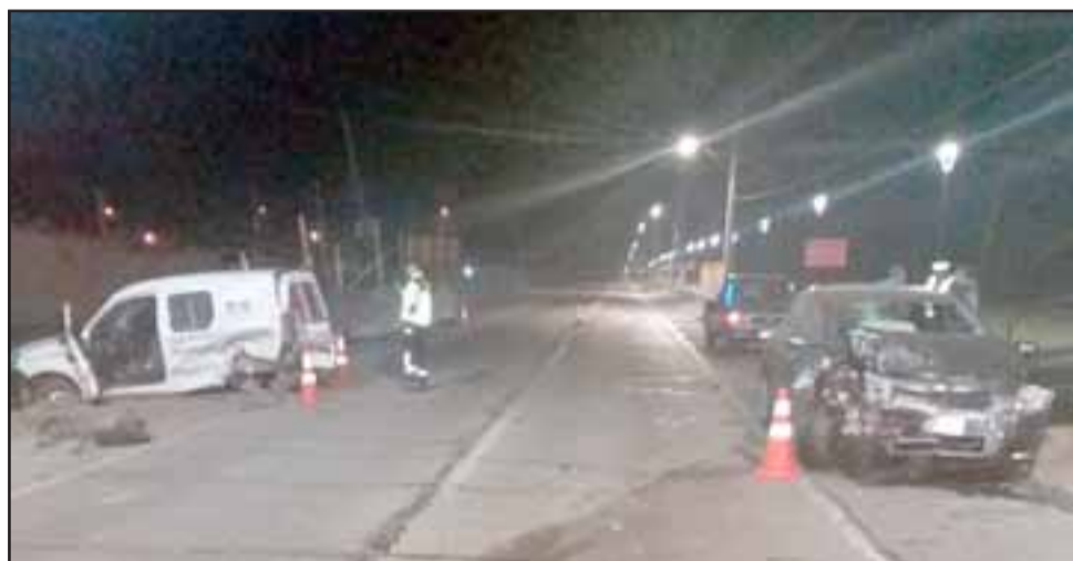
El accidente ocurrió alrededor de las 05:10 horas de este sábado 24 de agosto en la ruta Troncal en Panquehue.