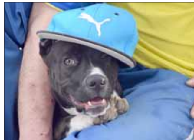
NADIE FALTÓ. - Este perrito también fue llevado al festejo con su mejor sombrero cumpleaños.