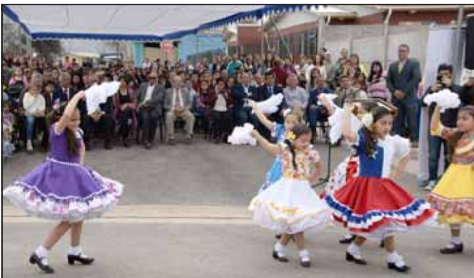
HUELE A SEPTIEMBRE.- El Ballet Infantil Municipal de Santa María se encargó de alegrar la actividad con nuestro Baile Nacional.