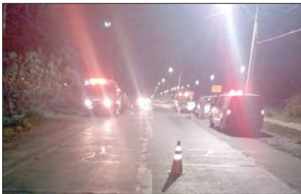
Al lugar concurrieron los organismos de emergencia para asistir a los conductores quienes protagonizaron la violenta colisión.