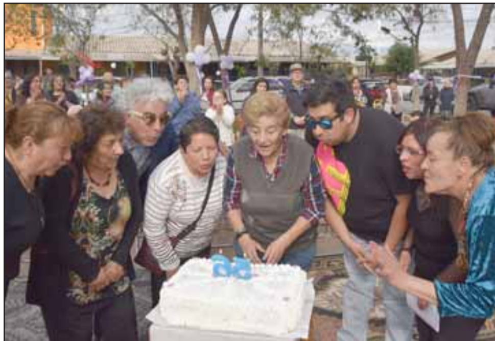
TREMENDA TORTA. - Enorme fue la torta cumpleaños que autoridades y vecinos degustaron en la actividad.

a celebrarlo con la música del Orfeón Aconcagua en vivo, las autoridades de la comuna y e invitados especiales, la mayoría de los vecinos son adultos mayores, pues esta población se fundó en 1963, en los últimos meses logramos pavimentación para el sector, ahora estamos centrados en un proyecto de cambio de techumbre, para poner zinc y quitar el pizarreño, lo estamos desarrollando este proyecto con el Serviu de San Felipe, son como 22 casas las que serán intervenidas muy pronto, agradecer a los vecinos por confiar en mí, una vecina nacida acá en esta villa», indicó la destacada lideresa comunitaria.