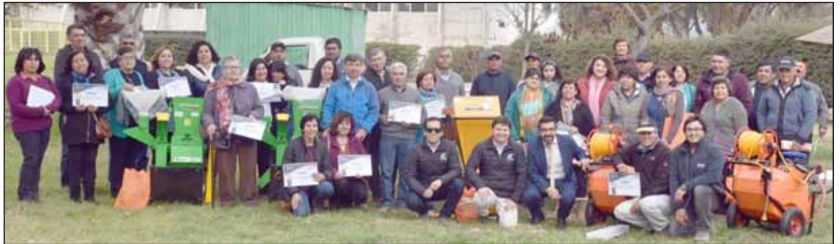
Los agricultores recibieron sus maquinarias y diplomas que los acreditaron como beneficiarios de esta iniciativa.

Dicho aporte económico es fundamental para los pequeños agricultores, los cuales llevan a cabo diversas tareas agrícolas, siendo un apoyo para la familia sobre todo en esta época del año. Cabe señalar que la co-