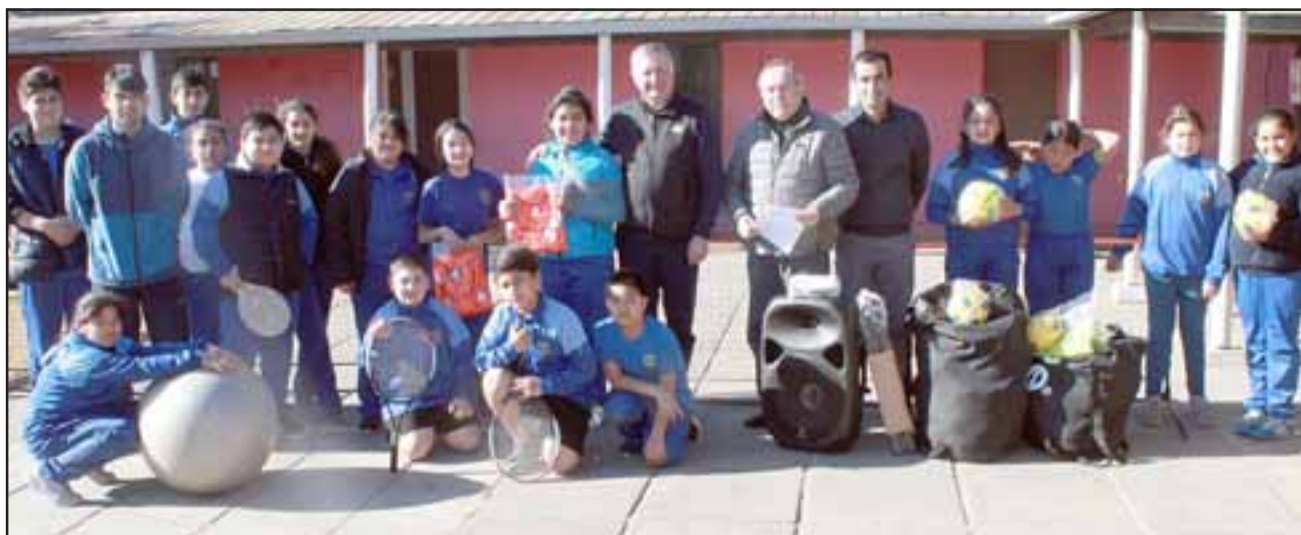
Este tipo de indumentaria consiste en balones de vóleybol, de fútbol, escalerillas, petos y conos.