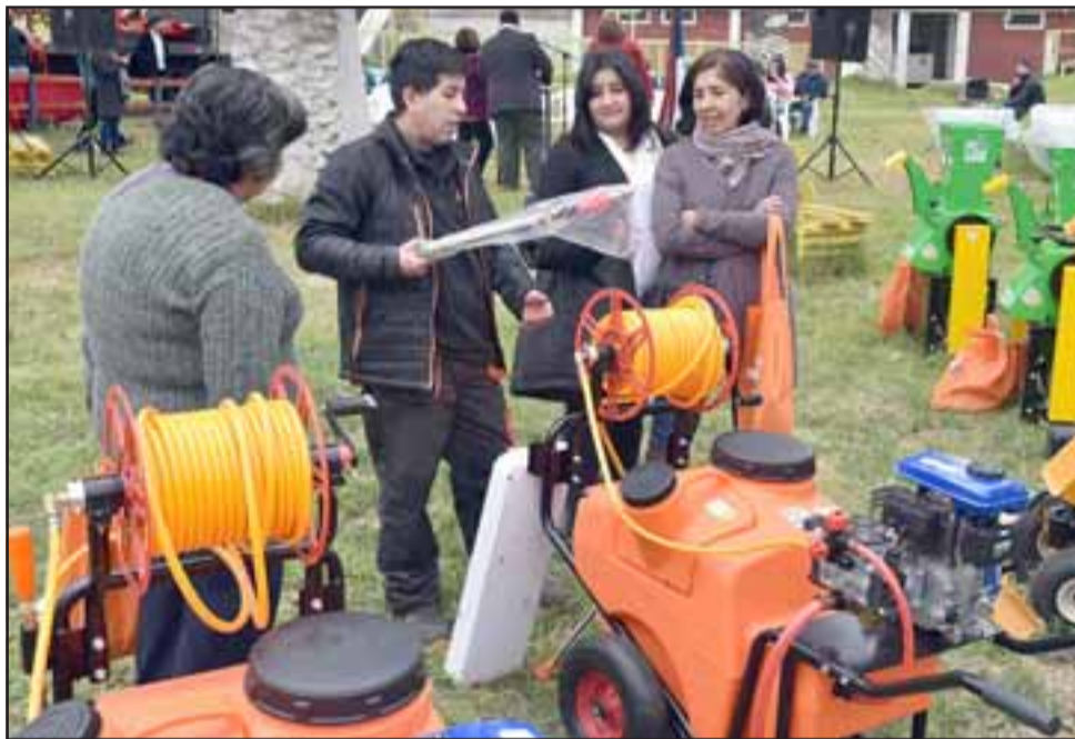
En total, los 38 beneficiarios recibieron fondos por un total de 40 millones de pesos.

gencia agrícola y ganadera que vive la zona: «Quiero hacer una invitación y un llamado, porque necesitamos más apoyo, un apoyo más estructural del Estado. Por cierto que estos beneficios aportan, pero queda mucho por hacer. Estamos partiendo y este verano va a ser muy complejo para nuestros agricultores y en ese sentido necesitamos más apoyo y más inversión en infraestructura de parte del Estado de Chile», sentenció.