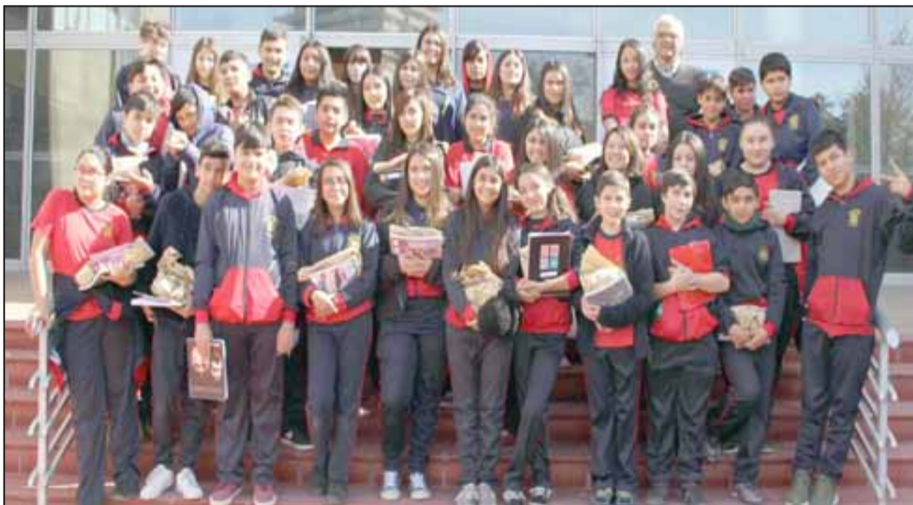
Cerca de 40 niños de 7° básico de la Escuela España visitaron el edificio de la minera en Los Andes, donde profesionales voluntarios los recibieron y les mostraron las distintas etapas del proceso productivo.

mo, sobre todo biolixiviación, y así establecer conexión entre los contenidos con lo que se trabaja acá en la minería». Andina Más Cerca es un programa con cuatro años de funcionamiento, y con varias líneas de trabajo, una de ellas son las visitas de estudiantes de enseñanza básica al edificio. «Estamos muy contentos con este inicio del segundo semestre del programa Andina más Cerca, y poder recibir a los estudiantes del valle de Aconcagua en nuestras instalaciones. El principal objetivo es acercar la minería a niños y jóvenes, nuestros vecinos, con quienes compartimos el mismo territorio», dijo Juan Suberca-seaux, director de Comunicaciones de Andina.