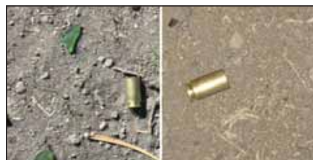
Carabineros de Putaendo levantó estas vainillas percutadas calibre 40 en el sitio del suceso.

«De lo anterior, no hubo personas lesionadas ni tampoco se presentó denunciante alguno, no obstante, Carabineros informó al Fiscal de Turno lo sucedido, quien instruyó confeccionar parte policial con los antecedentes y remitir las