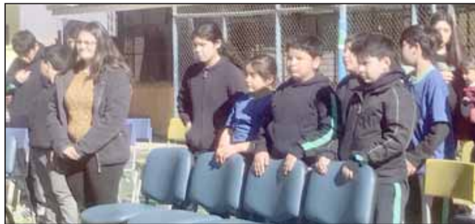
La actividad terminó este jueves 22 de agosto con un acto central, en el que participó toda la comunidad educativa.