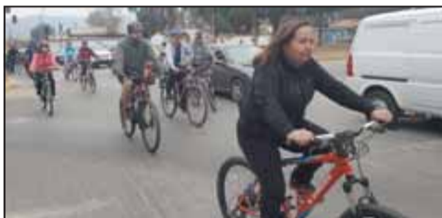
No importó la edad, niños y grandes disfrutaron del paseo, dejando claro que estas ciclovías sí son necesarias.