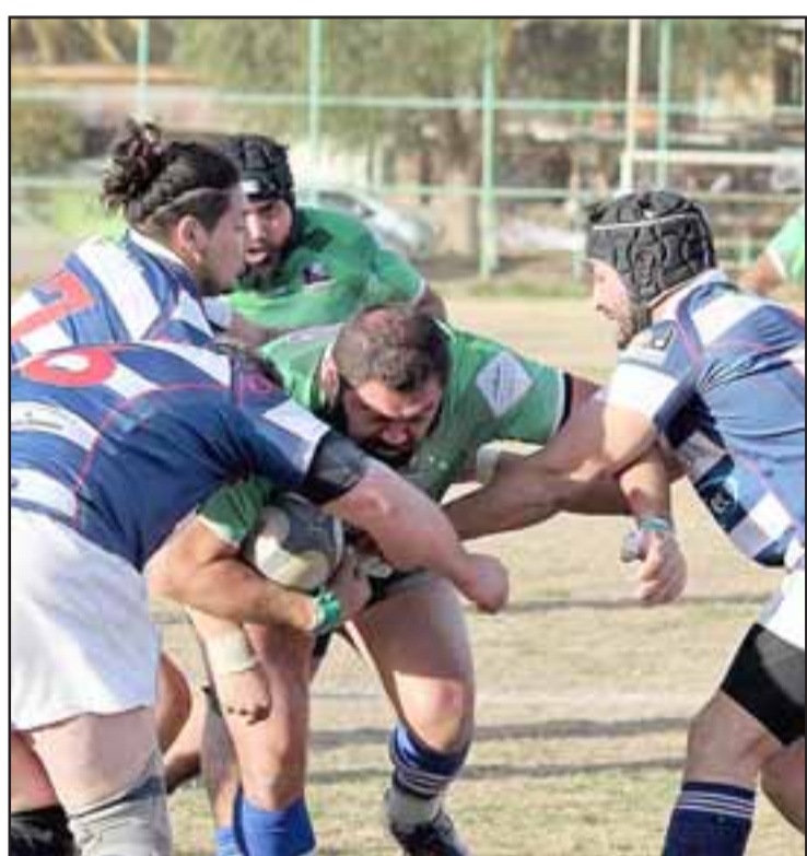
Los Halcones fueron goleados en la pasada fecha del Central A de La Arusa.