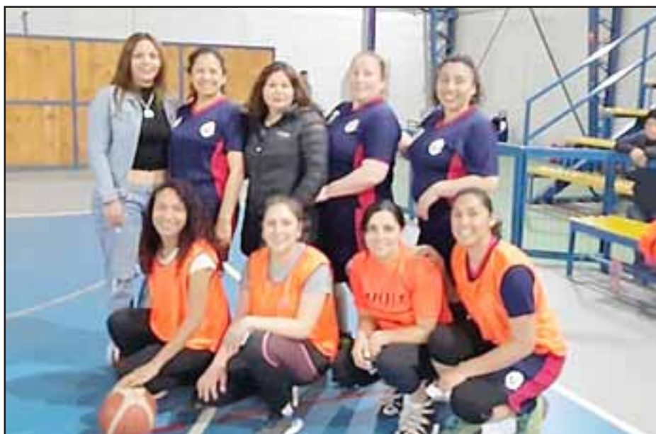
El representativo del María Auxiliadora terminó en la penúltima posición del torneo Valle de Aconcagua.