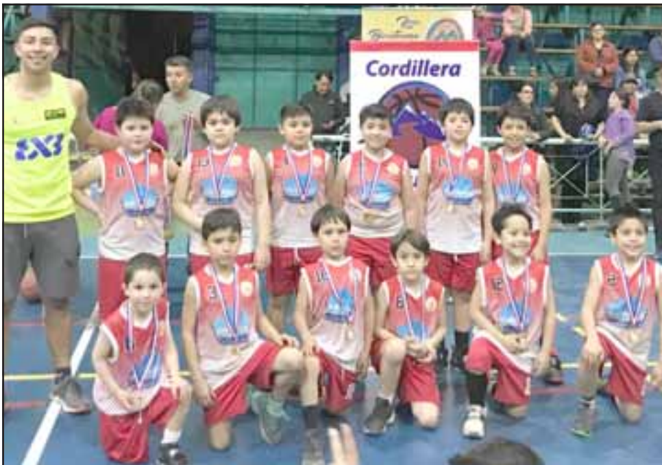
El San Felipe Baské logró desempeñarse muy bien en sus partidos, al final todos los niños recibieron su medalla.