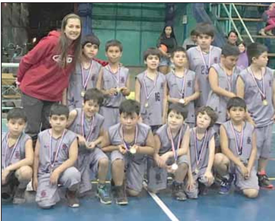
LOS ANFITRIONES.- Aquí están los anfitriones del encuentro, los jugadores del Club Deportivo Cordillera Baské.