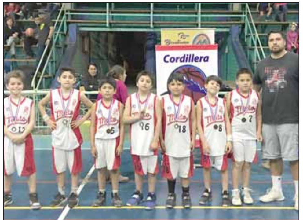
IMPARNABLES.- También los chicos del Liceo Mixto de San Felipe hicieron de las suyas en estas jornadas.