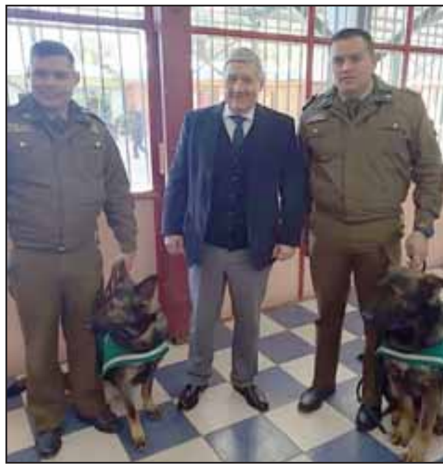
CANES ENTRENADOS.- Carabineros de San Felipe también participó en esta jornada, presentando una sesión demostrativa de los canes entrenados.