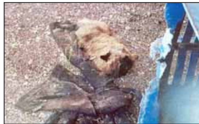
Uno de los animalitos muerto en el sitio del suceso.