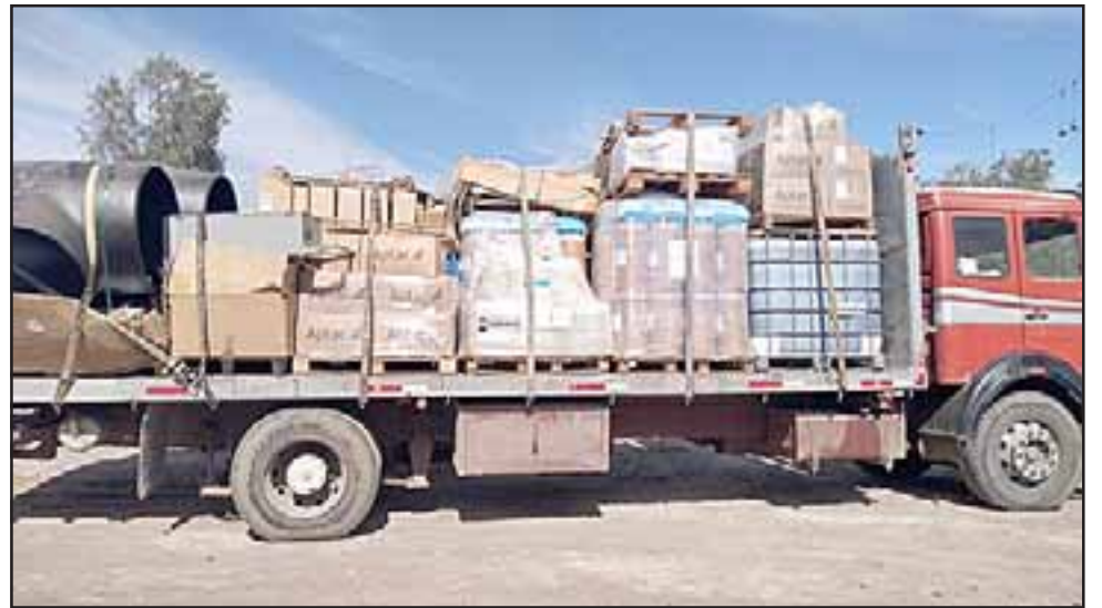
Los atracos fueron cometidos en los sectores de Lampa y Quilicura, para lo cual los antisociales se valieron de armas de juego y otros elementos intimidatorios como bate de béisbol.

El comisario López indicó que estos ilícitos corresponden a un Robo con violencia y un Robo intimidación, uno de ellos de transporte internacional que había ingresado a Chile en el mes de julio por el paso Cristo Redentor. Añadió que uno de estos robos fue bastante violento, ya que golpearon al conductor y ambos los camiones fueron