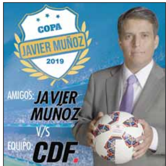
La cita futbolística será este jueves a las 17:00 horas en el Estadio Municipal de San Felipe.