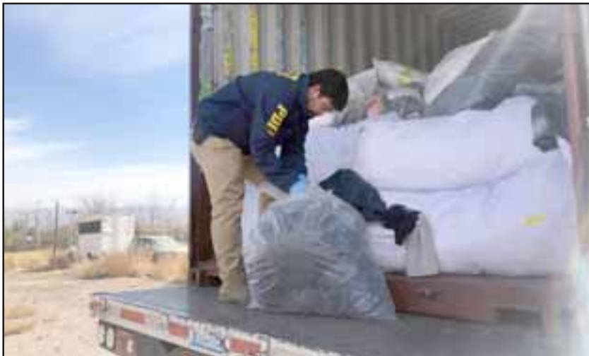
Se logró recuperar 278 fardos de ropa que tenían por destino la ciudad de Puerto Montt.

Los atracos fueron cometidos en los sectores de Lampa y Quilicura, para lo cual los antisociales se valieron de armas de juego y otros elementos intimidatorios como bate de béisbol. El jefe de la Biro comentó que todos los detenidos mantienen antecedentes policiales, siendo puestos a disposición del Juzgado de Garantía de Colina por el delito de Receptación. Además, continúan las diligencias para establecer si esta banda perpetró asaltos a camiones en la zona jurisdiccional de Los Andes, ya que al menos hay una denuncia que están investigando.