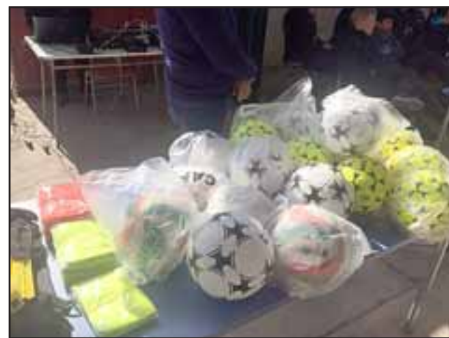
A JUGAR CHIQUILLOS.- Estas pelotas de fútbol son parte de los donativos que los niños de El Asiento recibieron por parte de esta fundación.