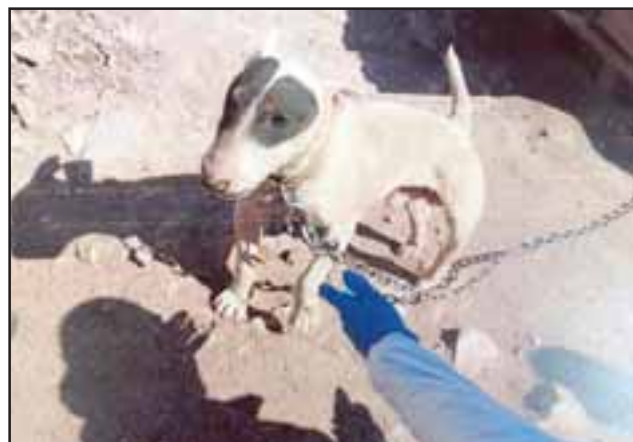
Este can fue uno de los rescatados por efectivos de la PDI.