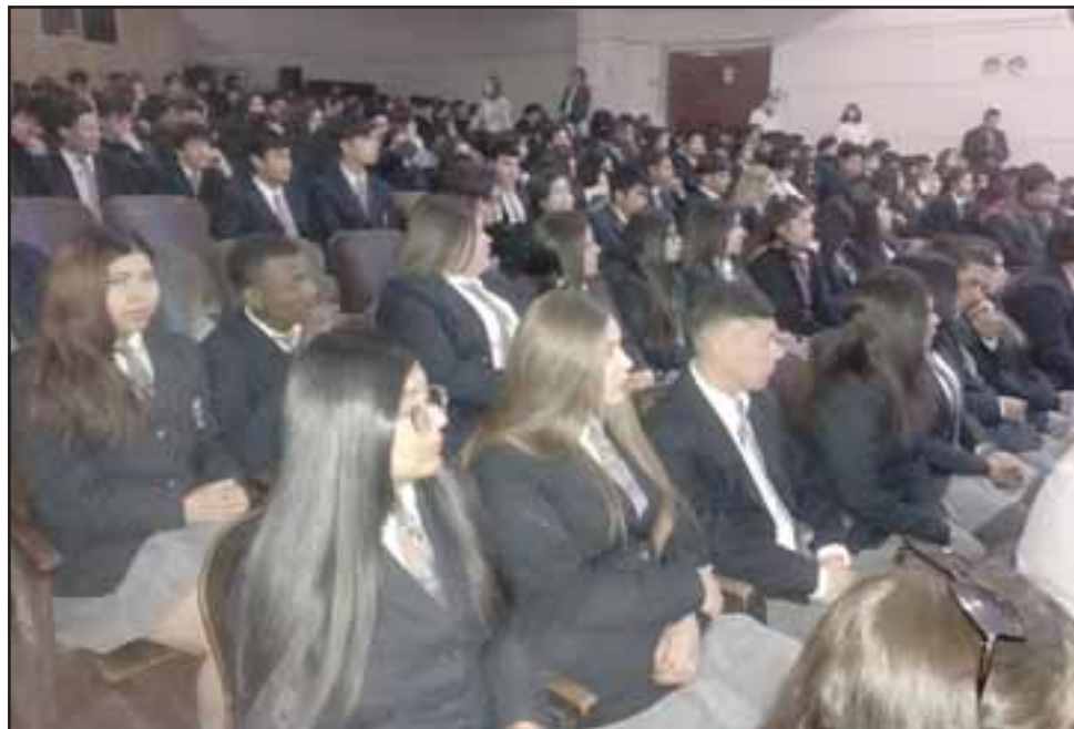
La comunidad estudiantil del Liceo Roberto Humeres, junto a autoridades y ex alumnos, celebró el día de la Educación Técnico Profesional.