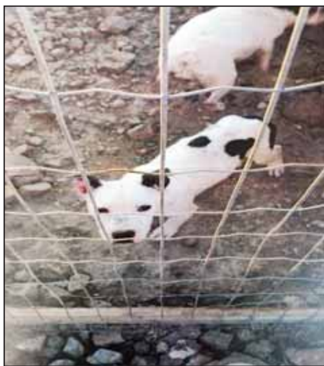
Otro de los animalitos salvados por la policía, encerrado en caniles.