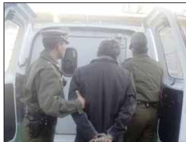
El imputado de 39 años de edad fue detenido por Carabineros de la Subcomisaría de Llay Llay por el delito de robo en lugar no habitado. (Fotografía Referencial).