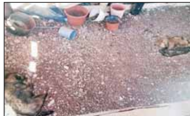
Lamentablemente fueron hallados muertos dos cachorros.