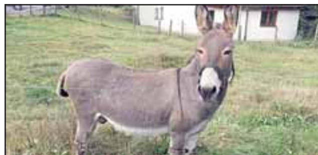
TREMENDO PREMIO. - Un burrito de verdad, de carne y hueso como éste, también está siendo rifado por esta joven sanfelipeña. (Referencial)

caudé con la campaña que me han hecho, he podido salir adelante, también con ese dinero me pago las radioterapias, la fundación me rebajará la mitad, también ya estoy coordinando