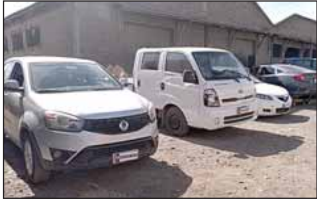
Además se incautaron seis vehículos; tres automóviles, dos SUV y un camión de reparto.