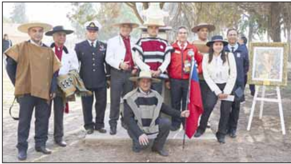
Esta es la delegación de chilenos que viajó a la ceremonia realizada en Argentina, junto al busto y el retrato del General Bernardo O'Higgins obsequiados a las autoridades trasandinas.