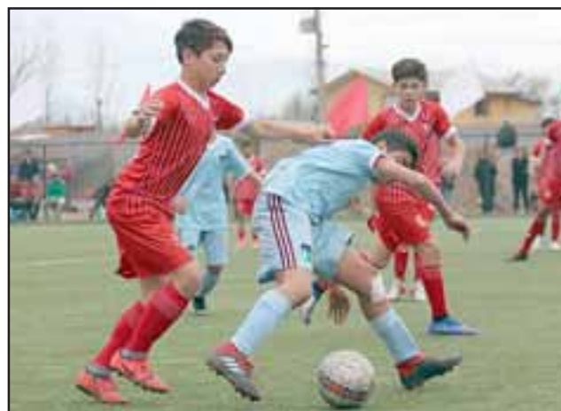
Cuatro conjuntos sanfelipeños se enfrentaron a sus iguales de O'Higgins.