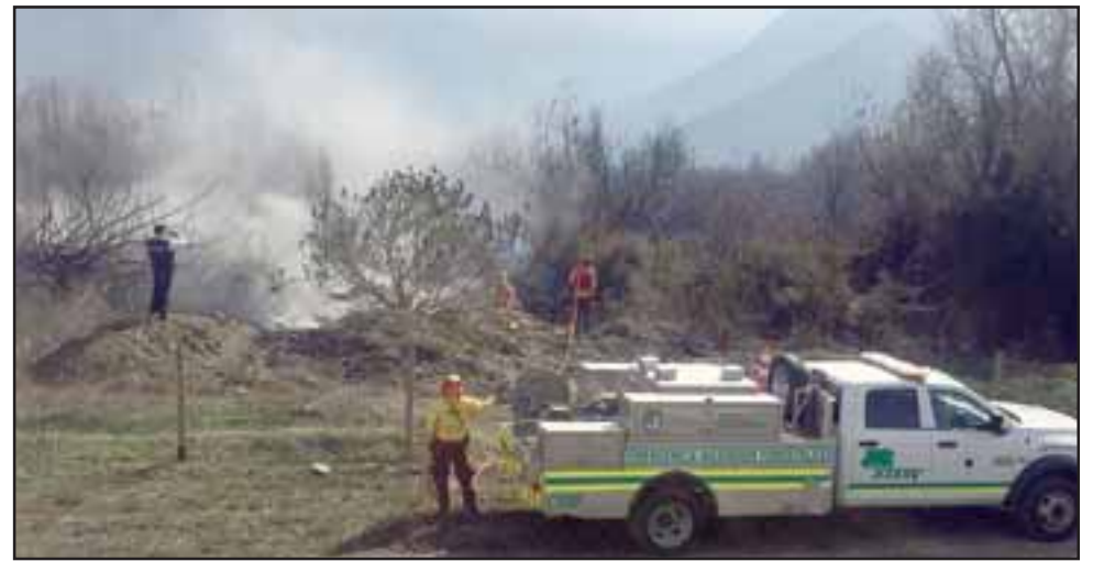
El gobernador Claudio Rodríguez anunció que queda prohibida la realización de cualquier tipo de quema agrícola para evitar incendios forestales como el registrado la semana pasada en el límite de las comunas de Panquehue y Catemu.

A partir de lo anterior, la máxima autoridad provincial destacó el trabajo coordinado que se llevó a cabo para extinguir el siniestro que la semana pasada afectó zonas cercanas a áreas pobladas. «Quisiera aprovechar de destacar y valorar la importante labor realizada por Bomberos la semana pasada, al igual