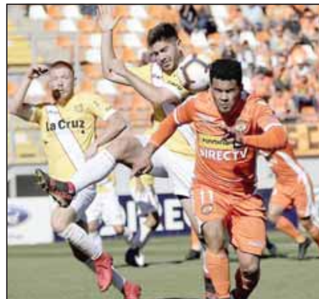
Unión San Felipe viene de caer por la cuenta mínima ante Cobreloa.