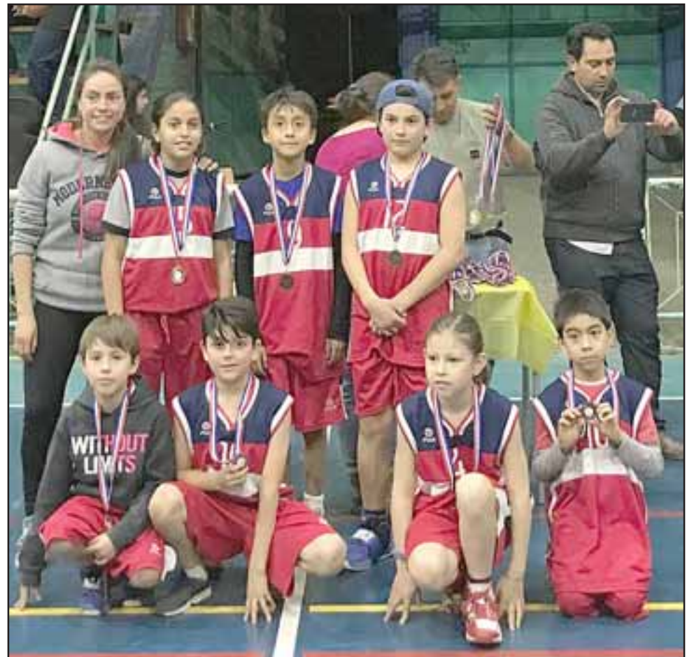
VALIENTES GUERREROS.- Estos pequeñines son los basquetbolistas del colegio Greenland, quienes participaron activamente en el encuentro.