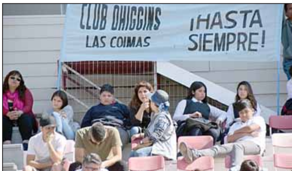
MUESTRAS DE CARIÑO. - Varios clubes deportivos de Aconcagua estuvieron presentes durante la jornada final.