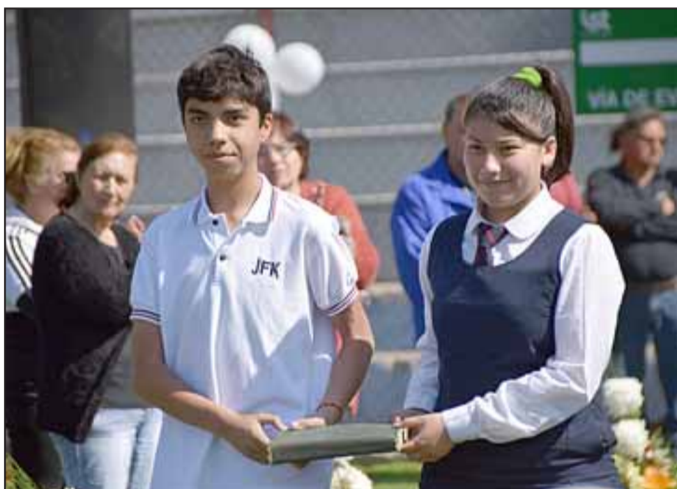
SUS ALUMNOS. - Varios niños que estudian en la Escuela JFK rindieron su homenaje también a su insigne profesor.