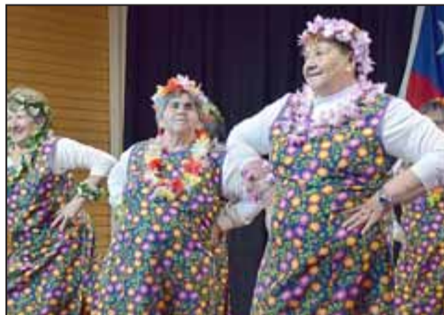
ELLAS TAMBIÉN.- Las adultas mayores también presentaron su trabajo folclórico frente al público, en el Teatro Municipal de Santa María.