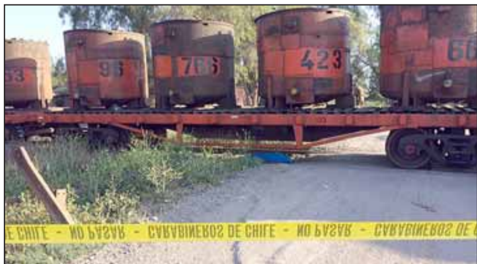
El lamentable hecho ocurrió en horas de la madrugada del pasado jueves en la línea férrea ubicada en la comuna de Llay Llay. (Fotografía Referencial).