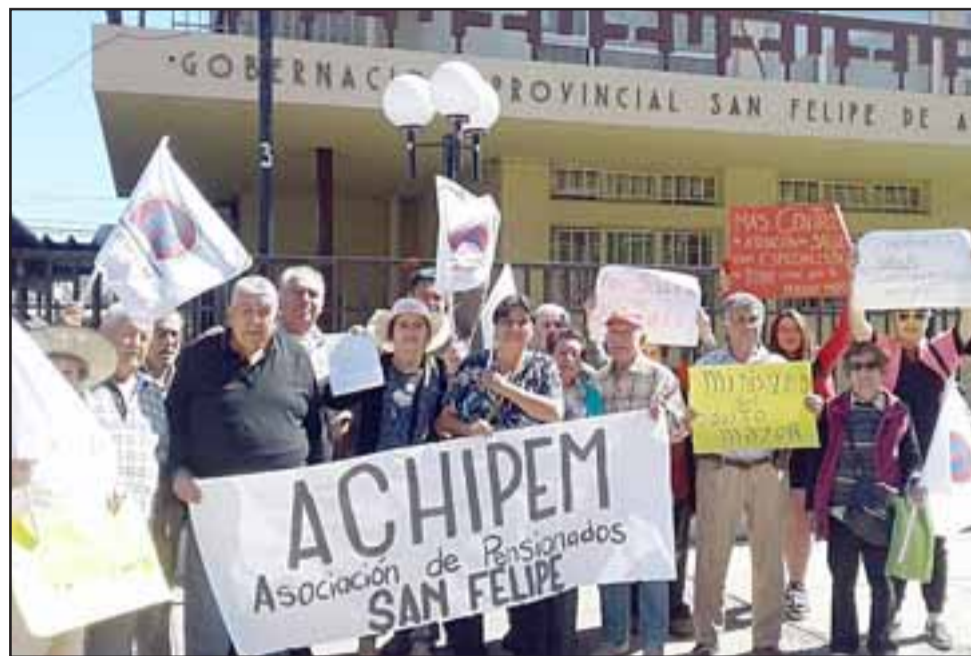
El grupo de adultos mayores que participó de la actividad llevada a cabo este día jueves 29 de agosto.

también que instalen en todo Chile incluyendo las zonas rurales Centros de atención para el adulto mayor, con especialistas que cubran nuestras demandas.