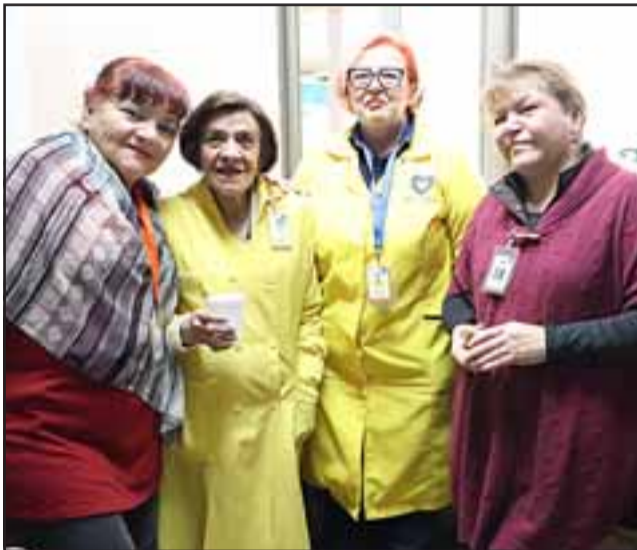
Este beneficio fue entregado por estas voluntarias durante invierno y culminó de manera exitosa, prometiendo volver el próximo año en ayuda de quienes asisten desde sectores alejados y muchas veces en ayunas.

res, proveniente de Quebrada Herrera en Putaendo quien recibió el último desayuno y que claramente no esperaba recibir en su visita al Hospital San Camilo acompañando a su hijo, pero se fue feliz con su guatita llena sin tener que realizar otro gasto adicional al de los pasajes.