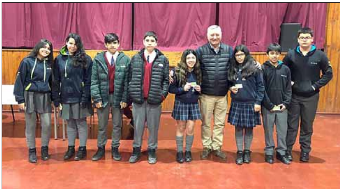
Esta Gift Card se trata de un beneficio que permite a los alumnos no desertar del sistema escolar, al no contar con recursos para poder estudiar. Los montos son variables, $9.000, $78.000, $90.000 y hasta $150.000.

La selección de los alumnos, la realiza el Ministerio de Educación, con los datos que entrega el Ministerio de Desarrollo Social, con el fin de hacer la clasificación de los llamados alumnos prioritarios, consi-