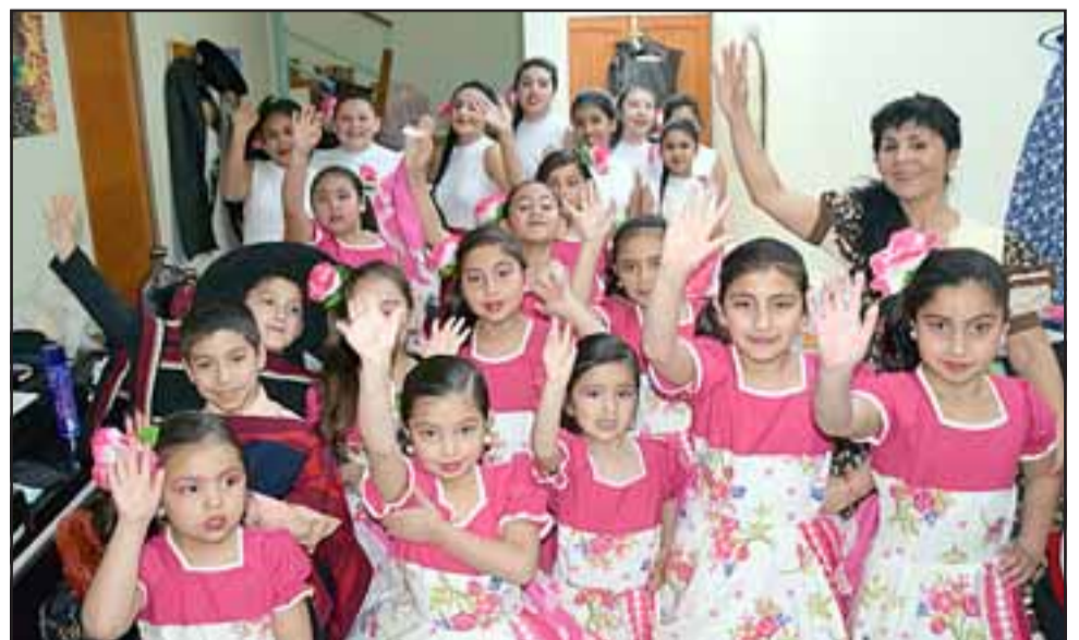
MUY TALENTOSOS.- Ellos son los más pequeñitos del Ballet, aquí participan niños desde sus 4 años de edad.