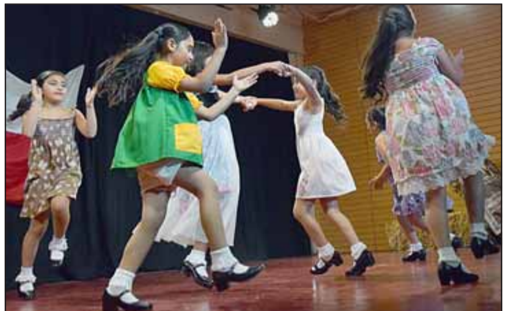
RONDAS INFANTILES.- Varias rondas infantiles fueron presentadas durante la excelente gala de estos chicos.