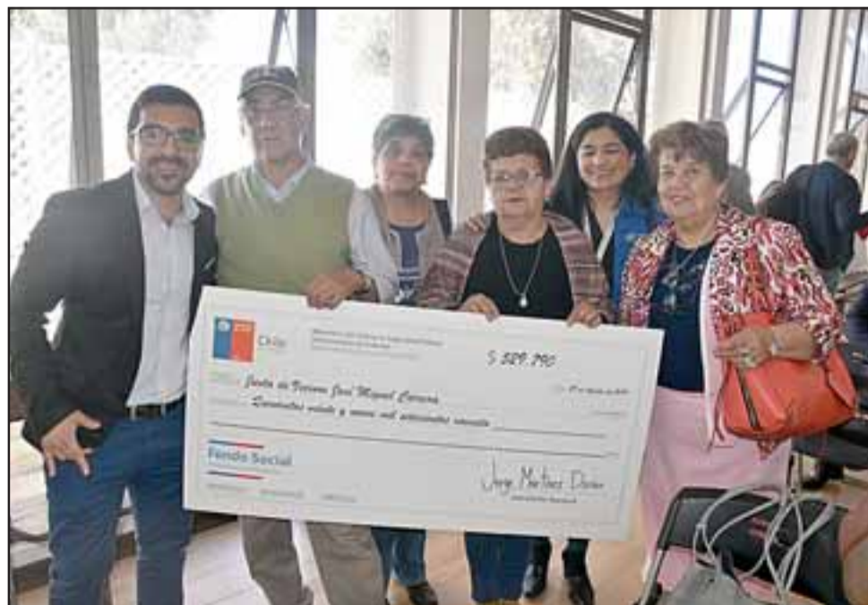
TREMENDO CHEQUE.- La junta de vecinos José Miguel Carrera recibió la suma de $579.790, con ese dinero podrán desarrollar varias iniciativas de bien común.

vel comunal. Lo trabajamos de esa forma porque somos una comuna que necesita recursos y tenemos que apalancarlos de distinta forma. Lo hacemos de manera profesional y colectiva», dijo el líder comunal.