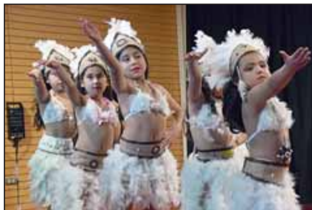
BAILES PASCUENSES.- También hubo bailes pascuenses en esta gala, estos niños ensayaron mucho para que les fuera tan bien.