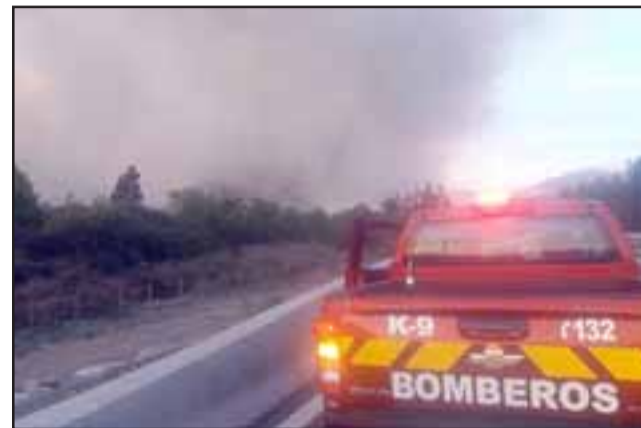
Camioneta de Bomberos presentes en el incendio forestal en Panquehue.

seleccionados para formar parte de la brigada, «todo ese proceso de capacitación, de seguridad, obviamente es entre septiembre y noviembre antes que empiece la brigada, son turnos de 10x4. Los contratos son por temporada. En este caso sería entre noviembre hasta fines de marzo, pero durante el próximo año se analiza si la brigada se mantiene un mes más o no, dependiendo de las condiciones climáticas que efectivamente son muy cambiantes, entonces ahí se evalúa si la brigada se mantiene un mes más, pero hasta ahora sería hasta