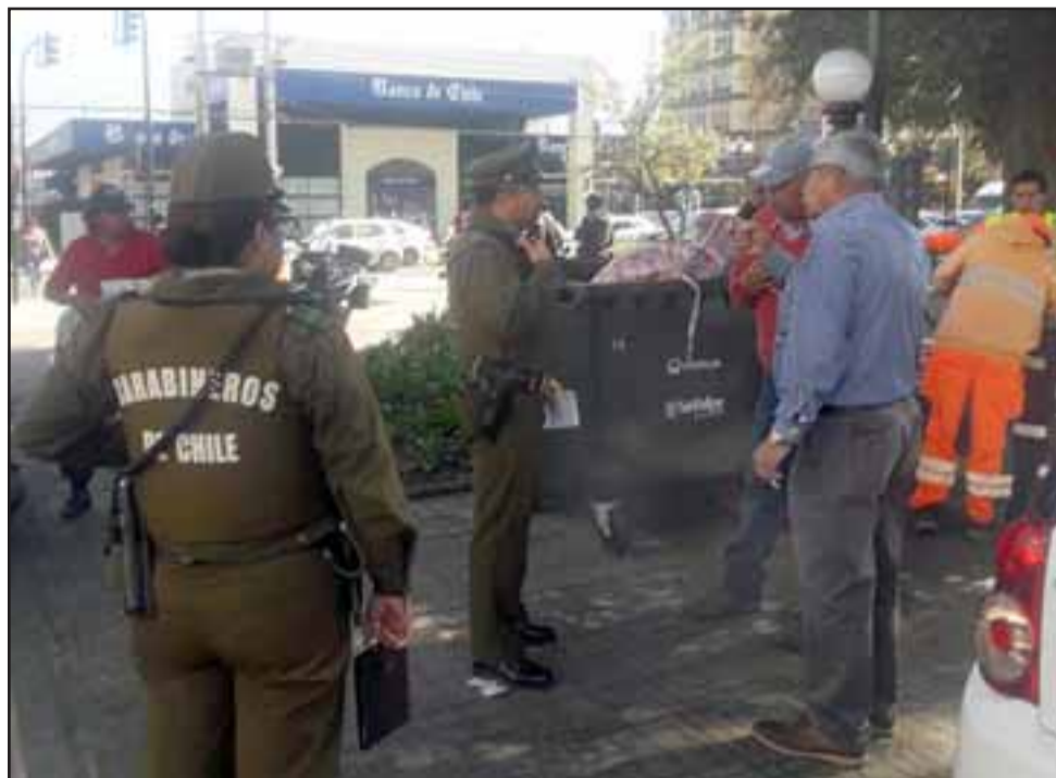
La víctima entregó su testimonio a Carabineros sobre el robo de $11.000.000.