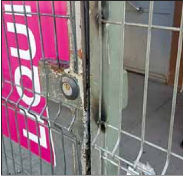
Los sujetos habrían utilizado el método del oxicorte para acceder a las dependencias, pasada la medianoche del este viernes por Calle 5 de Abril en San Felipe.

El Fiscal de Turno dispuso de la concurrencia del personal de la Sección de Investigación Policial (SIP) de Carabineros de San Felipe, para efectuar las diligencias del caso tendiente a dar con el paradero de los delincuentes, quienes de acuerdo a versiones de testigos de los hechos, estos sujetos habrían utilizado overoles para simular estar realizando trabajos en la tienda.