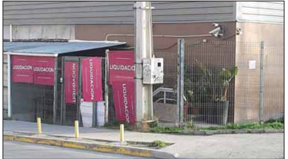
Los delincuentes habrían ingresado por el acceso trasero de la tienda Falabella para acceder al sector de bodega para apoderarse de diversos artículos tecnológicos.