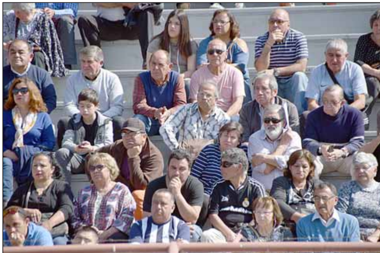
ÚLTIMO ADIÓS. - Cerca de 400 personas se dieron cita en el Estadio Municipal para despedir a su querido amigo.