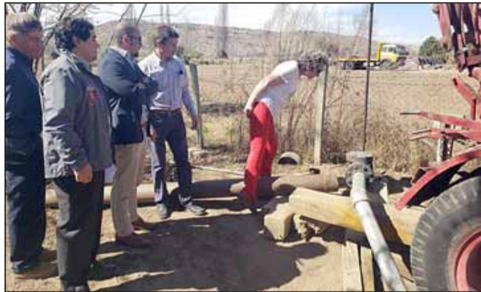
VISITA EN TERRENO.- Obras gestionadas por el municipio tienen un costo de inversión que alcanza los $24 millones y permitirá alargar su vida útil.