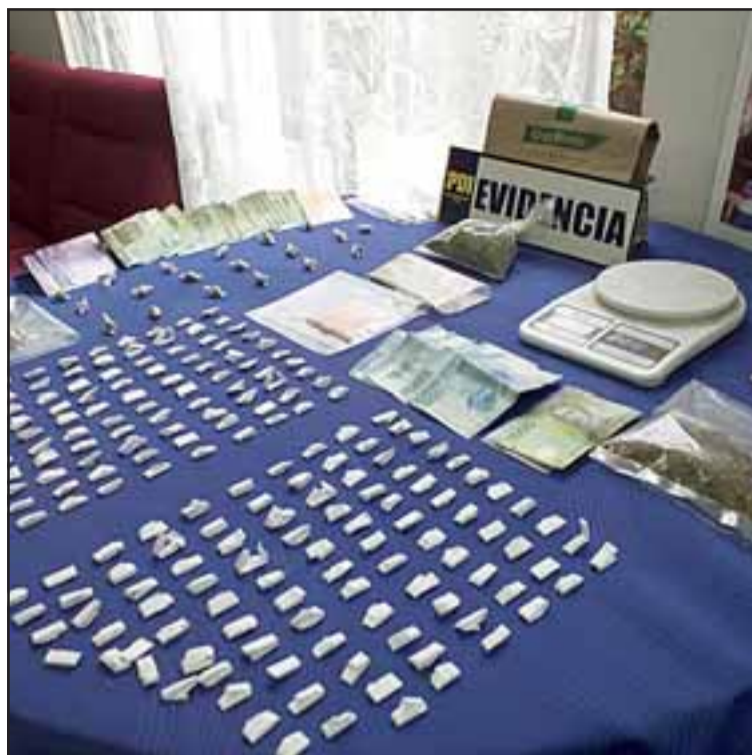
La Brigada Microtráfico Cero de la PDI incautó diversas cantidades de pasta base de cocaína, marihuana y dinero en efectivo desde diez viviendas ubicadas en Villa Los Aromos de Santa María.

«El operativo permitió sacar de circulación al equivalente de 1.260 dosis de cannabis sativa, 913 dosis cocaína base y 60 dosis clorhidrato de cocaína, lo