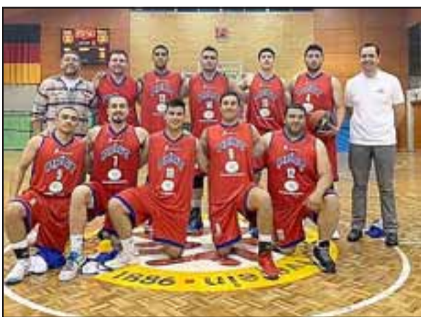
En la región del Bío Bío el Prat sufrió su cuarta caída en línea en la Liga Nacional de Básquetbol 2019.

Nacional de Básquetbol, el Prat se debió trasladar el