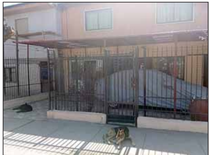
Este es el local ubicado en Calle Chorrillos que fue asaltado el jueves en la mañana.

- Sí, cada uno andaba armado, andaban armados y pistolas, creo que eran pistolas, a la clienta debajo de las axilas, costillas llamémosle más claro le pusieron la pistola, se lanzaron donde mi señora ella se fue en 'collera' con él, hicieron tira la caja recaudadora, ahí se llevaron lo que había en ese momento recaudado durante la mañana, bueno gracias a Dios no pasó a mayores, yo no me encontraba si me hubiesen encontrado hubiera sido