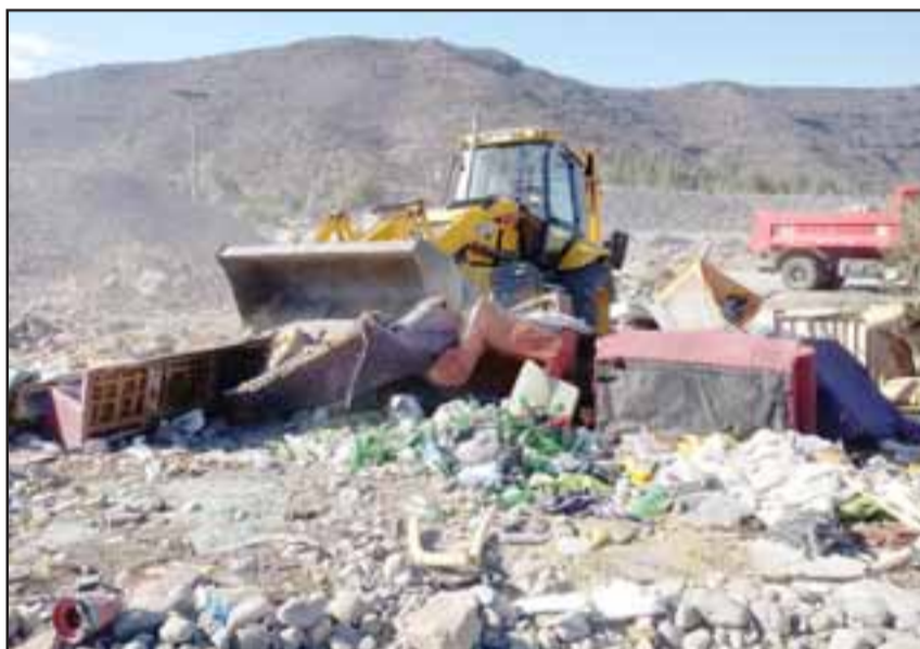
Para lograr este resultado también se utilizó maquinaria especial.

Ambiente y proteger los bellos paisajes comunales.