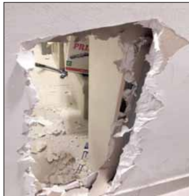
Uno de los forados efectuados por los delincuentes para cometer el robo de dinero.