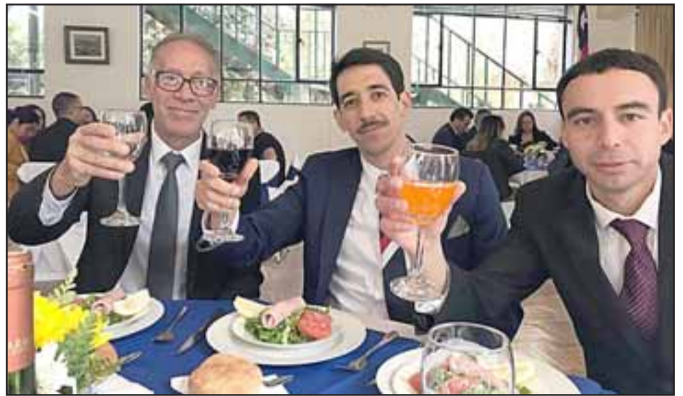
UN DÍA ESPECIAL.- Profesores y estudiantes de la Industrial disfrutaron también de un ameno momento y almuerzo en esta fecha tan especial.

Al comenzar el día, los primeros y segundos medios recibieron las visitas de los alumnos de tercero y cuarto, representando sus respectivas especialidades, quienes de manera muy coherente les contestaron cada una de sus dudas. Posteriormente, mientras los primeros medios contaban con una sólida inducción, terceros y