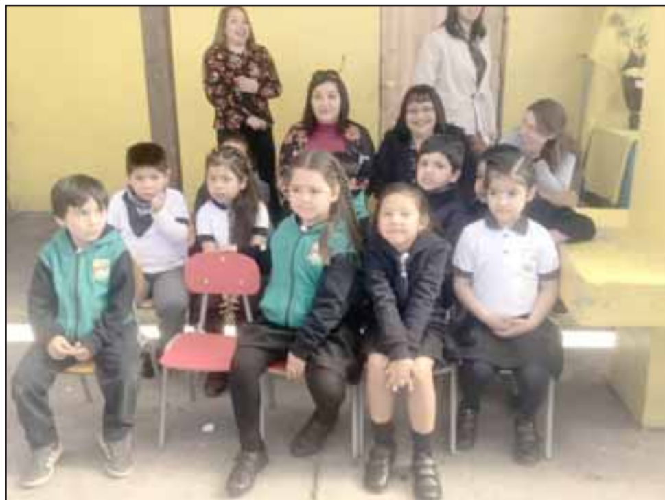
Esta casa educativa cuenta con una matrícula de 185 niños, quienes desde hace unas semanas ya se encontraban celebrando esta importante fecha.

La Escuela Almendral, con su sello medioambiental ha realizado un trabajo continuo con los alumnos, sumando a los niños de todos los niveles a participar en el cuidado del entorno.