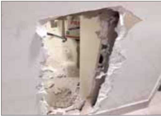
A través de un forado entraron a la farmacia

Delincuentes se llevaron botín de $25 millones