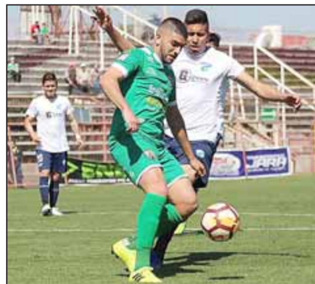
Trasandino jugó como local en el Estadio Municipal de San Felipe.