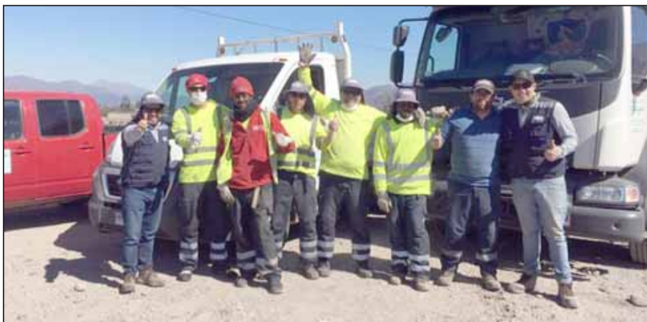
La noble labor organizada por la Unidad Municipal de Medioambiente Municipal logró extraer más de 85 toneladas de residuos.

«La comunidad tiene un papel importante al momento de detectar a la gente que va a tirar residuos. Por eso hacemos un llamado a los vecinos para denunciar estos hechos», sostuvo el encargado de Medioambiente municipal. La