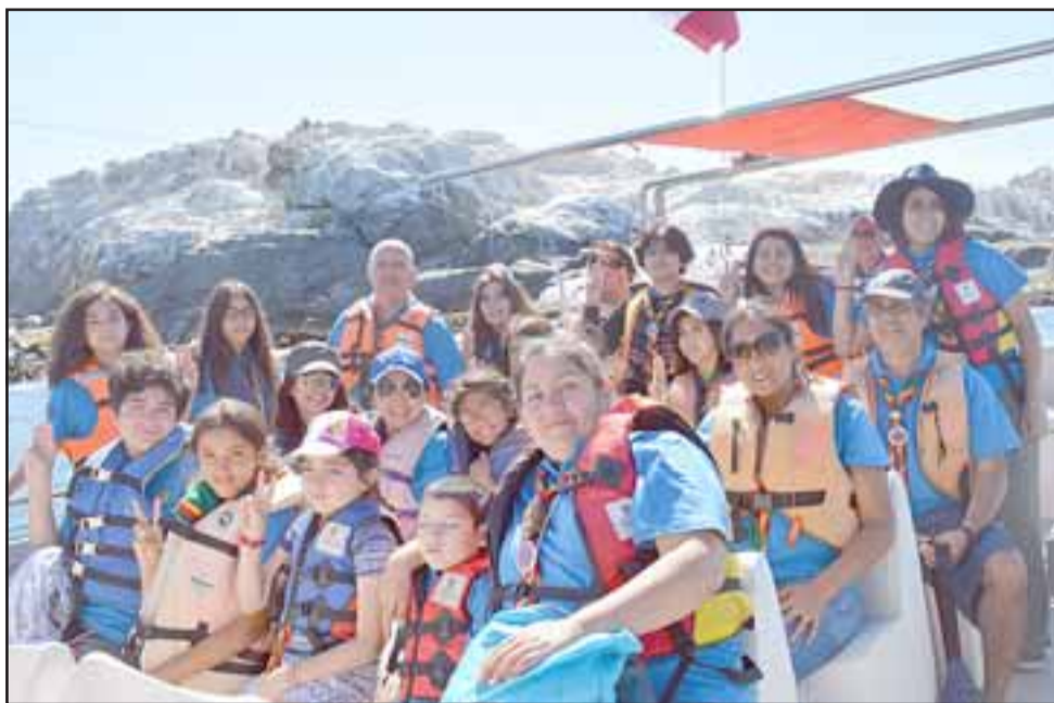
SIEMPRE APRENDIENDO.- Estos chicos realizan sus viajes con regularidad a distintas partes de nuestro país, y pronto alistarán maletas para viajar a la Argentina.

perar, aparte de conocer y disfrutar de una gran Aventura Scout, por lo tanto invitamos a todas las empresa de la zona de Aconcagua a cooperar en forma económica para el desarrollo de este gran proyecto, en bien de la gran juventud del presente», indicó Machuca.