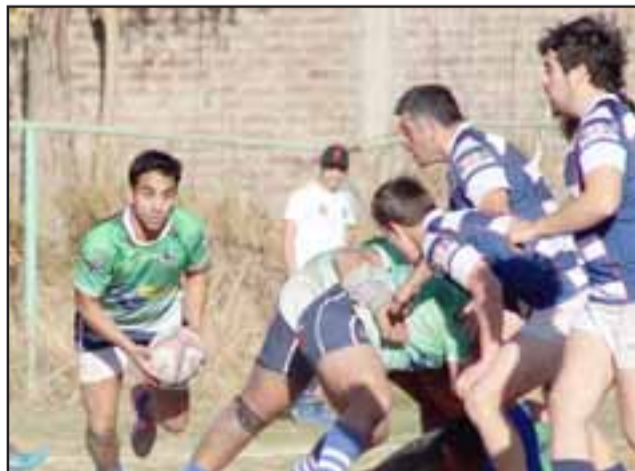
Después de un buen rato en el que solo supieron de caídas, el sábado pasado Los Halcones volvieron a ganar en la Arusa.