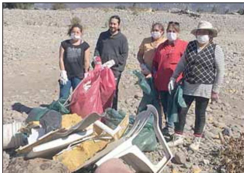
Vecinos y autoridades se dieron a la tarea de limpiar ese sector del borde río.