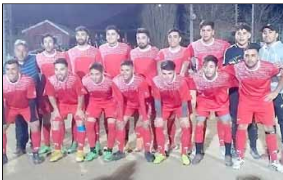
La selección de Honor de San Felipe fue claramente superior a su rival, pero los penales dijeron otra cosa y fue eliminada del Regional.