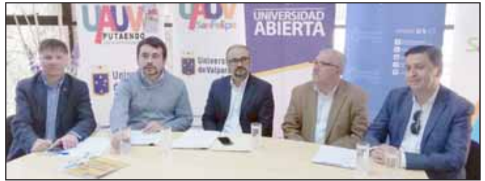
La mañana de ayer en la Municipalidad de San Felipe se realizó el lanzamiento de la Universidad Abierta para el segundo semestre.

Para esta ocasión, los cursos son: alfabetización digital adultos mayores; primeros auxilios; salud y autocuidado; programación neurolingüística; actividad física en adultos y adultos mayores; salud y autocuidado en personas mayores; habilidades directivas para dirigentes sociales y deportivos; conociendo nuestros derechos; de territorios, memoria y resiliencia; ¿cómo se viven los eventos sísmicos en Chile?; políticas públicas y participación ciudadana; comunicación y lenguaje escrito; gestión municipal; plan de negocios para emprendedores; gestión administrativa y conta-