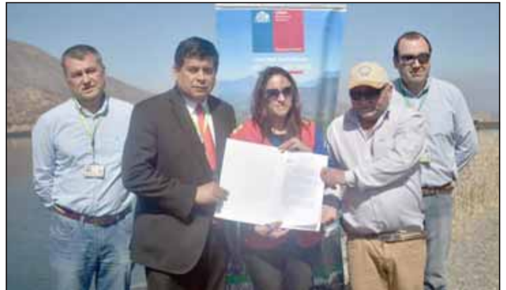
Autoridades y presidente regantes Canal El Zaino durante la firma del convenio

señala que se prevé mayores temperaturas para el mes de septiembre, así como una menor cantidad de lluvias en la región , que se suma al estrés hídrico de la zona, lo que propicia los incendios forestales .