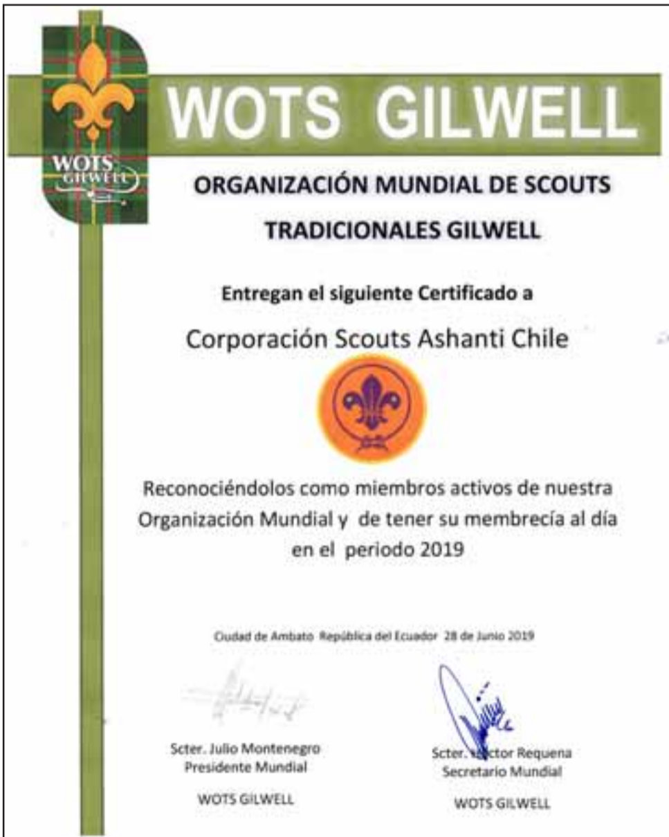
SCOUTS CERTIFICADOS.- Este documento es muy importante para cualquier agrupación Scouts del mundo, sin una licencia como ésta, la misma no será reconocida en ninguna parte.