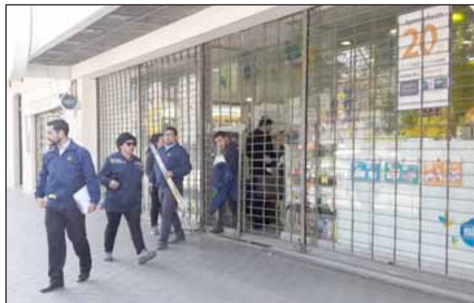
Personal de la PDI efectuando las primeras diligencias en la Farmacia Salcobrand en calle Combate de Las Coimas de San Felipe, la mañana de ayer lunes.

«Sujetos ingresaron con la técnica del forado sustrayendo un monto que todavía la empresa debe determinar en forma exacta. Por nuestra parte hay un equipo completo destinado a la investigación para lograr identificar a los responsables de este ilícito. La cifra no la podemos corroborar porque se están haciendo los arqueos de cajas respectivas, para que ellos nos