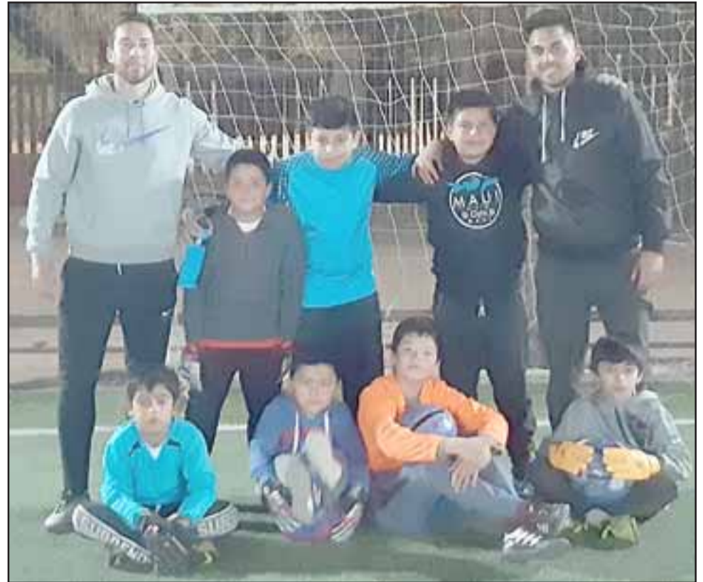
FUTUROS PORTEROS.- Ellos son parte de los niños que ya se están entrenando como arqueros de fútbol.

«Nuestra Escuela la fundamos el 22 de junio de 2019, somos un proyecto muy nuevo, aquí damos entrenamiento a niños desde los 5 años de edad en adelante, hasta adultos. Los niños aprenden el rol básico de un arquero, conceptos técnicos, tácticos y físicos de su posición durante un partido, técnicas para detener penales, lectura corporal del adversario, dirigir y armar defensas en balón detenido, o sea, todo lo que nosotros los instructores hemos aprendido en los clubes en que jugamos», comentó