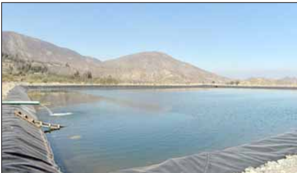
Embalse Tabolango, lugar donde se llevó a efecto la firma del convenio.