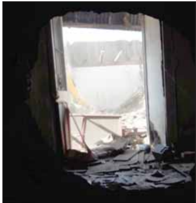
Los antisociales habrían ingresado la madrugada de este lunes burlando todas las medidas de seguridad.

Antisocial fue formalizado quedando en prisión preventiva: