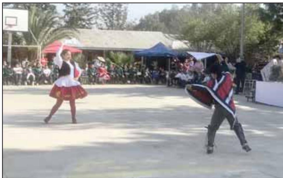
Comidas típicas y nuestro baile nacional presentarán los alumnos de los establecimientos municipales en el 'Bulevar Dieciochero'.

Durante la tarde los vecinos que quieran bailar cueca sólo deben acercarse, porque además podrán disfrutar de la comida típica y disfrutar de un grato ambiente al ritmo del baile nacional.