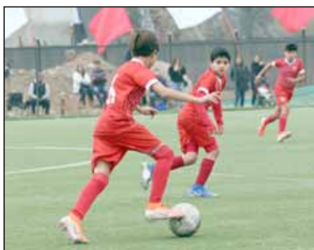
Los equipos formativos albirrojos supieron de triunfos y derrotas.