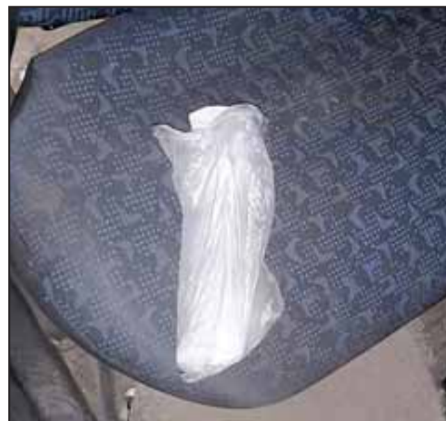
Carabineros incautó los papellillos de pasta base dentro de esta bolsa de nylon.

Las detenidas fueron individualizadas con las iniciales J.S.F. y M.P.F. , informándose que la primera de ellas mantenía una orden