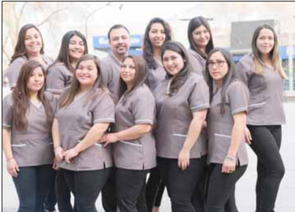
Trabajo Social PCE Vespertino.