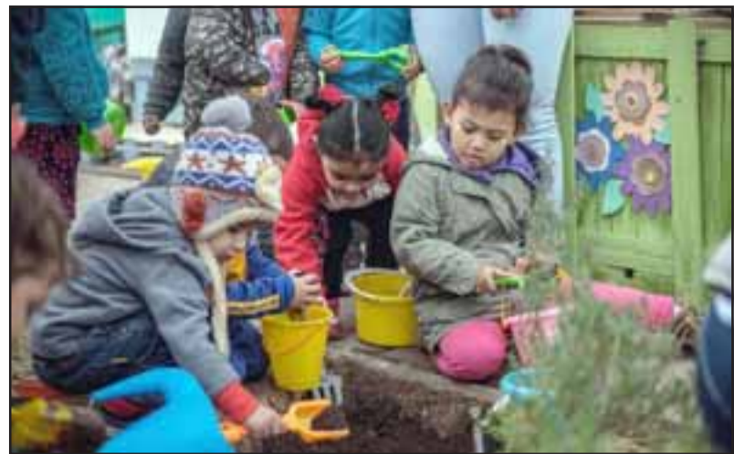
Aquí vemos la plantación en Jardín Medicinal Conejitos Saltarines, que los mismos pequeñitos mantienen a su cuidado.