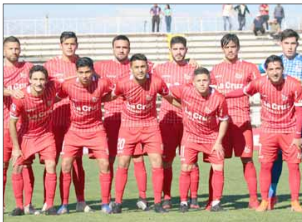
La próxima jornada del torneo de la Primera B, Unión San Felipe enfrentará a un rival directo en la lucha por entrar a la liguilla del ascenso.