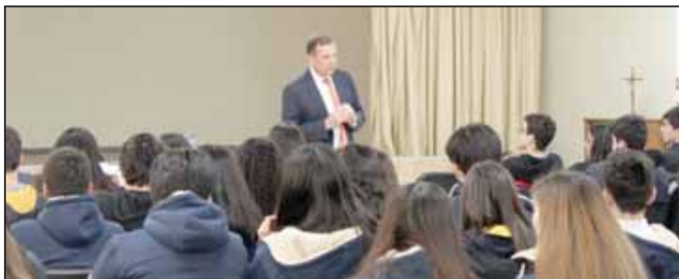
El diputado Luis Pardo se reunió con estudiantes de 3° y 4° medio del Instituto Abdón Cifuentes para conversar sobre educación cívica, el trabajo legislativo y temas locales.

El lunes pasado se llevó a cabo un encuentro entre estudiantes de 3° y 4° medio del Instituto Abdón Cifuentes y el Diputado del Distrito 6, Luis Pardo , donde conversaron sobre el trabajo legislativo, temas locales y además los alumnos tuvieron la oportunidad de resolver sus dudas respecto a temas educacionales.