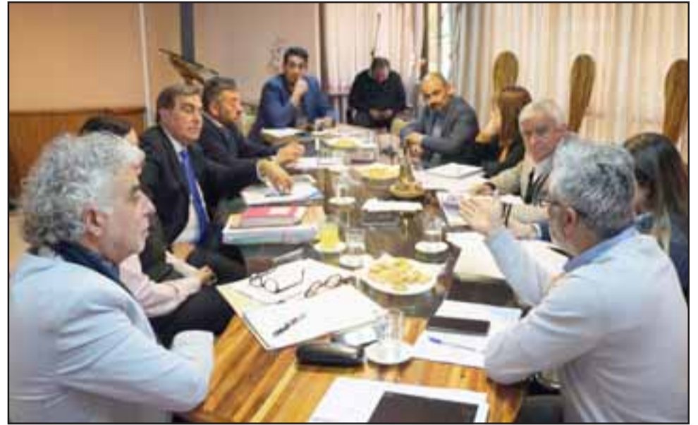
El Concejo Municipal votó de forma unánime rescindir el contrato por una serie de irregularidades observadas durante este tiempo.

Añadió que este es el procedimiento administrativo obligatorio; «tiene que entregarse un informe que indique si existe incumplimiento en la concesión, esos elementos están contemplados en las bases del contrato como causales de su término».