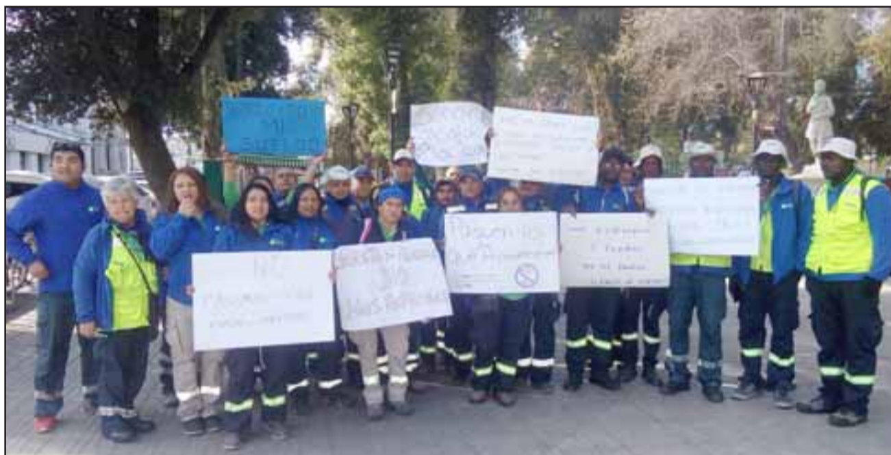
El grupo de trabajadores de parquímetros de San Felipe que paralizaron sus labores ayer.

Comentó que hasta el momento los compromisos que han adquirido con la municipalidad están cumplidos; «los convenios están pagados, la participación está cancelada, así es que hasta el momento estamos cumpliendo con la municipalidad, lo que pasa es que nos estamos atrasando con los chicos, pero tratando de cubrir a más tardar el vier-