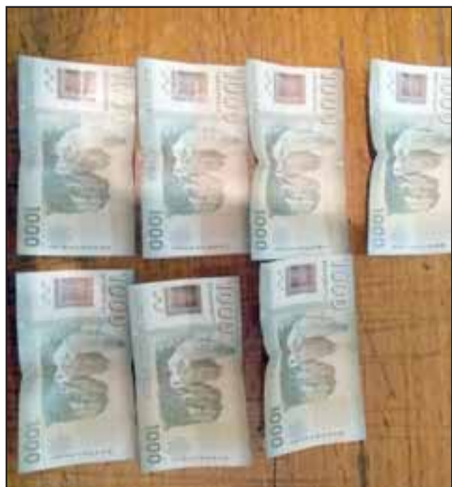
Un total de $7.000 en efectivo fueron decomisados durante el procedimiento de microtráfico de drogas.

Tras un patrullaje preventivo de Carabineros se descubrió el ilícito en horas de la tarde noche de este lunes.