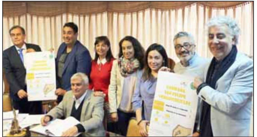
Los concejales junto a personal de la coordinación de reciclaje de la Dirección de Protección y Medioambiente (Dipma), durante el lanzamiento de la campaña '#chaocolillas'.

Básicamente, es un proceso donde se procede a 'purificar' la colilla y reutilizar el acetato de celulosa que posee, para luego convertirlo en diversos productos: hojas para escritura en braille, aislantes térmicos, almácgicos, carpetas higroscópicas, entre muchas otras alternativas.