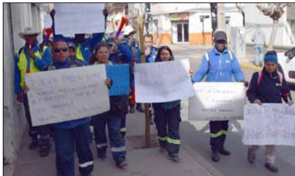
Por las céntricas calles de San Felipe marcharon ayer cerca de 40 empleados de esta empresa de parquímetros.