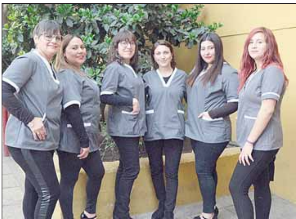
Trabajo Social Vespertino.

Aconcagua. También destacó el respeto por las personas y por los valores de la carrera y también las diferentes situaciones que hoy llaman a la reflexión y a la acción a quienes han escogido esta profesión, como por ejemplo la violencia contra la mujer y el rechazo a los inmigrantes y minorías