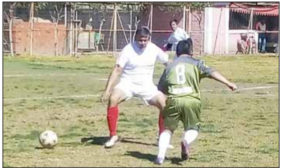
En el Clausura de la Liga Vecinal ya se juega la segunda rueda.