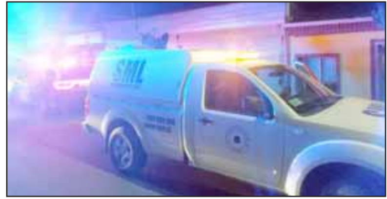
La Brigada de Homicidios de la PDI de Los Andes confirmó el suicidio de un vecino de 36 años de edad al interior de una vivienda ubicada en calle Vicuña Mackenna de Llay Llay la noche de este martes.