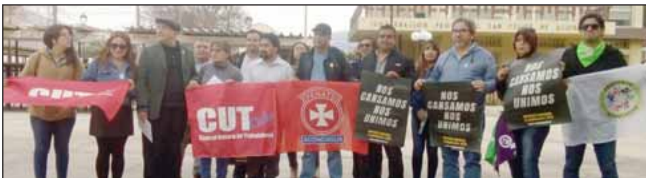
Representantes de la CUT, Salud, temporeros invitando a la marcha a realizarse hoy.

A nivel local la dirigente manifestó su preocupación por la escasez hídrica que está matando a los animales: «Hay zonas que son atinentes, como es el caso de Aconcagua, que tienen que ver con el agua, el medio ambiente y que va en directa relación con el código de