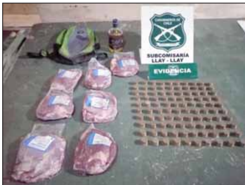
Carabineros de la Subcomisaría de Llay Llay recuperó un total de $100.000 en monedas, siete kilos de carne y una botella de pisco en poder del antisocial.

El imputado fue individualizado con las iniciales J.A.A.A. , de 48 años de edad, quien fue formalizado por la Fiscalía por el delito