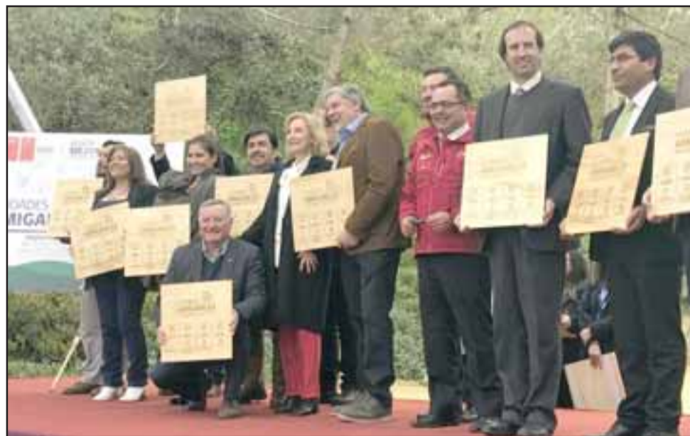
El alcalde Luis Pradenas (agachado) junto a la Primera Dama Cecilia Morel.

La siguiente etapa, luego del envío de la Solicitud de Adhesión a la Red Mundial, es realizar un diagnóstico participativo, con las personas mayores de la co-