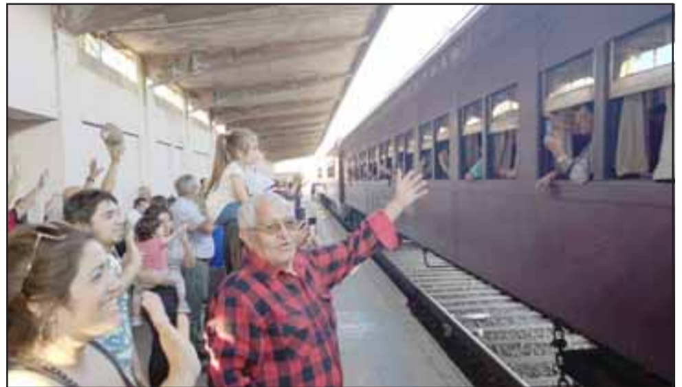
Una anhelada y justa aspiración constituye el deseo de recuperar este histórico medio de transporte para el Valle del Aconcagua.

«Por cierto que es una noticia importante, tanto para la provincia de Quillota como las provincias del Aconcagua. Cuando habla-