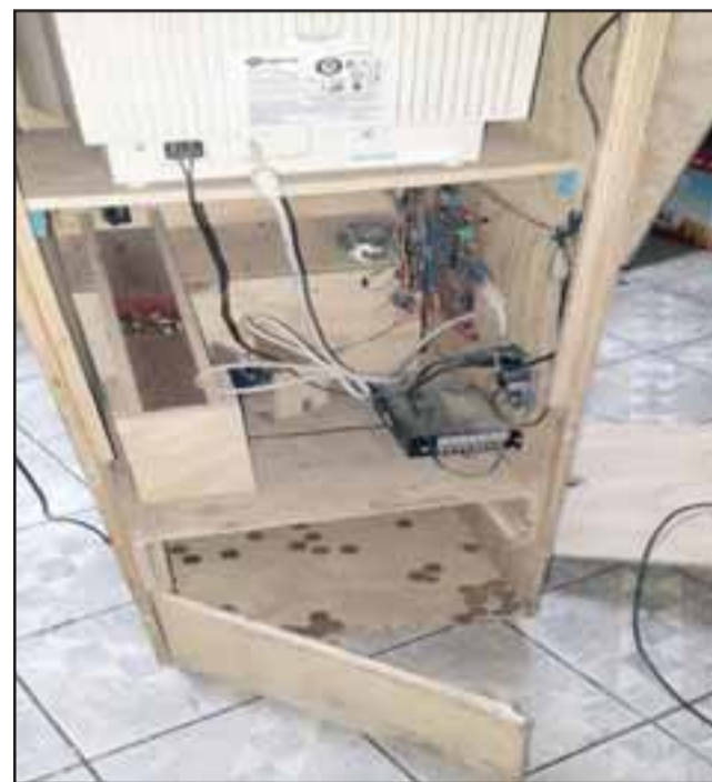
El sujeto descerrajó la máquina para sacar nada menos que cien mil pesos en monedas de 100.