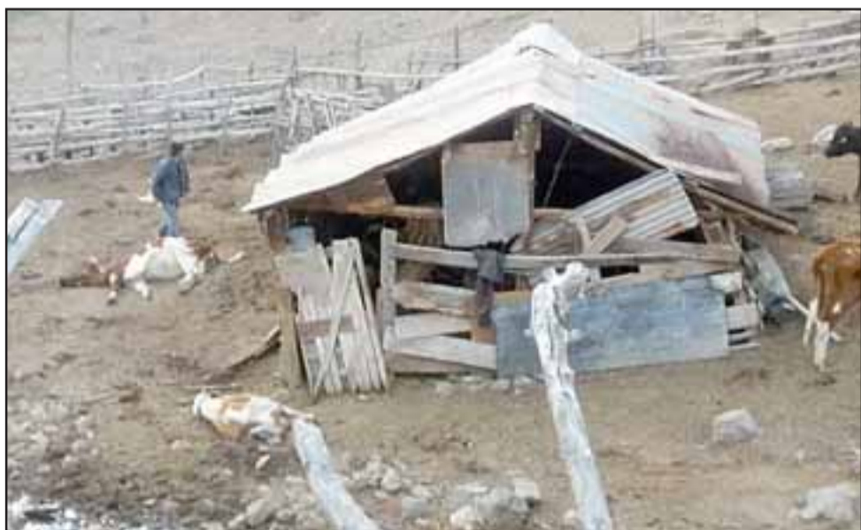
ESPANTO Y POBREZA.- Este es el triste escenario, animales muertos en todas partes, no hay dinero, no hay agua, tampoco llega el afrecho y el tiempo corre.