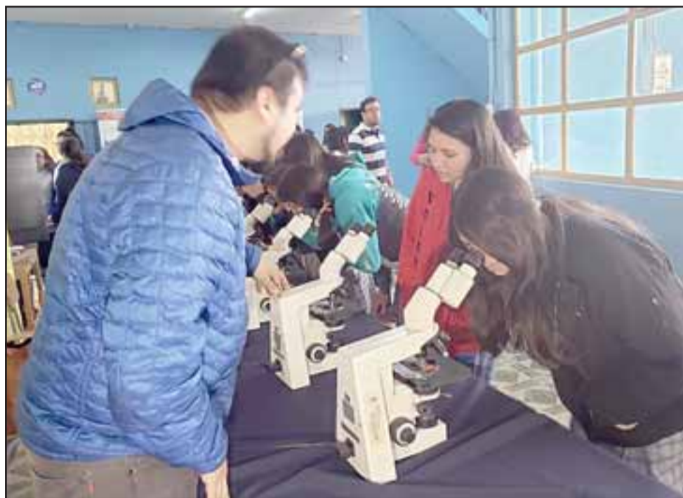
Los alumnos de distintos establecimientos disfrutaron de la ciencia de una manera interactiva gracias a la muestra organizada por el Liceo Corina Urbina y la Universidad de Valparaíso.

En la muestra además participaron alumnos de las escuelas San Rafael y Carolina Ocampo, establecimiento que tiene como sello el desarrollo de la ciencia.