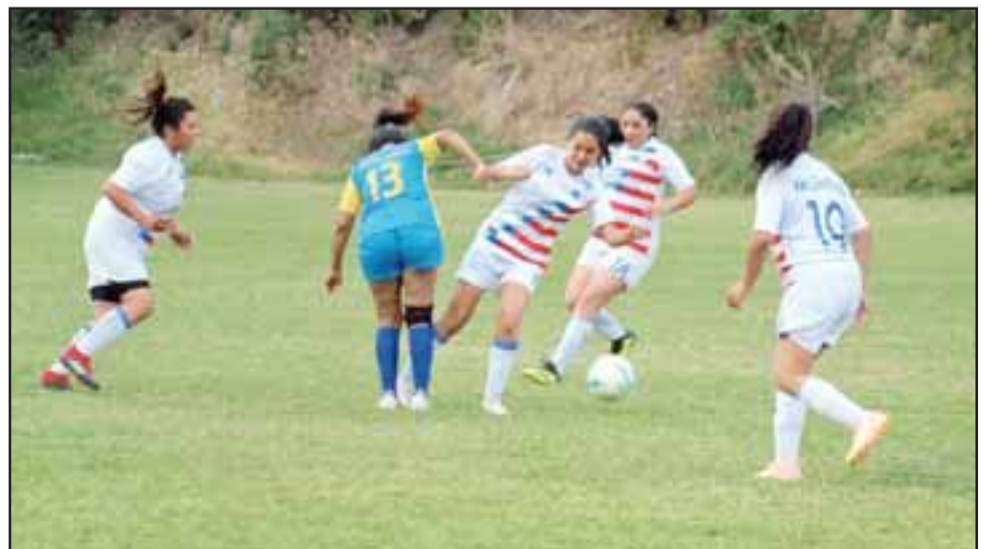
San Felipe y todo el valle de Aconcagua ya vibra con el fútbol femenino.

si será en un solo recinto o en distintas canchas; en lo personal a mí me gustaría que fuera el sábado para que las niñas asuman el protagonismo que corresponde; pero bueno, eso se definirá el próximo lunes en la reunión del Consejo de Presidentes», afirmó el directivo.