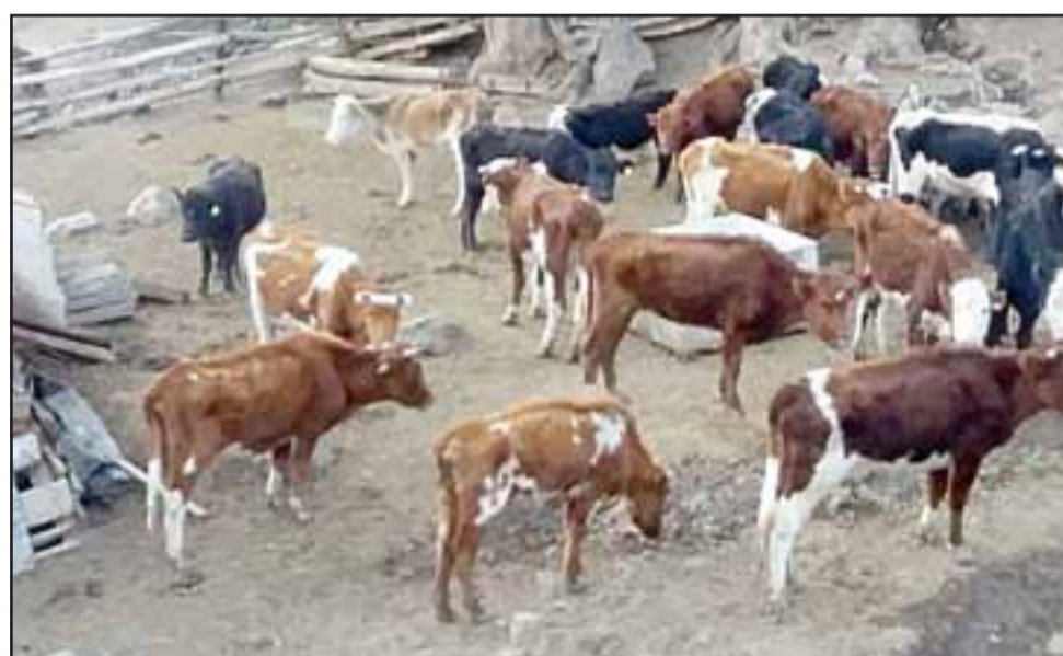
URGE LA AYUDA.- El ganado que aún sigue vivo, está en puro pellejo y huesos solamente esperando dos cosas: La muerte, o alimentos de sus dueños.