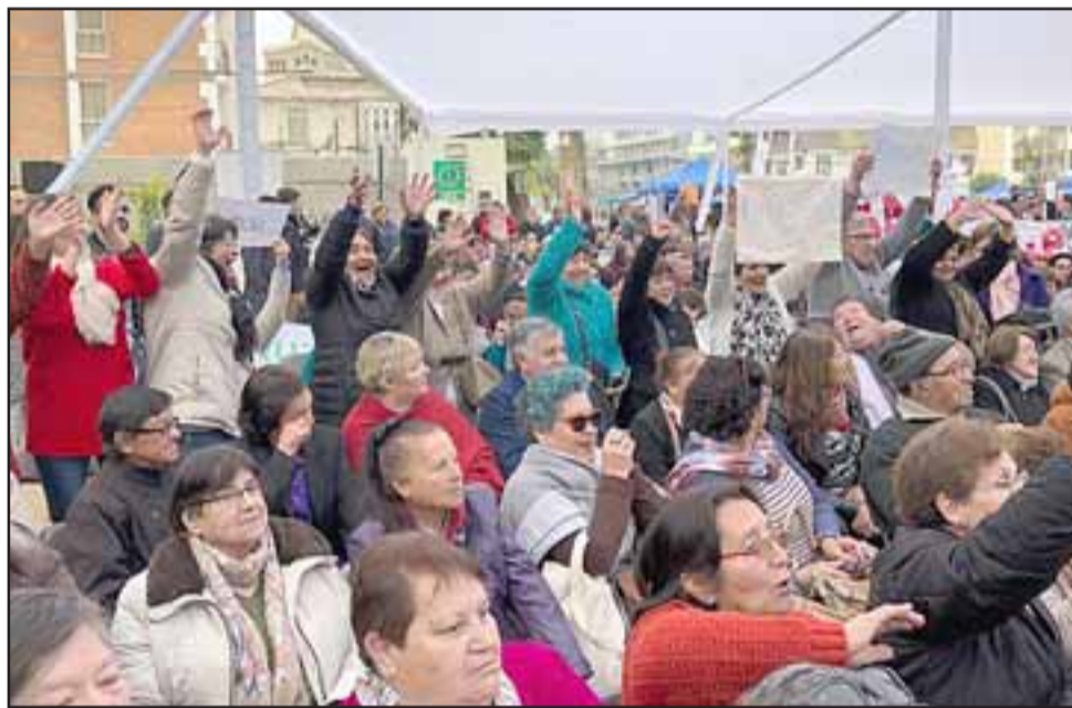
Un grupo de adultos mayores de Panquehue acompañó al alcalde al lanzamiento del programa Ciudades Amigables que se realizó en la Quinta Vergara, en Viña del Mar.

munidad y otros actores, según el Protocolo de Vancouver, documento que establece la metodología de trabajo para realizar una