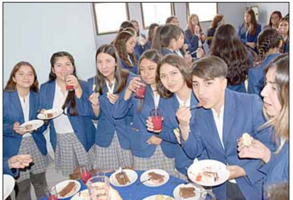
UN DULCE FINAL. - Al final de la jornada los estudiantes e invitados degustaron de un ameno brindis y platillos especiales.