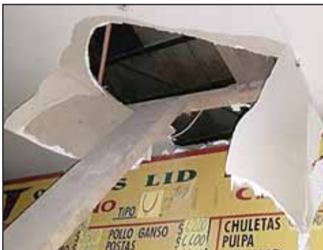
El imputado habría realizado este forado en el cielo para acceder a las dependencias.