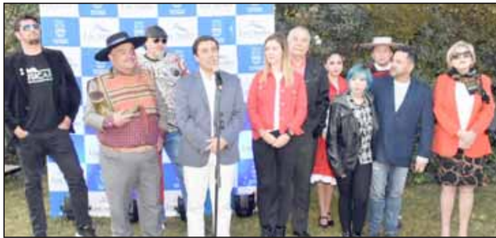
Los días 18 y 19 de septiembre, en el anfiteatro del Parque Urbano, se llevará a cabo la XIX versión del Festival del Guatón Loyola, con grandes artistas convocados, el humor y la competencia folclórica.

La nutrida programación de artistas locales, nacionales e internacionales, incluye a Denise Rosenthal, el humor de Kramer, los éxitos de Américo, Bafocla y Chungará durante la prime-