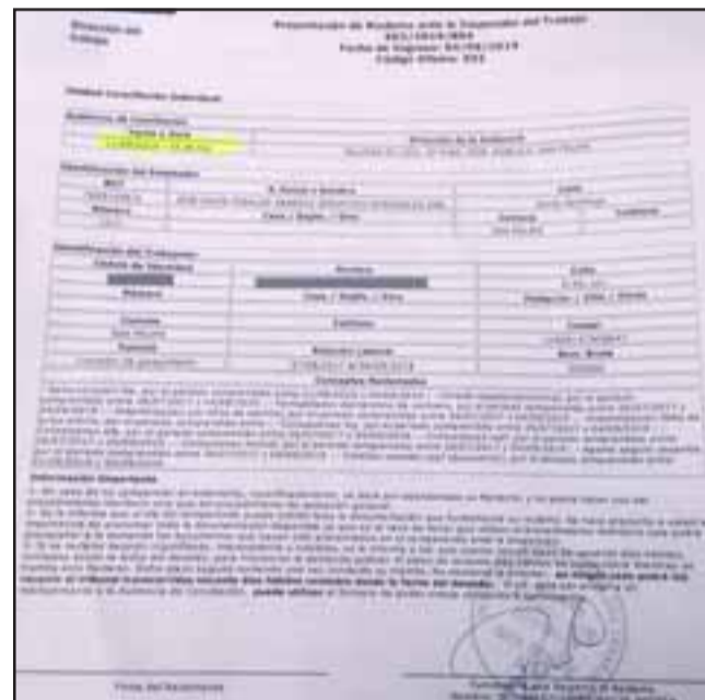
Acá una copia de la denuncia estampada en la inspección del trabajo.

- Lo que pasa es que ayer (martes) conversaba con mi