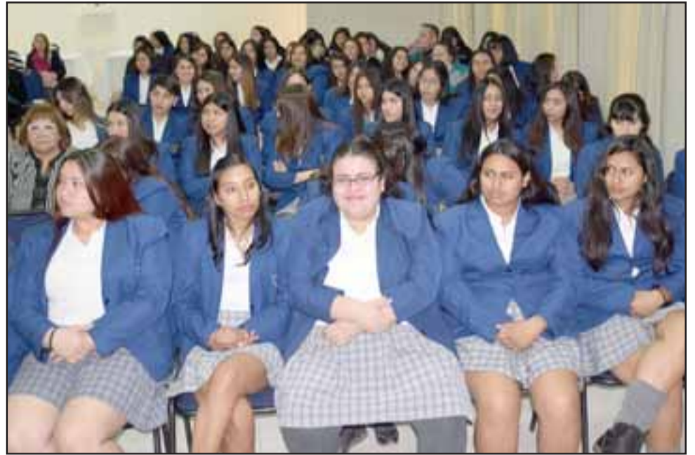
EL MUNDO LES ESPERA. - Estas damitas son estudiantes de Enfermería y Gastronomía, quienes pronto estarán mostrando sus habilidades y conocimientos en el mundo laboral.

con estas dos carreras o especialidades de Gastronomía y Enfermería (...) también este miércoles premiamos a las mejores estudiantes en Asistencia, tenemos alumnas con 100% de asistencia, lo que es muy bueno para la especialidad, todas tienen una excelente preparación y con buen rendimiento, lo que también las posiciona en el rubro laboral (...) también premiamos el esfuerzo de aquellas estudiantes que aún teniendo dificultades personales nosotros vemos que junto a su familia ponen lo mejor de sí mismas, en nuestro liceo tenemos alumnas de toda la provincia de San Felipe, son comunas a veces lejanas de San Felipe en donde estas jóvenes estudiantes tienen que tomar dos, y hasta tres locomociones para llegar a clases, y eso nosotros lo valoramos mucho, en total nuestro liceo cuenta con una matrícula de 650 estudiantes y tenemos dos cursos, uno de enfermería y el otro de gastronomía en los niveles de 3° y 4° medio», comentó Berríos a Diario El Trabajo . Roberto González Short