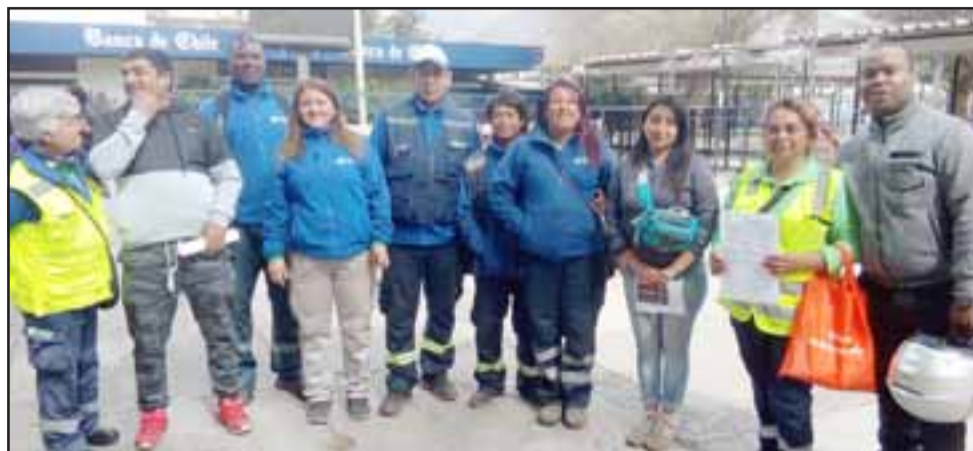
Al mal tiempo buena cara, los trabajadores despedidos junto a la directiva luego de ir a la Inspección del Trabajo.

- No, no hay otro motivo, por eso igual ayer (martes) le dije que era injusto