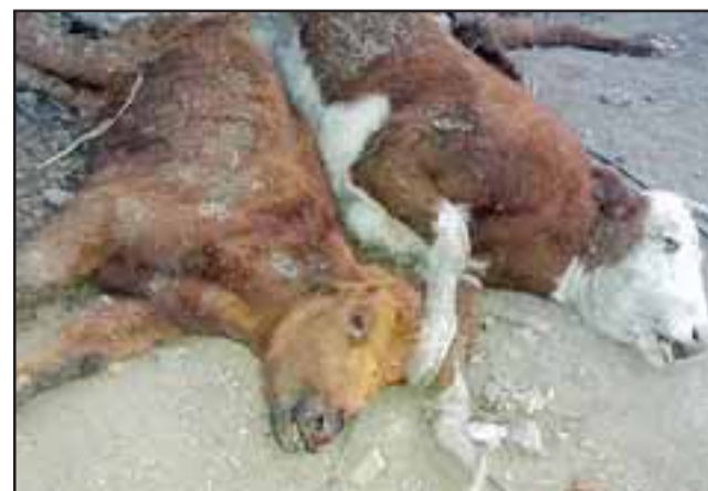
MUERTE Y DESOLACIÓN.- Este es el triste escenario que se repite en los cerros y valles de Aconcagua, por cientos mueren los animales por falta de pasto y agua.